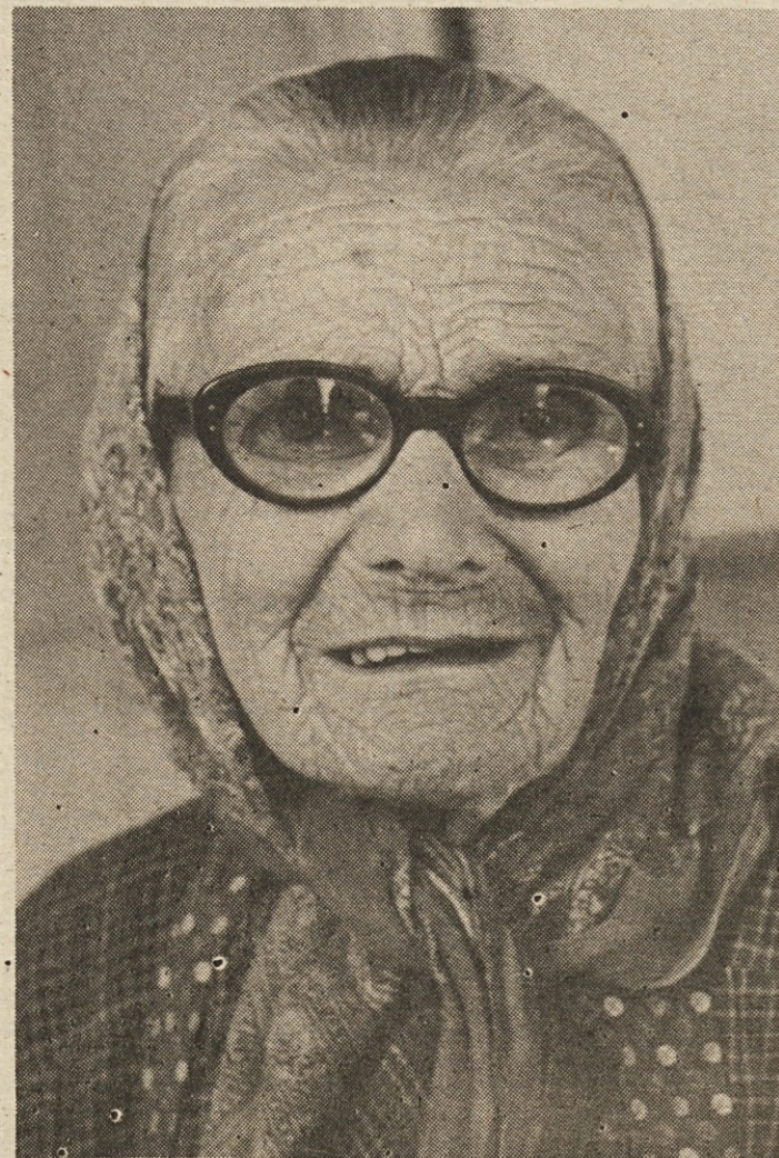
Sledovi stotih let