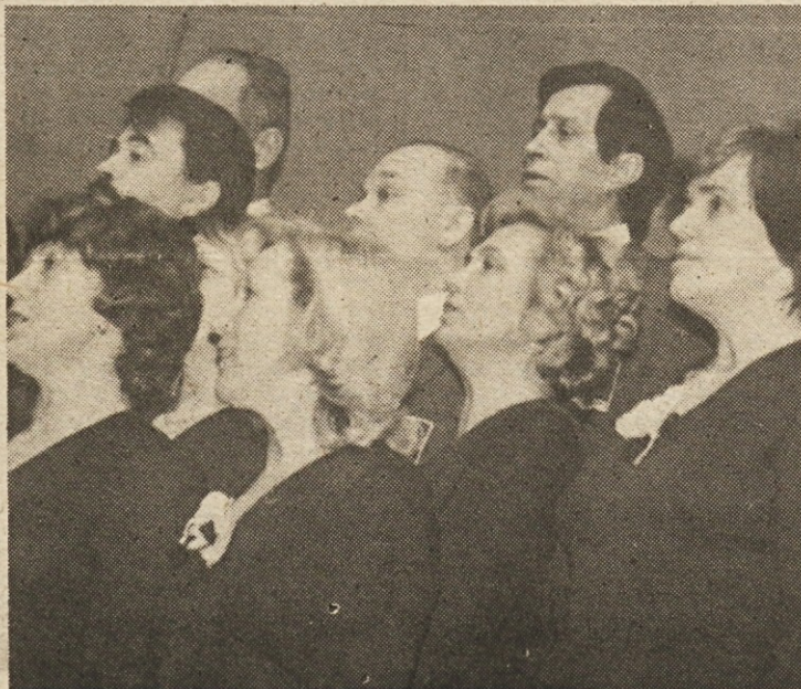
Mešani pevski zbor Litostroja iz Ljubljane

godbe iz Trbovelj pod taktirko Mihe Gunzka.