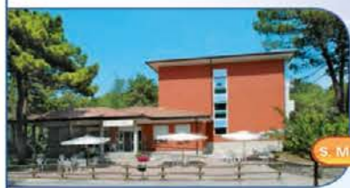
S. Maria del Mare