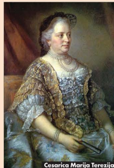
Cesarica Marija Terezija