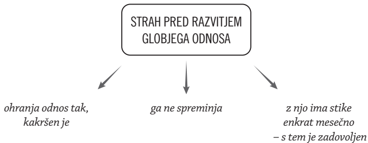
SLIKA 1: Skica odnosnega kodiranja skupine 1

Zakaj so izbrali ravno to temo? To, da se je skupina osredotočila na preiskovanje odnosov, s poudarkom na odnosu do hčere, so utemeljili z nosečnostjo dveh študentk članic skupine. Tema odnos do hčere pa je bila zanje različna od tem, s katerimi se običajno srečujejo pri delu (droge, nekonstruktivni odnosi v družini ...), in so jo izbrali v veliki meri zato, da bi se izognili stresu, ki ga prinašajo vsakdanje teme.