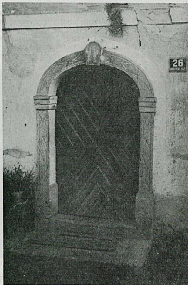
Sl. 3. Portal iz zelenkastega peračiškega tufa pri nekdanji Buhovi hiši.

Ogledujoč si izdelke iz škofjeloškega konglomerata nam bo gotovo vpadel v oči tudi enolično zelen kamen, ki je sicer na Selškem redek, pa zato še posebej omembe vreden. Doma je iz kamnoloma v grapi potoka Peračica blizu Brezij na Gorenjskem, po vasi Peračica so mu dali ime peračiški tuf . Kamnina je sprjet vulkanski pepel, ki je v srednjem oligocenu, to je približno takrat, ko se je nabiral na današnjem Kamnitniku in v okolici prod za škofjeloški konglomerat, padal v morje na današnjem Gorenjskem in se usedal med laporno glino. Ta tuf je potemtakem veliko mlajši od tistega, ki smo ga spoznali med Selci in Mohorjem, pa tudi po sestavi je drugačen, namreč andezitni. Najlepši portal iz