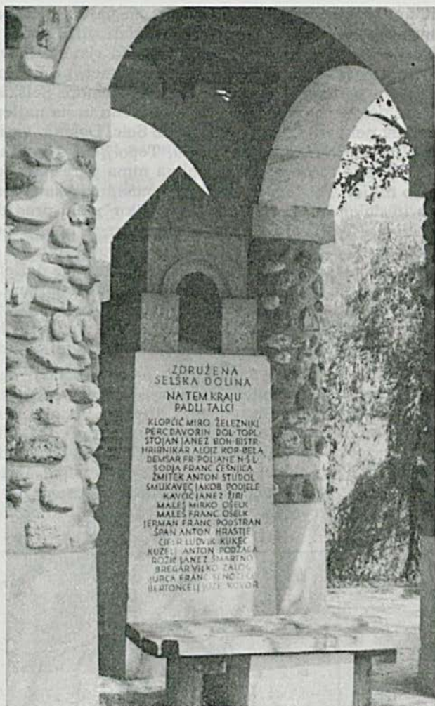
Sl. 5. Plečnikov spomenik padlim v NOB v Dolenji vasi. V stebrih je vgrajena pisana zbirka domačih kamnin.

je iz kraškega »marmorja«, to je iz zgornjekrednega apnenca, v katerem še lahko prepoznamo ostanke rudistnih školjk. Tudi spomenik poljskemu partizanu pod Hrastnikom na Luši je iz kraškega kamna. Tudi v geološkem pogledu predstavlja posebnost Plečnikov spomenik pri Dolenji vasi (Sl. 5). Osrednji del, to je sam spomenik z vklesanimi imeni padlih, je iz dveh različnih kraških »marmorjev«. Spodnji del je iz svetlejšega rudistnega zgornjekrednega apnenca, piramida pa je iz temnejšega, prav tako rudistnega apnenca. Tudi kamniti oboki, ki se pno pod ostrejšje, so iz zgornjekrednega kraškega kamna. Posebnost so stebri, v katere so vgrajeni samo domači kamni, takšni, kakršne prinašajo ob neurjih potoki s pobočij Selške doline v Selško Soro, le-ta pa jih prenaša naprej. Med njimi najdemo prav vse, kar je sposobno le malo daljšega transporta in kar nam razkazuje prod na Bukovškem polju. Tam so tudi nabrali material za oblogo stebrov. Vmes je veliko sivkasto rjavkastih kamnov dróbe, debelozrnate in drobnozrnate, prod-