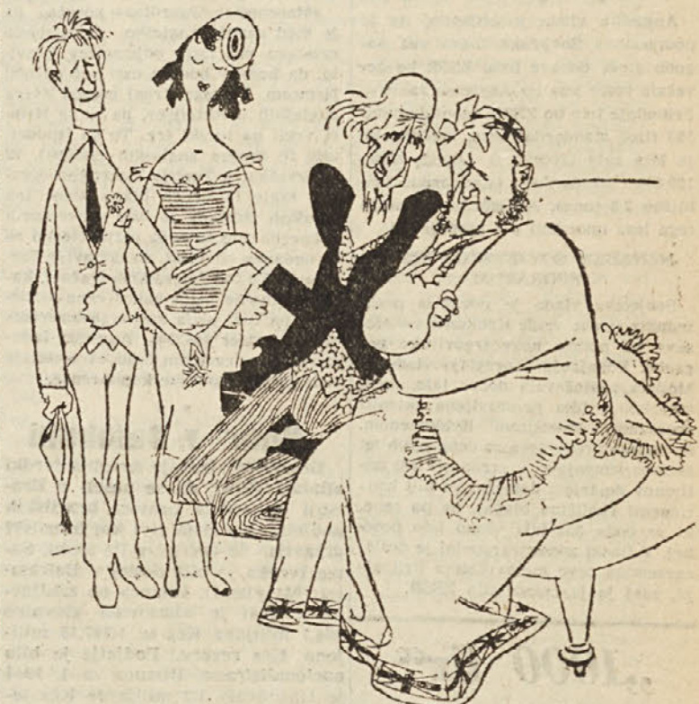
»Daj končno svoj blagoslov!«

Schumanov predlog, ki je delo g. Monmeta, tvorca načrta za francosko obnovo, je še zrušil enotno zunanje-politično fronto laburistov, konservativcev in liberalcev, ker zahtevata zadnji dve stranki, naj se Anglija vendar udeleži pogajanj v Parizu.