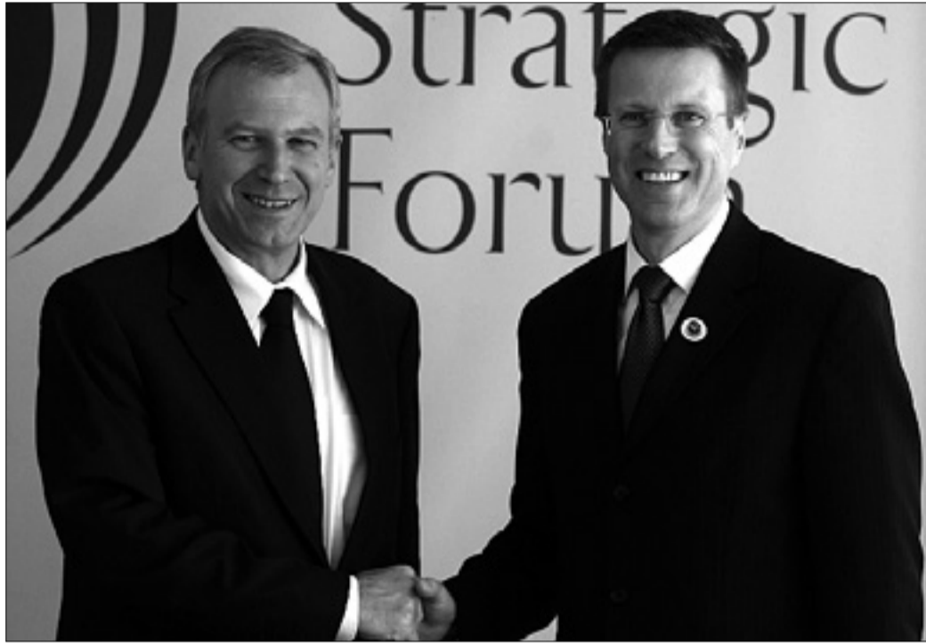
Slovenski zunanji minister Samuel Žbogar (desno) z belgijskim premirjem Yvesom Letermeom (levo) na blejskem strateškem forumu

Preko 400 udeležencev iz 40 držav, med katerimi so bili znani politiki, strokovnjaki in gospodarstveniki