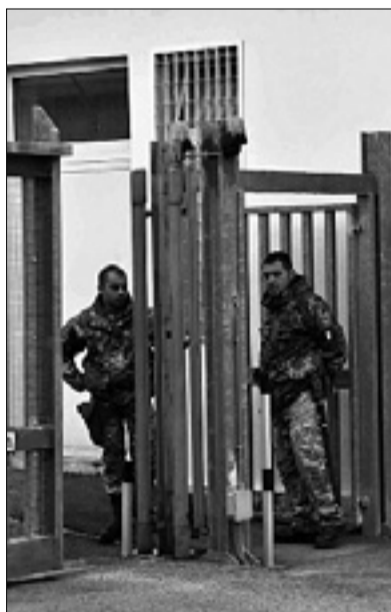
Vojska pred vhodom v CIE BUMBACA