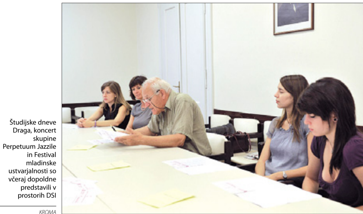
Študijske dneve Draga, koncert skupine Perpetuum Jazzile in Festival mladinske ustvarjalnosti so včeraj dopoldne predstavili v prostorih DSI