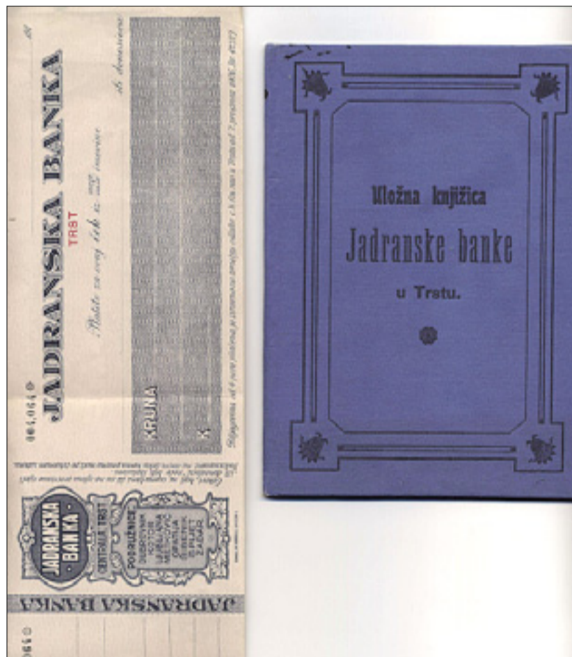
Vložna knjižica in ček Jadranske banke v Trstu