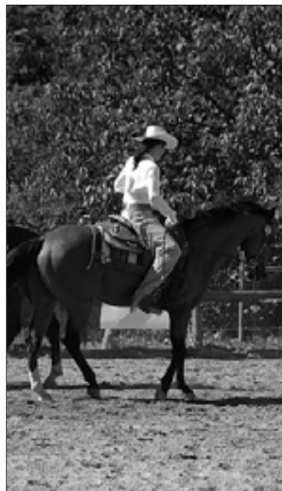
Pevmska Remuda ARHIVSKI POSNETEK

Do nesreče je prišlo včeraj popoldne po 17.30. Pripetila se je na površini jahališča, ki je namenjena učenju ježe. Deklica, ki je stara približno deset let, je v spremstvu svoje mame vadila jahanje. Po sicer skopih informacijah, ki so bile včeraj razpoložljive, je hodila ob svojem konju, iz neznanih razlogov pa se je žival nenkrat vznemirila in brcnila otroka z zadnjimi kopiti. Deklica je obležala, njena mama pa je iz razumljivega preplaha zavpila na pomoč. Na kraju je takoj posredovala rešilna služba 118, ki je otroka odpeljala v splošno bolnišnico. Deklico so pregledali na oddelku za prvo pomoč, zaradi rahlega pretresa možganov pa so jo zadržali za dodatne zdravniške preiskave.