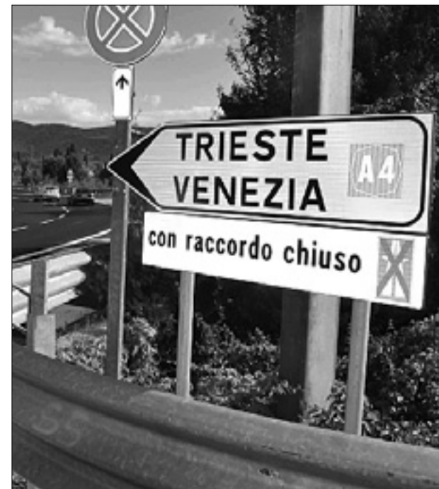
Na krožišču pri Štandrežu so se včeraj pojavila nova cestna znamenja

Dela za gradnjo avtoceste Vileš-Gorica so stopila v živo. Sinoči so prvič zaprli promet odsek hitre ceste med štandrekim krožiščem in izvozom pri Fari, kjer so začeli s premeščanjem pregrad »new jersey«; z njimi so na novo označili vozna pasova, ki bosta v času gradnje ožja. Med 21. in 6. uro zjutraj bodo z današnjim dnem in do sobote iz istega razloga zaprti tudi odsek hitre ceste med Gradiščem in Štandrežem v smeri Gorice ter ponovno odsek med Štandrežem in Faro v smeri Vileša. Obvoz so v prejšnjih dneh označili s tablamami in smerokazi. Po novem bo hitra cesta sestavljena iz dveh vozniških pasov - danes jih ima štiri -, ki bosta široka 3 metre in 75 centimetrov. Hitrost vožnje bodo z dosedanjih 80 kilometrov na uro znižali na 60, takšne razmere pa bodo trajale vse do zaključka gradbenih del, predvidoma 31. marca 2013. Vsakih 500 metrov bodo ob vozniških pasovih uredili tudi postajališča za rešilna vozila, kjer se zasebni avtomobili ne bodo smeli zadrževati.