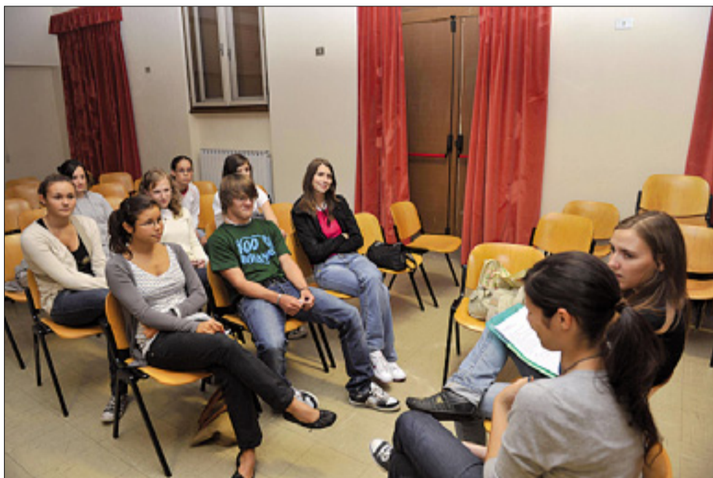
Včeraj so se zbrali udeleženci gledališke delavnice

Udeleženci Festivala mladinske ustvarjalnosti se bodo drugače vključili tudi v program 45. študijskih dni Draga 2010.