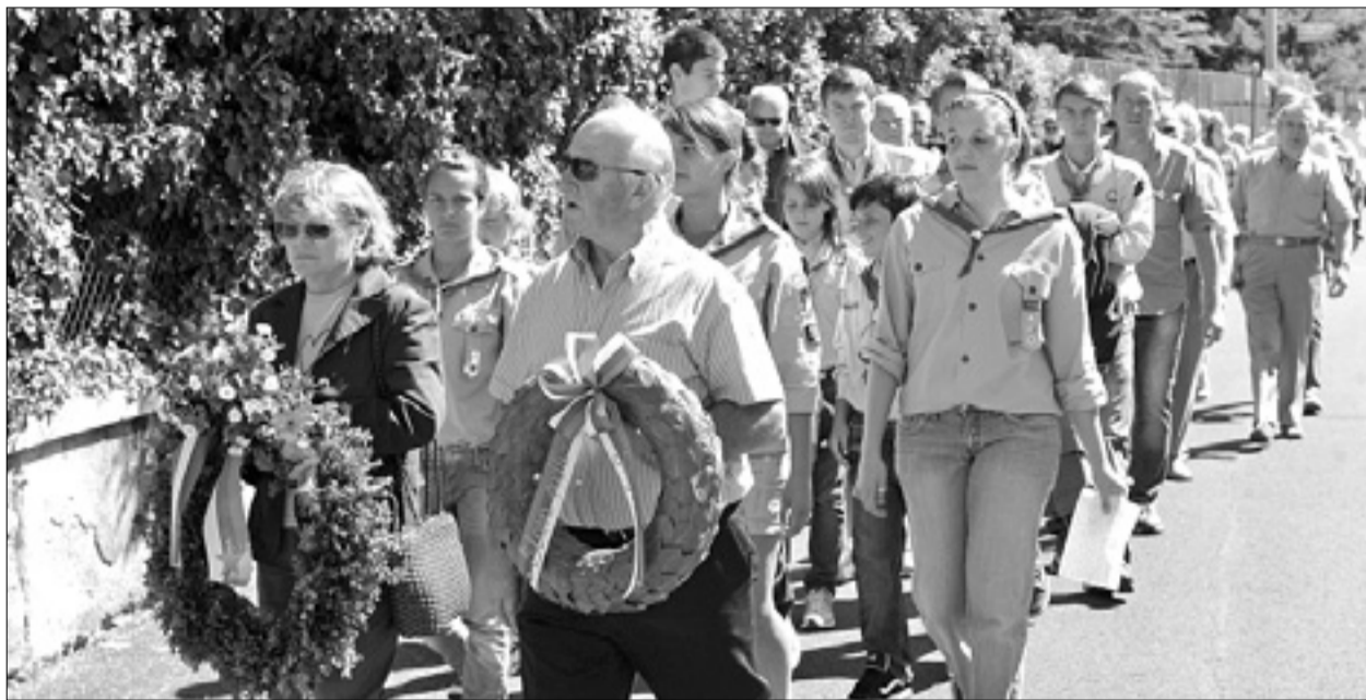
Zgoraj sprevod po Opčinah, spodaj slovesnost na kraju smrti

Udeleženci spominske slovesnosti so se ob lepem vremenu podali po poti, ki so jo prehodili padli pred usodnimi strelji, od nekdanje karabinjerske postaje, sedanje pošte, kjer so bili mladi borci za svobodo zaslišani, do hišne številke 16 v sedanji Ul. Salici, kjer je bila nemška komanda. Mnogim starejšim udeležencem je spomin poletel v tista težka, krvava leta. Ob domačinih, članih VZPI-ANPI z Opčin, od Banov, od Ferlugov in od Piščancev, so se komemoracije udeležili predstavniki partizanskih organizacij iz Nabrežine, Proseka-Kontovela, Repentabra, Trebč, ter seveda iz Doline in Prebenega. Na slovesnosti je ob besedah spomina zadonela pesem iz mladih grl dekliske pevske skupine Vesele pomladi ter borbeno pesem iz partizanske epopeje moškega pevskega zbora Tabor.