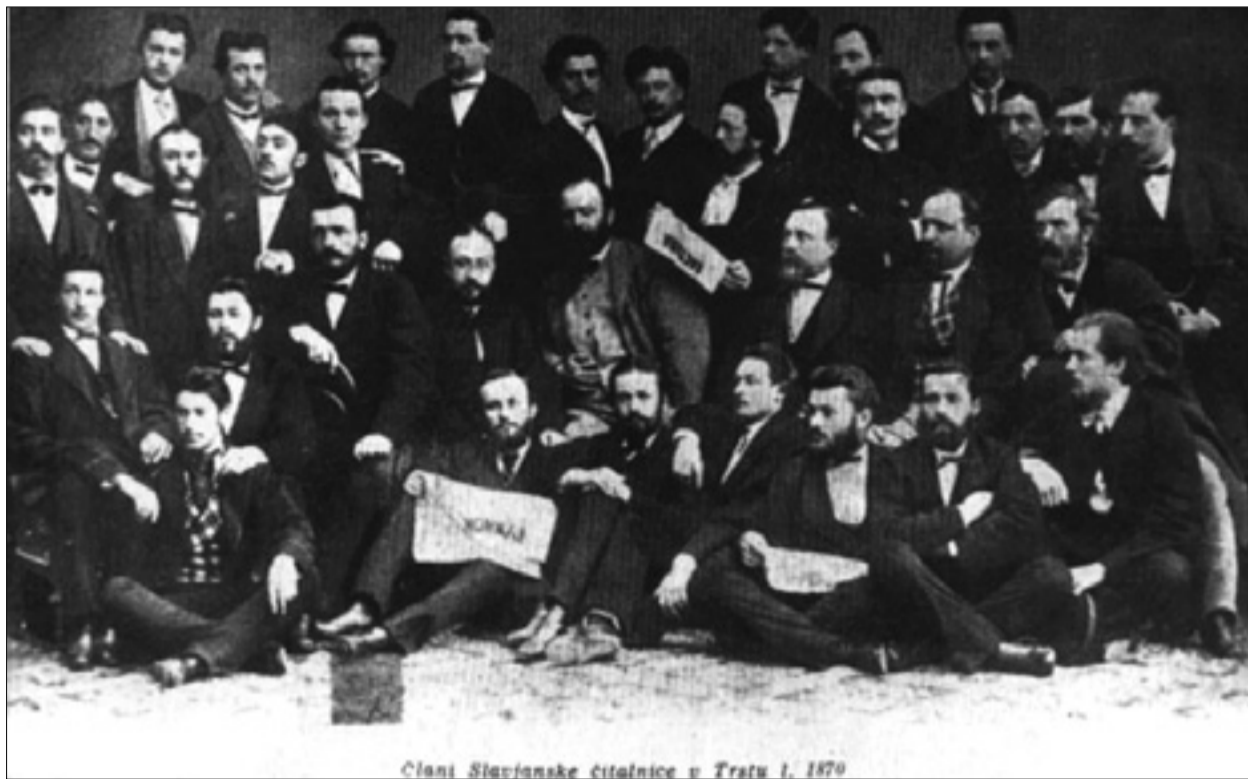
Člani Slavjanske čitalnice v Trstu leta 1870