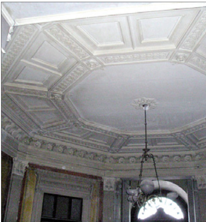
Detajl stropa palače Kalister na trgu Libertà