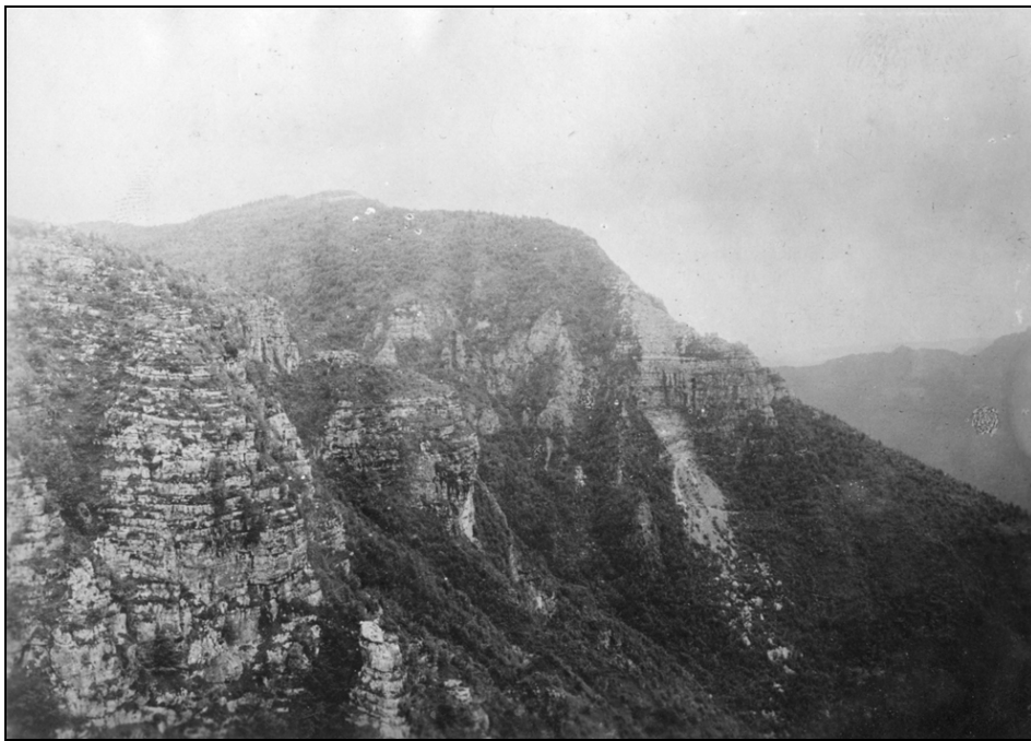
Pogled na Monte Cengio avgusta 1916 (iz zbirke Mitje Močnika).