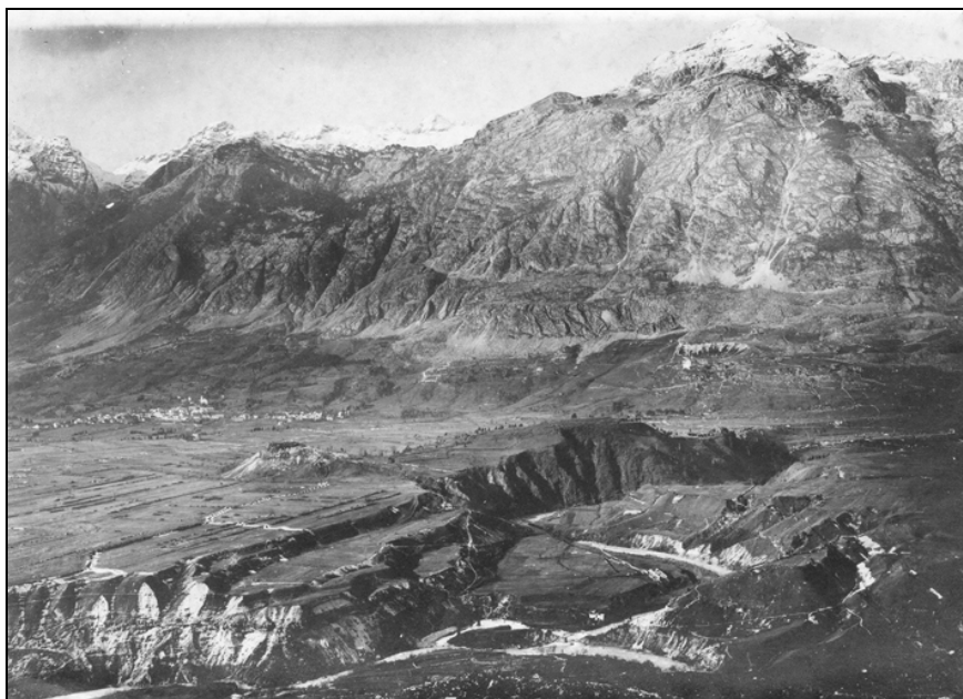
Bovška kotlina, slikana s pobočja Javorščka. Spodaj Ravelnik in Bovec, v ozadju Rombon s Čuklo.

na Koroškem, kjer smo izstopili. Tu smo ostali pet dni, da so nas opremili z gorsko opravo in nas preiskali, ako nima kdo kake nalezljive bolezni. 25. avgusta smo se odpeljali v Trbiž, od tu pa nato korakali v Rabelj, od koder smo po 5 km dolgem rovi ondotnega rudnika ponoči prišli v Spodnji Log (Unterbreth). Do tu je korakal naš I. bataljon redno skupaj. V Logu so pa vsako stotnijo poslali kam drugam. Našo so 27. avgusta poslali na Rombon. Po 9 urni naporni hoji – bile so same kozje steze in včasih smo morali plezati skoraj navpično navzgor – smo prišli na kraj, kamor smo bili poslani.