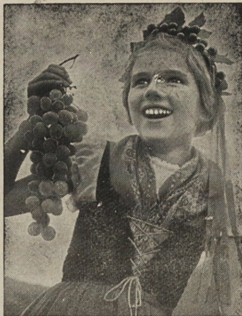
„Sladko bo vince...“ — seveda zanjo še ne!

Med pesnike, ki so s posebno ljubeznijo viseli na rodni grudi, na slovenski zemlji in slovanstvu, spada v prvi vrsti Gregorčič, ki je res škropil svojo srčno kri po naši zemlji z željo, da bi iz nje zrastle v Slovencih ljubezen do domovine. Njegova rodoljubna pesem ne bo nikdar pozabljena.