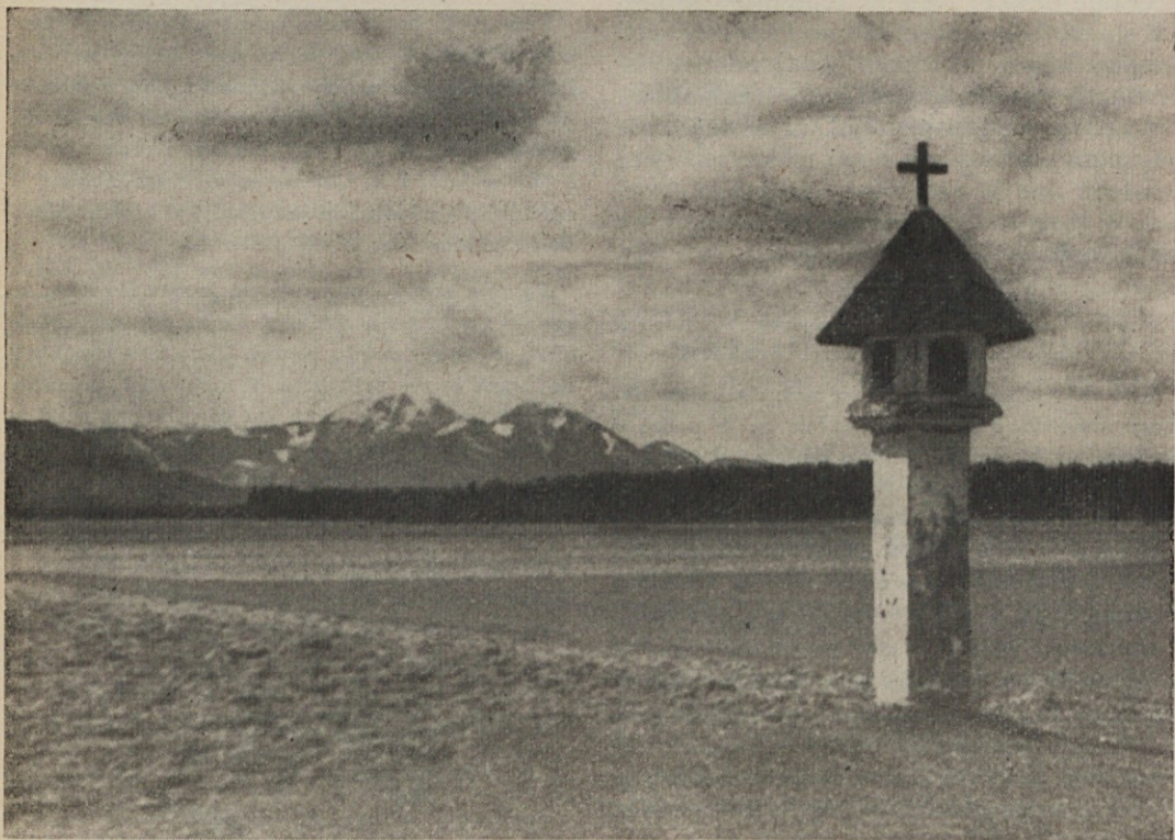
„Hladna jesen že prihaja...“. (Jesenska idila v Podjurski dolini na Koroškem. — V ozadju gora Peca [2114 m], pod katero pravijo, da spi Kralj Matjaž.)

Pisma naj bodo pisana v slovenščini ali v angleščini. Posebno važnost bodo imela pisma Slovencev s Tržaškega, Goriškega, Beneške Slovenije, Rezije, Kanalske doline in Koroškega. Čim več pisem, tem bolj nas bodo upoštevali.