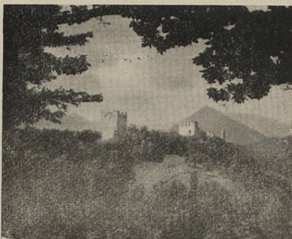
Razvaline celjskega gradu