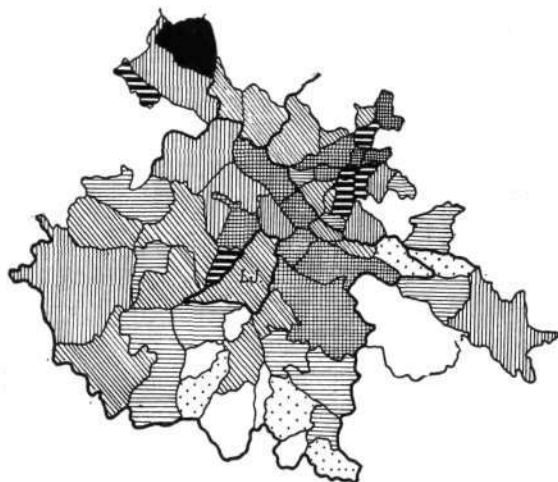
Sl. 2. Odstotek v industriji in obrti zaposlenih v l. 1931. (po občinah),