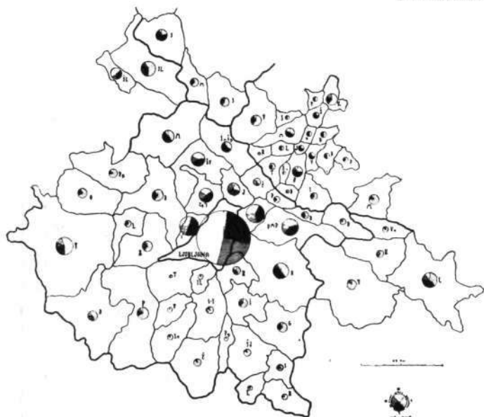
Sl. 1. Poklicna struktura Ljubljane in okoliških občin (l. 1931.).