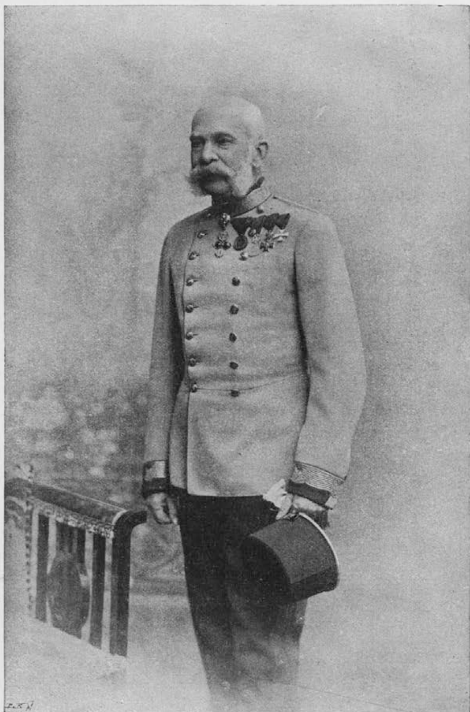
Cesar Franc Jožef I.