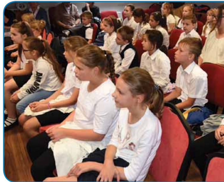
Sejno dvorano Državne slovenske samouprave so napolnili učenci porabskih

ekip (z monoštrske šole so prišli le učenci iz prvega, narodnostnega razreda, z obeh dvojezičnih šol pa skupine od 1. do 6. razreda). Strokovne