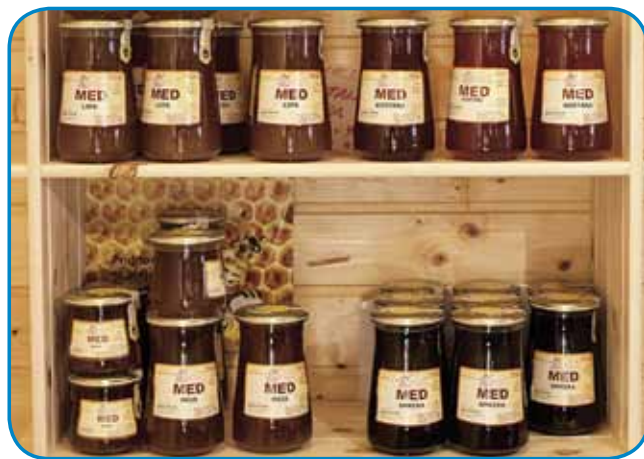
Šemnovi odavajo 12 fajt meda

Tüdi fčelari so dosta odvisni od narave, tak ka včasi pripouvajo več, včasi pa menje meda: »S sedmimi tovrnjaki vozimo fčele po cejlj Sloveniji, zatau mam telko različni sort medov. Posebnost zadnjih lejt sta med iz dine, steri je trno zdravilen, fčele pa ga naberajo doma v Prekmurji, na mordje pa jih