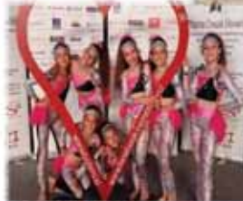
PLESNA ŠOLA ZEKO MURSKA SOBOTA