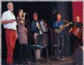
GLASBENA SKUPINA RILA BUDIMPEŠTA