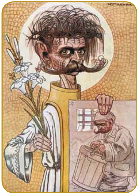
Ivan Cankar kak mantrnik na karikaturi Hinka Smrekara

Grozdrom pa Gruđenom, šteriva badva šketa na svojo stran postaviti bogatca Gornika - vse tau v imeni narodovi idealov. V etoj satiri Cankar dojzračuna z idejami nacionalizma ino liberalizma iz drügoga tala 19. stoletja. Prauti toma dvöma mentalitetama se postavi novinar Ščuka, že skoro s socialističnimi mislimi. V toj dramu je dosta prizorov (jelenet), šteri nemajo idejnoga