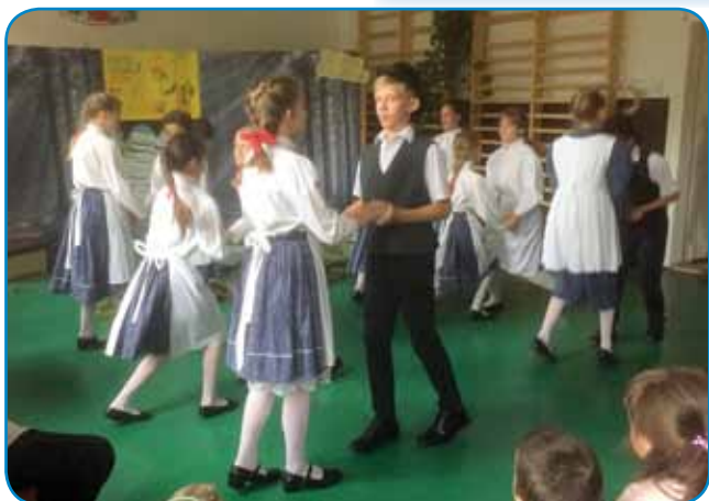
Seniška šolska folklorna pleše porabski ples »rozinko«

»Te dejavnosti potekajo v slovenskem jeziku, zato ga morajo učenci tudi uporabljati. Osvojijo več izrazov, če se naučijo kakšno pesmico ali neko vlogo v kakšni igri. Tako