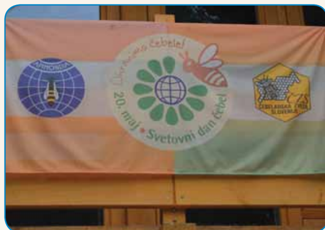
ZA MOŠKE SO TEMNI, ZA ŽENSKÉ SVEKLI MEDOVI stran 4