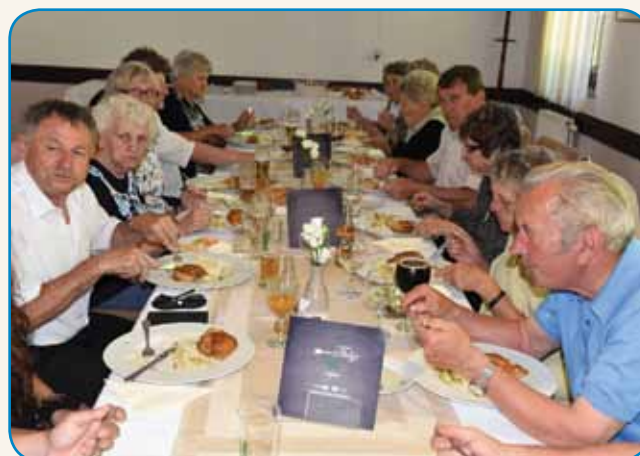
PRED 60. LEJTI SO KONČALI ŠAULO stran 8