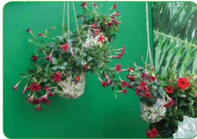
Dipladenija je vedno zelena vzpenjava ovijalka z olesnelimi stebli. Sadimo jo v posode, sklede ali korita in jim namenimo sončna rastišča. Za mraz je zelo občutljiva in ne prenese temperatur pod 10 °C.

Pelargonija je še vedno stalnica, ki prekriva balkone z bogatim cvetjem in ki v glavnem nikoli ne razočara. Vrtnarji vsako leto izpostavijo sorte s posebnimi barvnimi