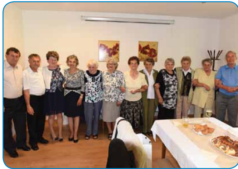
Nekdenešnji sošolci v hoteli Apát

»Vse so tašne oljnate bile, zato ka pod je z oljom bejo goranamazani. Taše črne nodje smo meli kak vrag, gda smo bausi bili.«