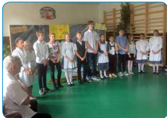
Pevski zborček je zapel pesem iz Slovenije in dve iz Porabja

prvo smo slišali veselo pesmico Lenčke Kupper z naslovom »Enkrat je bil en škrat«, ki so