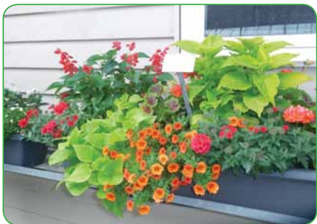
Mešana zasaditev: milijon zvončki, sladki krompir, salvija, dekorativna pelargonija in navadna pelargonija, verbena in zelena okrasna kopriva. Vse prenašajo močno sonce.

odtenki, ki kljub bujnemu cvetenju ne vzamejo preveč