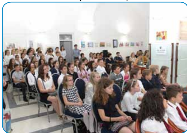
Učenci, pripadniki vseh trinajstih narodnosti na Madžarskem

Narodnostni pedagoški šolski center pri Uradu za šolstvo je 9. maja organiziral proslavo, v okviru katere so nagradili najboljše narodnostne učence, ki so se udeležili državnega tekmovanja iz znanja narodnostnih jezikov in državnega likovnega natečaja za narodnostne učence. Proslava, na kateri so odprli tudi razstavo najboljših otroških del, je potekala v prostorih Urada varuha človekovih pravic v Budimpešti.