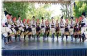
BOLGARSKA FS JANTRA BUDIMPEŠTA