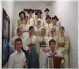
FS ZSM GORNJI SENIK