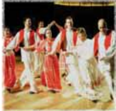
FS HKD GORNJI ČETARCI