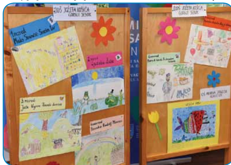
Razredi so pripravili tudi ilustracijo k pesmi, ki so jo recitali

pesmi slovenskih avtorjev. Med njimi smo našli tudi ljudske (»Sonce sije, dežek gre«, »Žabe svatbo so imele«), vendar so prevladovali znani in priznani slovenski mladinski pesniki ( Maks Simončič , Branko Rudolf , Miroslav Košuta , Cvetko Golar , Boris A. Novak in drugi). Mlajši šolarji so seveda povedali preprostejše pesmi,