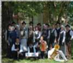
FS REJ ŠMARTNO PRI SLOVENJ GRADCU