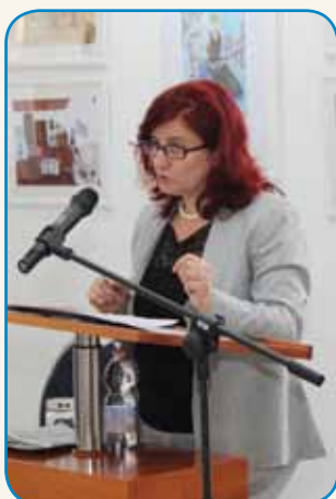
NAGRAJENI NAJBOLJŠI... stran 3