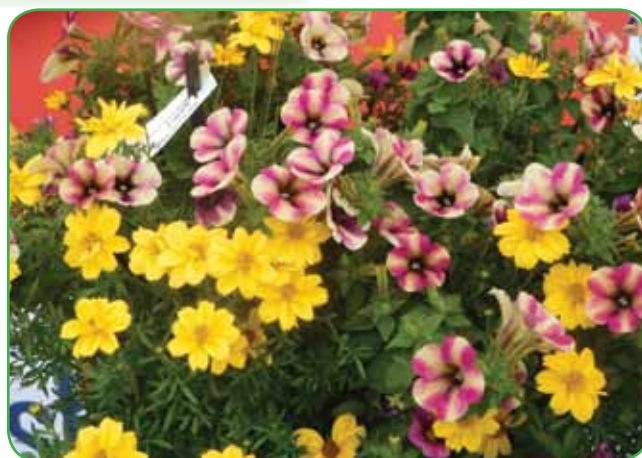
Priljubljene pisane petunije, bidens ali mehiški brkač. Rumena barva je vedno poživljajoča in vedra. Bidens je žejen, prav tako petunija.