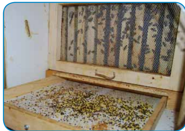
Fčelice in cvetni praj