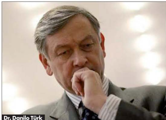
Dr. Danilo Türk

mi. Razveljavili so tudi razpis za gradnjo nove urgence v ljubljanskem Kliničnem centru. Inšpektorji pregledujejo razpise, pogodbe, natečaje in druge dokumente, ki bi utegnili vsebovati same korupcije. Proti morebitnim krivcem bo vlada uvedla sankcije, kar velja tudi za projekt gradnje šestega bloka termoelektrarne Šoštanj. Ta pomeni največjo naložbo v preteklih nekaj letih v Sloveniji, v dosedanjih postopkih za gradnjo pa so domnevno že ugotovili nekaj primerov osebnega okoriščanja z državnim denarjem. Poznavalci političnih razmer in