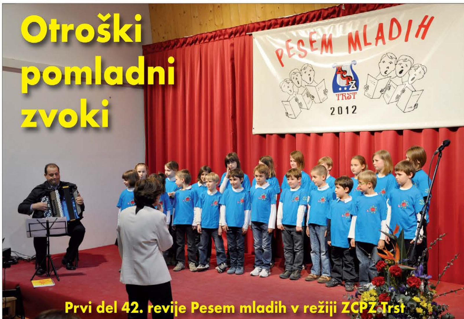
Prvi del 42. revije Pesem mladih v režiji ZCPZ Trst