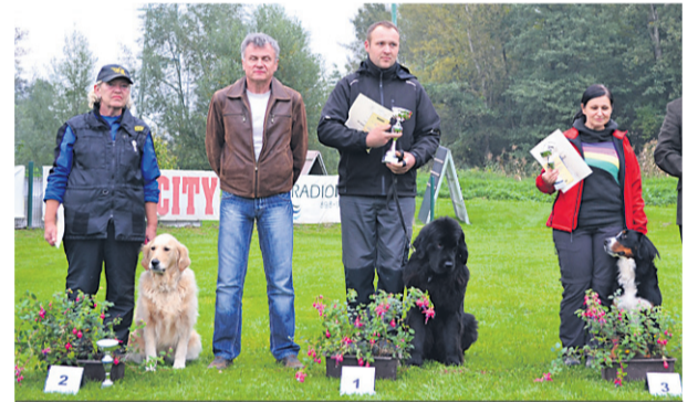
17. Čihalov memorial