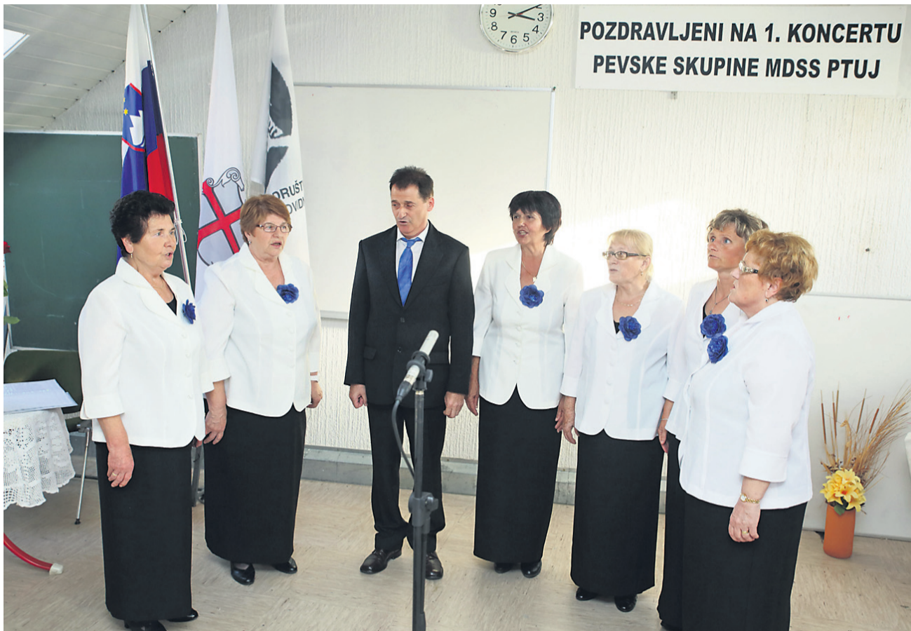
Pevska skupina Medobčinskega društva slepih in slabovidnih Ptuj je praznovala prvo obletnico delovanja. Počastili so jo s koncertom, na katerem so sodelovale tudi skupine ljudskih pevcev in glasbenikov s Ptujkega in širše.

Medobčinsko društvo slepih in slabovidnih je ob obeh dnevih, posvečenih vidu, pripravilo tudi odmeven koncert svoje pevske skupine, s katerim so praznično obeležili njeno prvo obletnico delovanja. Nanj so povabili 20. oktobra, natanko eno leto po začetku delovanja skupine v letu 2013. Skupina se je