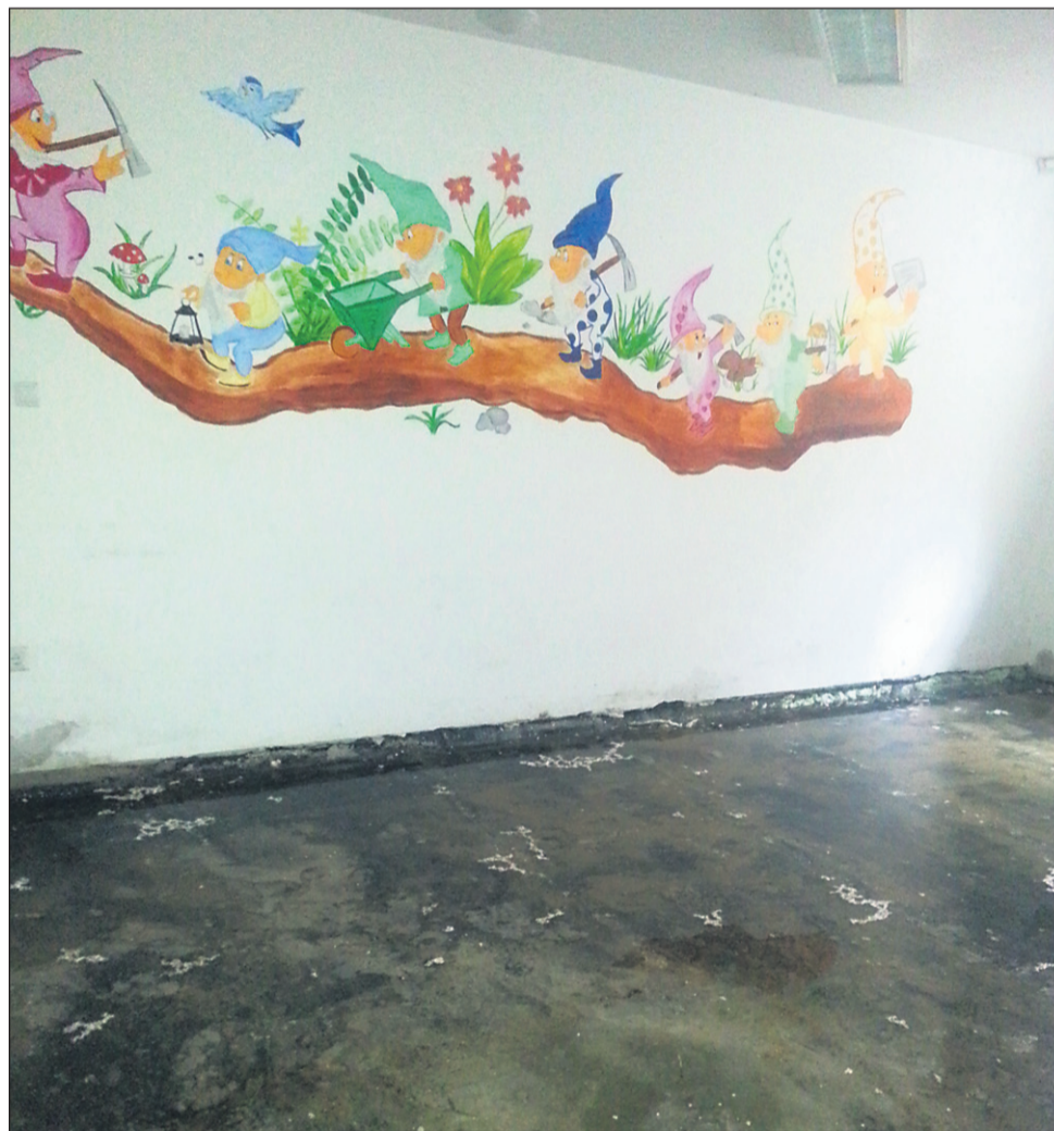
Tako izgleda pravljíčna soba po odstranitvi tal. Pod sobo, v kateri sicer niso izvajali pravljíčnih ur, se je skoraj 12 let pretakala voda.