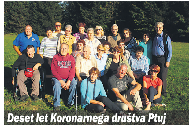
Deset let Koronarnega društva Ptuj