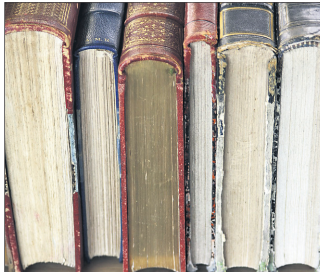
Zaradi vlage in posledično plesni je bilo v lenarški knjižnici uničenih okrog 4000 knjig (fotografija je simbolična).

presega v trikratniku samo investicijo. Verjetno bi morali takrat bolje proučiti tla in nevarnosti, za katere je bilo splošno znano, da obstajajo. Najceneje ni vedno najbolje. Najhuje pa je dejstvo, da prizidek nikoli ni dobil svoje prave namembnosti, ker se je zaradi neuporabnosti obrnilo vse na glavo in se je vse povezovalo med seboj.«