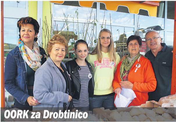
OORK za Drobčinico