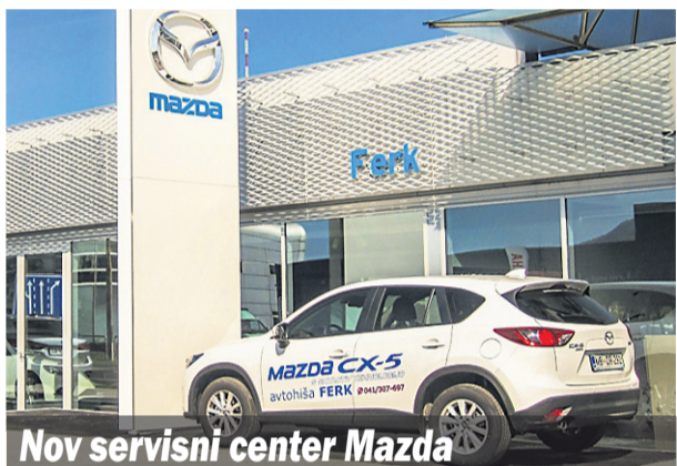
Nov servisni center Mazda