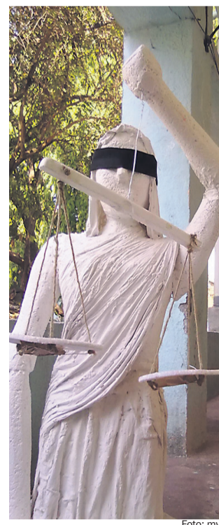
Fotografija je simbolična.

»In zakaj je pomembno, da občinski svet potrdi nov sklep? Zato, ker nam v finančni konstrukciji za leto 2015 manjka tisti del, ki smo ga računali dobiti od Evropske unije. To je 840.000 evrov. Jaz sem prepričan, da občina k temu projektu mora pristopiti. Pridobili smo gradbeno dovoljenje, da se sedanji vrtec poruši in se na istem mestu zgradi novi, energetska varčen objekt. V vrtcu v Veliki Nedelji so oddelki, teh je pet, polni. Že sedaj pa imamo en oddelek v šoli, ker ni prostora v vrtcu,« je še pojasnil ormoški župan.