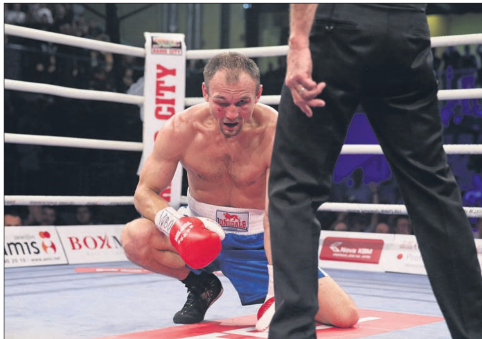
Ferencu Hafnerju v Taboru ni bilo lahko ...