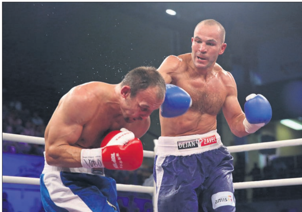
Odlična predstava našega šampiona ni puščala trohice dvoma v zmago.