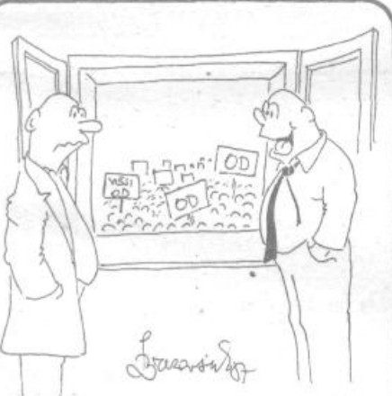
- Vidiš, sploh nismo mi krivi, da stavkajo, ampak osebni dohodki!

Organiziranost akcijskih konferenc je stekla tudi v krajevnih skupnostih, kjer naj bi se zaključila v mesecu oktobru.