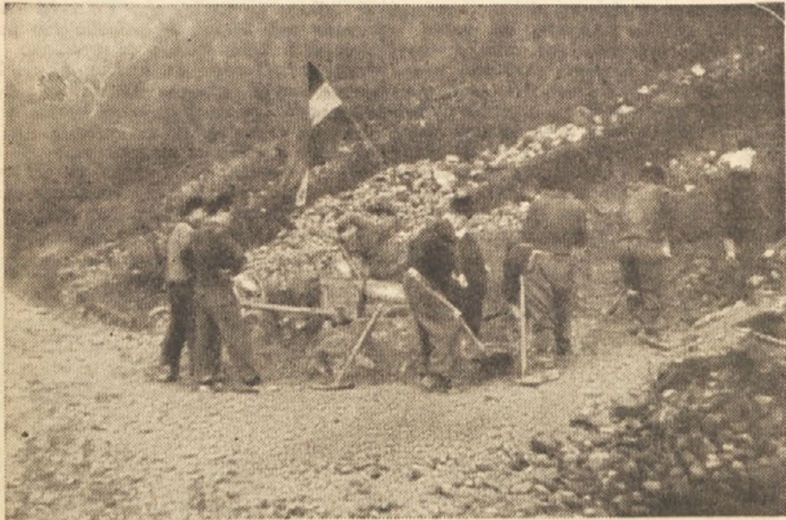
Titova zastava jih vodi na delo in pri delu.

Oglejmo si uspehe. Tovarišici Čandap Marija in Furlan Roža sta v delovnem času, to se pravi v 6 urah zvozili po 120 samokolnic 80 metrov daleč in to prekvašene težke zemlje, ali pa z zemljo pomešanega gramoza.