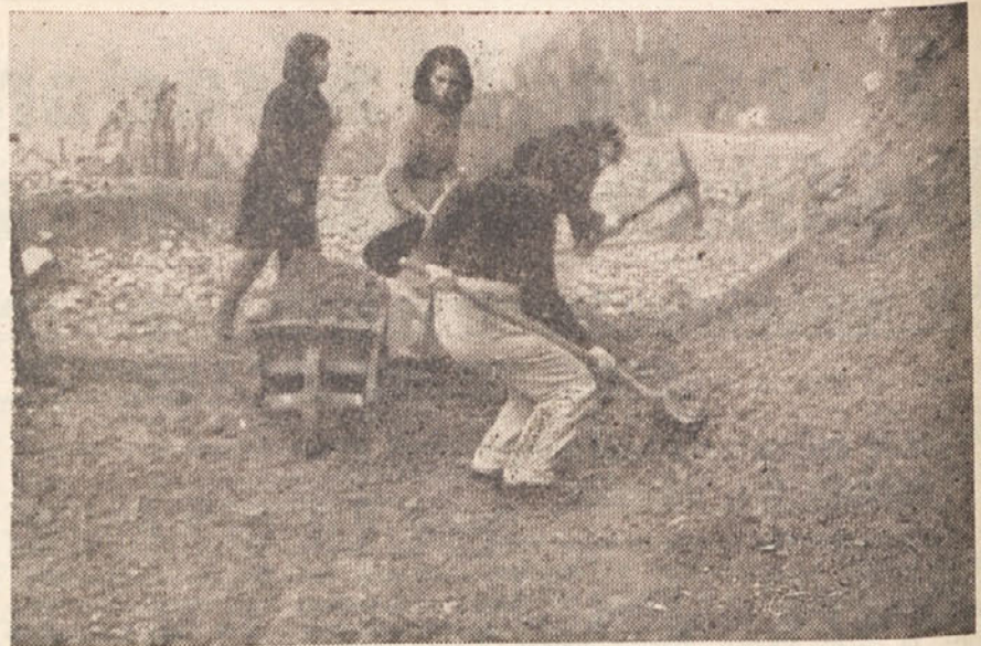
Skupina brigade »Simona Kosa«, ki gradi cesto v Nemški Rut, pripravlja grušč za posipanje cestišča.