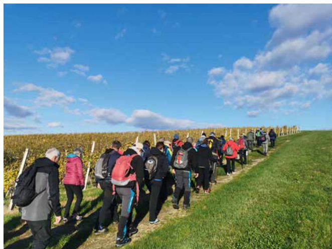
Med Radgonskimi goricami

Na pohod ob polni luni smo konec novembra popeljali tudi otroke osnovne šole. Ker se je tokrat luna kar sramežljivo skrivala za oblaki, so otroci na pohodu na Repetitor z velikim užitkom uporabljali najrazličnejše lučke. Če nas je kdo srečal, je bil gotovo kar malo presenečen ob tako raznovrstni razsvetljavi. Za slišnost pa so prav tako poskrbeli številni mali in radoživi udeleženci našega pohoda. Otroci so bili na koncu zadovoljni in nekateri tudi malo utrujeni. Malo potrpežljivosti pa so morali pokazati tudi starši, saj smo zaradi velike skupine malo zamujali.