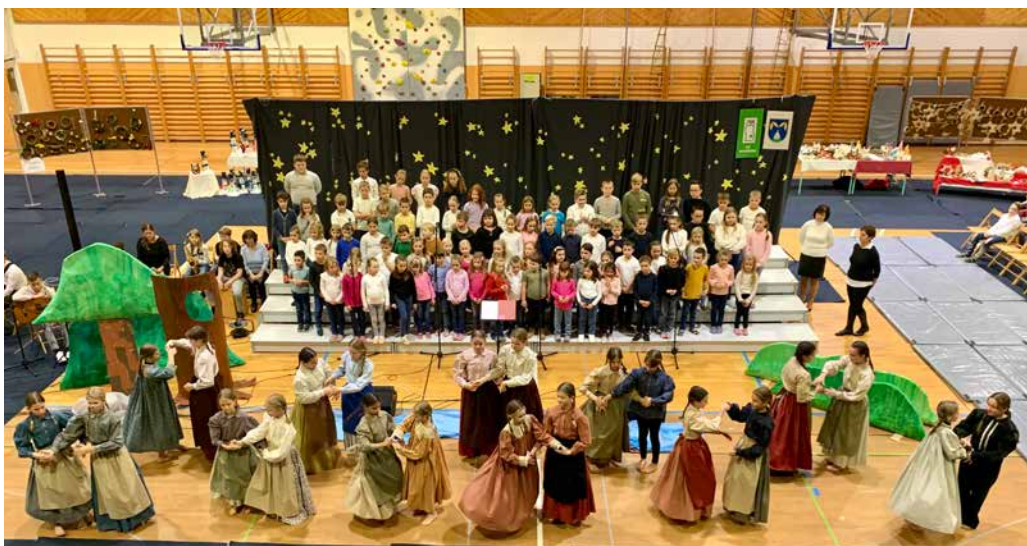
Nastopajoči na božičnem bazarju v OŠ Majšperk