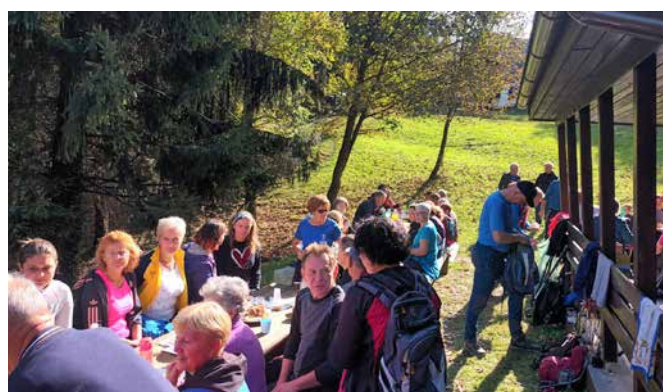
Planinci na kostanjevem pikniku