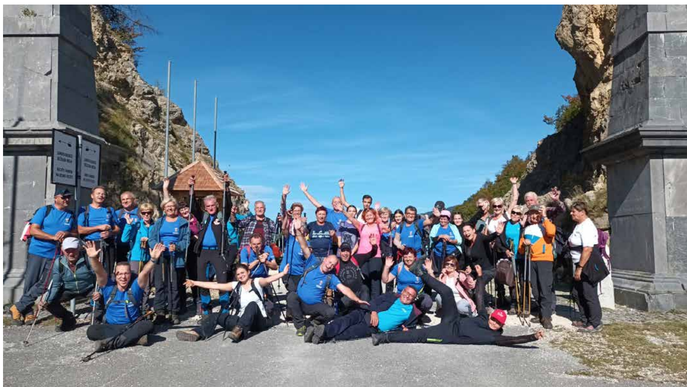
Planinci na starem Ljubelju

V oktobru smo že tradicionalno izvedli kostanjev piknik na Donački gori, na katerem se je zbralo veliko članov in pla-