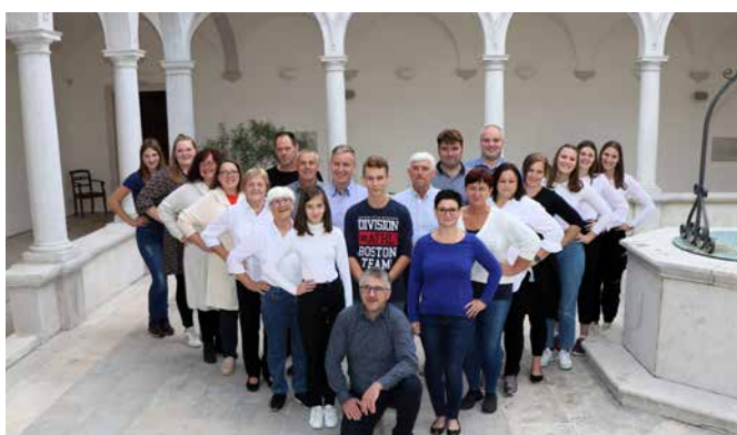
Popravek: Zbor sv. Miklavža v Piranu