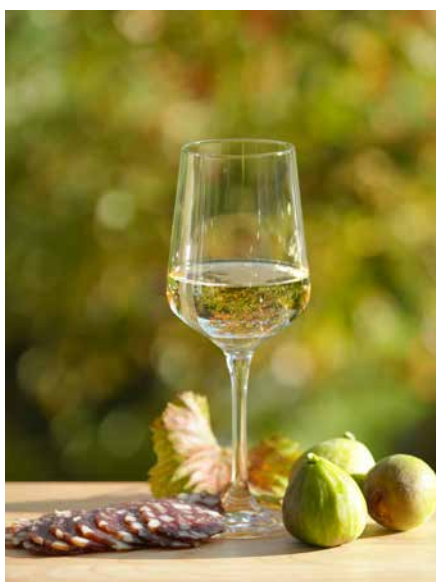
Martinovo tihožitje