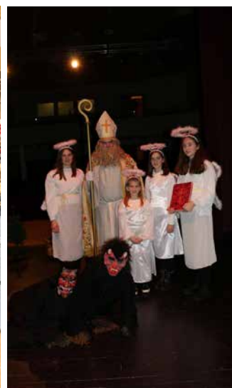
Miklavž v Majšperku