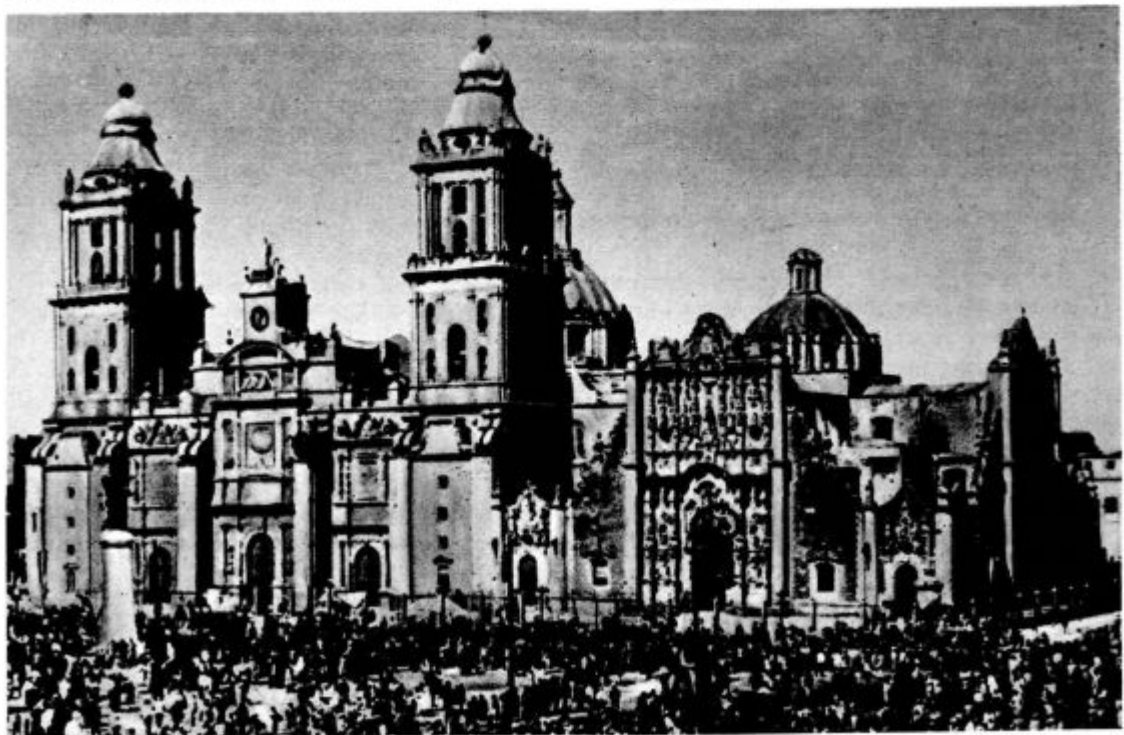
Stolnica v Mehiki,

kjer se je nedavno vdrl kor in je bilo več oseb ponesrečenih