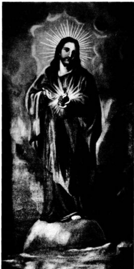
b) Srce Jezusovo

(Slikala gdč. Gretl Wanisch, Ljubljana, za veliki oltar v Št. Vidu pri Lukovici )