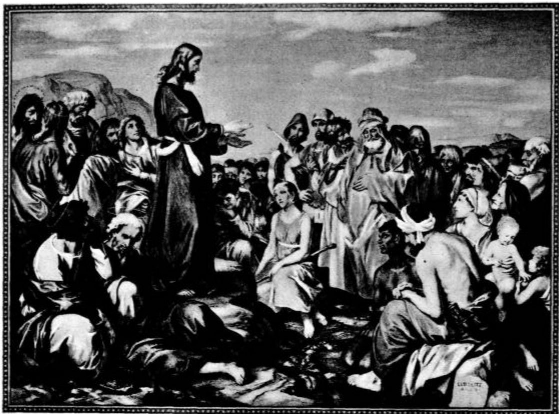
Jezusov govor na góri (Posnetek iz djakovske stolnice)

Kakor je pri orehu glavna stvar jedro, pri človeku pa duša, tako je pri pobožnosti glavna stvar duh. — Res je pa, da jedro potrebuje lupine in duši služi telo. Zato je vendarle na lupini tudi nekaj ležeče; pri človeku ima tudi telo važno vlogo, — a pri pobožnosti tudi zunanost.