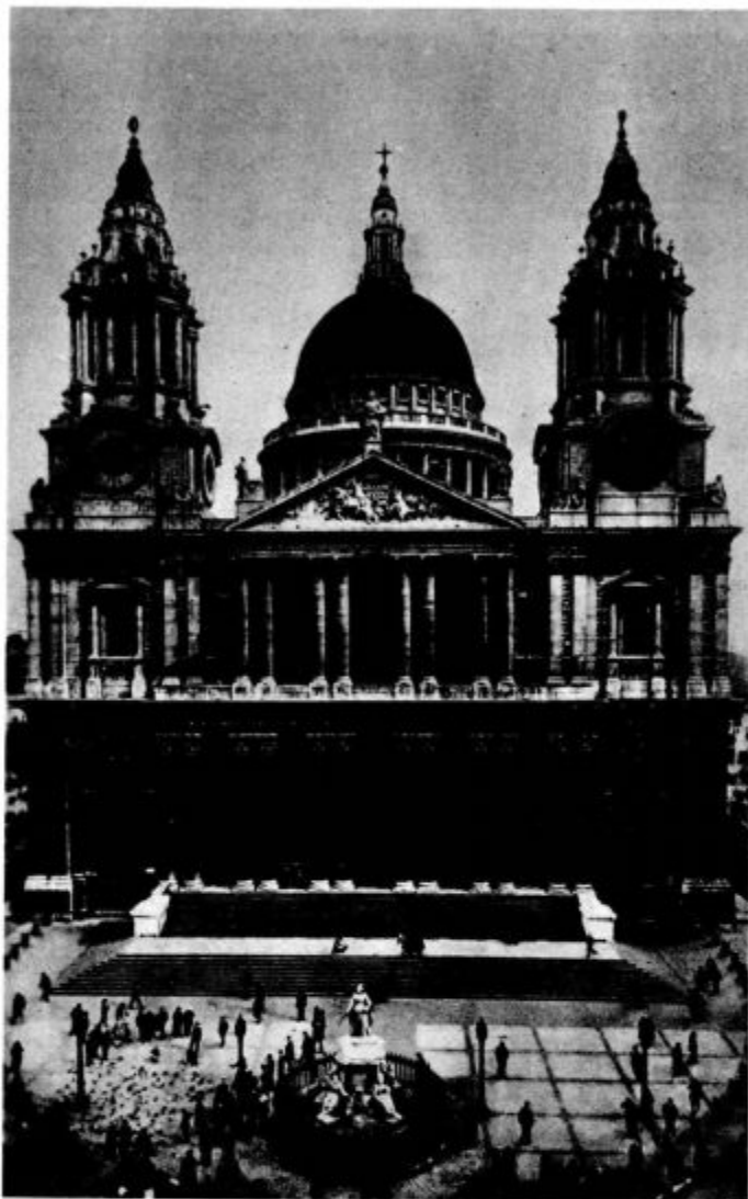
Stolnica sv. Pavla v Londonu

»Preden pridemo k svojemu pravemu predmetu — 'čudežem Gospodovim' — si moramo biti predvsem na jasnem o najbolj početnih pojmi. Večina zmot o evangelijskih poročilih o čudežih poteka samo iz tega, ker sklepajo iz napačnih domnev in načel. Moramo torej predvsem vedeti, kaj sploh je čudež!