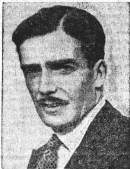
Anton Eden, angleški zunanji minister

Narod se ne da več slepiti z raznimi pri-smodarijami, ki jih »Slovenec« in njegovi bratci prodajajo med našim kmetiskim narodom, kadar so postavljeni na sonce.