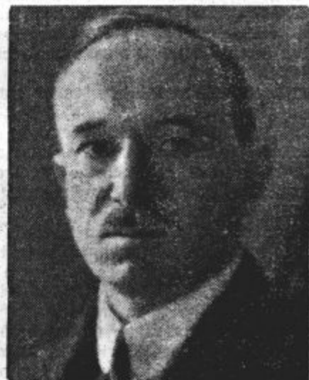
Dr. E. Beneš

Poleg tega je poskrbel Veliki fašistični svet tudi primerne ukrepe, ki naj zagotove vsem tem potrebam zadostno število človeškega materiala.