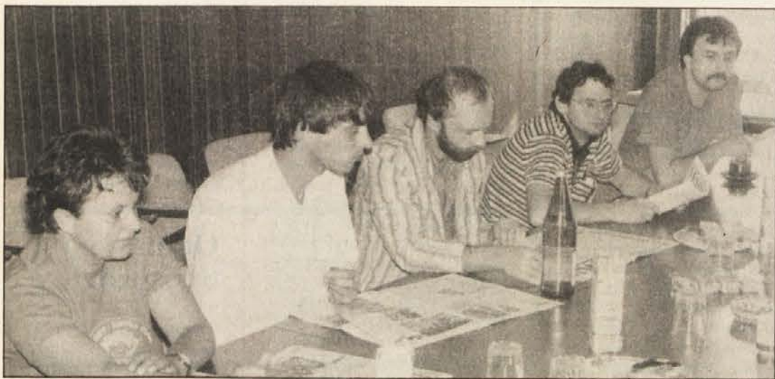
Predstavitvi novega Slovenskega vestnika v okviru tiskovne konference na sedežu ZSO v Celovcu so prisostvovali predstavniki vseh pomembnih medijev na Koroškem.

Največji slovenski dnevnik „Delo“, je predstavil list s ponatisom prve strani, Mariborski „Večer“ je pisal, da je Slovenski vestnik „časnik, ki se želi odpreti preko državnih in narodnostnih meja“. Ljubljanski „Dnevnik“ pa je ob izidu novega lista poudaril, da je Slovenski vestnik z novim konceptom in v novi podobi pomembna pridobitev slovenske narodnostne skupnosti na Koroškem.