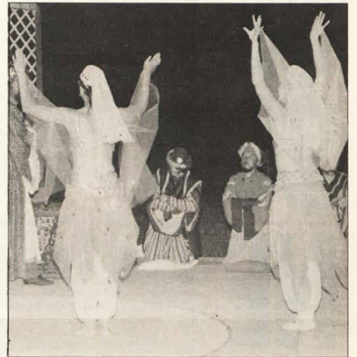
Szenenaufnahmen aus der Premierenvorstellung des slowenischen Volksstückes „Miklova Zala“ in Svatne/Schlatten.