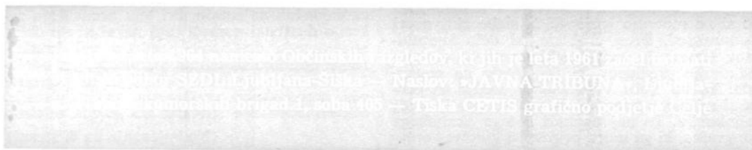
...konferenca Občinskih pregledov, ki jih je leta 1961 začel voditi ... ...SZDL in Ljubljana - Šiška - Naslova »JAVNA TRIBUNA« ... ...komunalni pregled 1. soba 405 - Tiska CETIS grafično podjetje ...

● v obravnavo navedenih zadev je v čim večji meri treba pritegniti vse dejavnike, ki bodo vplivali na hitrejšo in učinkovitejšo reševanje. Socialistična zveza, predvsem pa vsi njeni voljeni organi v občini, prevzemajo s to konferenco vrsto nalog in obveznosti, ki jih je potrebno reševati in rešiti v prihodnjem obdobju. Pred člane Socialistične zveze pa se postavlja vprašanje njihove aktivnosti in sodelovanja v vseh oblikah delovanja Socialistične zveze kot tribune občanov, kjer naj izražajo svojo pripravljenost za sodelovanje v razreševanju širših in splošnih družbenopolitičnih zadev kakor tudi vseh problemov seseske, kraja in vasi, ki so pomembni za socialistični razvoj in za najbolj ugodno počutje občanov v svojem okolju.