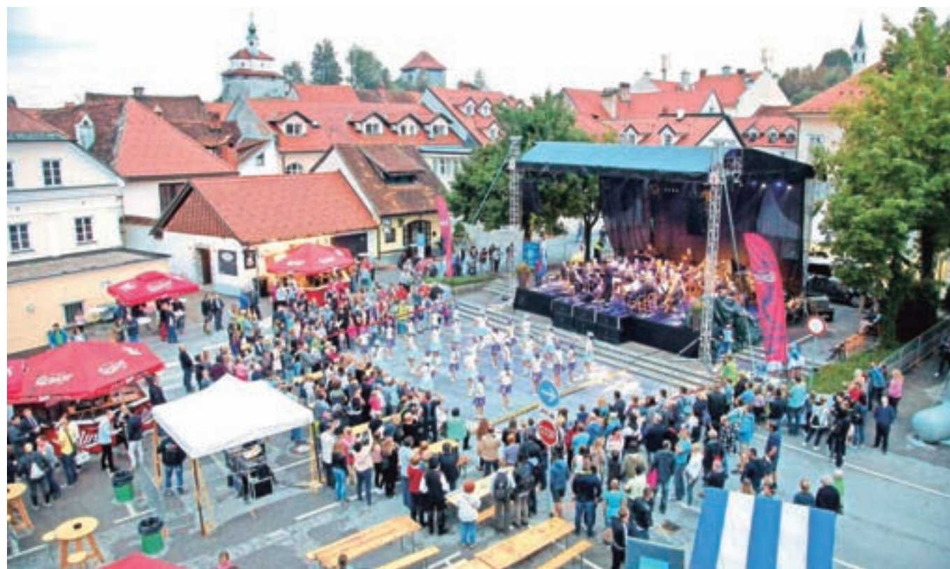
Glavni oder je bil letos na Trgu prijateljstva.

Dneve narodnih noš in oblačilne dediščine so letos zaznamovale štiri strokovne razstave ter pestro spremljevalno dogajanje, vrhunec pa je predstavljala povorka s skoraj dva tisoč udeleženci v narodnih nošah.