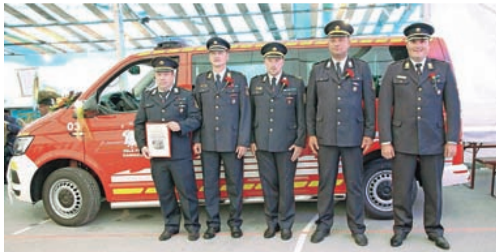
V Selah pri Kamniku so slovesno prevzeli novo gasilsko vozilo.