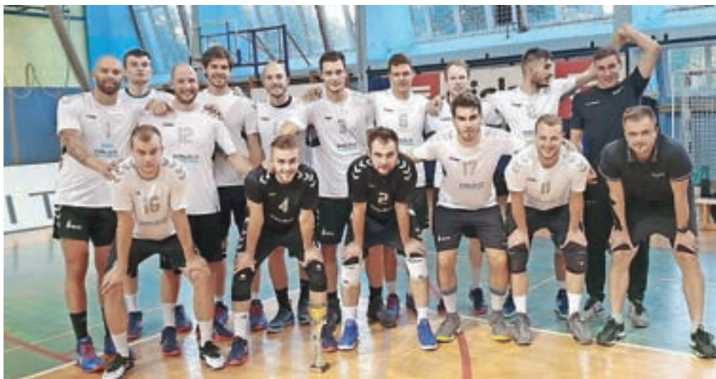
Kamniški odbojkarji so na prvih dveh pripravljalnih tekmah zabeležili zmago in poraz.

»Mislim, da smo na pravi poti, čeprav se nam še pojavlja precejšnje število lastnih napak, a je to po svoje logično, saj do zdaj praktično še nismo igrali. Do zdaj napada sploh še nismo trenirali, bolj smo se ukvarjali s servisom in obrambo. V teh dveh elementih smo že naredili določen korak naprej, medtem ko se nam v napadu pozna, da imamo še veliko stvari odprtih. Zelo dobro stojimo glede telesne pripravljenosti, s prihodnjim tedom pa bomo več pozornosti namenili odbojgarskim elementom in taktiki,« je po domačem turnirju