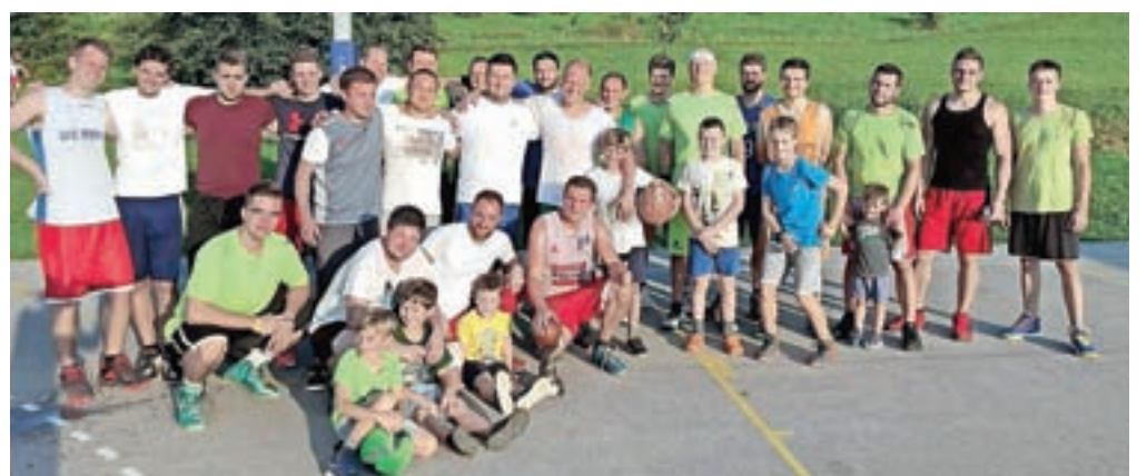
Pod koši igrišča v Mekinjah so se na šesturnem košarkarskem maratonu pomerili igralci Športnega društva Tuhinj in Športno-kulturnega društva Mekinje.

svojega igrišča, smo morali turnir organizirati na različnih lokacijah (na parkirišču tovarne Kemostik in za domom ŠKDM, kjer smo morali zapreti cesto, ki vodi v Nevlje), sedaj pa se na našem igrišču nekajkrat letno odvijajo razni dogodki. Mekinjčani in Tuhinjci se bomo seveda srečali tudi prihodnje leto, saj je šesturni turnir prijateljska vez, ki veže oba kraja.