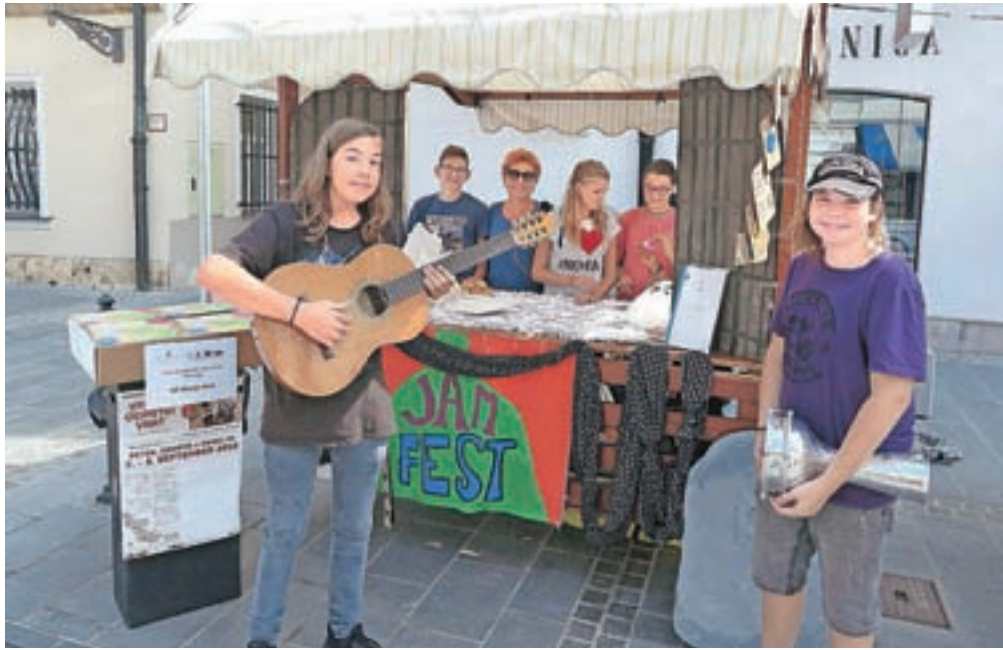
Učenci iz Osnovne šole Marije Vere v Kamniku so predstavili svoj Jamfest na Dnevh narodnih noš in oblačilne dediščine.

Gre za enodnevni kulturno-turistični dogodek Jamfest, ki bi potekal v poletnem času na Jamci na Duplici. Udeleženci bi se zbrali že v zgodnjih dopoldanskih urah in se po interesu razdelili v več skupin. Programi v skupinah bi bili v ekološkem duhu prijazni z naravo. Večina udeležencev bi šla peš v Kamnik, kjer bi si ogledali srednjeveško ulico, grad nad Kamnikom, izvedli bi tudi nekaj o pomembnih Kamničanih in si ogledali muzej in rojstno hišo Rudolfa Maistra. Za popotnico bi udeleženci dobili »jamburger«, na sodoben način pripravljeno značilno jed s kamniško kajzarico, klobaso in kislim zeljem. Na Jamci bi potekal