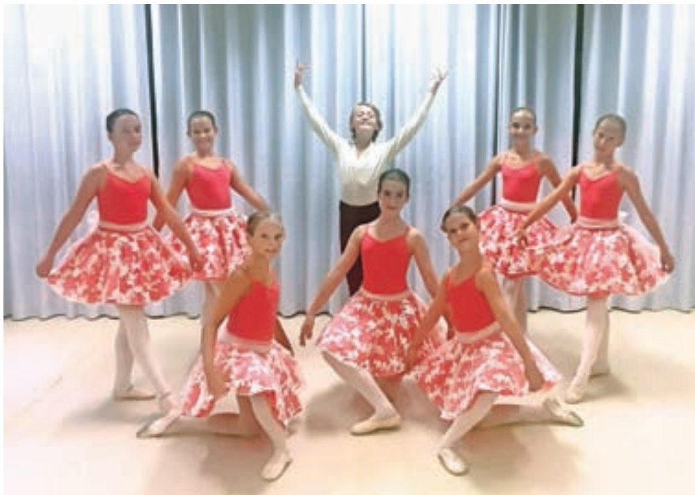
Uspešni kamniški baletni plesalci

Kamnik – Tutu 2018 – slovensko baletno tekmovanje in četrto slovensko tekmovanje koreografskih miniaturn je bilo letos posvečeno 100. obletnici ustanovitve prvega profesionalnega slovenskega baletnega ansambla in z njim baleta v Sloveniji. Tudi na letošnjem tekmovanju, ki je potekalo v SNG Maribor od 20. do 23. junija, so bile zelo uspešne mlade balerine in baletniki iz Glasbene šole Kamnik. Trije naporni tekmovalni dnevi so prinesli veliko veselja tudi kamniški baletni učiteljici Ani Trojnar, ki je del organizacijskega odbora tega tekmovanja, saj so njeni varovanci dosegli izvrstne rezultate, na odru zanesljivo in odločno prikazali in dokazali svoje znanje, talent, trdo delo in odlični odroski nastop. Mednarodna žirija je v kategoriji I. Bela, v kateri plešejo najmlajši učenci solo, dode-