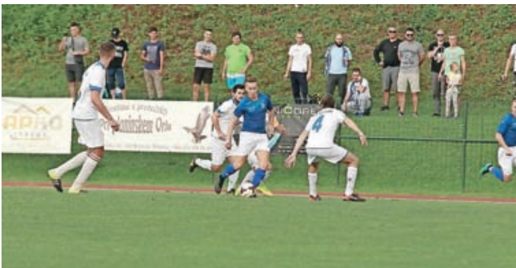
Kamniški nogometaši so se pogumno borili z gostujočo ekipo iz Litije.

minuti zadeli – na koncu se je izkazalo – odločilni zadevek. Po zadnjem pisku so igralci potrto zapuščali zelenico, ponosni, vedoč, da so dali vse za klubski grb, pa vseeno žalostni, ker je ena napaka botrovala prejetemu zadetku, so pozdravili navijače, ki so tudi po zaključku srečanja nagradili naše mlade fante z velikim aplavzom. Hvala vsem, ki ste bili priča izjemnemu dogodku, igralci že stremijo proti naslednjemu koncu tedna, ko se bodo v gosteh pomerili z Dolom, čez dva tedna pa vnovič v Mekinjah.