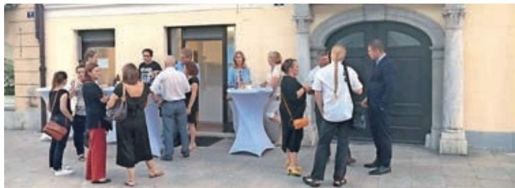
Arkada psihoterapija ima svoje prostore na Šutni.