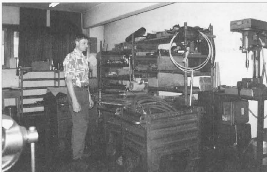
Razlika je očitna – stara montažna delavnica.