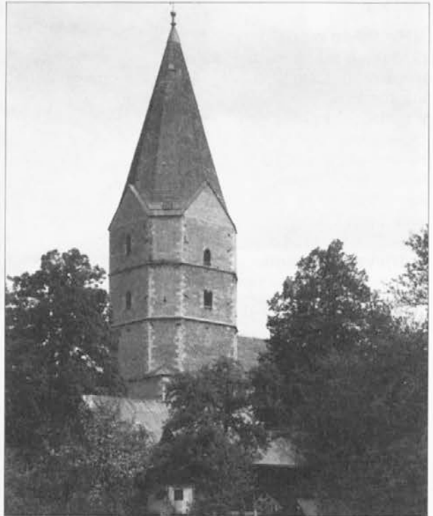
Svetinska Marija Snežna – stara božjepotna romarska cerkev.