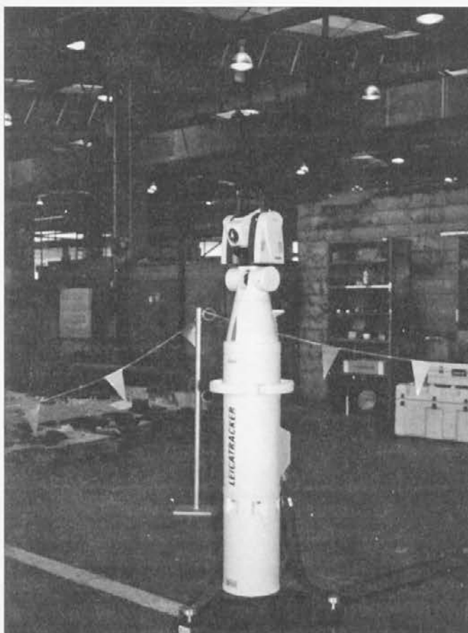
LEICA Laser Tracker LTD700

Laserski merilni sistem je dobavilo švicarsko podjetje Leica, ki je poskrbelo tudi za usposobitev treh operaterjev. V Opremi so, po Orešnikovih besedah, z novo pridobitvijo zadovoljni, še posebej zato, ker je sistem prenosljiv in se lahko uporablja tako v delavnici kot na terenu. »Ta laserski merilni sistem uveljavlja nova merila pri prenosljivem merjenju, saj je njegova natančnost izjemno povečana,« ocenjuje sogovornik pomen nove opreme, ki je prva takšne vrste v Opremi Ravne, medtem ko jo njihovi poslovni partnerji uporabljajo že nekaj časa. Po predvidevanjih bodo ravenski kontrolorji storitve laserskega merilnega sistema tudi tržili.