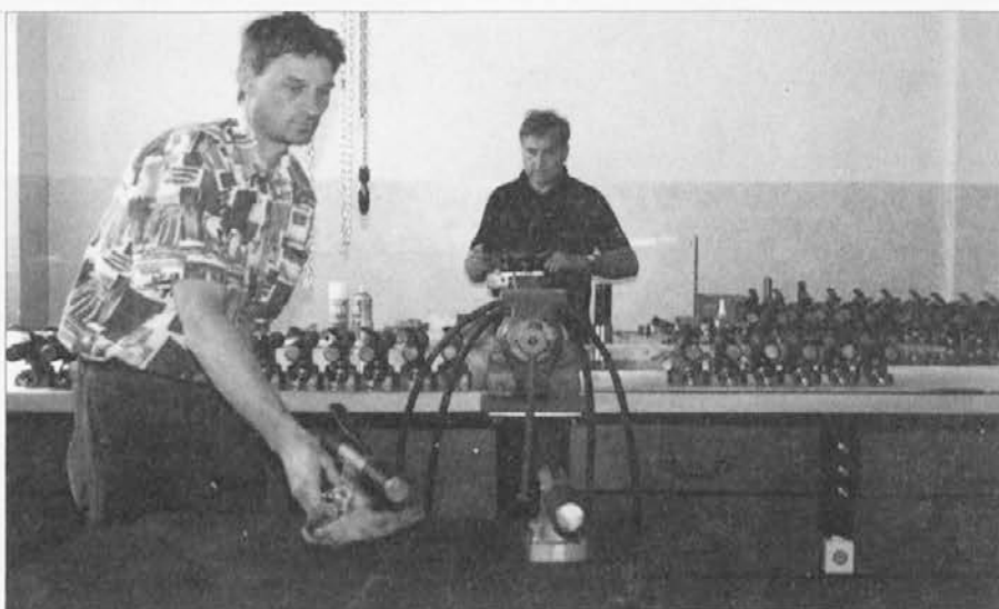
Monterja sta konec maja že delala v novem prostoru.