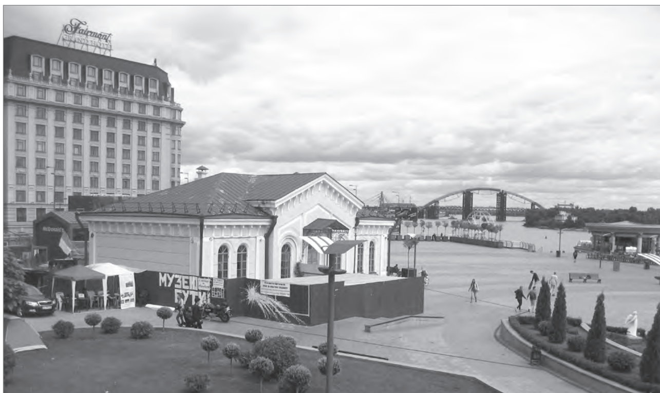
Slika 3: Poštni trg v Kijevu. Napis na ograji: »Muzej bo!«

Pomembno vozlišče v Kijevu je tudi Trg neodvisnosti ( Maidan nezalezhnosti ), ki je bil v 20. stoletju večkrat prenovljen. Potem ko je Ukrajina postala neodvisna, je mestna uprava v želji, da Kijev spremeni v evropsko mesto, začela prenavljati ulico Hreščatik in njeno okolico, vključno s Trgom neodvisnosti.