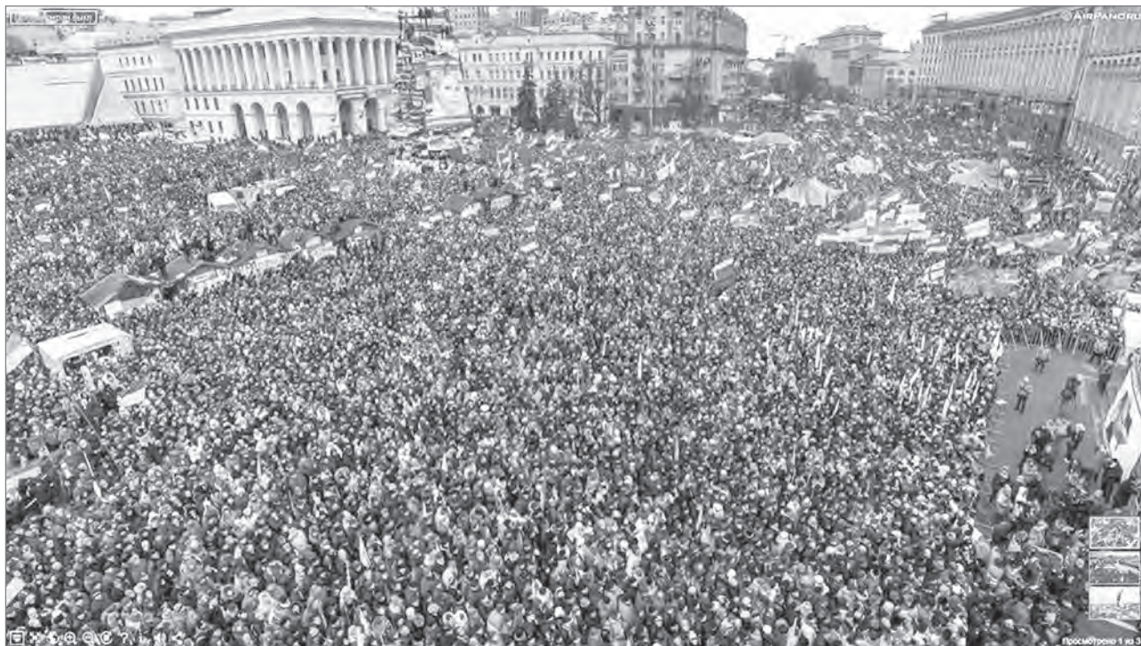
Slika 5: Trg neodvisnosti in protesti ob revoluciji dostojanstva (Euromaidan) leta 2014

turnih prvin mesta. Vozlišča se danes ne dojemajo več v smislu koncepta, ki ga je razvil Lynch, ampak kot skupek procesov, povezanih s človekovim preživetjem in spremembami krajin na vseh ravneh. Ta sprememba je povezana s temeljnimi topološkimi prvini prostora z vidika gibanja in vidnosti. Nekatera vozlišča – zlasti stara mestna jedra, območja, ki si jih prebivalci zapomnijo po dogodkih, ki so tam potekali, in trgi, ki izstopajo zaradi verskih, arhitekturnih in izobraževalnih ustanov – imajo vlogo simbolnih mestnih središč in so del prostorske identitete mesta.