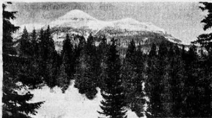
Pogled na Snežnik

Jugoslovanski zvezni odbor za turizem je na svoji zadnji seji sprejel več sklepov za poživitev turizma. Eden izmed teh je ta, da se bodo smele muditi v Jugoslaviji skupine turistov iz tujine, ki prihajajo z avtobusi ali vlaki, 72 ur; imeti bodo seveda morali potni list, a vizuma ne bo več treba. Za jugoslovanske državljane pa je odpravljen vizum s Švico iz z državami Beneluxa.