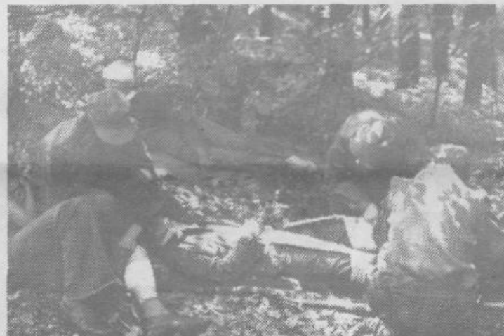
Po spopadu z zasedo je bilo treba z bojišča odnesti ranjence na varnejši kraj, kjer so jim dali prvo pomoč in poskrbeli za nadaljnji transport huje poškodovanih.