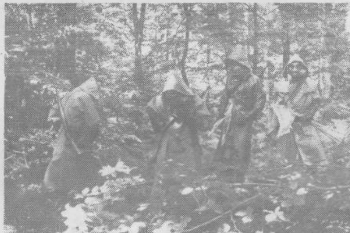
Učenci so sami sodelovali pri vseh vajah, ki so jim jim razložili starešine in pripadniki JLA. Na fotografiji so učenci pri vaji RKB – Detekcija in dekontaminacija.