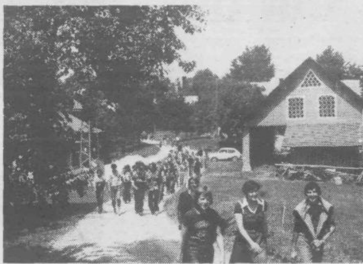
Na obrambnem dnevu grafične in papirniške poklicne šole je sodelovalo 331 učenec in učencev, aktiv rezervnih starešin, učiteljski zbor in oddelek pripadnikov JLA – skupaj 384 udeležencev. Vaje so potekale z Rudnika prek Orljega do Urha.