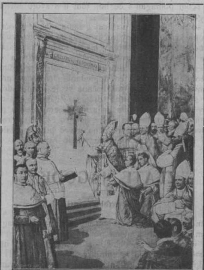
Pred 25 leti odpirajo na sveto leto sveta vrata XIII. Leon papa z zlatim hamričkom, šteroga so njim poklonili pūšpecje sveta. Za to sv. leto so ga poklonili francozki katoličanci.

„Ali znaš, ka me zadržava, da grešnikov dostakrat ne kaštigam? Molitvi pravičnih jemlejo šibo iz rok moje bože pravičnosti.“