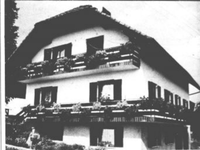
Balkoni v Velenju - takšni in drugačni