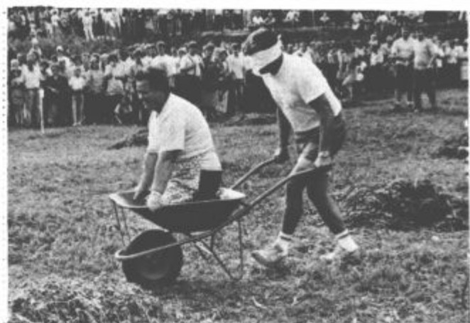
Najbolj so se gledalci nasmejali pri navidez najbolj enostavni disciplini - pri slalomski vožnji kosice v samokolnici. Da je bilo težje, seveda z zavezanimi očmi. Pa je šlo malo levo, malo desno, malo narobe... v splošno veselje in smeh.

gibanja, za druge je bil tovor pretežak in so na poti do cilja "vklopili kiper", zopet tretji so naleteli na drugačne ovire.