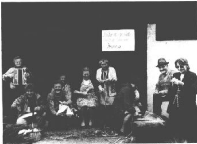
Veliko obiskovalcev so najbolj navdušili preužitkarji v "svoji" hiši

Slovenski vrtnarji in upravljalci "štajerskega bisera" so letos v gaju posadili več kot sto tisoč sadik cvetja, za razstavo pa so v goste povabili nizozemske, nemške, avstrijske, madžarske in hrvaške vrtnarje. Ti so vse svoje mojstrstvo izrazili v čudovitih aranžmajih, ki so jih tokrat prilagodili vodi - ribniku in potoku ob robu gaja. Posebno doživetje je bil večerni obisk gaja, saj so ljubitelji cvetja lahko dodatno uživali v umirjeni glasbi