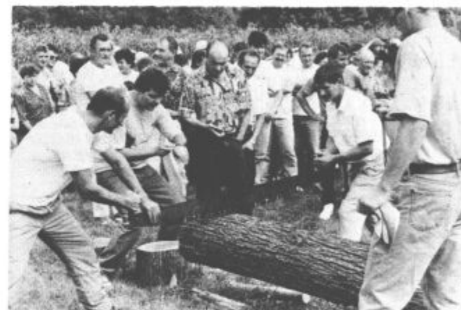
Žagmojstri - večinoma "stari mački" - so vedeli da je treba žago zagnati počasi, nato pa hitreje in hitreje.

Ko so člani posebne komisije ob koncu iger sešteli točke, se je