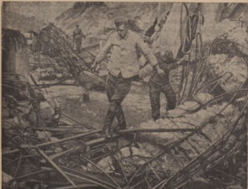
Pioniere im Kampf gegen Natur- gewalten

Durch Eisgang u. Hochwasser ist die- ser Staudamm ein- es 12 km langen Sees zerstört wor- den. Unsere Pioniere sind nun dabei, die Trümmer weg- zuräumen, um den Damm wieder auf- bauen zu können.