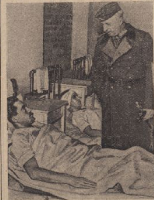
PK-Kriegsbericht Krippans (Atl—Sch).

plača zapadljiva pripomoč za otroke šele za tisti mesec, ko so zato dani potrebni predpogoji. S tem se hoče preprečiti, da bi se prepozno izplačevalo podpore radi zamujene prijave od strani frontnih bojevnikov. Pripomoč se bo izplačevala samo za eno leto v koledarskem letu prijave.