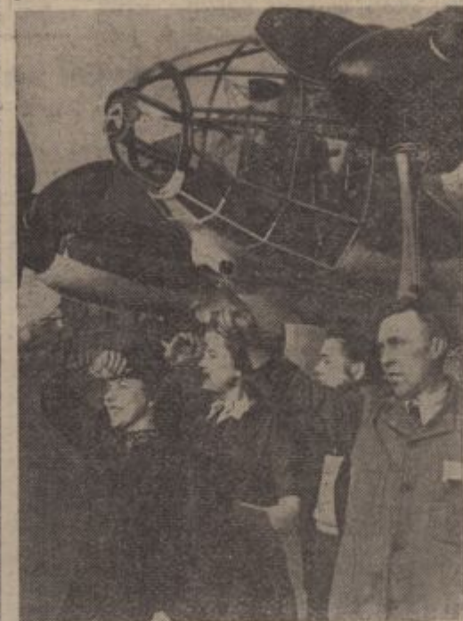
PK-Kriegsbericht Stempka (PBZ — Sch).

Nemčija in Italija nista povezani samo vojno-politično, temveč v veliki meri tudi vojno-gospodarsko. To se zrcali tudi iz zadnje izdaje ita-