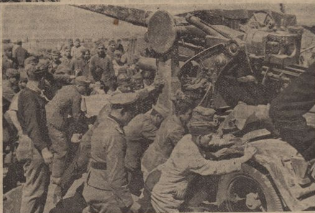
PK.-Kriegsbericht Götzenberger-Atl. (Sch)

Ist der Zerstörer nicht auf Feindfahrt und liegt nur in Bereitschaft, sind die 24 Stunden eines jeden Tages im Borddienstplan genau eingeteilt. Dienst, Freizeit und die Essenszeiten wechseln einander ab, — Wie unser Bild zeigt, macht das Nähen und Stopfen in der warmen Frühlingssonne Spaß.