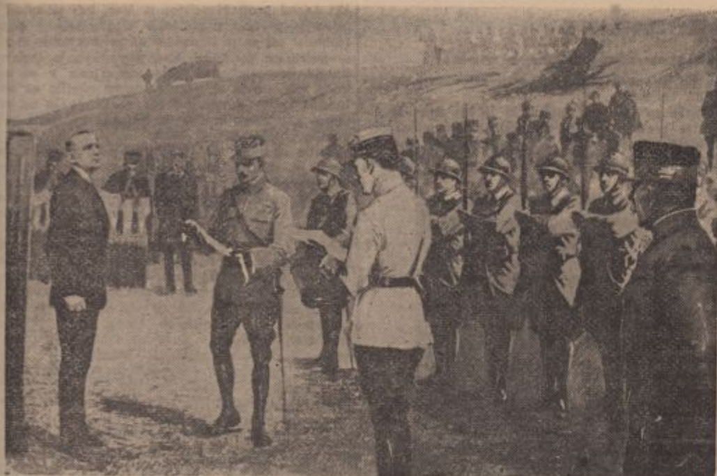
Zum 20. Todestag Albert Leo Schlageters

Am 26. Mai 1923 wurde der Vorkämpfer für die deutsche Freiheit, Albert Leo Schlageter, auf der Golzheimer Heide bei Düsseldorf von den Franzosen erschossen. Als die Franzosen wider alles Recht das Ruhrgebiet besetzten, war Schlageter einer der ersten, die den Widerstand organisierten. Durch Verrat der eigenen Landsleute gelang es den Franzosen, seiner habhaft zu werden, ihn zu verhaften und zum Tode zu verurteilen. Im unbestimmten Zwielicht zwischen Nacht und Tag des 26. Mai 1923 zerriß eine Salve die Stille der Golzheimer Heide. Albert Leo Schlageter war für Deutschland gefallen. — Unser Bild zeigt die Erschießung Schlageters auf der Golzheimer Heide — Zeichnung von Schwormstedt — Scherl-Bilderdienst-Autoflex