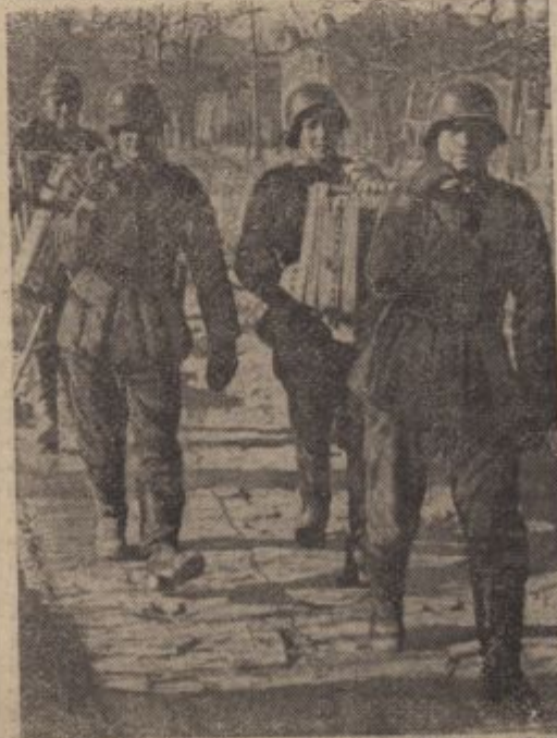
PK-Kriegsbericht Leopold (PBZ — Sch).

ki je ni nikdo branil. Bombardiranje Sicilije podčrtava strateško važnost tega otoka, ki je tudi del predtrdnjave Italije v Evropi, v Sredozemskem morju in je že v času Rimljanov igral veliko vlogo. Tega se dobro zavedajo Anglosasi, posebno Angleži, ki med prevažanjem svojih spremljiv iz Gibraltarja na Malto vedno hujše bombardirajo Sardinijo, da jim italijanske sile tega otoka ne bi uničile ladij. V tem je dokaz, kako velike važnosti je tudi ta otok ki je najmoderneje utrjen in pripravljen za vsak primer. Z eno besedo: Italija, ki jo smatrajo Angleži in Amerikanci morda za najbolj občutljivo in ranljivo točko v Evropi, je danes ravno tako trdo in dobro oborožena in utrjena, kakor je utrjena in nezavzetna francoska