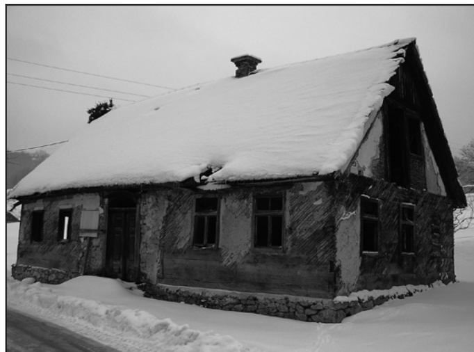
Slika 2: Rojstna hiša Avguština Stegenška z vhodnim portalom in napisno ploščo