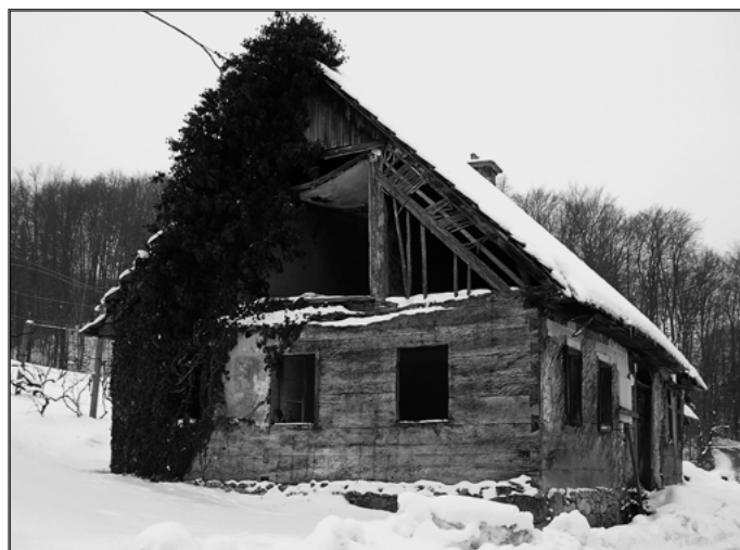
Slika 3: Severna stran Stegenškove rojstne hiše