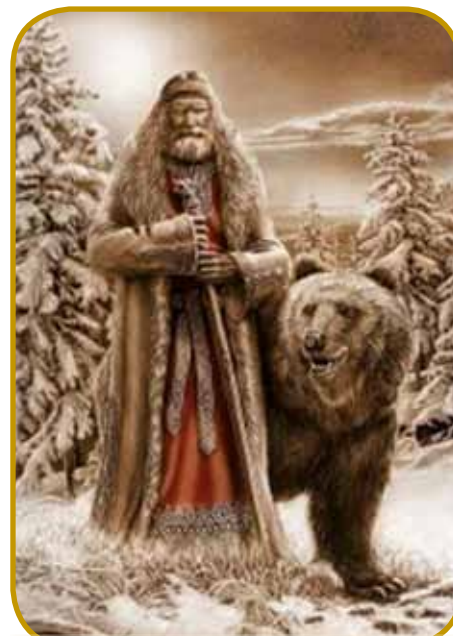
Volos je biu baug živali tö

je gorspisana pa zato od nje leko pripovedjamo. Skrak njegovoga svetišča so na zemlau kopja doj djali. Tak so bila sklajena, kak gnesden pragi na štrejki ležijo. Sedem so ji dojdjali. Bejli konj je tak mogo prejk nji titi, ka se je v nienoga nej opotekno, ga je nej geno. Gda se je takše zgodilo, se je bojna začnila, Volos tak šké, so si brodili, gvüşno, ka ji zbije mo. Če pa je v stero s kopitom brsno, so tak razmeli, ka baug bojne neške, aj na bitje dejo. Bojna je njegovoga žlata bila, ka ranč za Volosa vala, ka nej nikoga emo, nej žene, mlajšov tö nej. Njegvi »mlajši« gnesden eške živejo. Na, pripovedjamo od toga, ka je za njim ostano lo pa eške gnesden živé. Nej samo ena vej Velesevo v