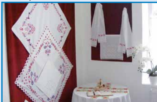
Razstava ročnih del