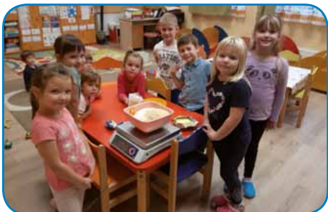
Sestavine za bučne kroglice

buč lahko naredimo različne sladice, pire in tudi razne druge dobrote. Ena od vzgojiteljic je v vrtec prinesla še veliko bučo Hokaido. Otroci so jo očistili tako, da so ji odstranili semena. Nato smo sladko bučino meso spekli v pečici in otroci so iz nje-