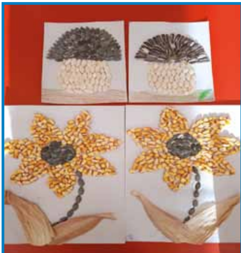
Izdelki iz semen. Naredili otroci iz Vrtca Gornji Senik

Zapisala in fotografirala Andreja Serdt Maučec