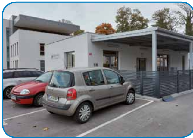
Na mesti stare zidine nekdešnjega špitála sta zrasli dve nauvi zidini

Nej dugo toga nazaj, ob svetovnom dnevi vida in 15. oktobri, mednarodnom dnevi beloga bota, je MDSS Murska Sobota v sodelovanji z Lions klubi Murska Sobota, Gornja Radgona, Lendava in Ljutomer pripravilo kulturno-rekreativni in družabni večer ob vrtnom kegljanji pod geslom Skupaj zmoremo. Na té način so prvo paut predstavili svoje nauve prostore. Na Ulici arhitekta Novaka sta v slabom leti namesto ene zrasli dve zidini, vekša, v steroy ma sedež slovenski tau firme MOL, menša pa je drugi dom slepih in slabovidnih lidi iz krajine ob Muri. Prejšnji društveni prostori so meli 130 kvadratnih metrov površine, nauvi jih majo okauli 300, ške bole fontoško pa je tau, ka so nej v tretjom