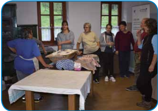
Tau je bila šesta delavnica, stero je v okviru projekta Ethos land pripravila Razvojna agencija Slovenska krajina

delom spravlati. V okviru projekta, v sterom sodelüvle šest partnerov, polonje iz Slovenije in polonje iz Madžarske,