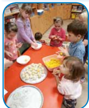
Slastne bučne kroglice, ki smo jih pavaljali v kokosu

povedali, da imajo doma bučna semena, bučno olje, da kdaj pa kdaj doma naredijo bučne pogače ali bučni kolač. Največkrat pa pri njih doma okusno