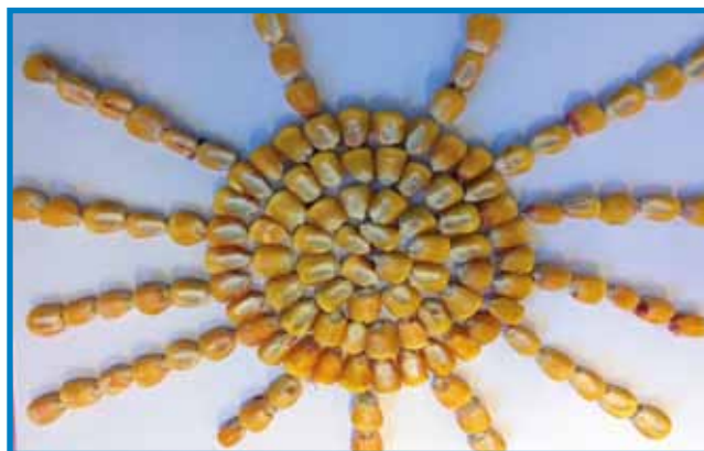
Sončece, sončece siješ lepo, z zlato barvo nam greješ nebo. Izdelek iz koruze. Vrtec Števanovci