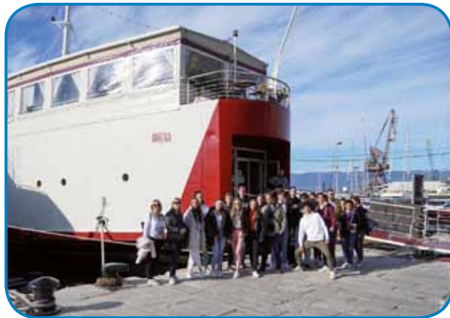
Namestili so nas v Botelu Marina, ki je hotel na ladji

Interreg najbolj popularna iniciativa, ki nam pomaga, če imamo start-up ideje. Toda bodoči ekonomisti, inženirji in voditelji si morajo biti na jasnem, da igra varstvo okol-