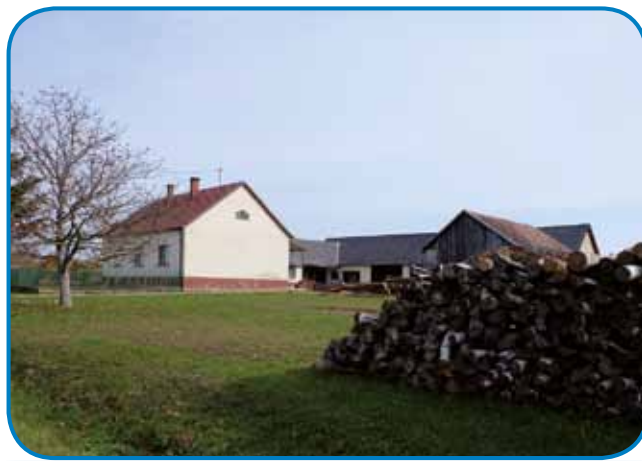
Vendel so - gda so ešče ladali - trno radi z drvami delali

»Zdaj že s traktorom, depa dja sem dosta delo s konjami tü, kak tøj v Števanovci, tak doma pri starišaj v Andovca. Depa tam je baukše