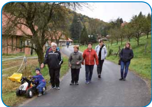
Šetali smo se od Hiše jabolk do rama Šandorja Labritza

smo mi steli najti deset takših lidi, steri bi se z dopolnilnim delom spravlati in bi svoje produkte odavali tüdi v naši bauti na vzorčni kmetiji. Na žalost smo jih zagnauk najšli samo pet. Med njimi je tüdi