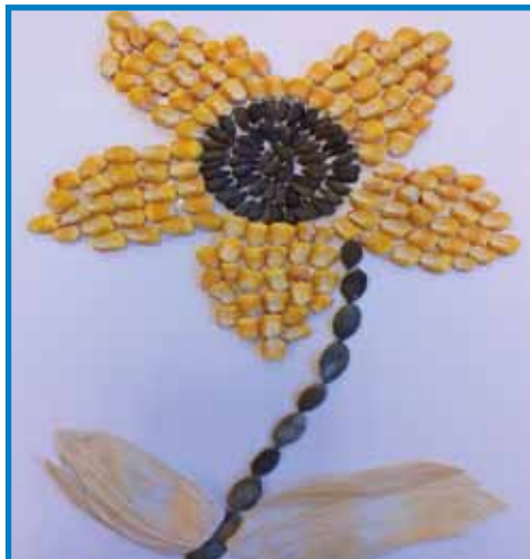
Sončnica. Izdelek iz semen. Vrtec Števanovci