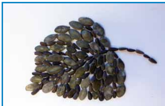
Lipov list. Simbol Slovenije. Naredili otroci iz Vrtca Števanovci