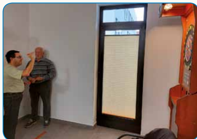
Srce jim pleše stran 6