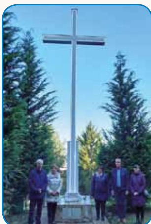
Obisk državnega sekretarja... stran 4