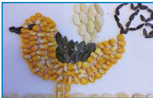
Zlata ptica. Izdelek iz semen. Naredili otroci iz Vrtca Števanovci