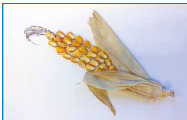
Koruzica. Vrtec Števanovci