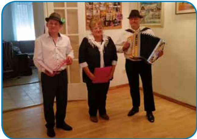
Skupina Taščica je na našom svetki naprajla veselo razpoloženje

Tresto oblejtnico je svetilo Slovensko društvo v Budimpešti 16. oktobra. Tau vi že mogli lani, pred ednom leti, samo ka zavolo epidemije je taostalo. Na te svetek smo pozvali KUD Taščica iz Rač pa pevski zbor Društva Triglav iz Subotice/Szabadka. Žau,