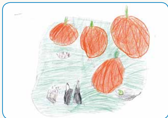
BUČIN PETEK V VRTCU GORNJI SENIK stran 7