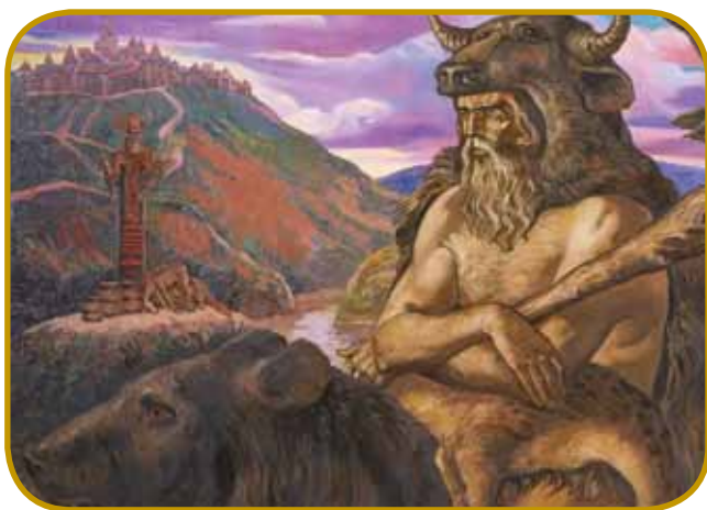
Volos ali Veles je sebe leko djau v kejp vuka, medveda ali drugi živali

Od Perüna smo pripovedali, ka je svetel baug biu. Leko bi tö prajli, ka pozitiven je biu. Gda od Volosa pripovedamo, tau ne moremo prajti. Baug svejta pod zemlov je kmičen, tak, kak pod zemlov kmični svejt živé. On je baug bogastva tö biu. Vejmo, bogatija dos-