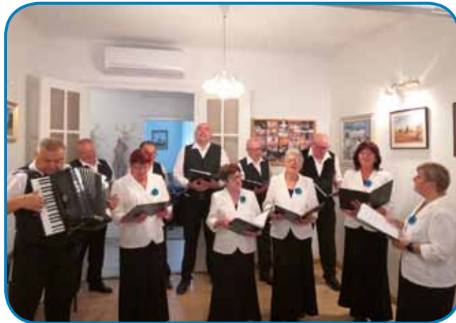
Naš zbor je tō vsigdar lepau spejvo, a zdaj tak, ka je vse štrmelo