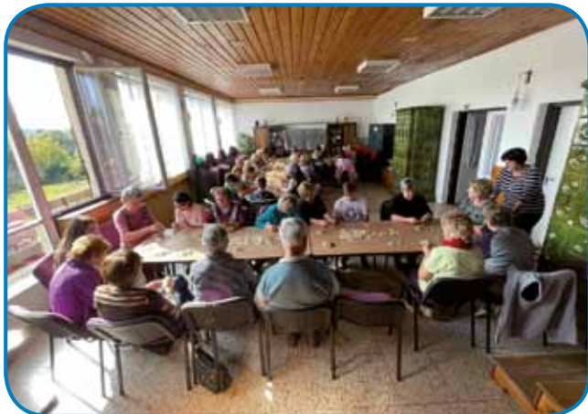
Števanovski kulturni daum smo lepau napunili vküper z mlajši pa lerenci

so nas postrašüvali, ka so sir gučali, ka so tü pa tam čare-lice vidli. Ali so prale v mlaki ali so nika v žepko klale pa taše. Dostakrat bilau, ka smo se malo bodjali domau titi,