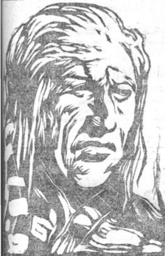
Naša slika predstavlja 105letnega velikega duhovnika solnčnega boga.

Kakor smo že nedavno pisali, bivajo na južnozahodnem ozemlju Zedinjenih držav tako zvani Pueblo-Indijanci, ki so izmed vseh Indijancev najmanj prosvetljeni. To plemo časti še svojega solnčnega boga, zvanega Manitu.