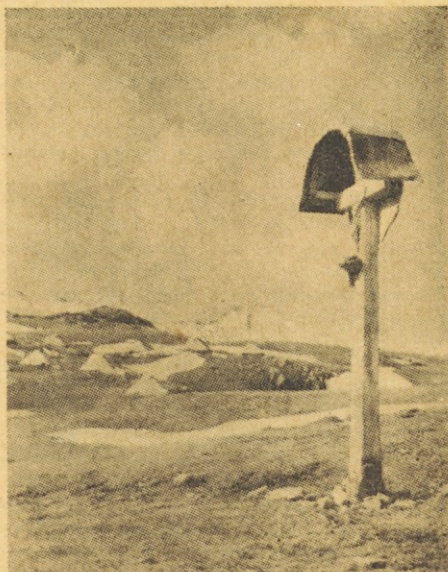
Na Veliki planini

Na tej stopnji marksistične razlage o nastanku vere so marksizmu prav prišle razne teorije o izvoru vere, o katerih govori primerjalno veroslovje. Primerjalno veroslovje skuša namreč na znanstven način preiskovati vere in dognati njih izvor. Je to veda, ki se razvija od srede preteklega stoletja. V njej so nastale razne smeri ali šole. Takšne šole so n. pr. mitološka, antropološka, sociološka in psihološka. Vsaka izmed njih pa se še deli na razne