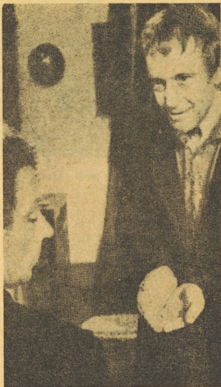
Pierre Fresney v vlogi cerkovnika Tomaža

Izdelava filma je čudovita. Fotografija je spretna igra luči s sencami tako, da človeka zajame vsega: Zdi se gle-