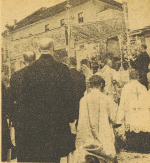
Prizor ob priliki blagoslova pri procesiji sv. Rešnjega Telesa leta 1941 v Ljubljani

Če gledamo in premišljujemo v naših časih strašno sovraštvo organiziranega brezboštva, preganjanje in mučenje zvestih vernikov, zapeljevanje in kvarjenje nedolžne mladine, na drugi strani pa silno duhovno zapuščenost in brezbriznost neštetih kristjanov, ki so bili v svetem krstu oprani z Jezusovo krvjo, pa žive življenje polno pregreh, daleč od Očetove hiše, dalje nezvestobo mnogih Gospodovih učencev, ki ga zapuščajo v njegovi stiski in izdajajo, prehajajoč v tabor njegovih sovražnikov, tedaj se nam s papežem Pijem XI. nehote vzbujajo misel, da se približujejo poslednji časi, napo-