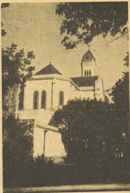
„Victor Martinez 50“ v Buenos Airesu, v ozadju cerkev sv. Julije

Ni čuda, da se danes vedno pogosteje čuje klic: Nazaj k družini, k nekdanji družini! Današnji človek, ki v trdi borbi za vsakdanji kruh tako lahko posurovi ter postane sebičen, neusmiljen in krut, hoče vsaj v družini najti toplo snezdo, kjer ni borbe, ni grdih in sovražnih pogledov, ni trdih in krivičnih besedi, ampak mir, ljubezen, umevanje. V družini postane človek nenadoma zopet ves dober in mehak, ljubezniv in velikodušen. Francoski pisatelj Maurois je zapisal stavek: „S tem, da delavci, študentje, rokodelci, umetniki in uradniki obojnega spola ob zaključku trdega dnevnega dela zopet smejo postati otroci, starši, dedje in tudi tete, ostanejo mladi, živahni, okretni. V nenehni