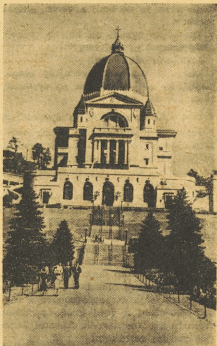
Veličastno svetišče sv. Jožefa v Montrealu, kamor radi romajo naši rojaki v Kanadi

„A ko so to slišali, da živi in da ga je ona videla, niso verjeli. Pozneje se je prikazal enajsterim, ko so bili pri