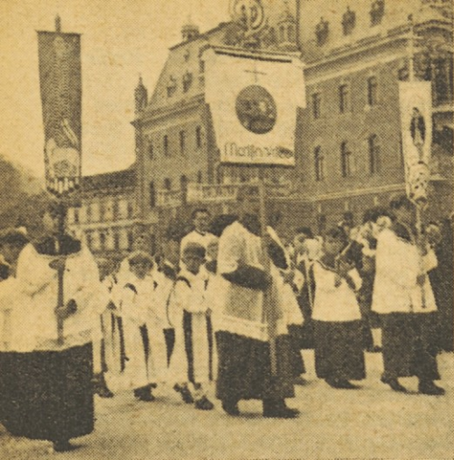
Procesija sv. Rešnjega Telesa se pomika po Kongresnem trgu v Ljubljani (leta 1941)