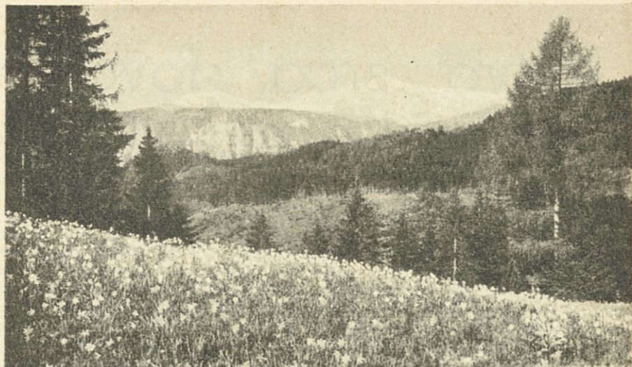
Narcisna polja pod Golico

Vlak drvi v noč, tisoče isker beži mimo oken kakor neugasli spomini . . .