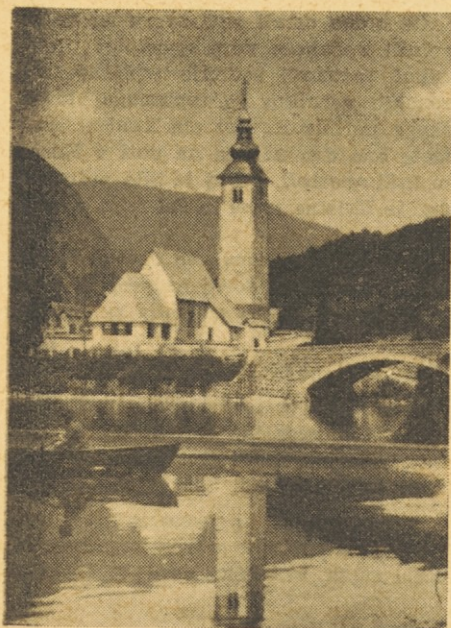
Sv. Janez ob Bohinjskem jezeru

Antikristovega kraljestva? Odgovarja Janez v Skrivnem Razodetju, da tam, kjer so prelomili in poteptali božji pečat in si uradno prilastili strašno geslo: „Nočemo, da nam ta vlada!“