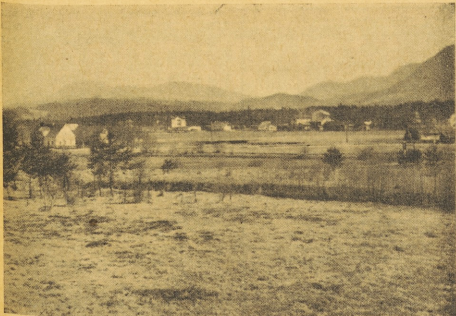
Kraj nesrečnega spomina — travnik padlih domobrancev pri Pliberku na Koroškem

Naslednji dan je vojaški kurat poročil mladi par v vetrinjski cerkvi.