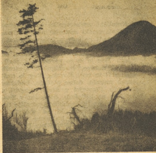
Triglav in Begunjščica s Kofc

Prvo vprašanje pa je, kaj sploh vera je. Glede tega se nekatoliški raziskovalci na daleč razhajajo. Že pred leti