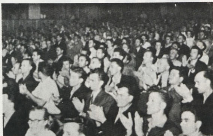
Delegati na prvem kongresu delavskih svetov junija 1957 v veliki dvorani doma sindikatov v Beogradu.

Namen izvolitve prvih DS je bil, da bi dosegli čimvišjo stopnjo demokratičnosti v proizvodnji in večjo angažiranost delavcev pri izpolnjevanju gospodarskih nalog.