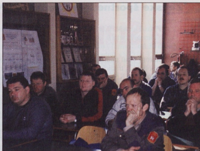
Člani sindikata so pozorno prisluhnili, kakšne pravice imajo po novem zakonu.