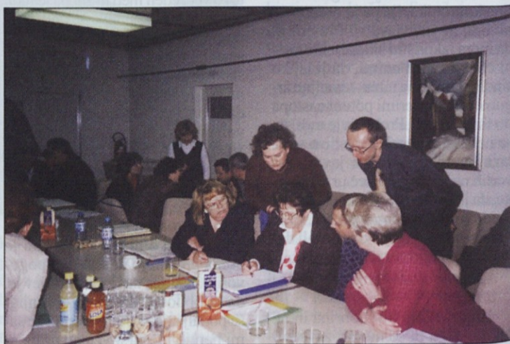
Takole so zaupniki v skupinah iskali rešitve za probleme, povezane z novim zakonom o delovnih razmerjih.

V zadnjem delu posveta so udeleženci, raz-