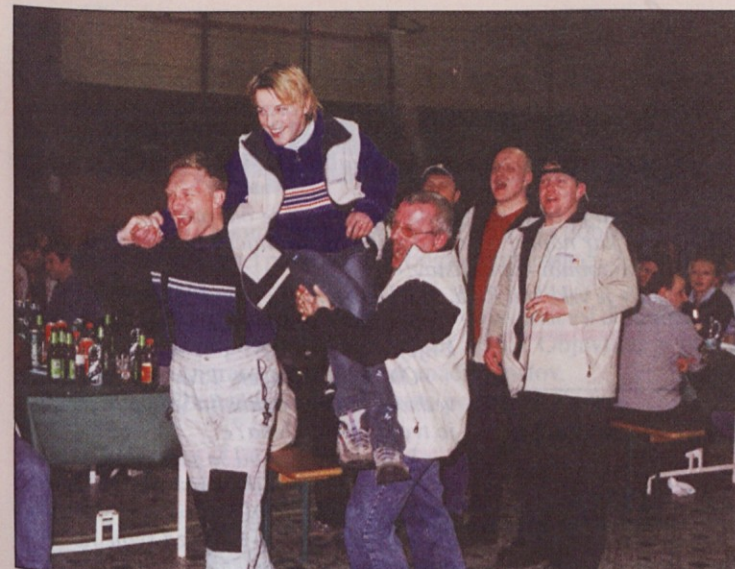
Zmagovalko med najmlajšimi so kolegi iz Juteksa prinesli na zmagovalni oder.