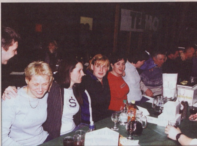
Korošci so bili na družabnem srečanju med najbolj živahnimi.

Vrstni red ekip: 1. Termo 961 točk, 2. Johnsons Controls NTU 609, 3. Novem 534, 4. Helios 421, 5. Sava Goodyear, 6. Juteks.