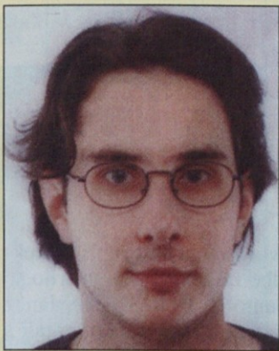
Piše: Jure Snoj, univ. dipl. ekon.

stotka BDP. Izgovarjanje na neugodne gospodarske razmere za tako visok proračunski primanjkljaj se ne zdi dovolj prepričljivo. Zmanjšanje le-tega z realnim zmanjšanjem delavskih plač pa sploh neljudsko.