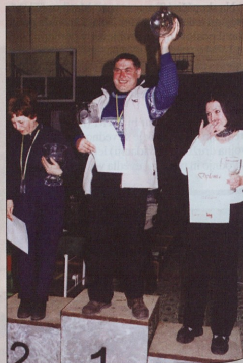
Predstavniki zmagovalnih ekip so bili najbolj zadovoljni.