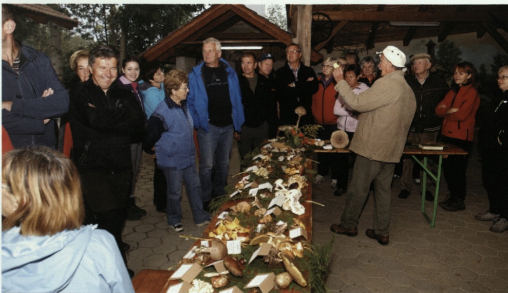
Razstava gob 2015