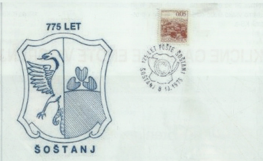
Ob 125 letnici Pošte Šoštanj je bil leta 1975 izdelan spominski žig

Danes je na pošti Šoštanj zaposlenih 15 delavcev, deset jih je v dostavi in 5 v manipulaciji. Ravno toliko je tudi dostavnih okrajev, kamor dostavljajo poštarji (vmes so bili pismošošte) pošto vsak dan, razen ob sobotah, ko je dostava na območju pošte Šoštanj samo v mestu (ožji okoliš) in to priporočene pošiljke.