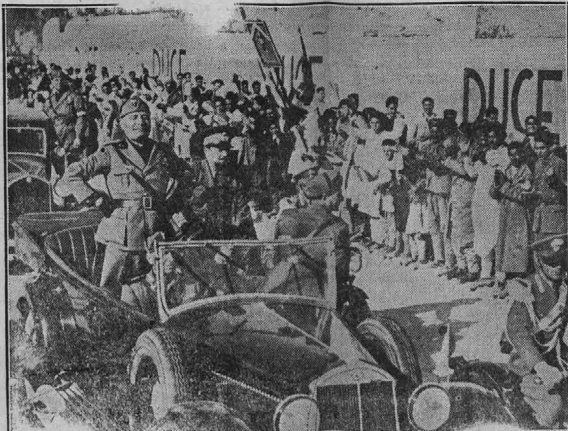
V pravi diktatorski pozi, kakor bi hotel pokazati, da mu celi svet leži pred nogami, vidimo na gornji sliki italijanskega Mussolinija, ko se je vozil po severoafriški italijanski koloniji Libiji in milostno sprejemal na znanje ovacije, ki so mu jih prirejali tamkajšnji domačini — prostovoljno ali prisiljeno, kdo ve?