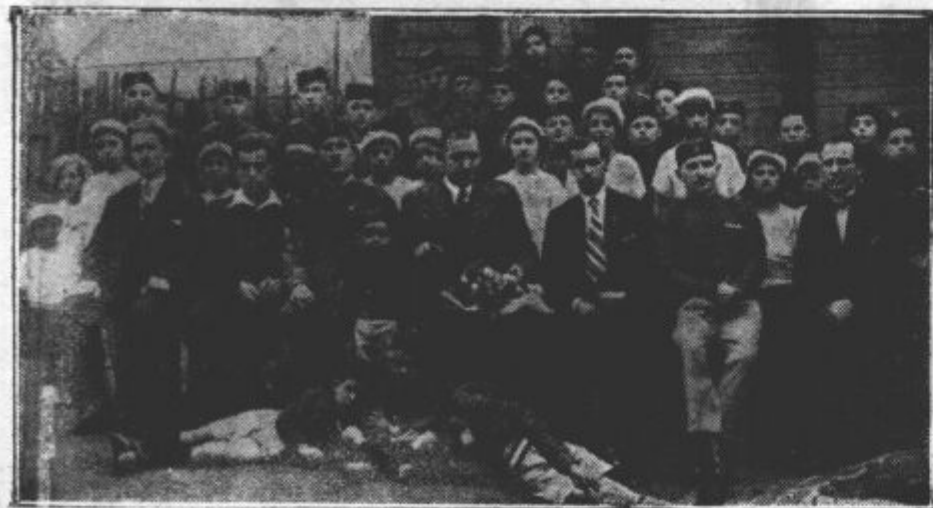
Naši učenci šole v Braganzi.