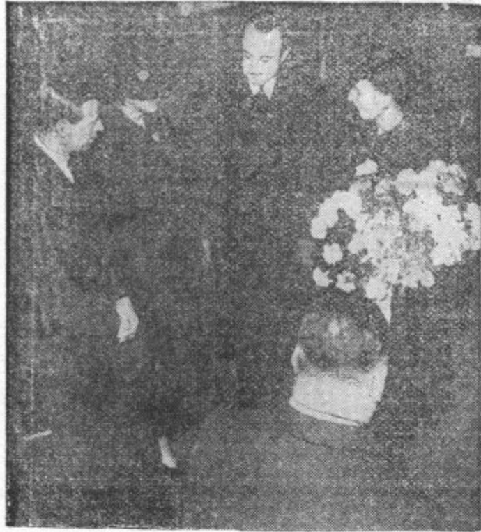
PRIHOD KNEZA-NAMESTNIKA V LONDON. Na kolodvoru Victoria v Londonu sta pričakovala in sprejela kneza-namestnika Pavla in njegovo soprogo Kentski vojvoda in vojvodinja