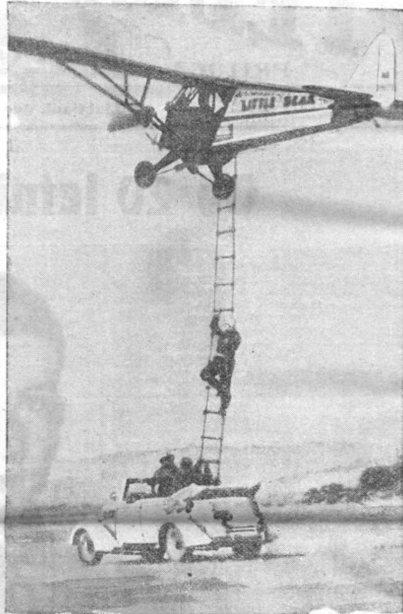
MED NEBOM IN ZEMLJO. V Lancastru (Združene države Amerike) je neko letalo ostalo več dni v zraku. Med poletom so menjali pilote na način, kakor prikazuje gornja slika