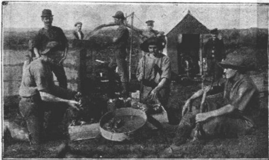
V Aucklandu v Novi Zelandiji imata brata Skansija iz Jugoslavije veliko podjetje. Tako pridobivajo in odbirajo naši vojaki kaurovo smoko na semljišču v Awanui severno od Aucklanda.