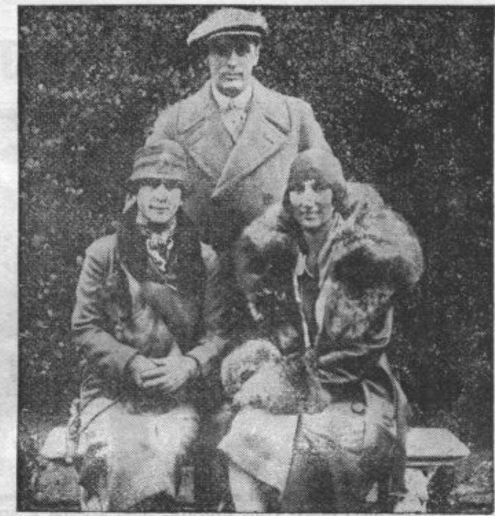
SMRT NORVEŠKE KRALJICE V LONDONU. Po uspešni operaciji slepiča je v Londonu nepričakovano umrla norveška kraljica Maud. Kraljico vidimo na gornji sliki s sinom, prestolonaslednikom Olafom in njegovo soprogo, princeso Marto