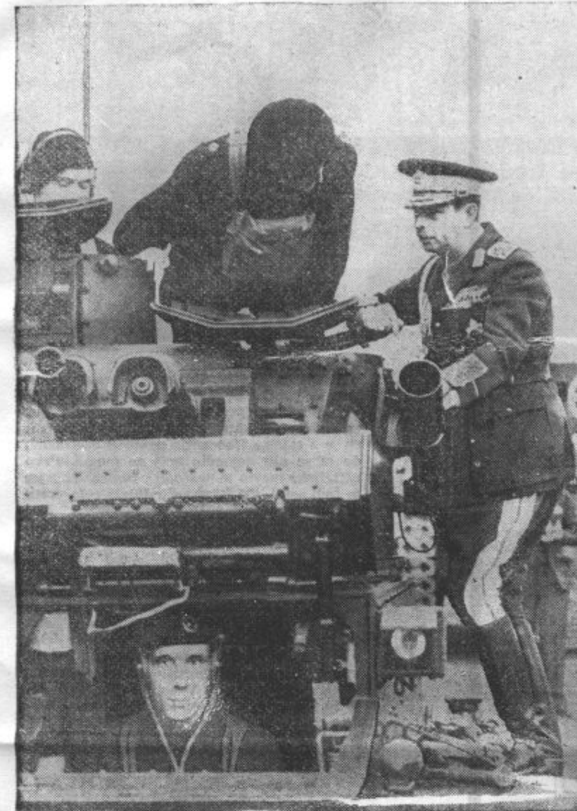
NA OBISKU V ANGLIJI si je rumunski kralj Karol ogledal tudi vojaške naprave v Aldershotu. Posebno so ga zanimali novi topovi