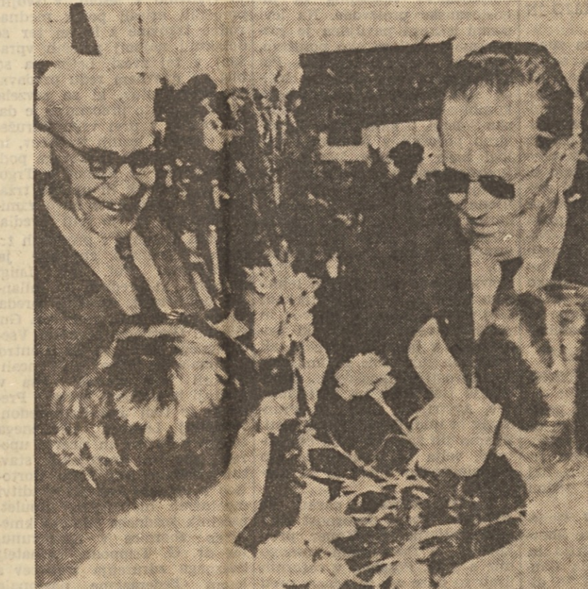
Prizor v Varšavi, ki je bratsko sprejela predsednika Tita in soprogo Jovanko (levo glavni tajnik Poljske združene delavske stranke). Pred začetkom razgovorov s poljskimi državniški si je Tito ogledal najraznejše industrijske obrate, med temi tudi ladjedelnice in železarski kombinat Nova Huta. Obiskal je tudi zgodovinsko mesto Krakov. Predsednik Tito in Gomulka sta na sestanku naglasila, da sta obe državi povezani v boju za mirnoobstoječo; borba za mir je korist vseh narodov. Predsednik Tito je izjavil, da je sedanja poljsko-nemška meja na Odrini Nisi nespremenljiva. Ta izjava je zbudila veliko pozornost zlasti v Zah. Nemčiji, ki se ne sme sprijazniti s to mejo. Zadnjih Titovim obiskom v tujni posveća evropski tisk izredno pozornost; poleg nemških so tudi italijanski listi posvetili Titovim pobudam za spravo med narodi vodne komentarje.

pisec je očitno svoje pero napolnil z veliko dozo optimizma ali pravzaprav naivnosti. Nanižan niti en primer v dolgotrajnem boju za premoč na severnem Jadranu, ko bi Benetke bile pripravljene pomagati Trstu in njegovemu pomorstvu. Navadno je bilo prav nasprotno! Sicer pisec proti koncu svojega članka nekako vstopa v usodo pripomočnja, da se razvija promet čez Benetkino morje. Zdi se, da mora biti Italija v leto 1965 v razmerju kupne moči, kakor ugotavlja avtor, mnogo bolj naravna kakor Benetka. Za namo so časi, ko je tržaški promet zdaleč prekašal benetškega.