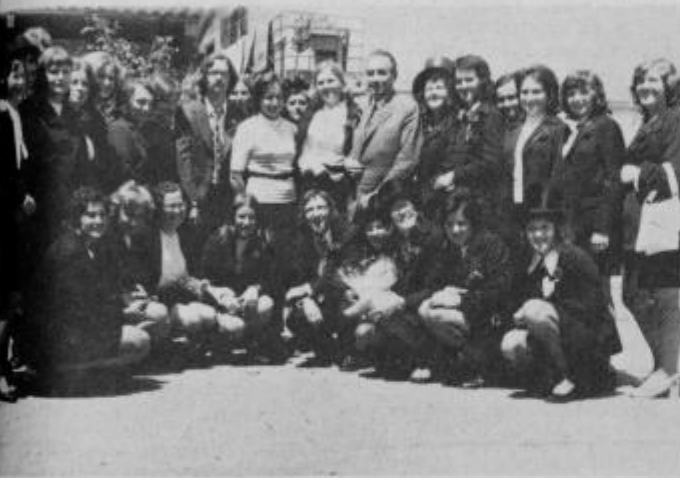
Spominski posnetek maturantov s svojo razredničarko in ravnateljem.