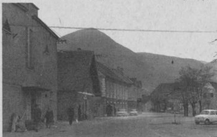
Poljčane pred svojim praznikom.

Tako je bil v nedeljo, 11. junija 1972 dopoldne občni zbor ZB NOV Poljčane, za tem pa so se udeleženci občnega zbora in številni prebivalci tega kraja zbrali pred spomenikom NOB v središču Poljčan, kjer je o pomenu krajevnega praznika spregovoril predsednik krajevne skupnosti. V kulturnem programu so sodelovali godba na pihala iz Poljčan,