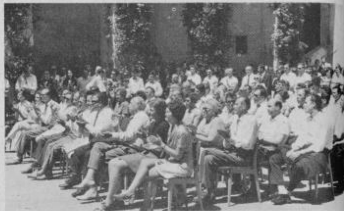
Tradicionalne revije zborov na ormoškem grajskem dvorišču pritegujejo vedno več obiskovalcev

Organizacijo te vsakoletne revije zborov je tudi letos prevzel občinski svet zveze kulturno prosvetne organizacij Ormož skupaj z občinskim svetom ZKPO Maribor. Dobra organizacija srečanja je nedvomno pripomogla k temu, da so takšni nastopi postali v Ormožu tradicija. Zbori so se srečevali že pred tem. Revije so bile po raznih krajih, vendar se nikjer niso obdržale. Ko so zbori pred tremi leti prvič nastopili v Ormožu, se je organizator tako močno potrudil,