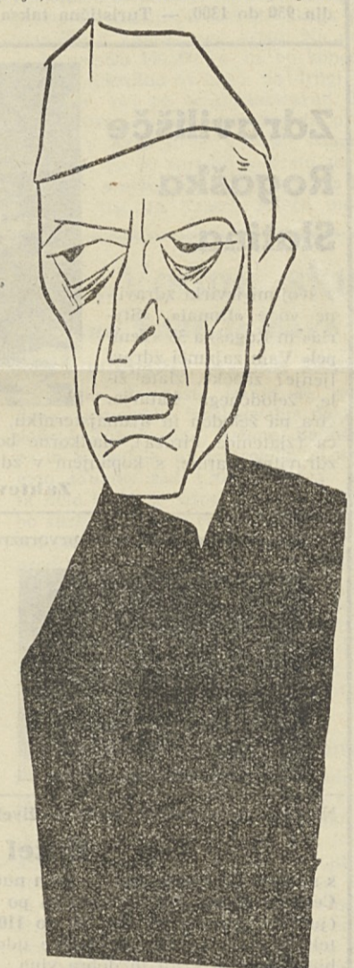
Ghandijev naslednik Pandit Nehru