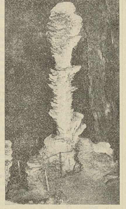
Eden izmed kapnikov v jami