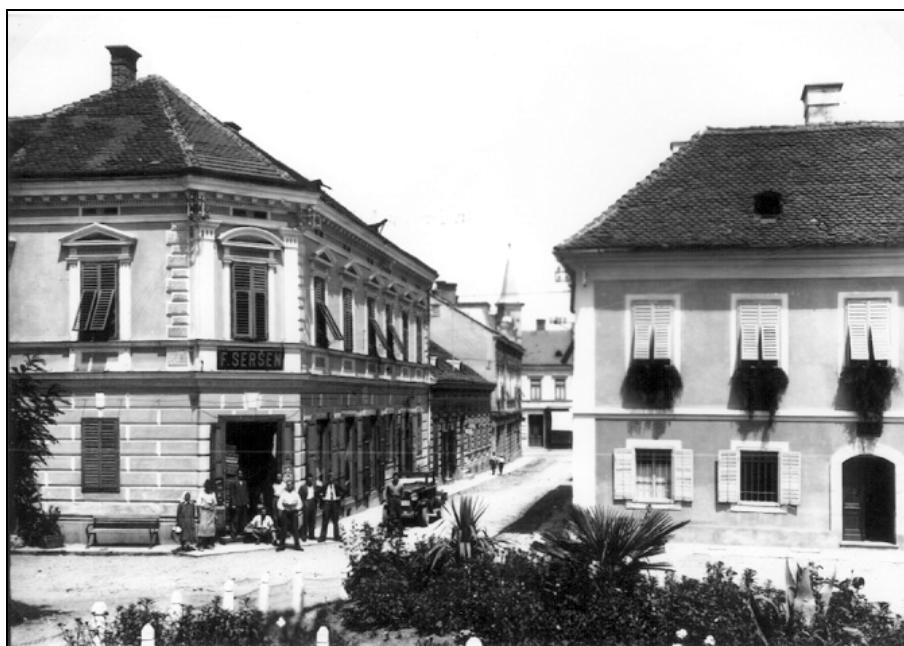
Na levi strani je Seršenova hiša. V njej je bila čitalnica od leta 1878. Danes ima hiša naslov Miklošičev trg 6.

poslanca v deželni zbor v Gradcu ter ustanovitev okrajne posojilnice 1872. leta. Politično društvo naj bi skrbelo za širše narodne interese Slovencev s političnim delom in prizadevanjem za izvolitev slovenskih ali Slovcem naklonjenih predstavnikov. Društvo naj bi bilo nujno potrebno, ker se čitalnica kot kulturno društvo javno ni mogla ukvarjati s političnimi vprašanji, saj je to presegalo okvir njenega delovanja. 42