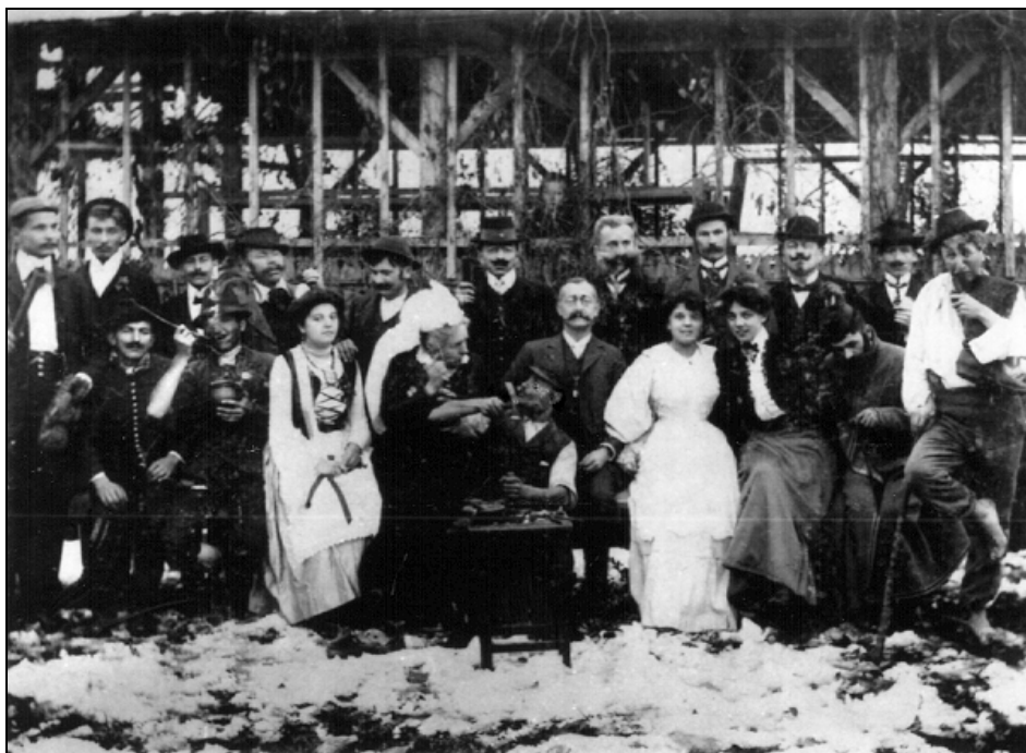
Gledališki odsek čitalnice med igro Deseti brat leta 1904.