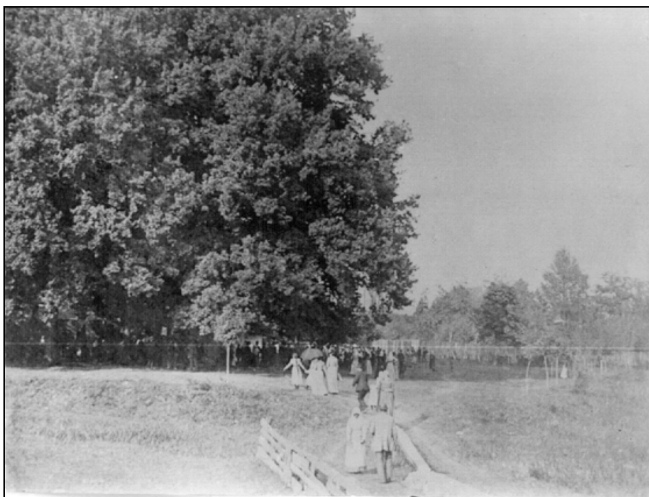
Slomškova slavnost v Ljutomeru 2. septembra 1900 v Seršenovem logu. Danes je to park 1. slovenskega tabora.

sko veselico z moškim in mešanim zborom pevskega društva in godbo. Kupili so zložljivi oder za pevske prireditve in veselice ter notne zvezke za pevsko društvo. Na Silvestrovo 1899 je čitalnica priredila veliko veselico z bogatim kulturnim programom, ob pustu pa veselico s plesom in gledališko igro "Berite novice". Ves prihodek so namenili za dejavnost knjižnice bralnega društva.