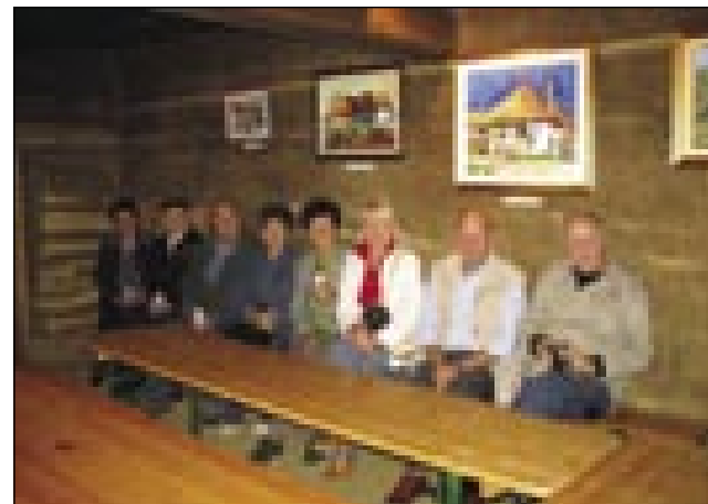
Slikari v slovenskoj izi

Ka bi lüstvo nej lačno ostalo, so Romkinje v veukom šatori ciganjsko gesti küjale pa pek-le. Mele so kapüsto z več fele