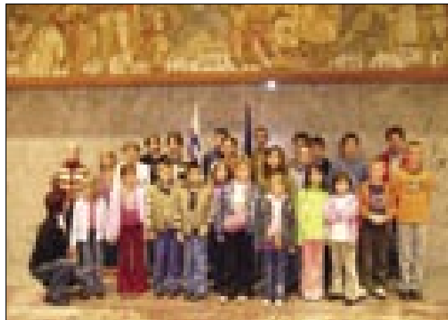
V slovenskem parlamentu

7. septembra 2007 zjutraj ob pokazal obnovljeno stavbo. pol osmih so se števanovski Videli smo lepe freske, na ka-