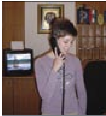
Lilla na recepciji hotela Lipa

ni samo dvigovanje telefona, ampak pisanje računov, ko gostje iz hotela odhajajo in plačajo svoj račun. Spomnim se, ko sem imela približno deset odhajajočih gostov in sem morala istočasno pisati račun na računalniku, paziti na plačeva-