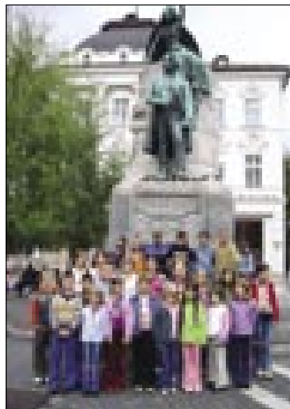
Pri spomeniku Franceta Prešerna v Ljubljani

terih smo lahko spoznali naselitev Slovencev in slovensko zgodovino. Za spomin smo