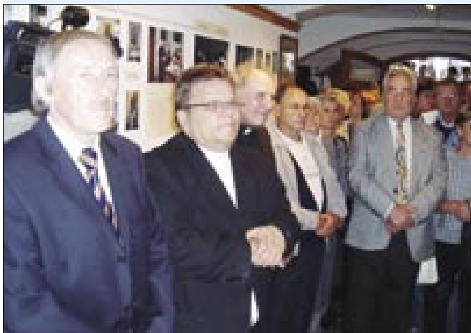
Spominsko razstavo si leko poglednate na starom farofi

uni mrgējo, z njimi vred mrgē slovenska rejč na Gorenjom Seniki.