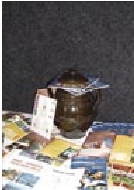
Nekaj prospektov in prazno ozadje - to je Porabje?

rabjem, sta se priključila projektu kot začetek baročne poti, ki vodi po državi in ima 10 postaj. ( Keszthely - Feštetičev dvorec, Tihany - benediktinski samostan, Veszprém - nadškofova palača, Székesfehérvár - stolna cerkev, Zirc - opatija, Pápa - Esterházyjev