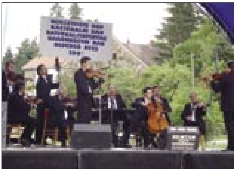
Romski ansambel Savaria

nemški pa rovački mlajši iz sombotelski vtrcov. Vej pa so vsi stariške najgir na svojo deco. Te dvej manjšine tō dosta dajo na tau, ka bi se mlajši s kem prva začnili včiti gezik svoji starišov. Za mené je