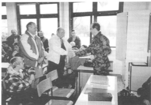
Na sliki: Litijski veterani in častniki v vojašnici Bohinjska Bela

Udeleženci so se odpravili proti Gorenjski, kjer so se prvič ustavili v vojašnici Bohinjska Bela. Tam so jih sprejeli in pozdravili poveljnik 33. območnega poveljstva Slovenske