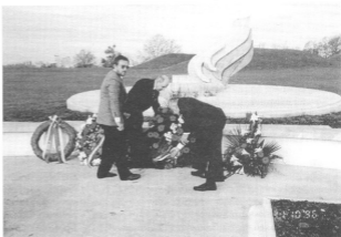
Na sliki: Polaganje venca

Po petih letih znage nad JA in obranitve referendumске