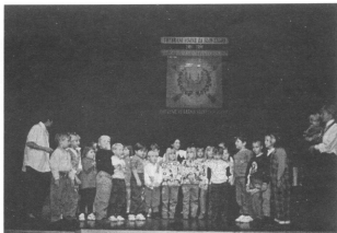
Na sliki: Svobodni 5-letni malčki