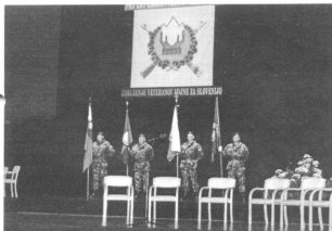
Na sliki: Praporščaki