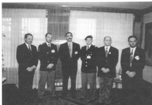
Na sliki : Člani delegacij ZVVS in Sever na sprejemu pri predsedniku DZ RS

pravičnost naše naravnosti v neustrankarstvo ter odprtost za vse, ki so v obdobju 90-91 delovali za dobro Slovenije in slovenstva.