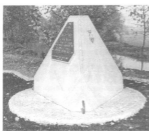
Na sliki: Spominsko obeležje na Prilipah

Med gosti pa je spregovoril tudi g. Albin Gutman /citirano/... Ko so v topli junjski noči leta 91 na trgu pred slovenskim parlamentom ob razglasitvi dolgo pričakovane neodvisnosti in ob slavnostnem postroju pripadnikov Teritorialne obrambe in tisočglavi množici dvigali slovensko zastavo, nihče niti slutil ni, da bo že čez nekaj ur hromenje tankovskih gosencin naznanilo obdobje vojne. In še predno se je poleglo praznično navdušenje, je bila komaj rojena država