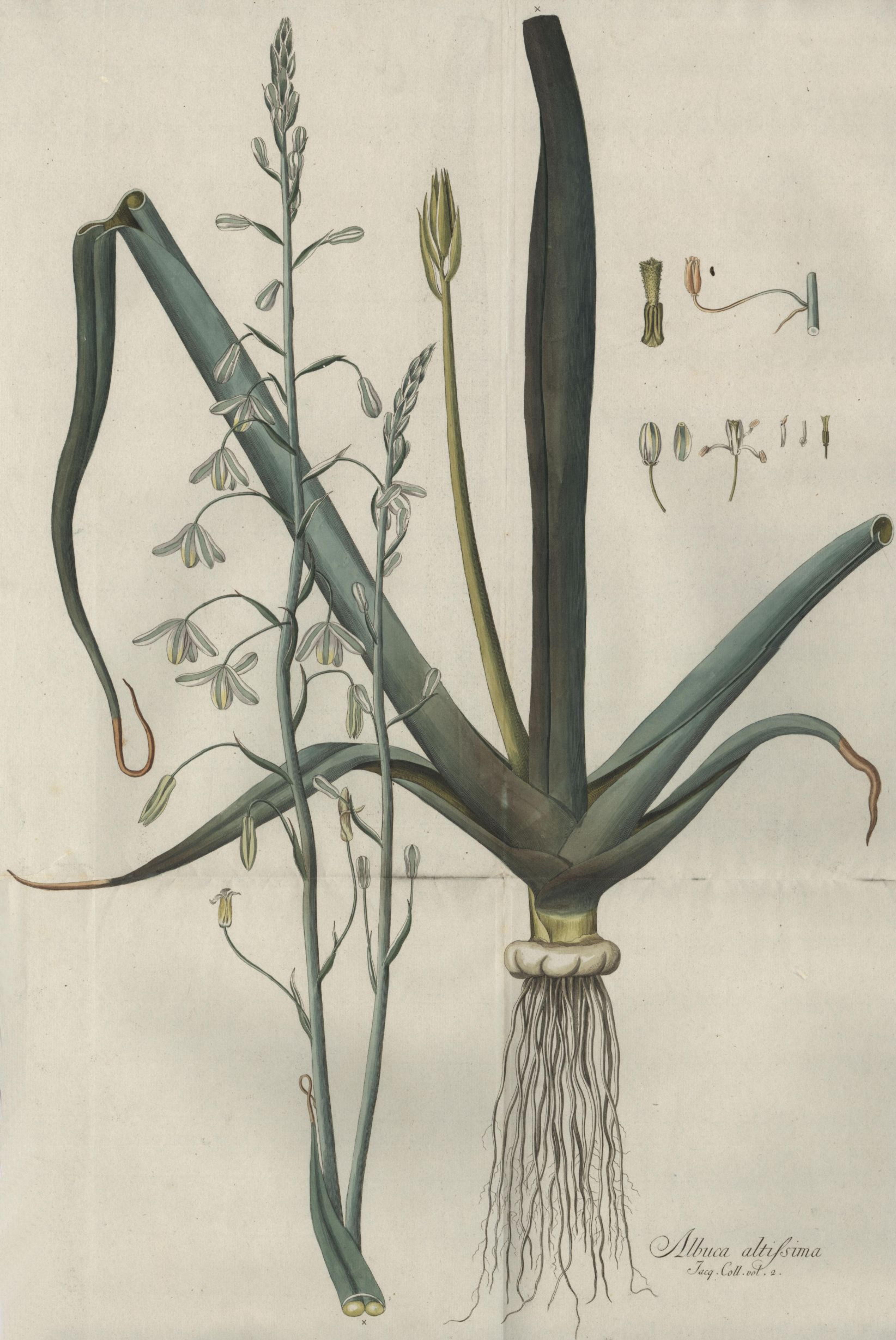
Albuca altissima Jacq. Coll. vol. 2.