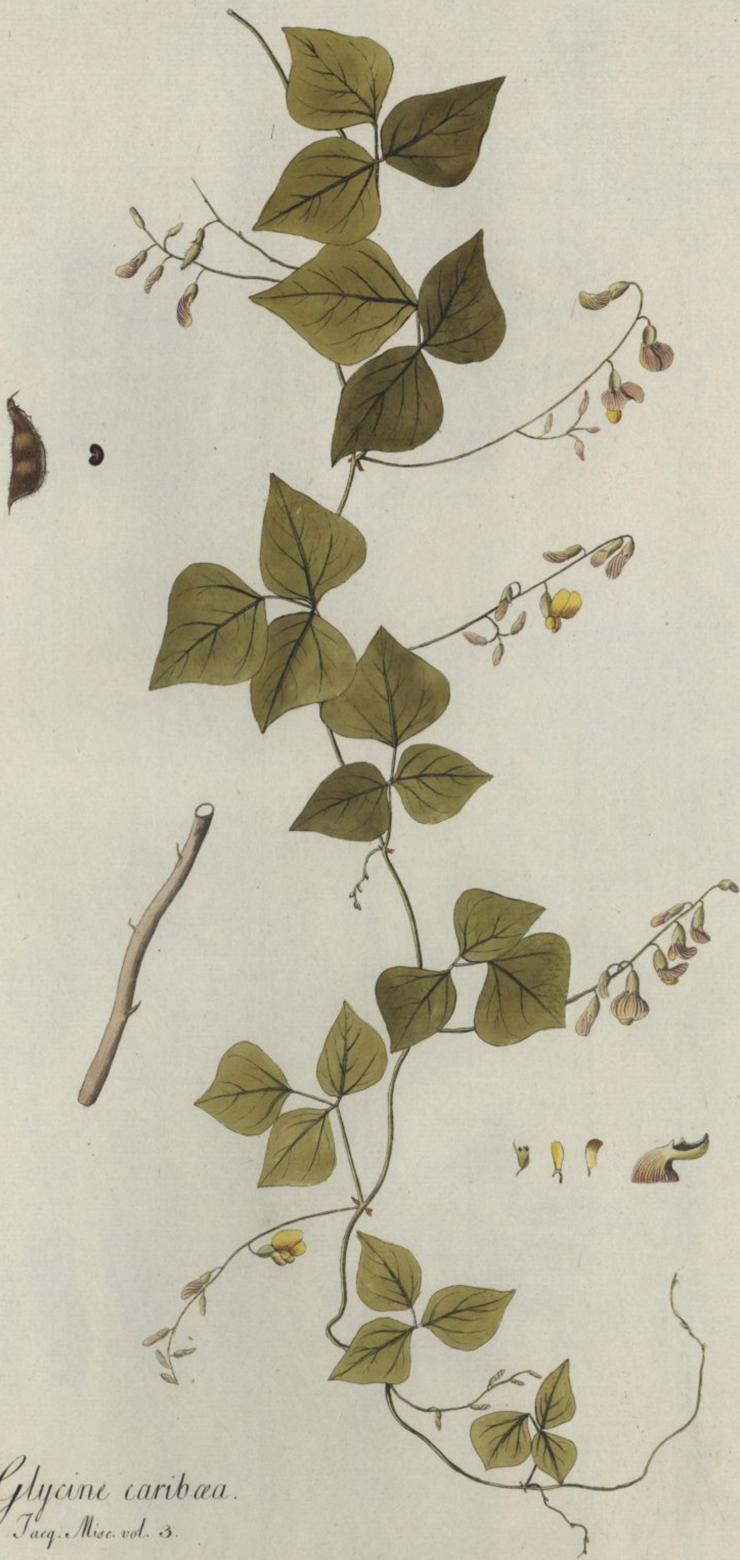
Glycine caribaea. Jacq. Misc. vol. 3.