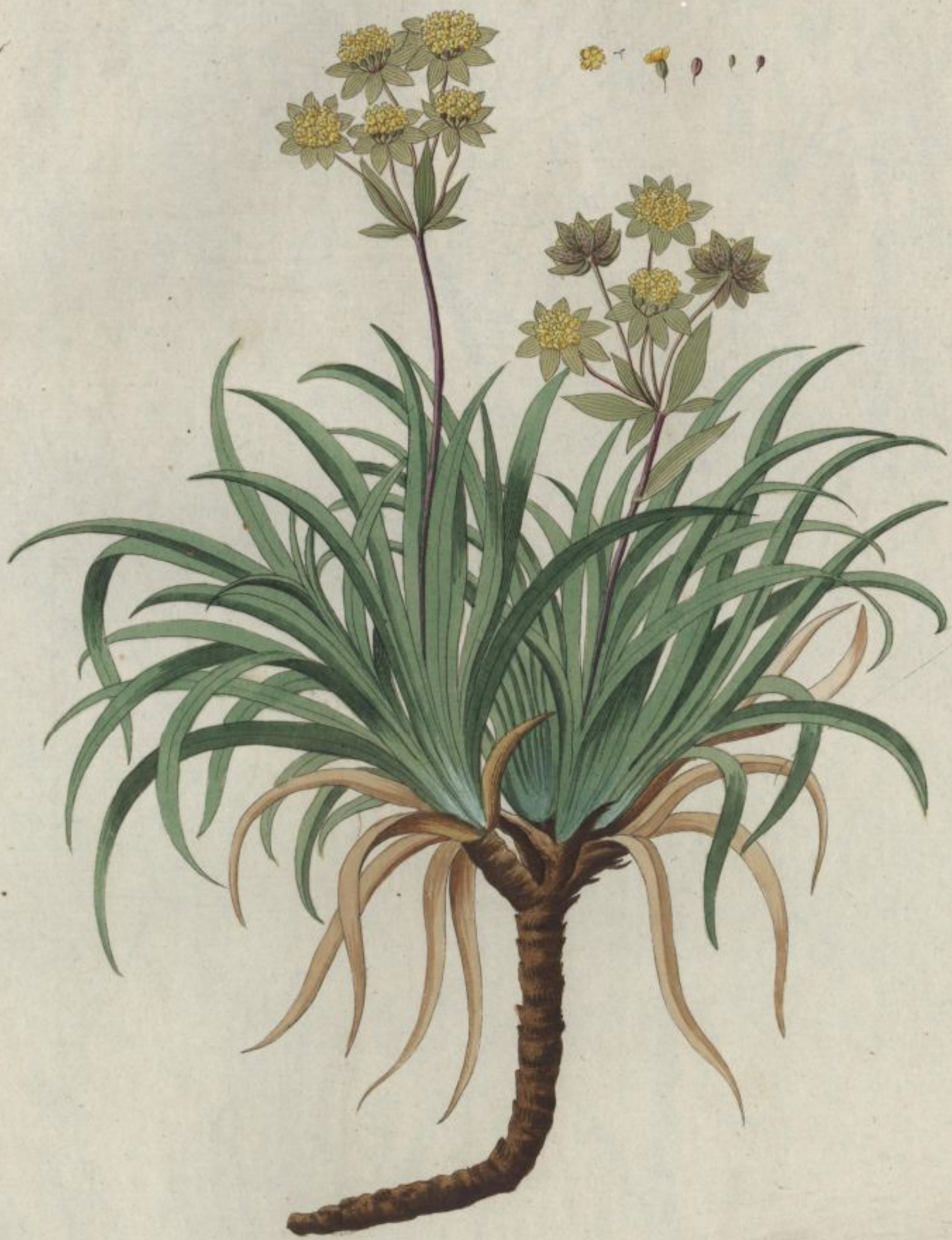
Bupleurum petraeum. Jacq. Coll. vol. 1.