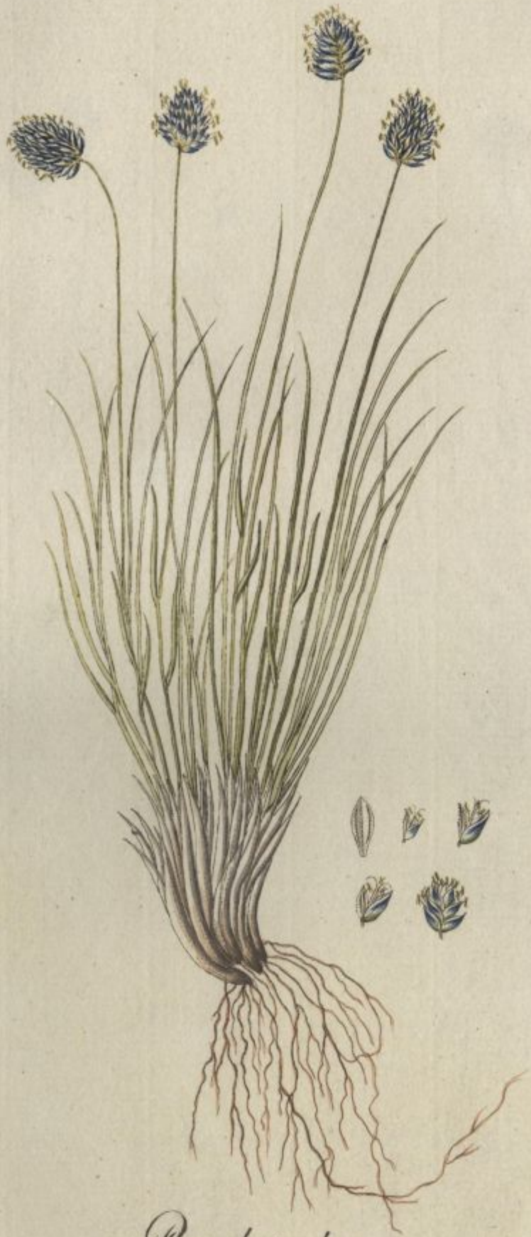
Poa disticha. jacq. Misc. vol. 2.