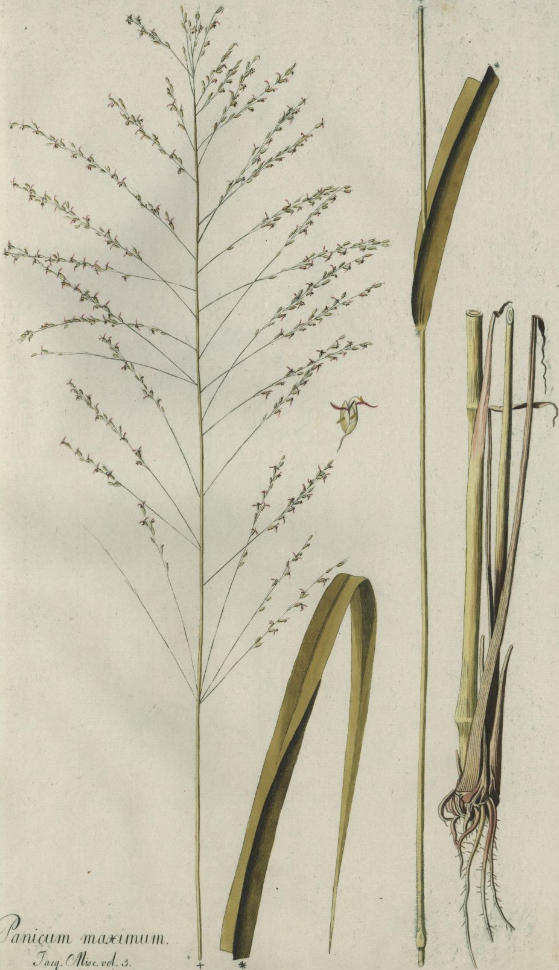
Panicum maximum. Jacq. Misc. vol. 3.