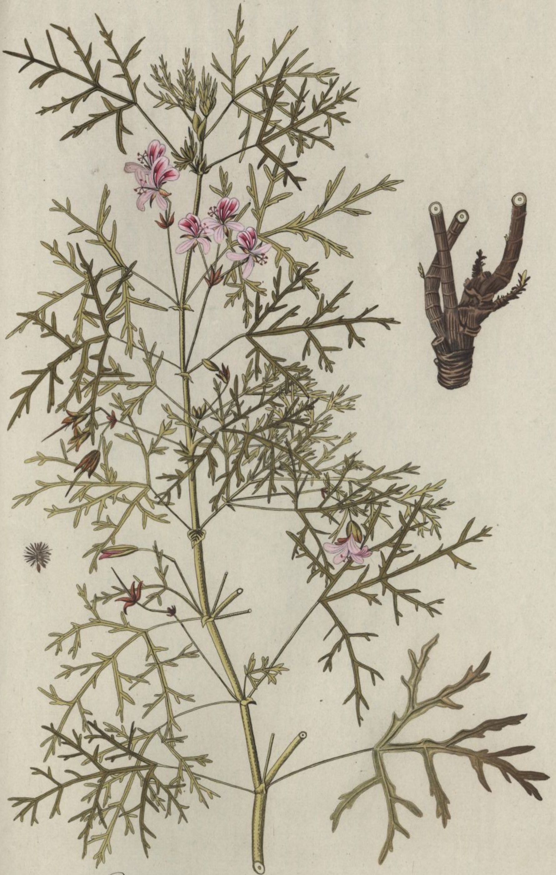
Geranium revolutum. Jacq. Misc. vol. 3.