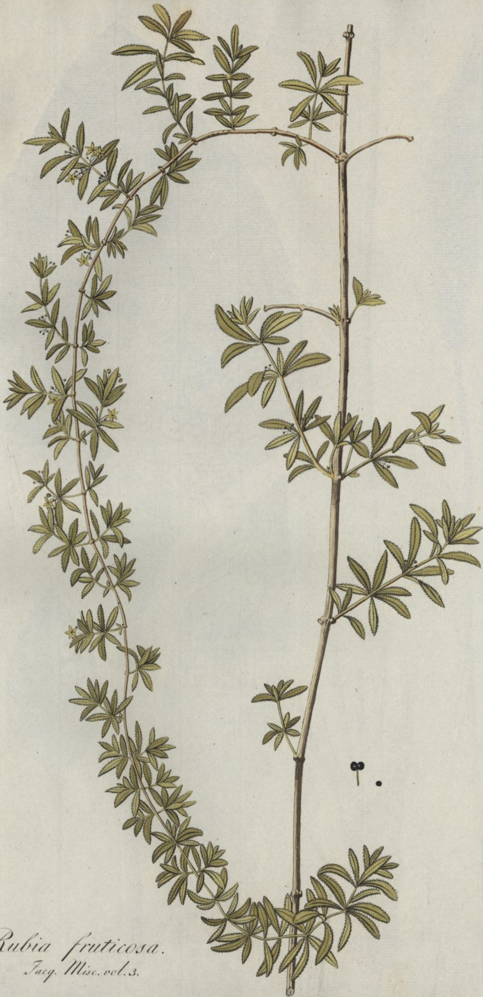
Rubia fruticosa. Jacq. Misc. vol. 3.