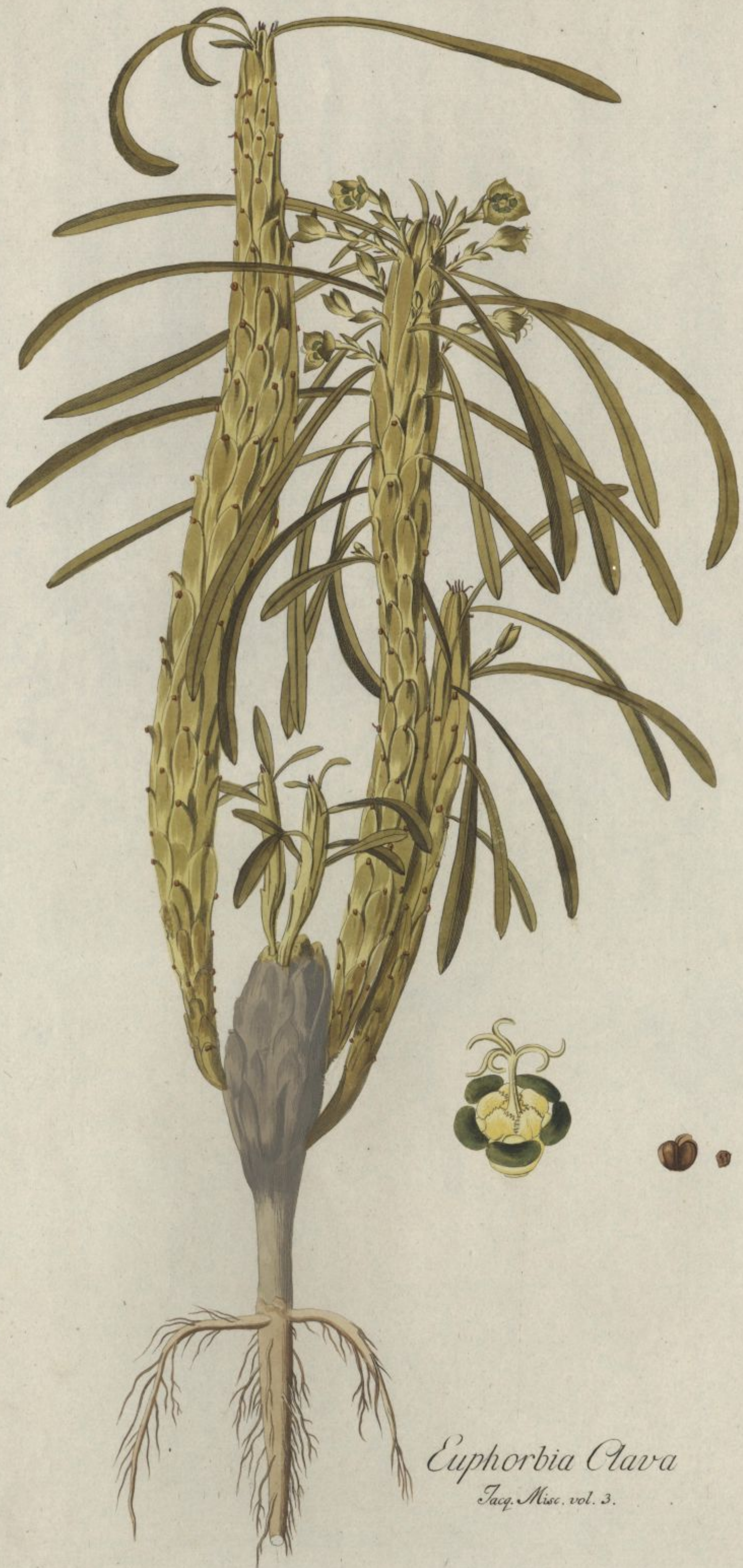
Euphorbia Clava Jacq. Misc. vol. 3.