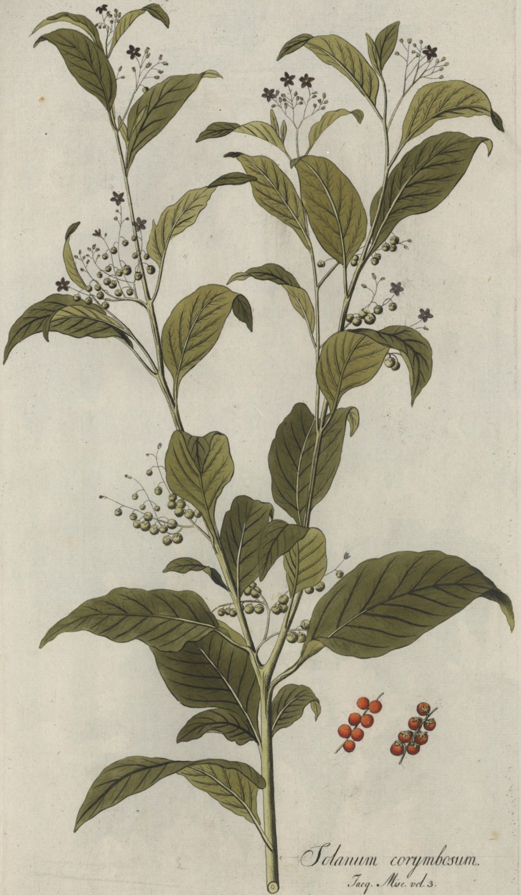
Solanum corymbesum. Jacq. Misc. vol. 3.