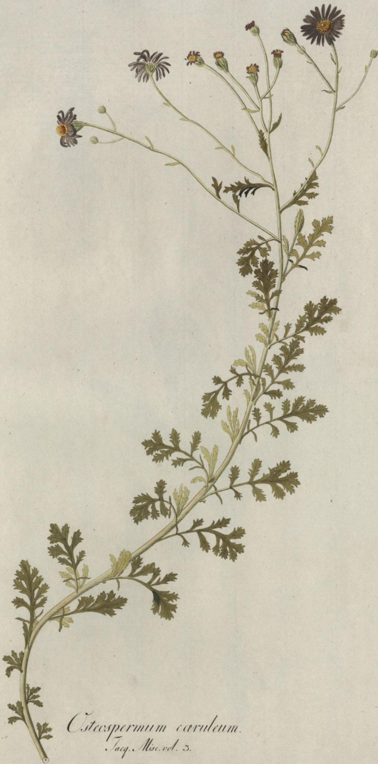
Osteospermum caruleum. Jacq. Misc. vol. 5.