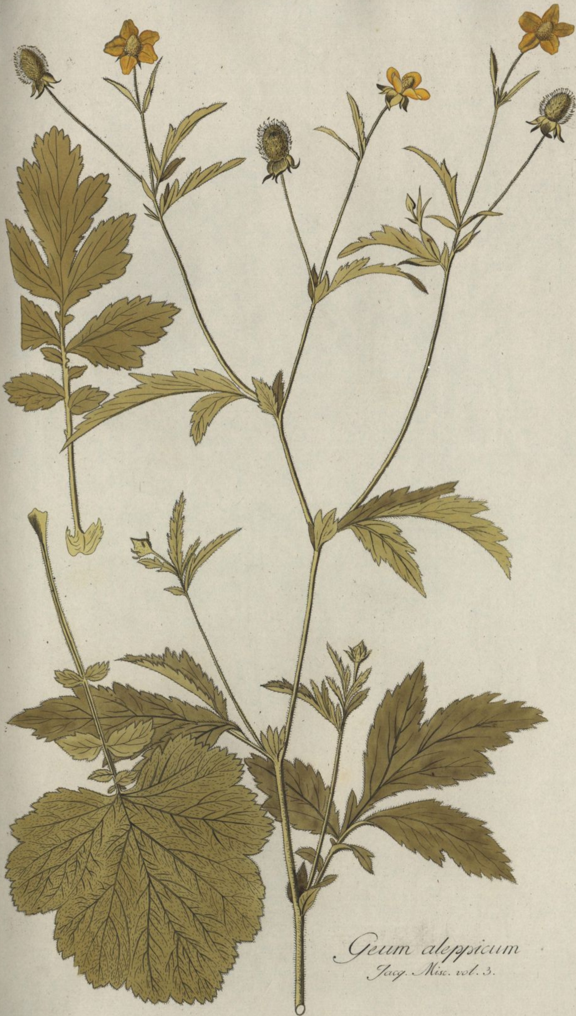
Geum aleppicum Jacq. Misc. vol. 3.