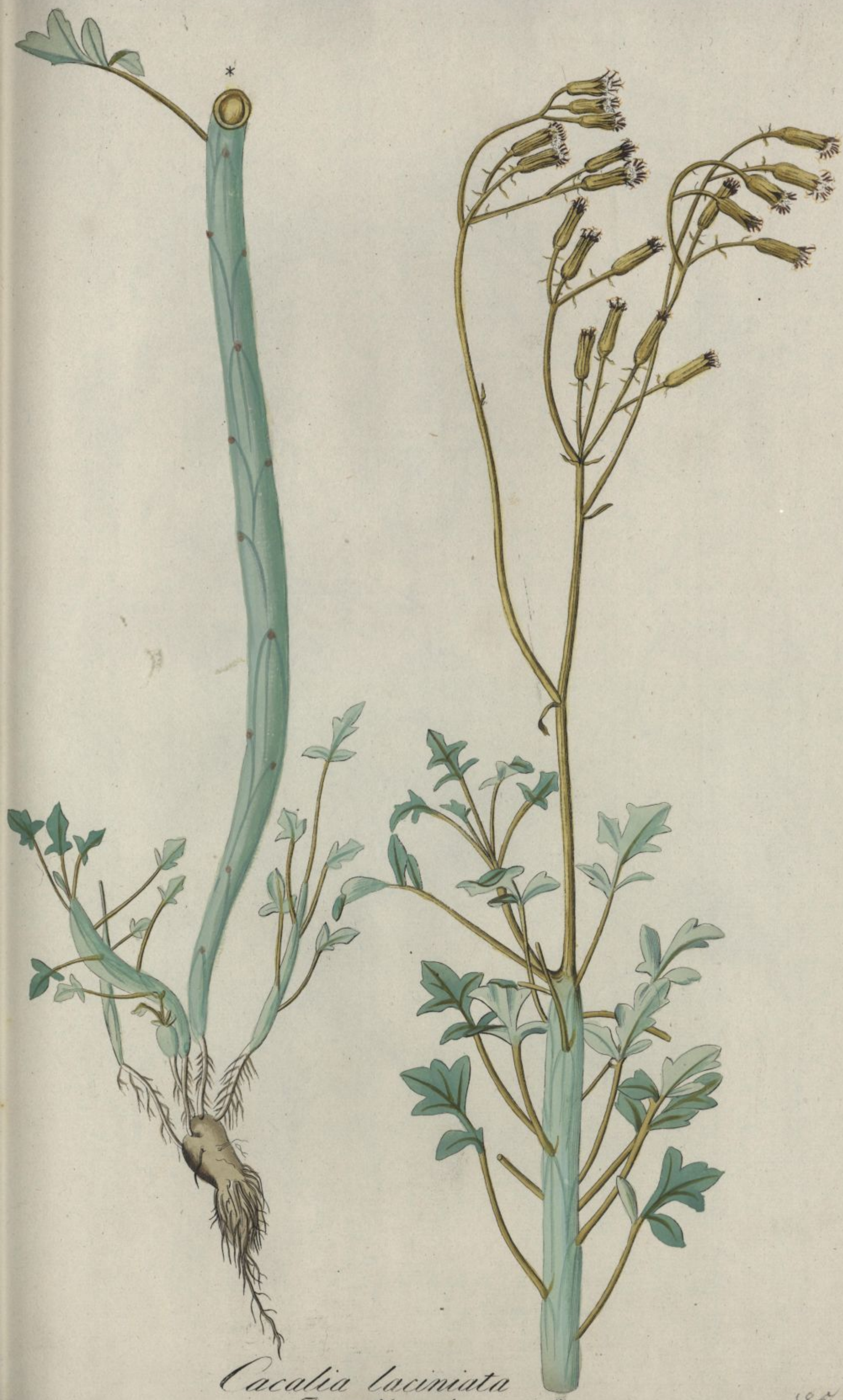
Cacalia laciniata Jacq. Misc. vol. 3.