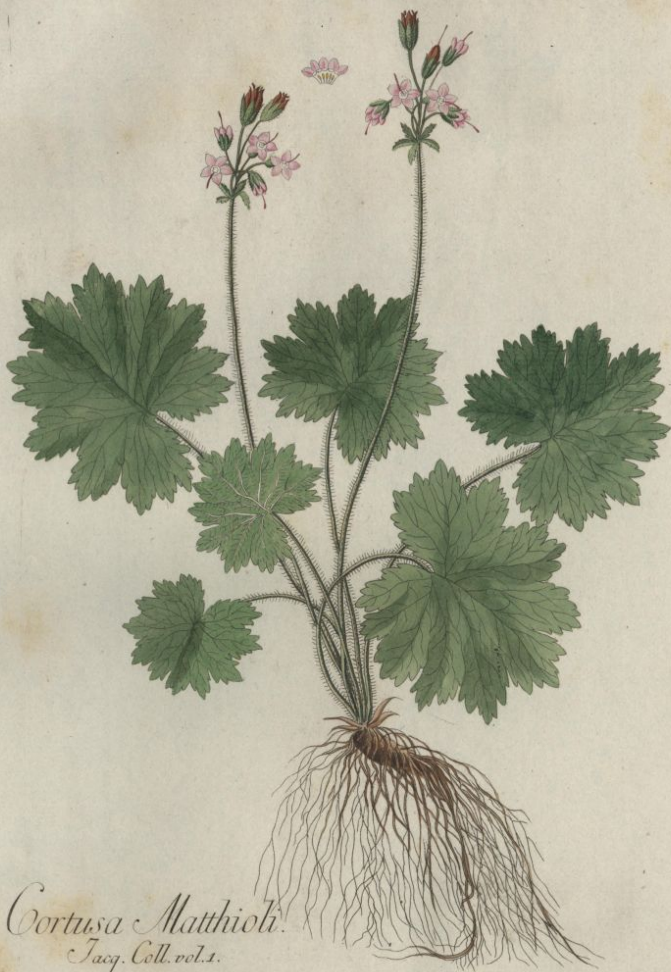
Cortusa Matthioli. Jacq. Coll. vol. 1.