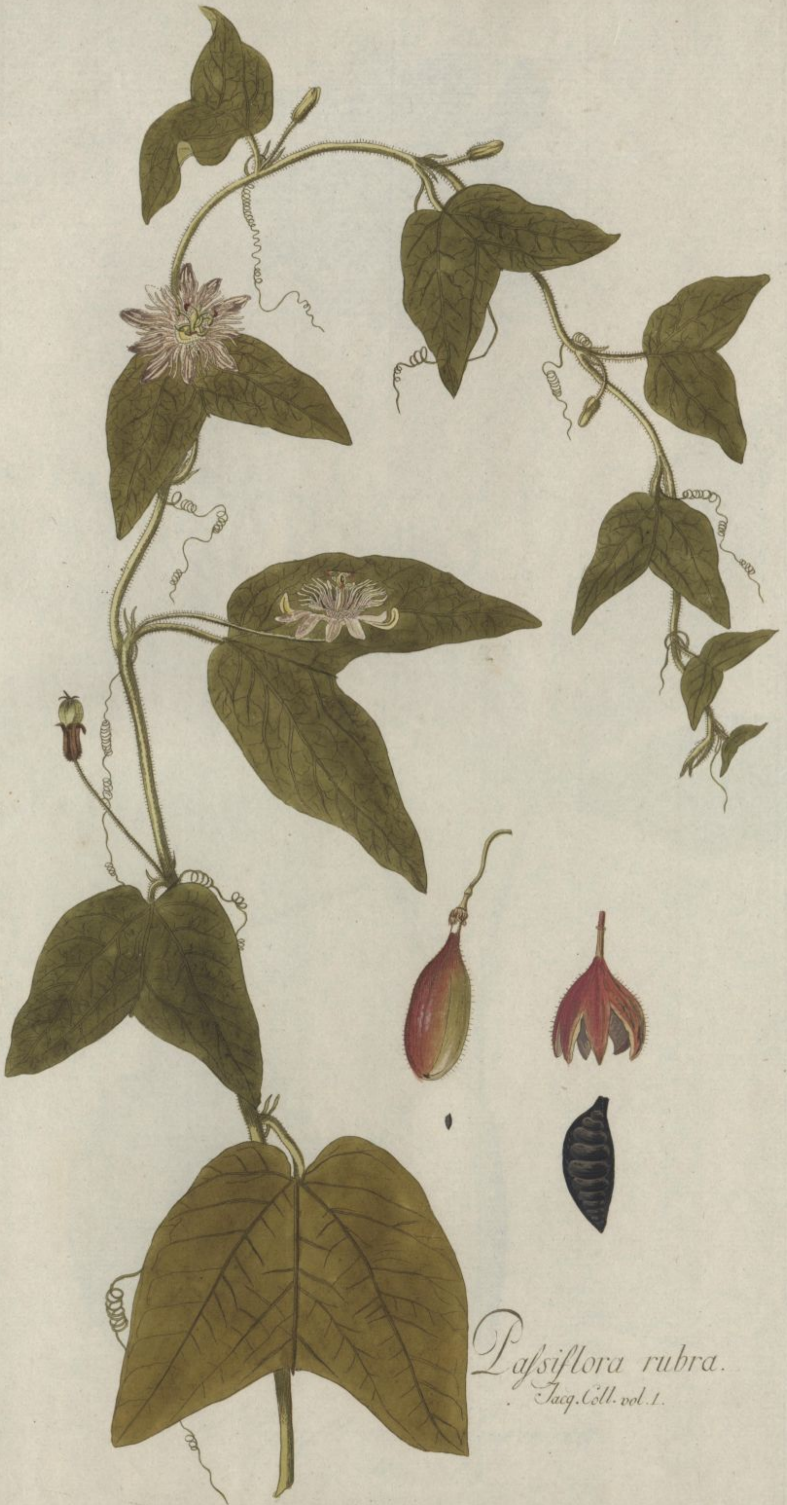
Passiflora rubra. Jacq. Coll. vol. 1.