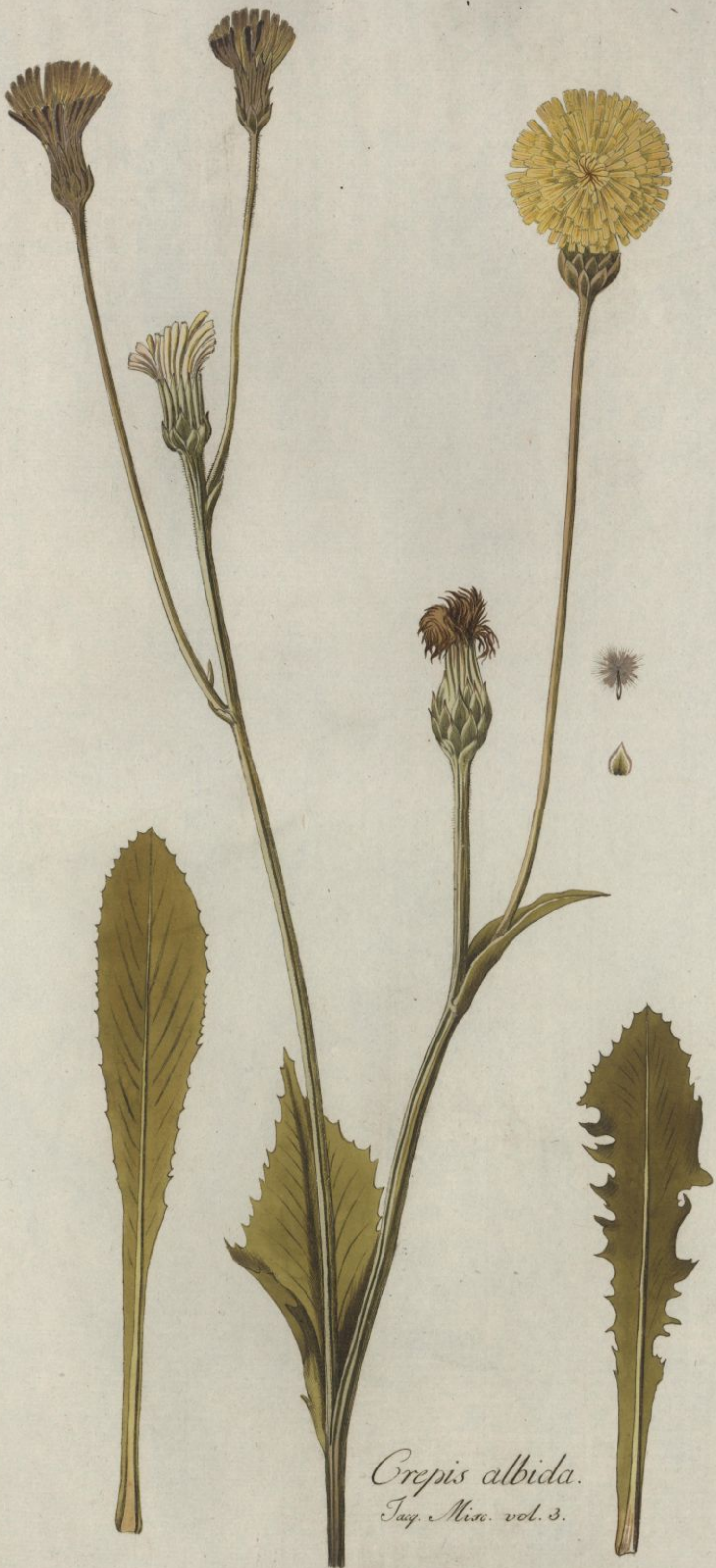
Crepis albida. Jacq. Misc. vol. 3.