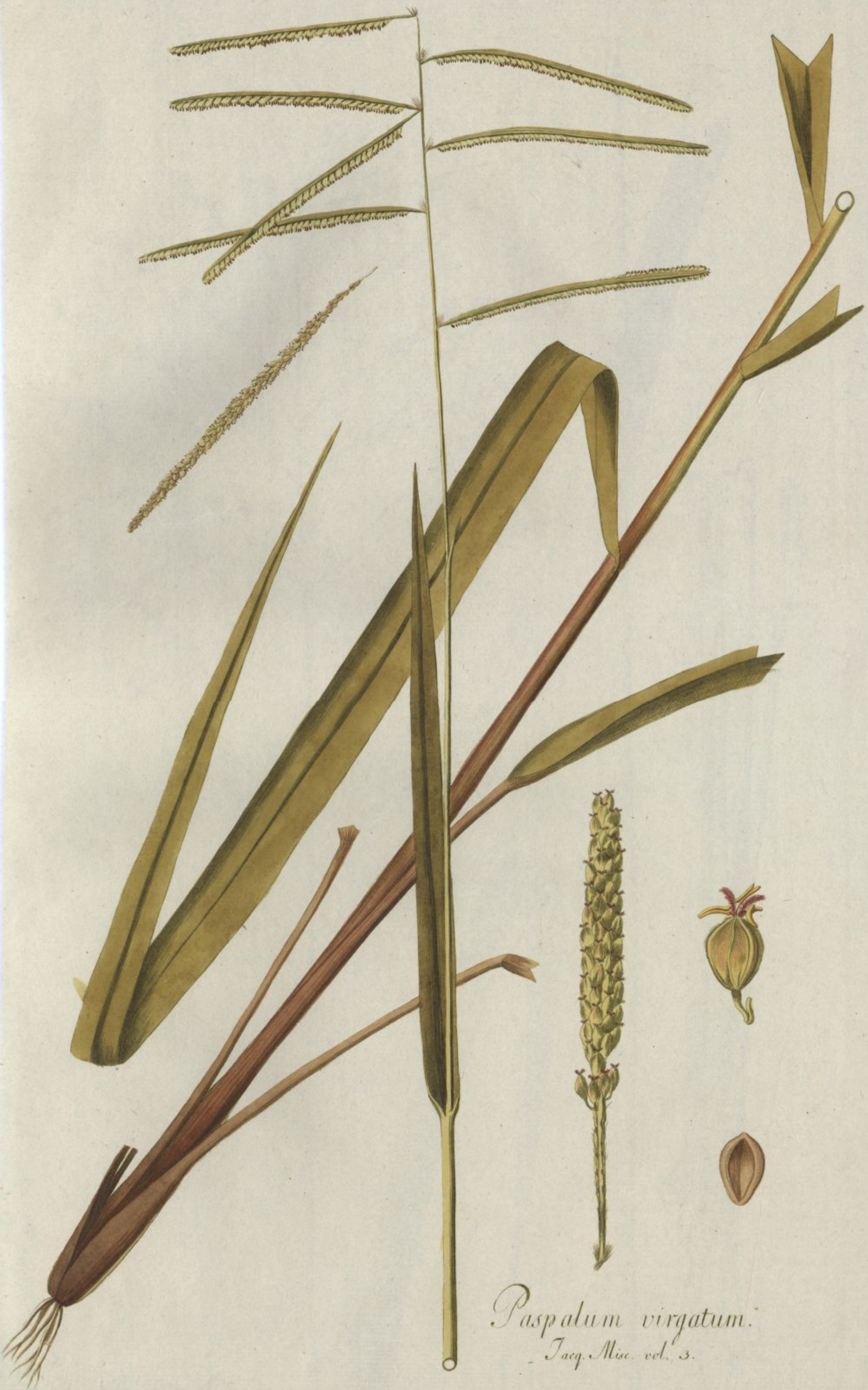
Paspalum virgatum. Jacq. Misc. vol. 3.