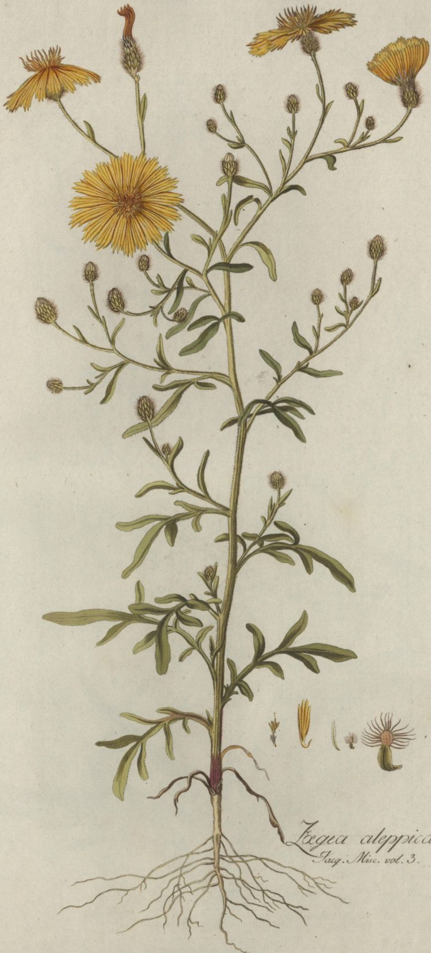
Tegea aleppica. Jacq. Misc. vol. 3.