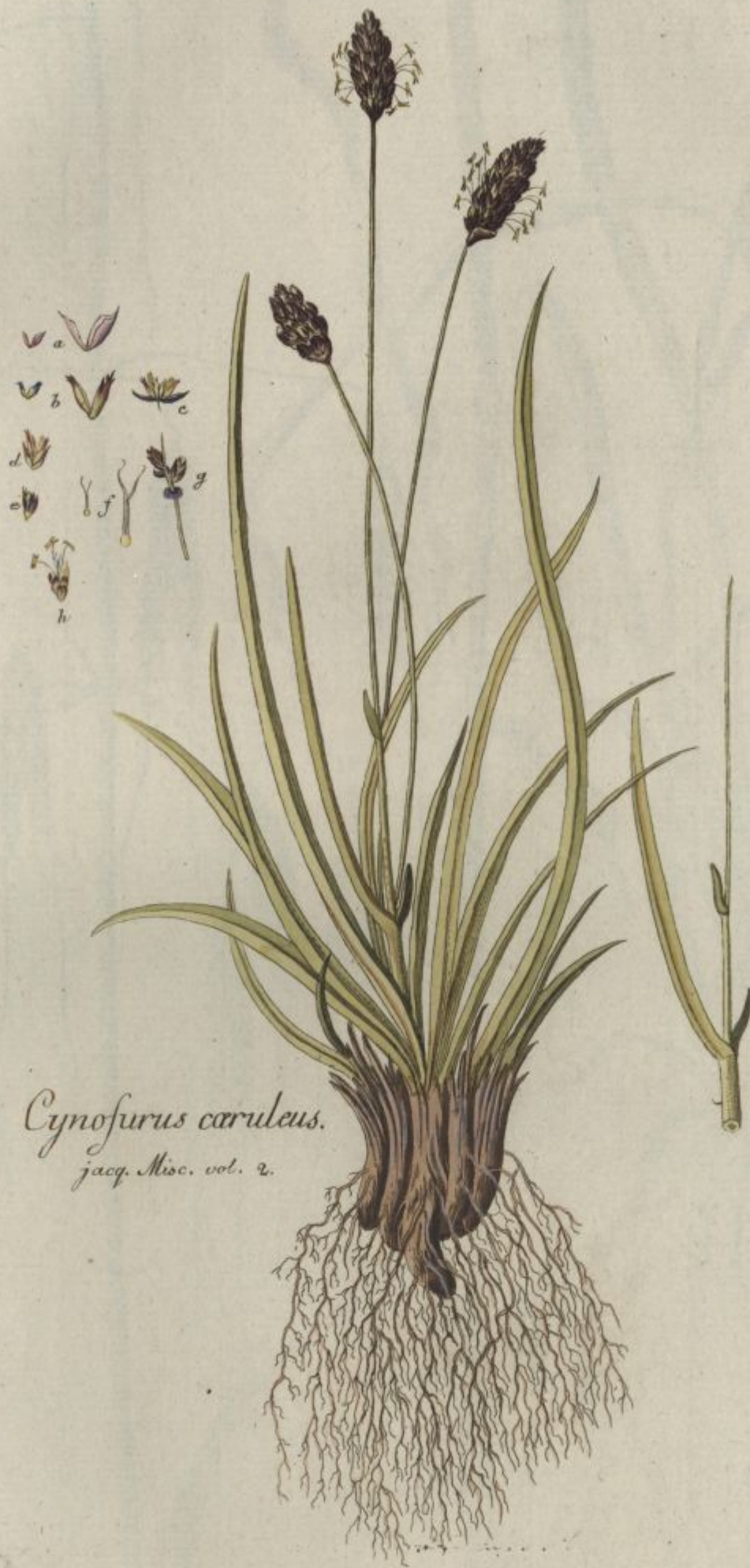
Cynosurus caruleus. jacq. Misc. vol. 2.