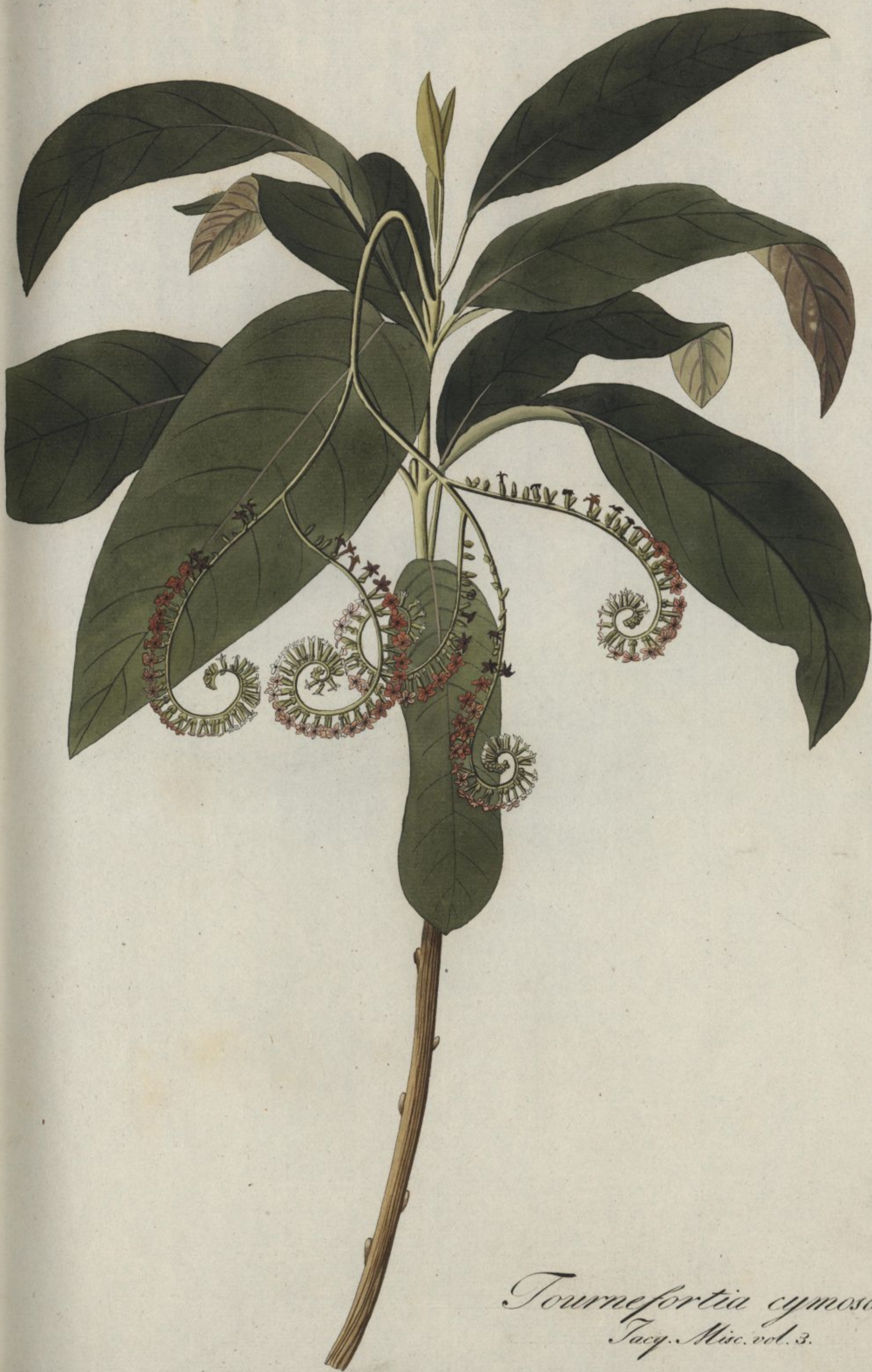
Tournefortia cymosa Jacq. Misc. vol. 3.