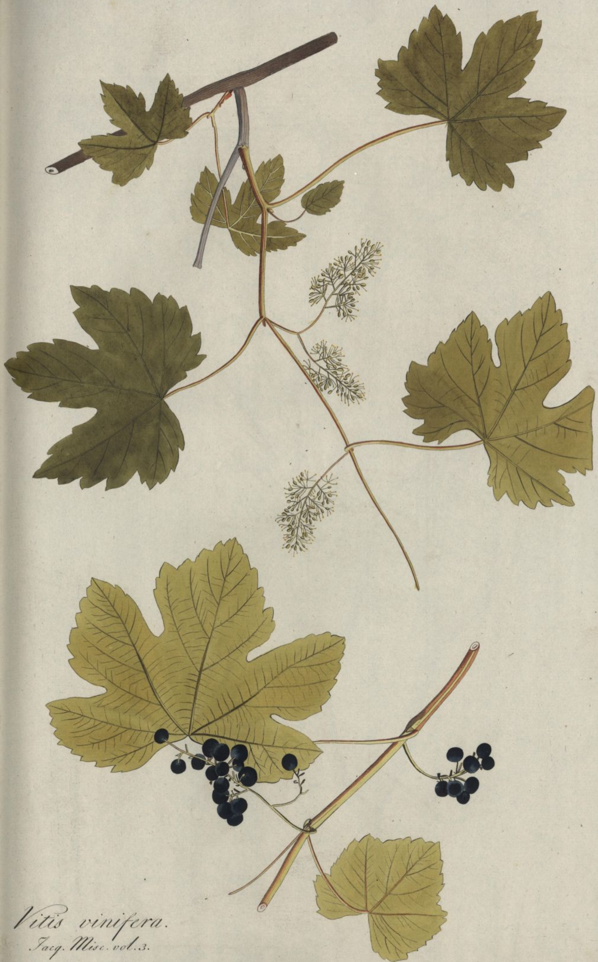
Vitis vinifera. Jacq. Misc. vol. 3.