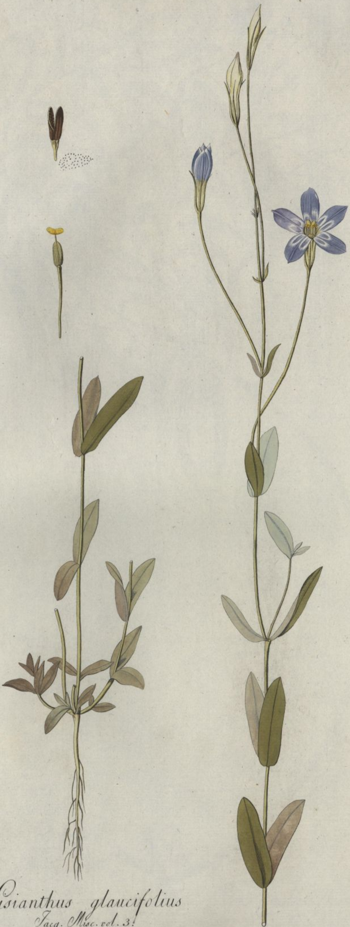
Lisianthus glaucifolius Jacq. Misc. vol. 3!