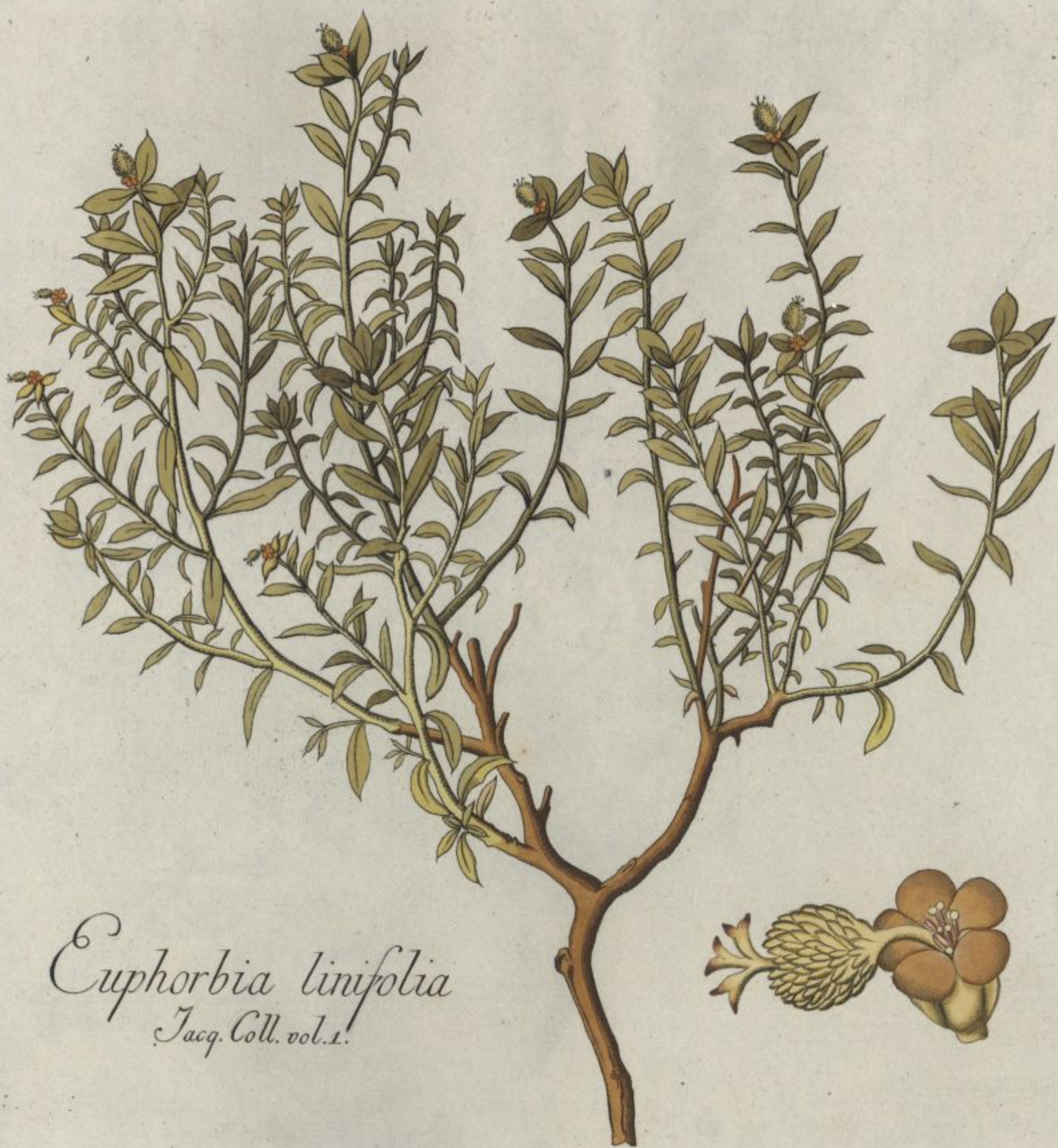
Euphorbia linifolia Jacq. Coll. vol. 1.