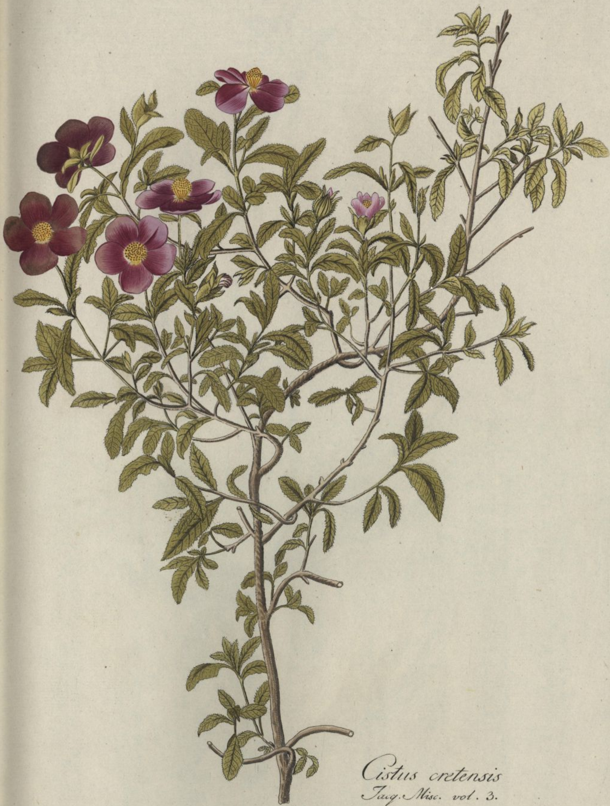
Cistus cretensis Jacq. Misc. vol. 3.