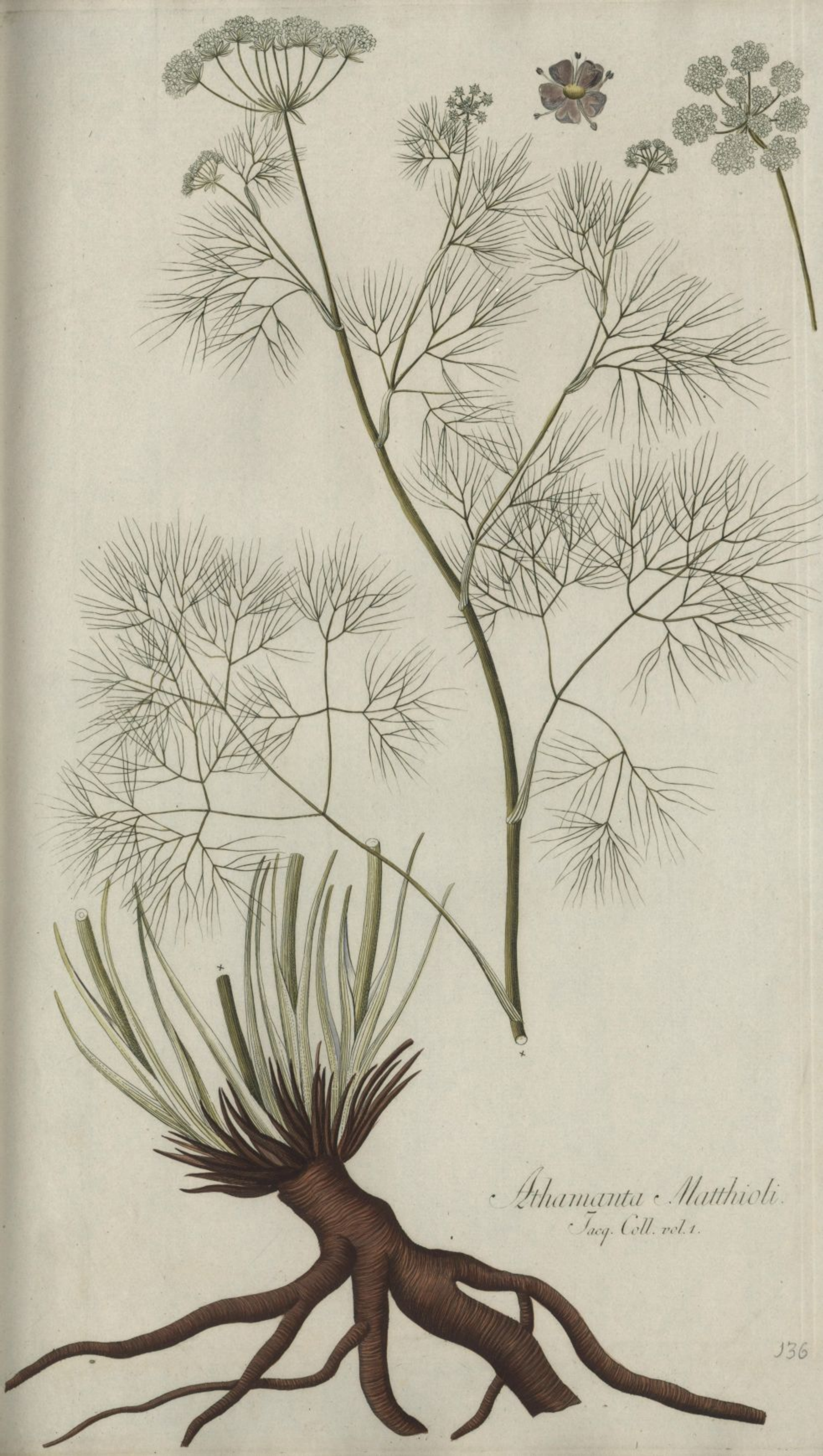
Athamanta Matthioli. Jacq. Coll. vol. 1.