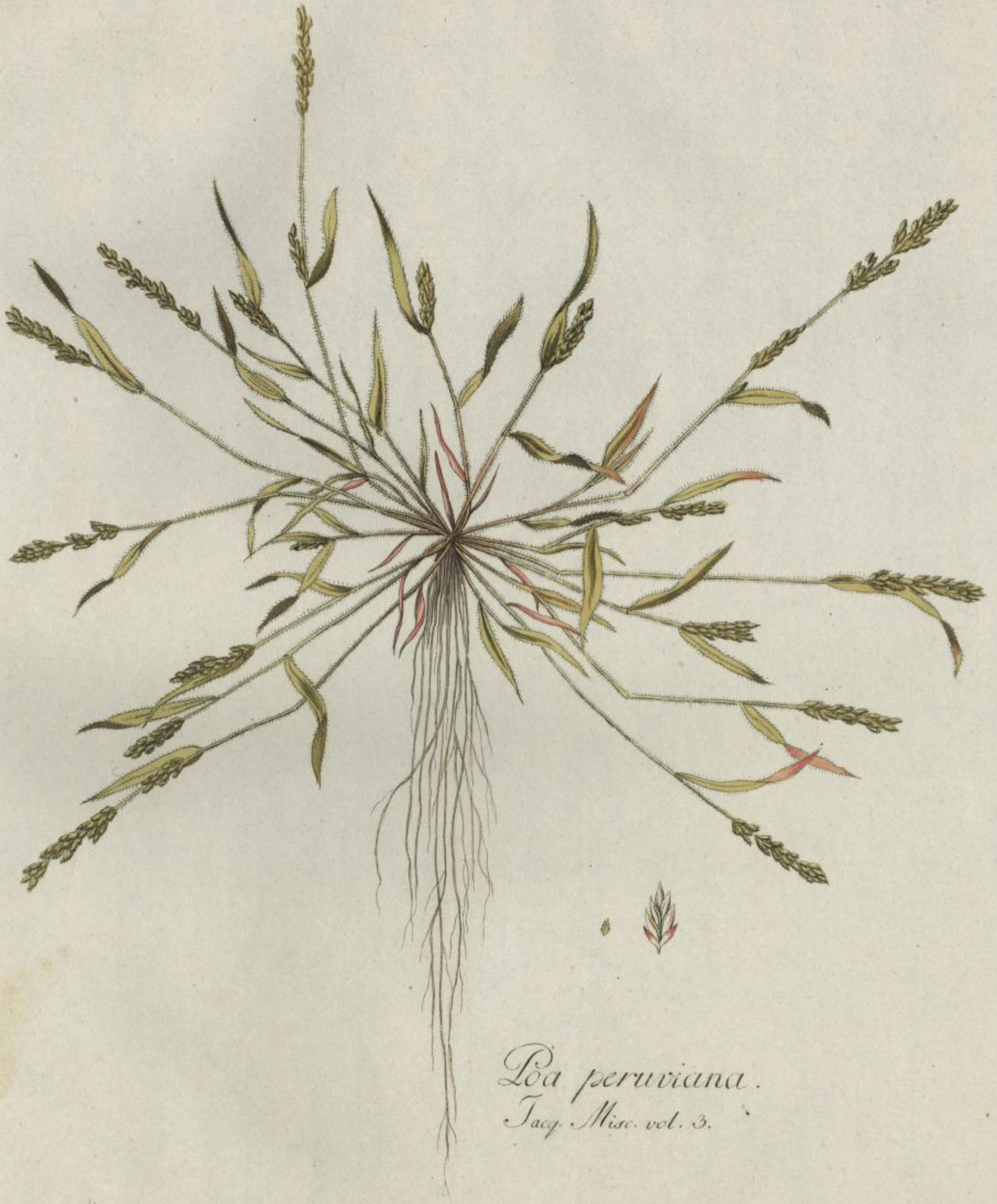
Poa peruviana. Jacq. Misc. vol. 3.