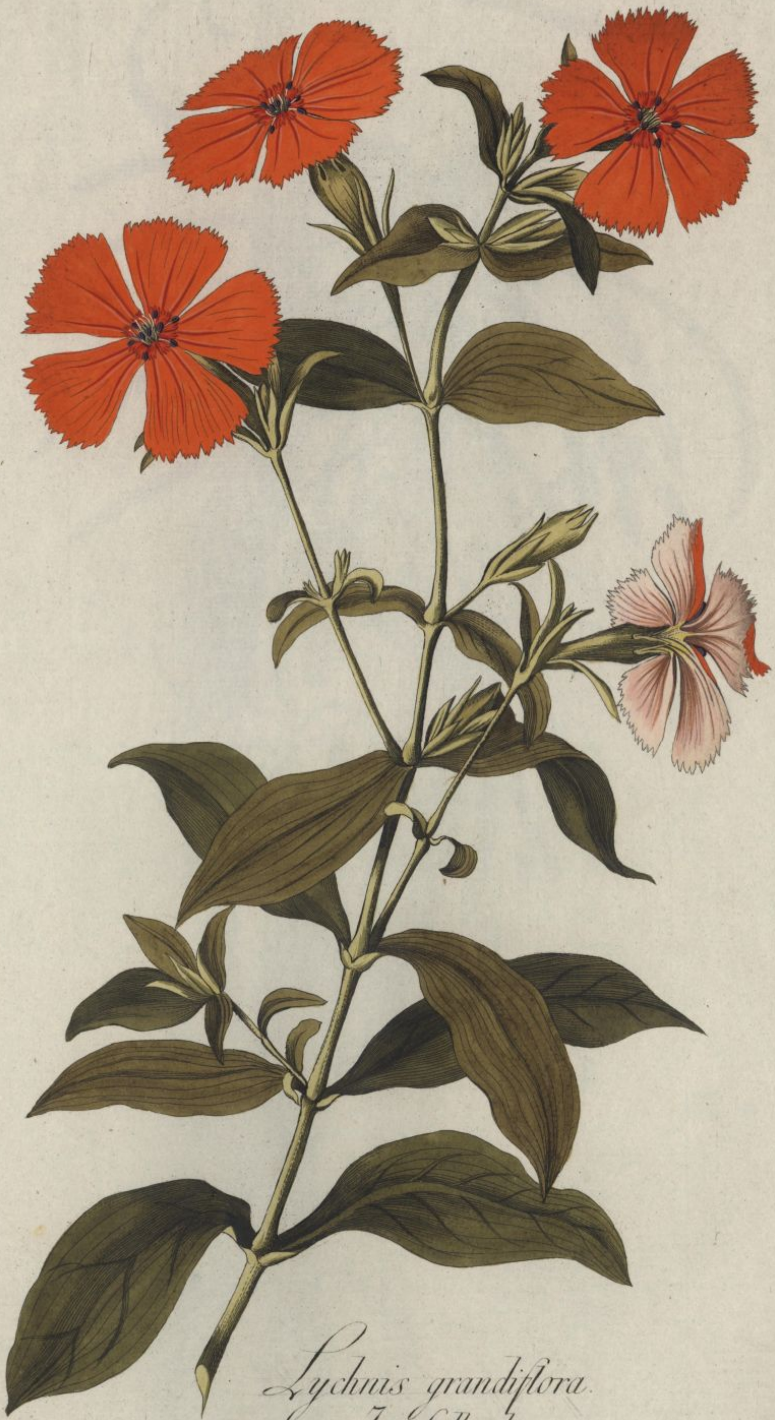
Lychnis grandiflora. Jacq. Coll. vol. 1.