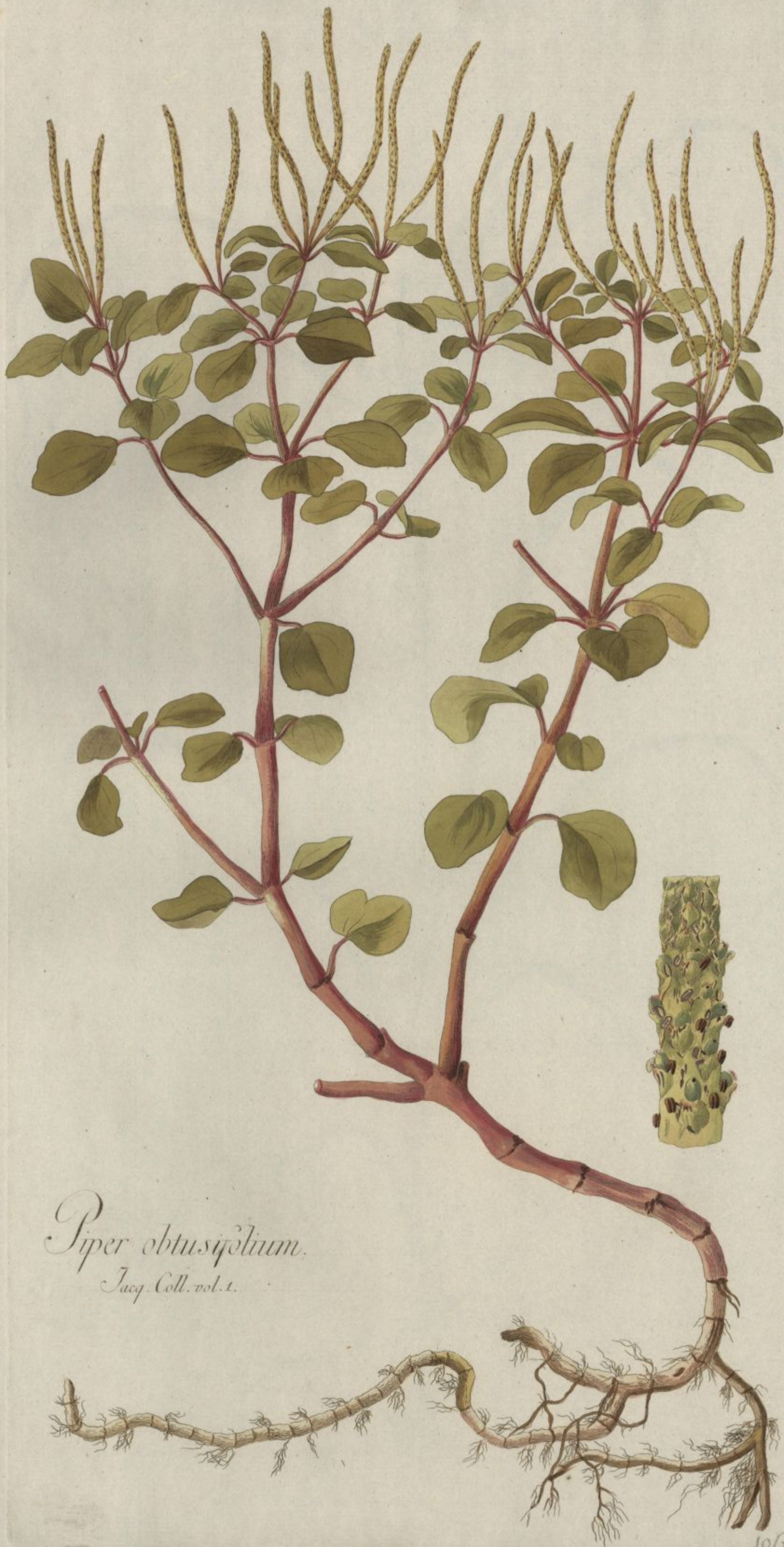
Piper obtusifolium. Jacq. Coll. vol. 1.