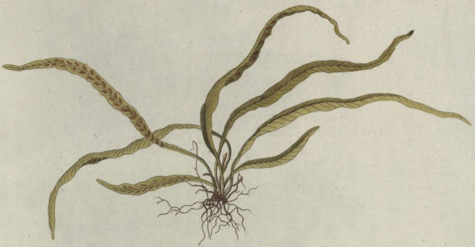
Asplenium angustifolium. Jacq. Coll. vol. 1.