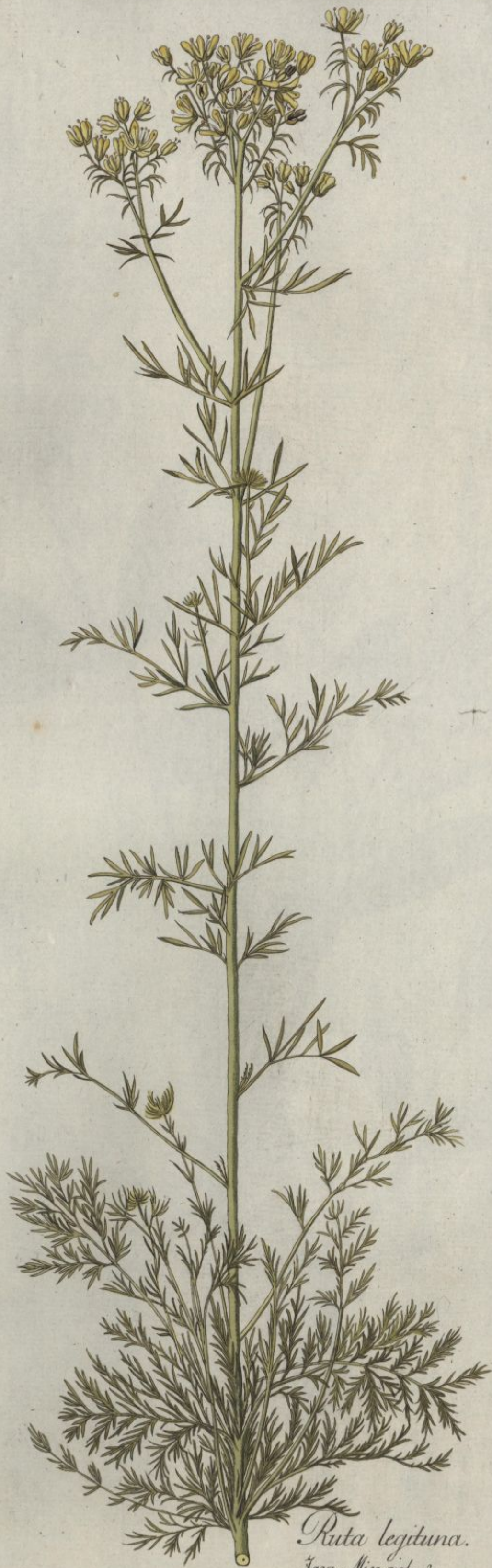
Ruta legitima. Jacq. Misc. vol. 3.