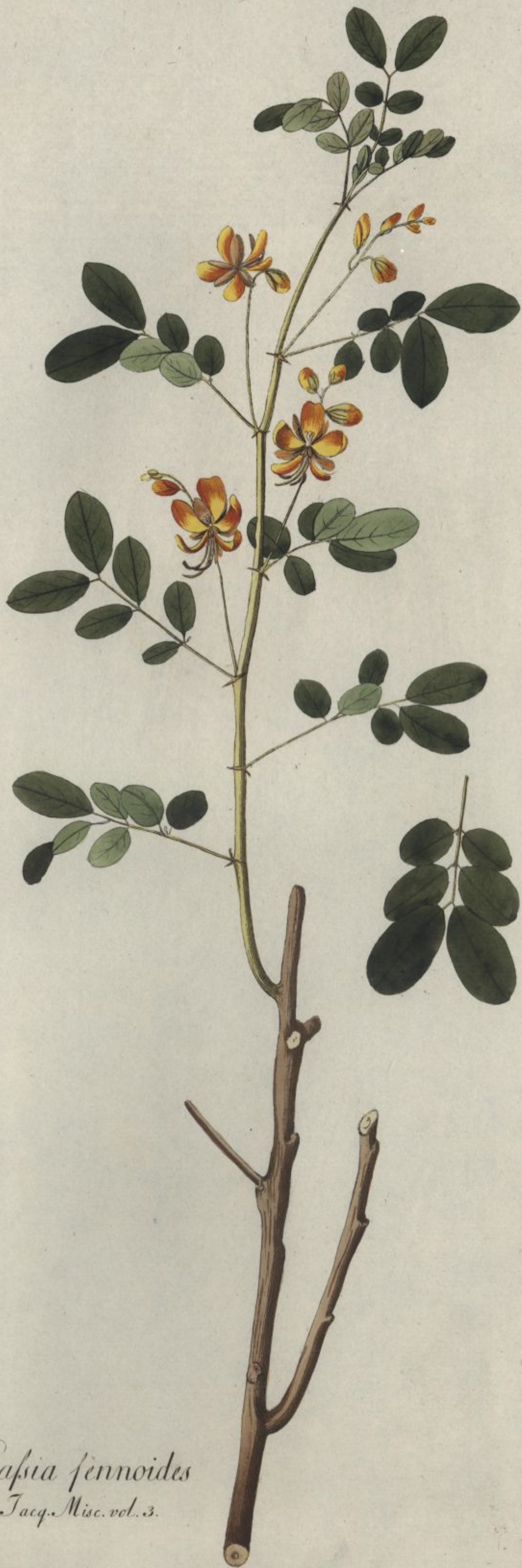
Cassia fennoides Jacq. Misc. vol. 3.