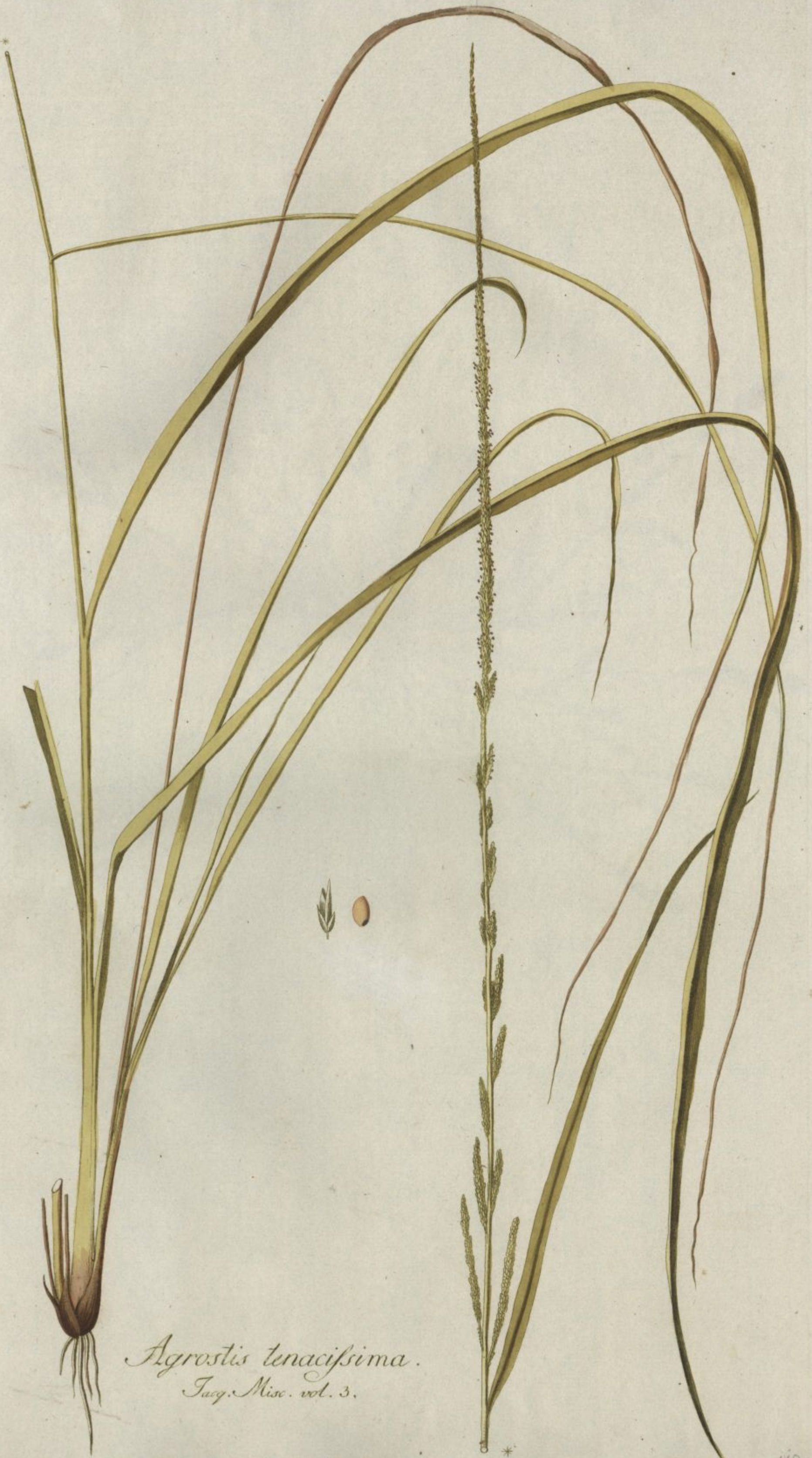
Agrostis tenacissima. Jacq. Misc. vol. 3.