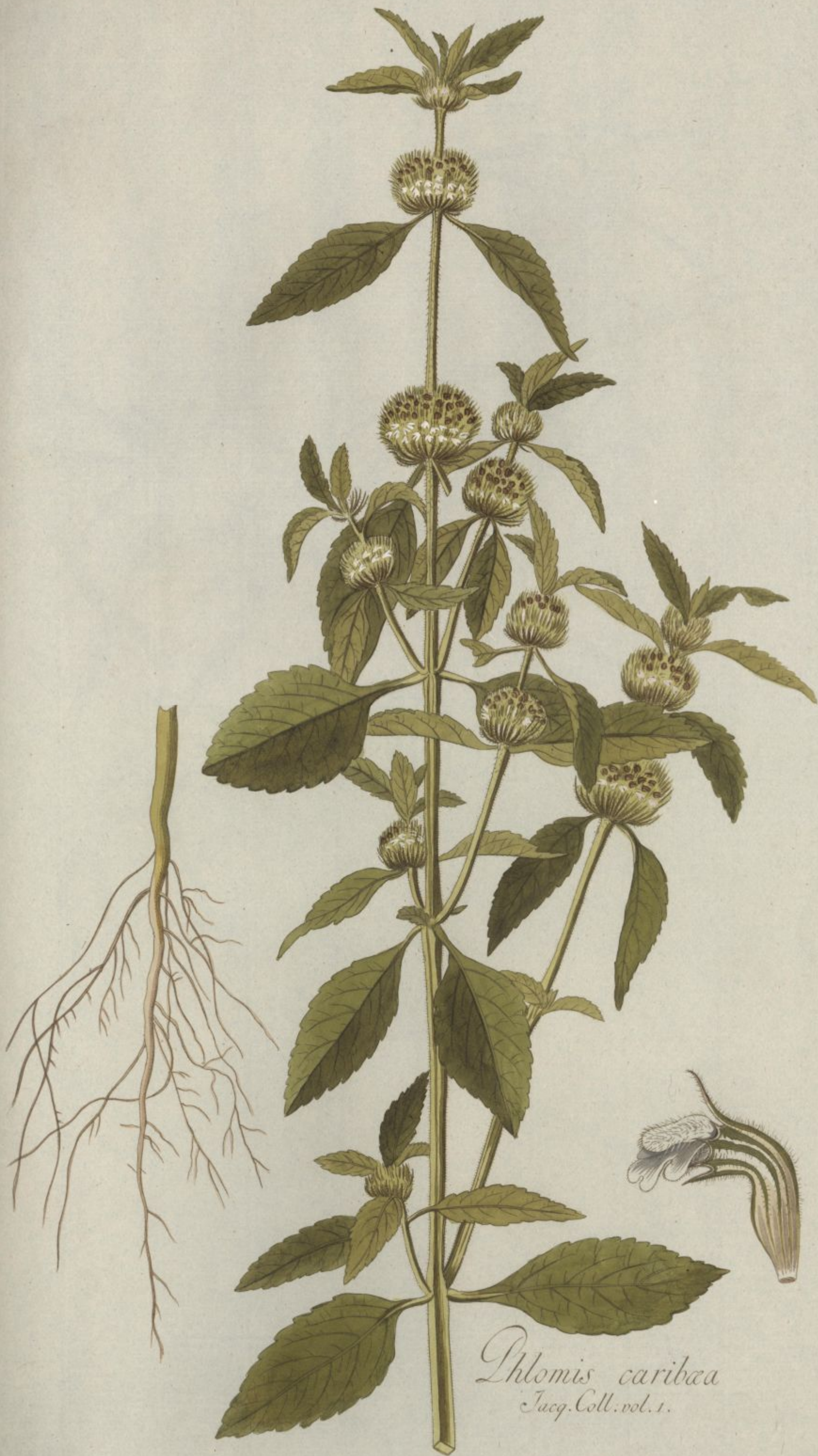
Phlomis caribaea Jacq. Coll. vol. 1.