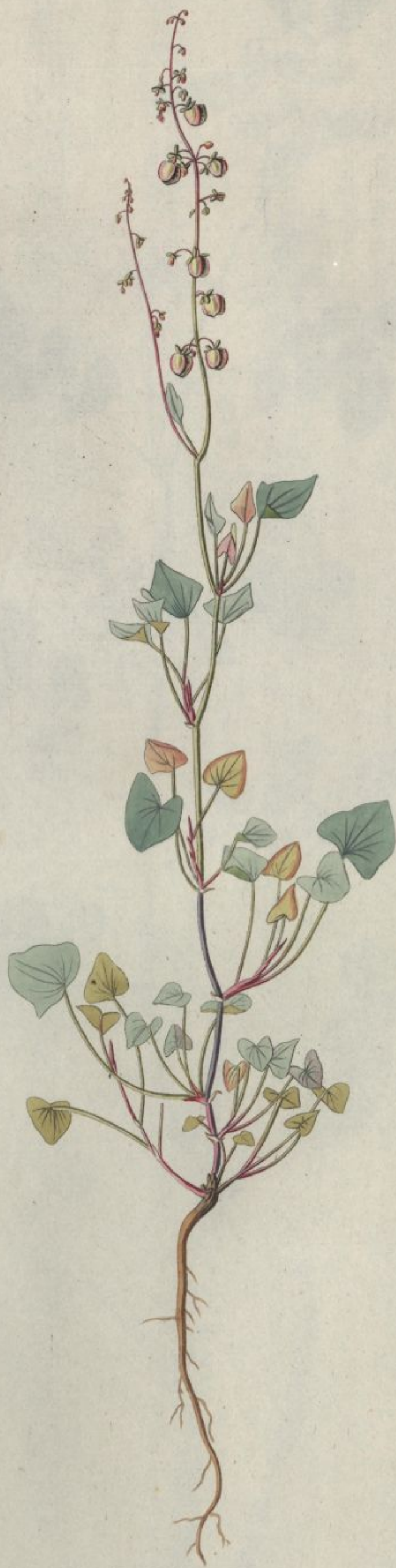
Rumex glaucus. Jacq. Misc. vol. 3.