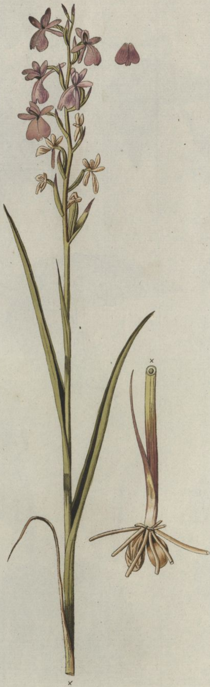
Orchis palustris. Jacq. Misc. vol. 5.