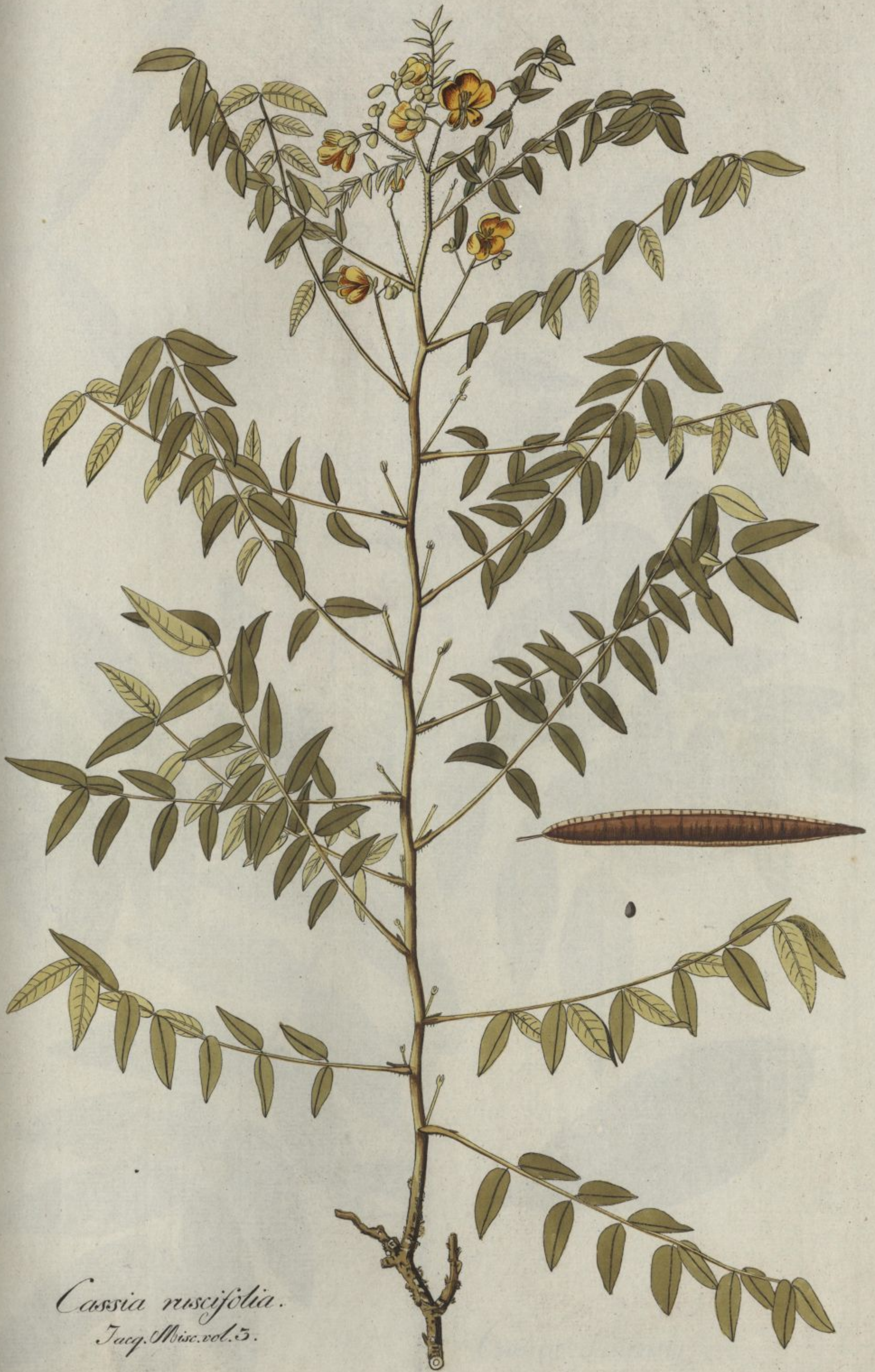
Cassia nuscifolia. Jacq. Misc. vol. 5.