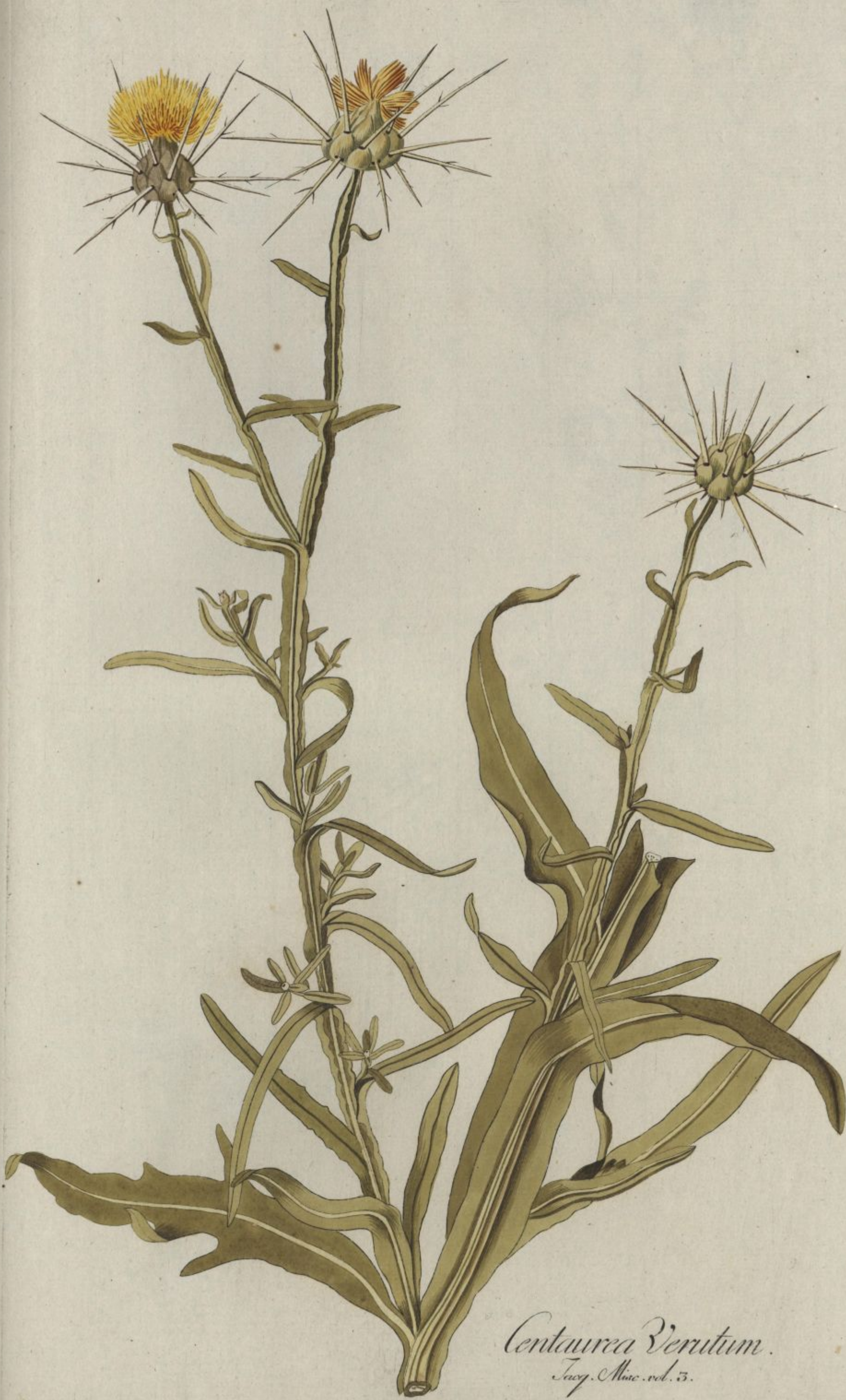
Centaurea Verutum. Jacq. Misc. vol. 3.