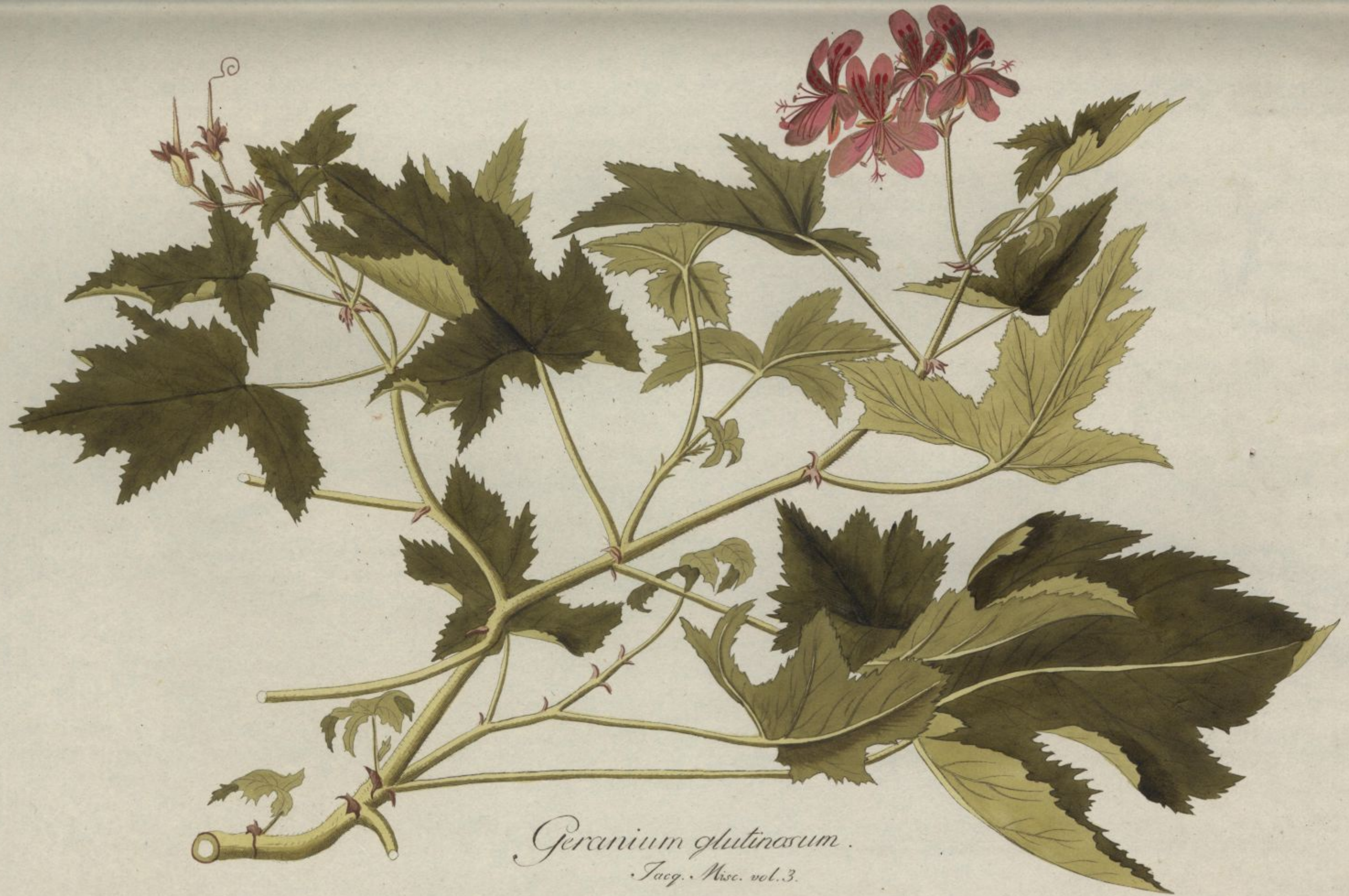
Geranium glutinosum. Jaeg. Misc. vol. 3.