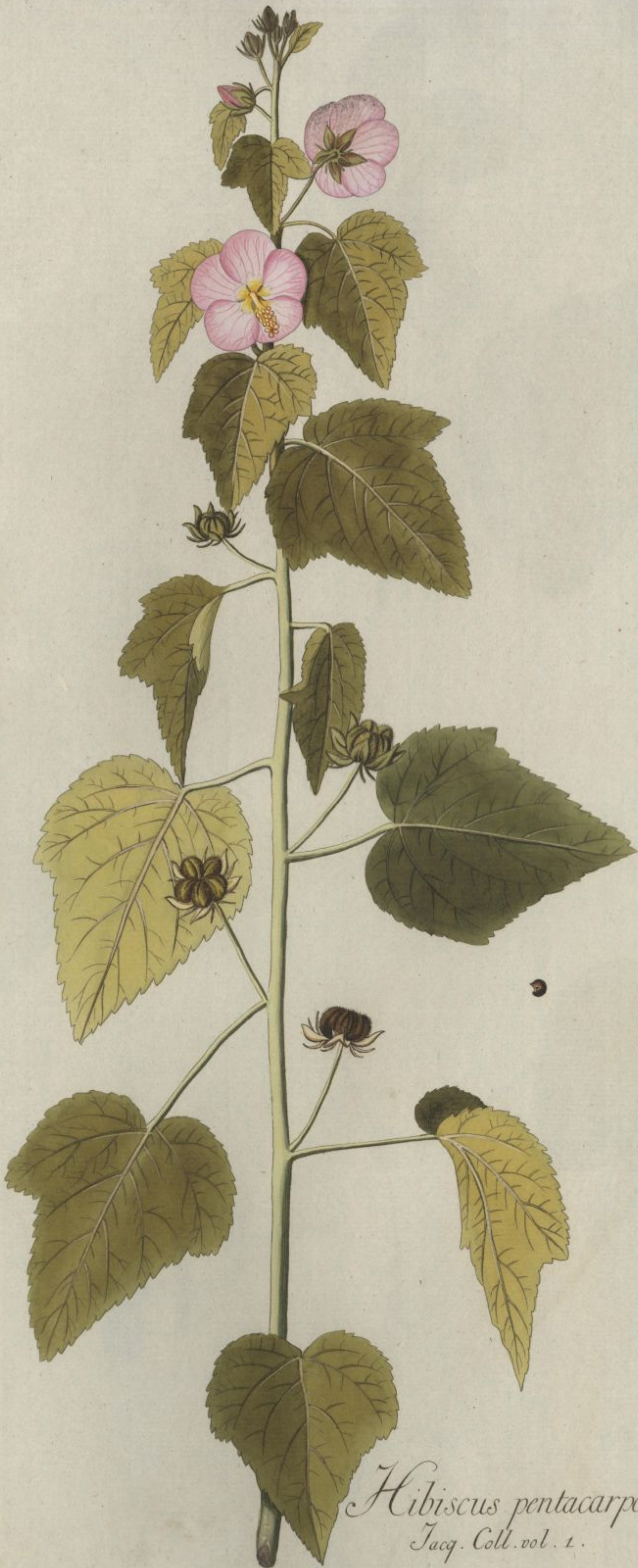
Hibiscus pentacarpos Jacq. Coll. vol. 1.