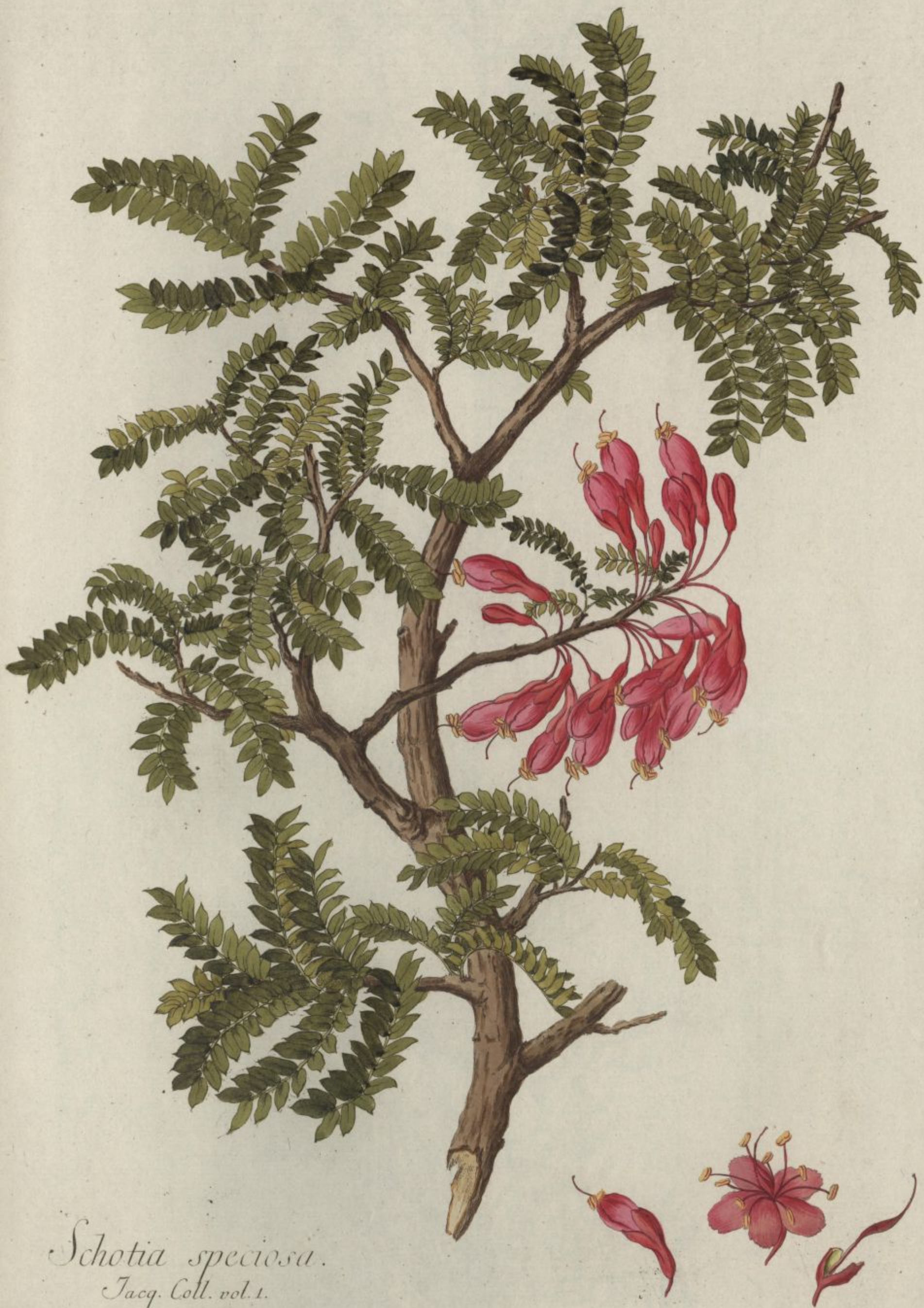
Schotia speciosa. Jacq. Coll. vol. 1.