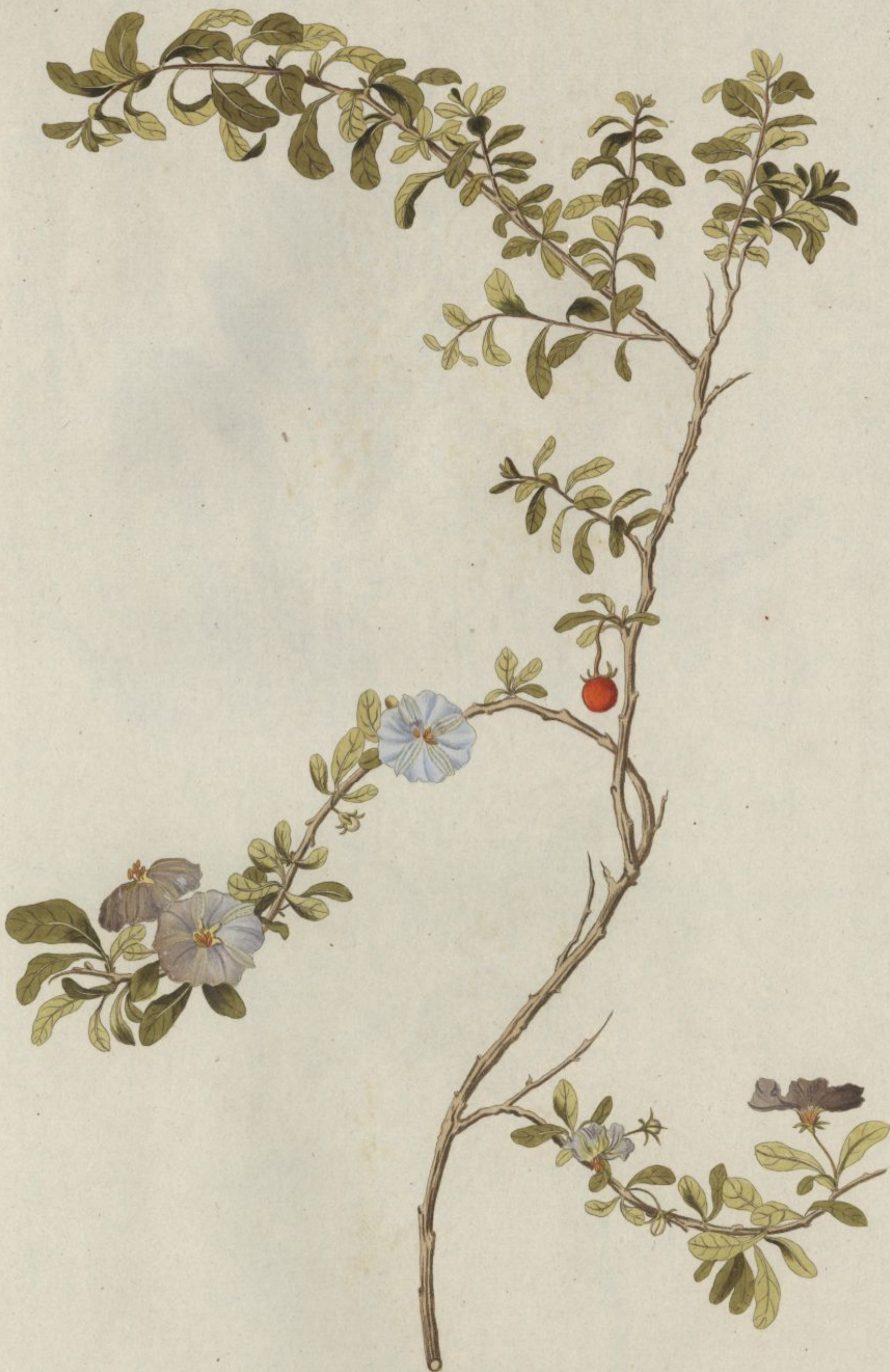
Solanum lycioides. Jacq. Misc. vol. 3.