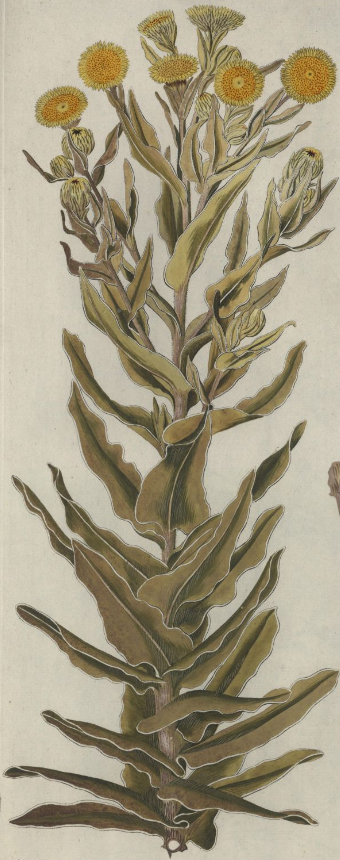
Xeranthemum fulgidum. Linn. suppl. pag. 365.