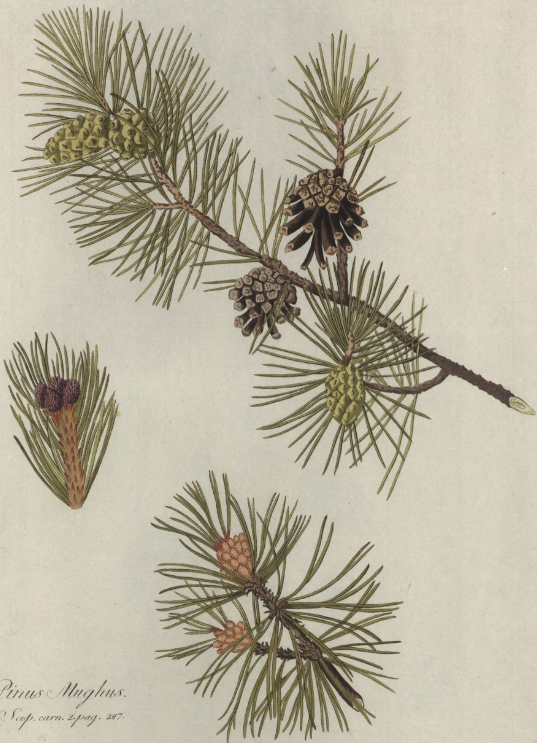
Pinus Mughus. Scop. carn. 2. pag. 247.