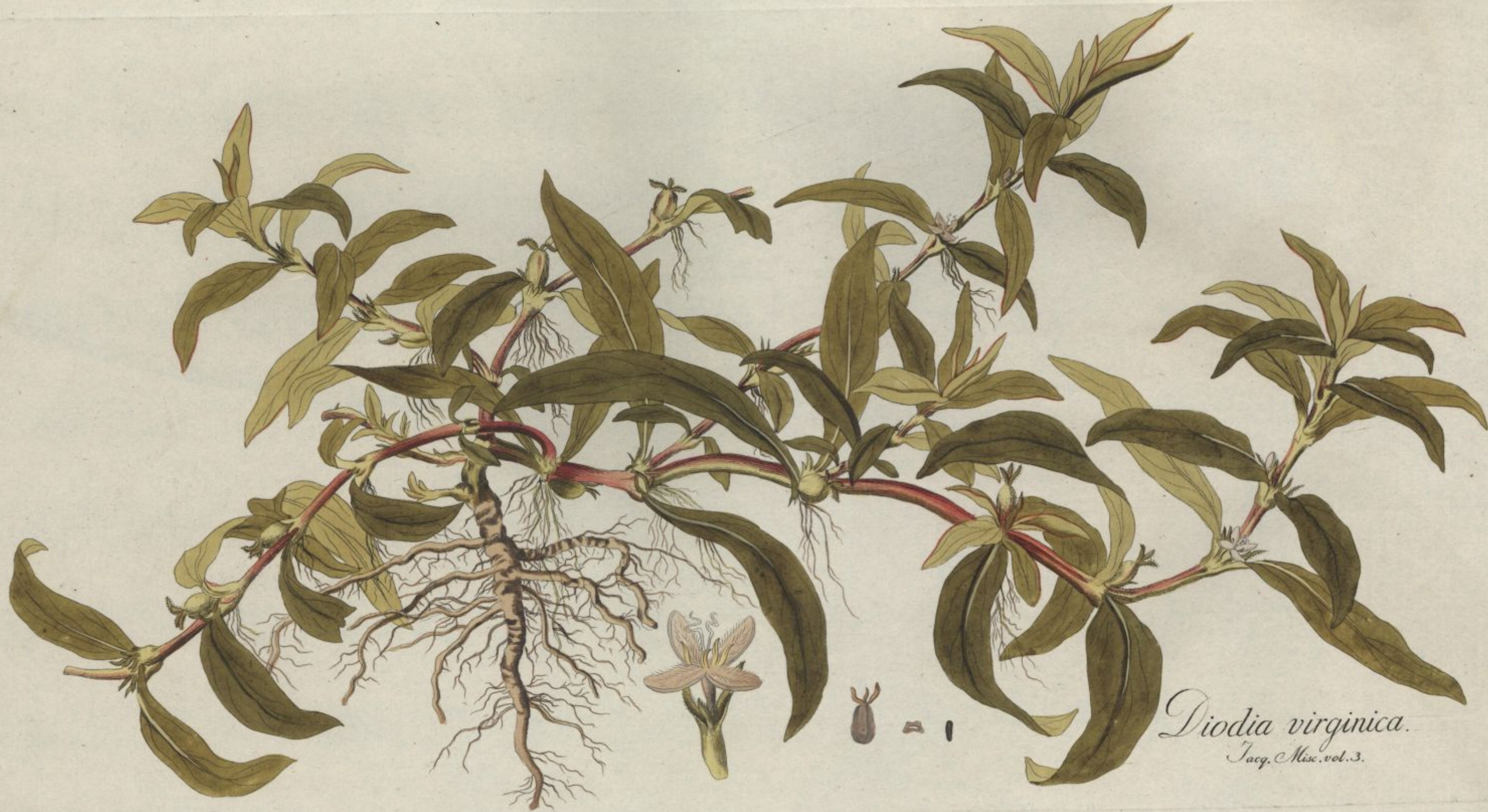
Diodia virginica. Jacq. Misc. vol. 3.