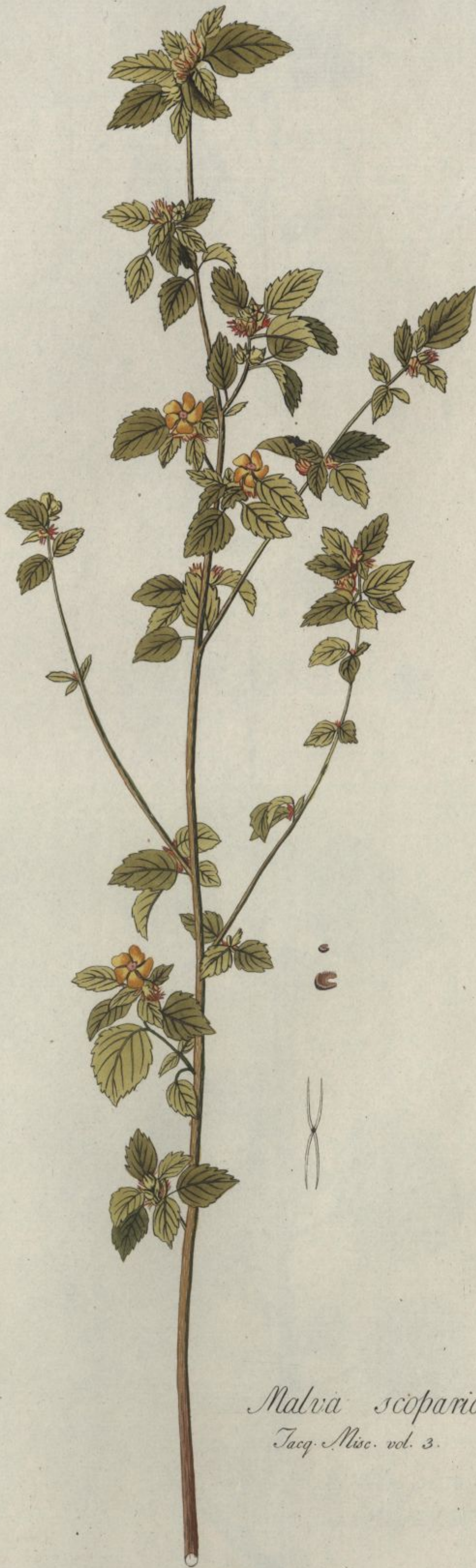
Malva scoparia. Jacq. Misc. vol. 3.