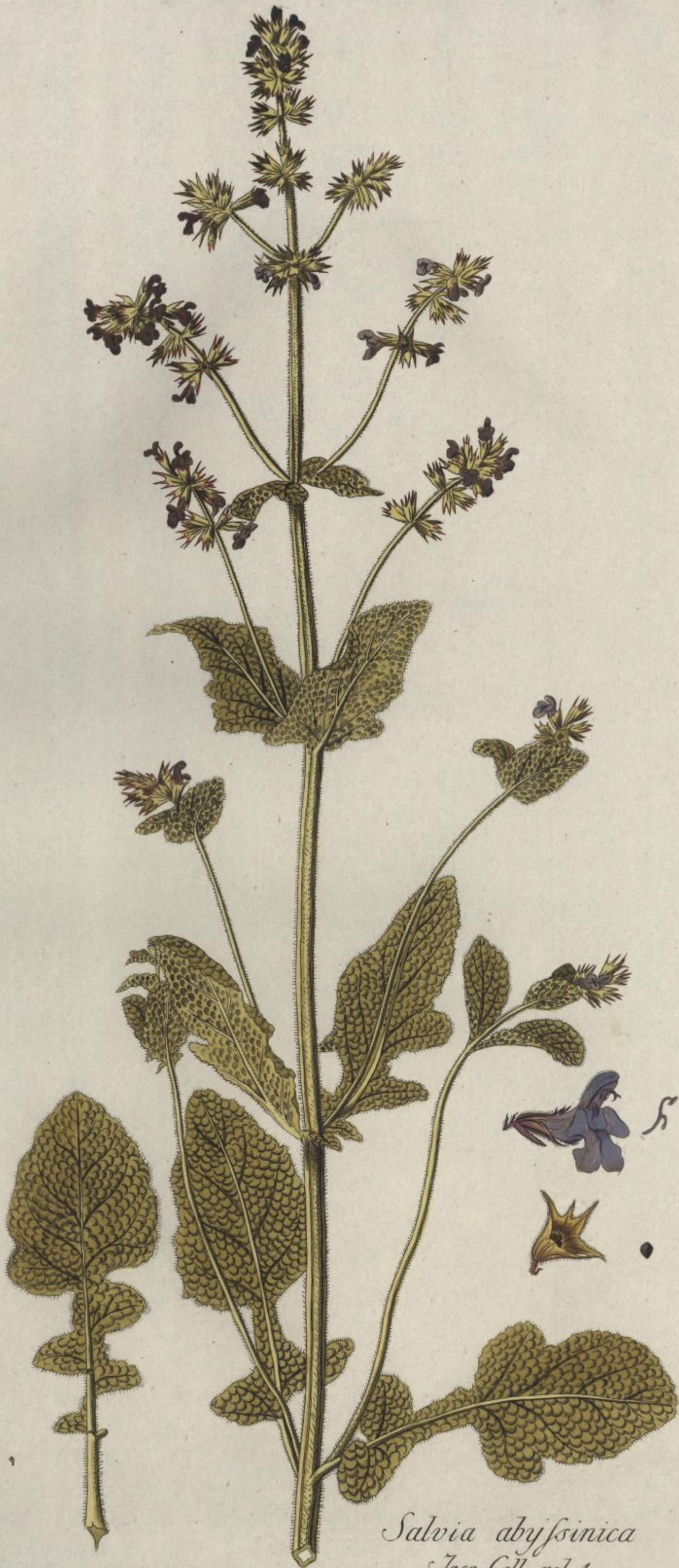
Salvia abyssinica Jacq. Coll. vol. 1.