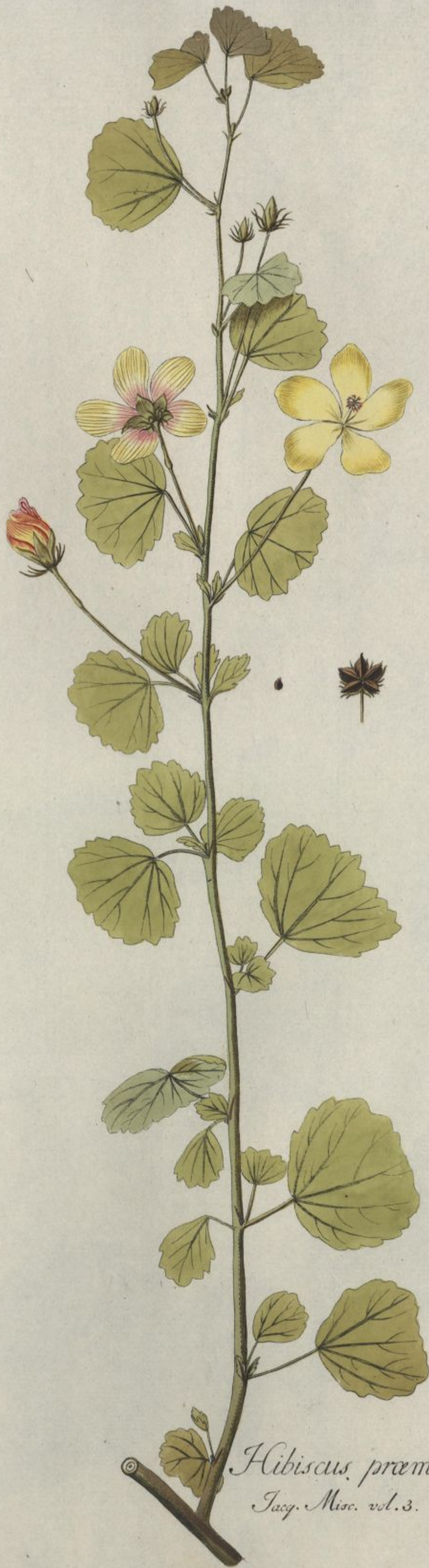
Hibiscus praemorsus. Jacq. Misc. vol. 3.