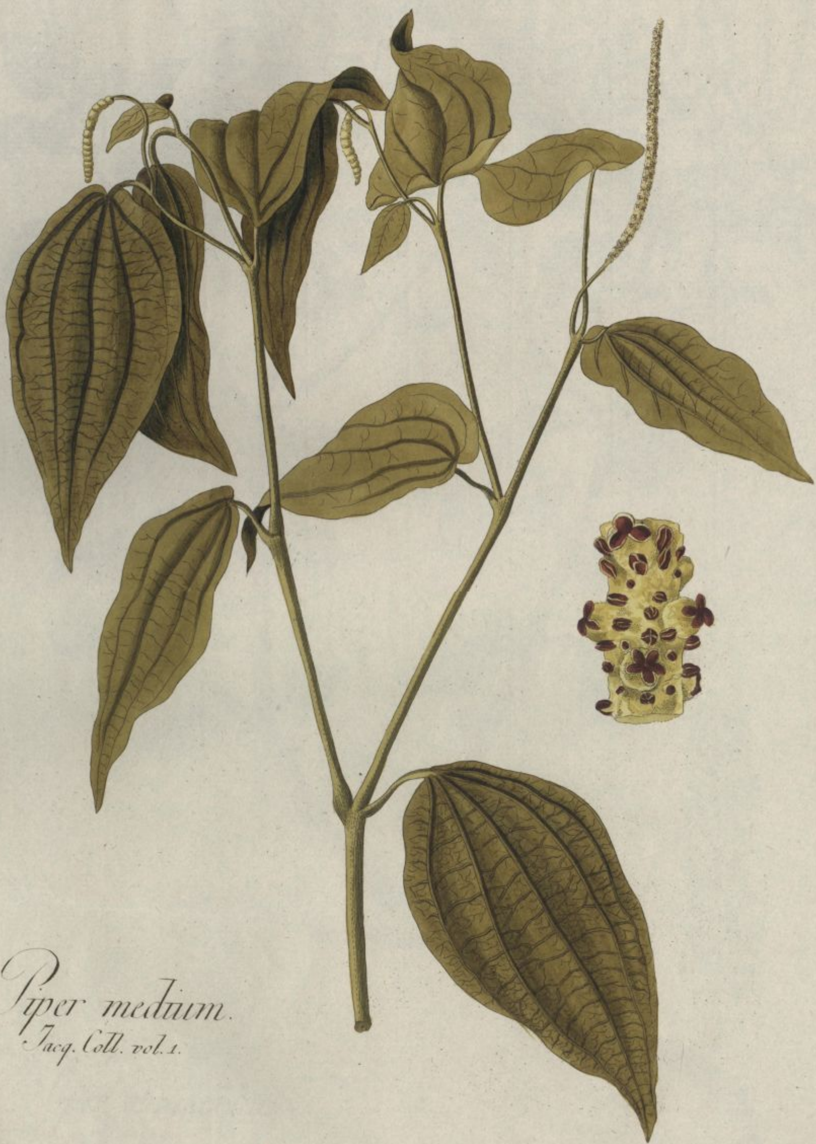
Piper medium. Jacq. Coll. vol. 1.