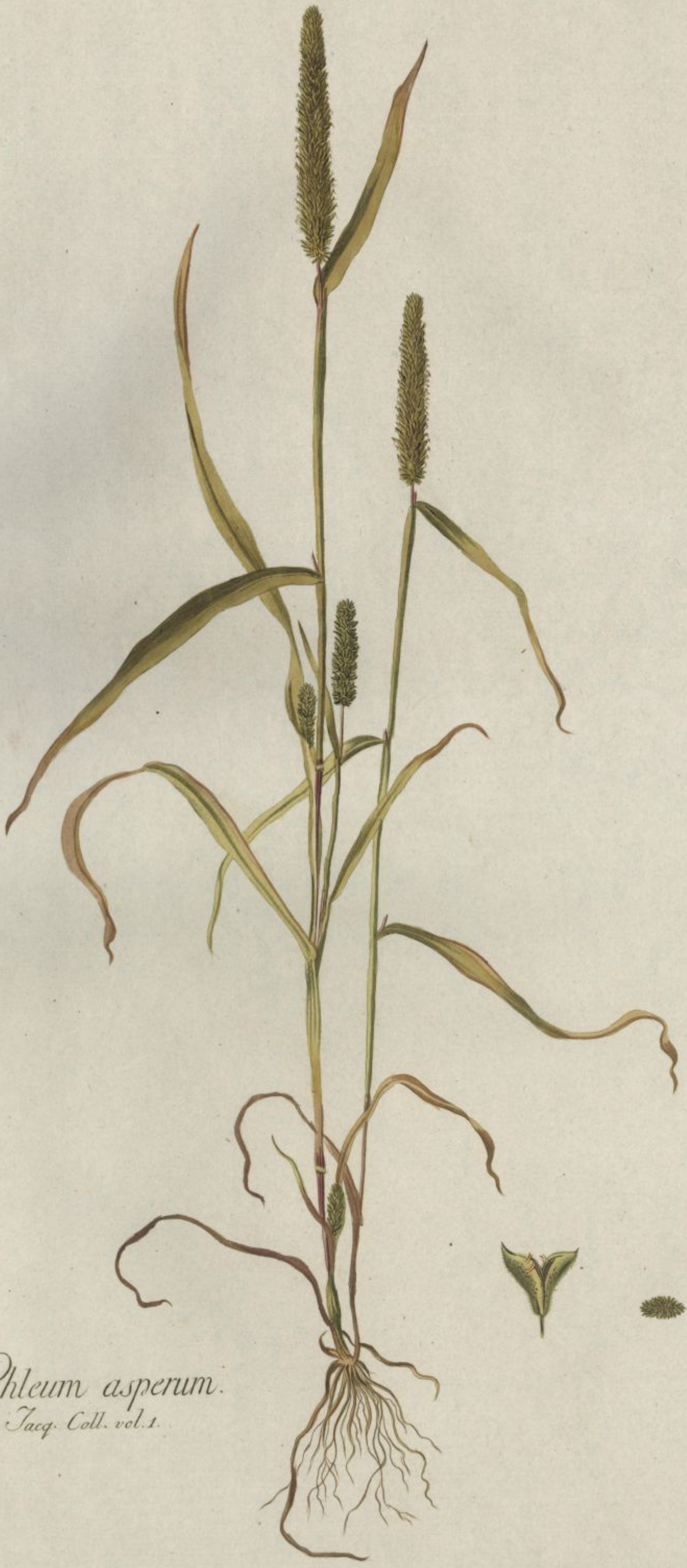
Phleum asperum. Jacq. Coll. vol. 1.