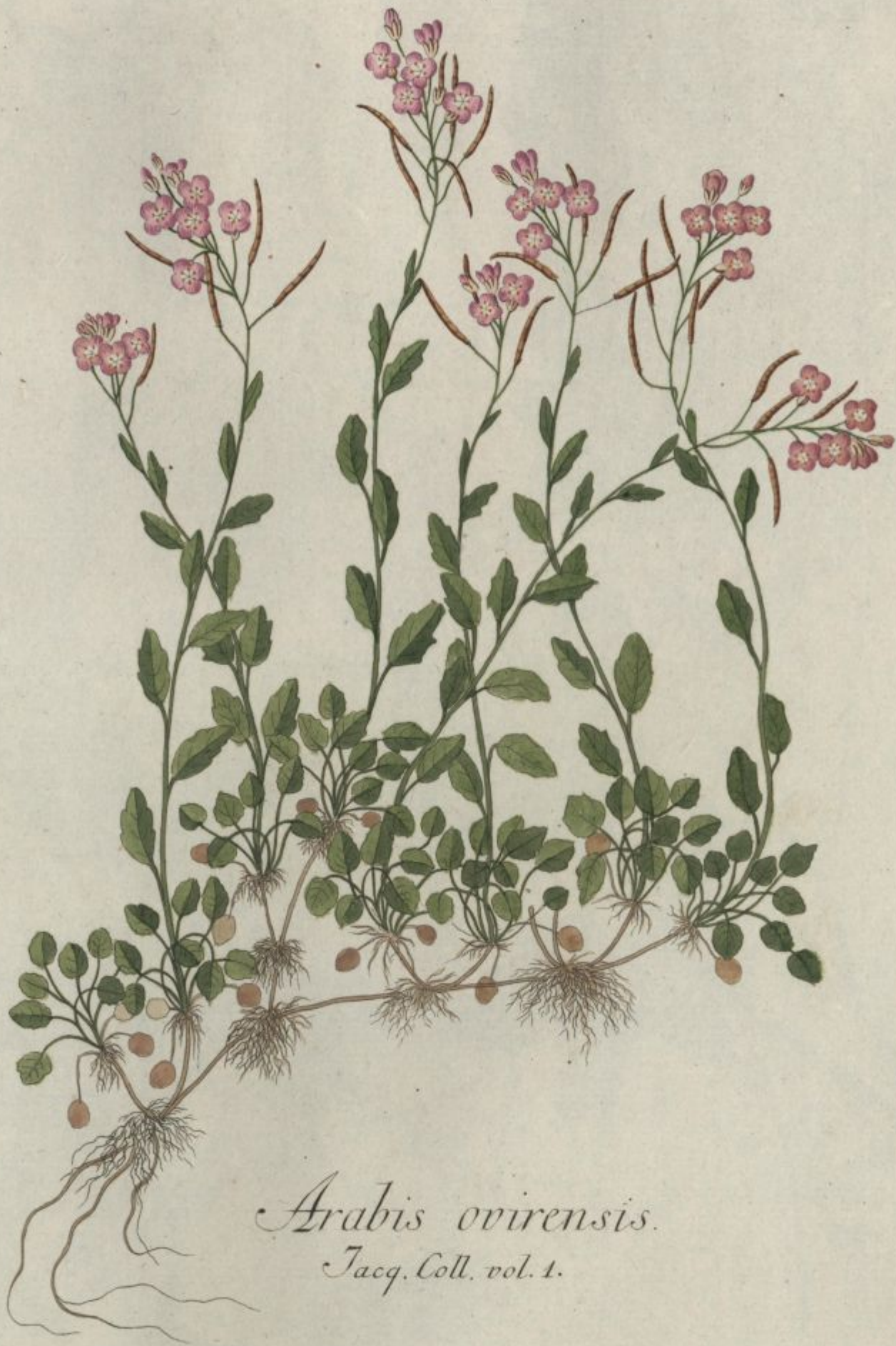
Arabis ovirensis. Jacq. Coll. vol. 1.