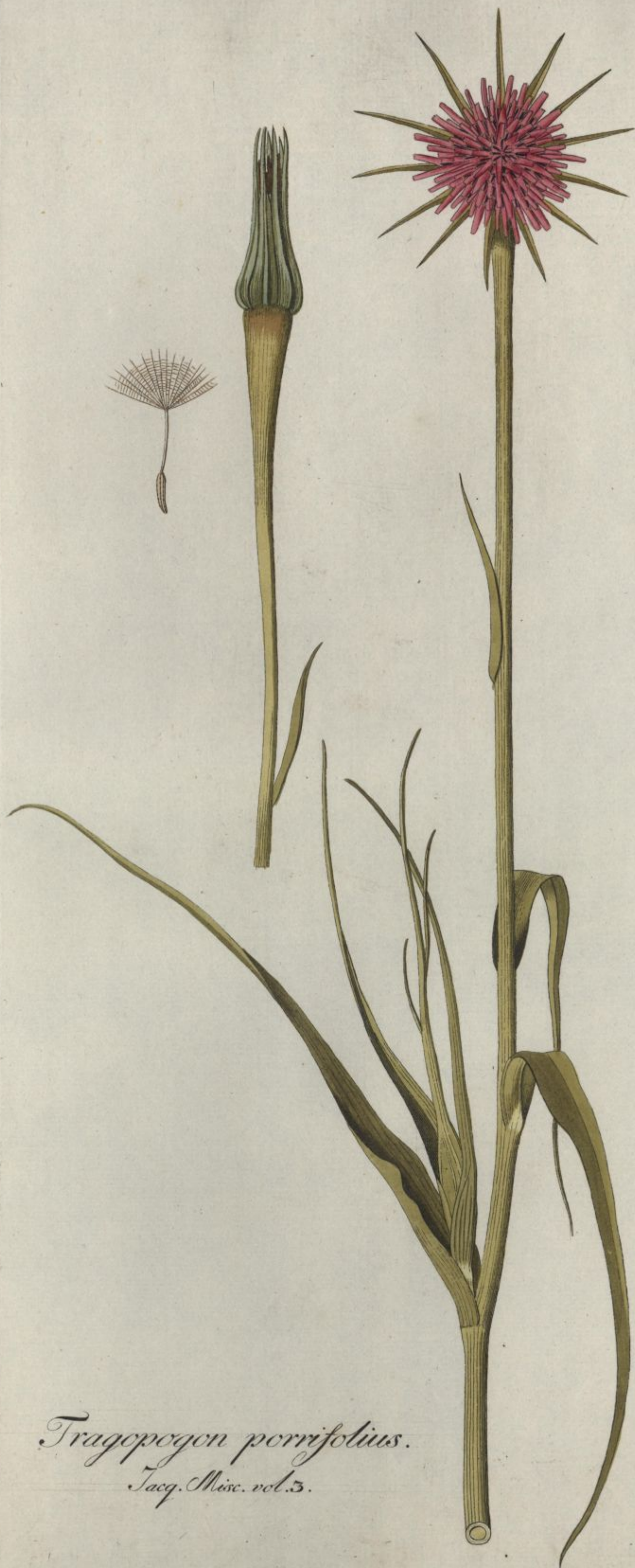
Tragopogon porrifolius. Jacq. Misc. vol. 3.