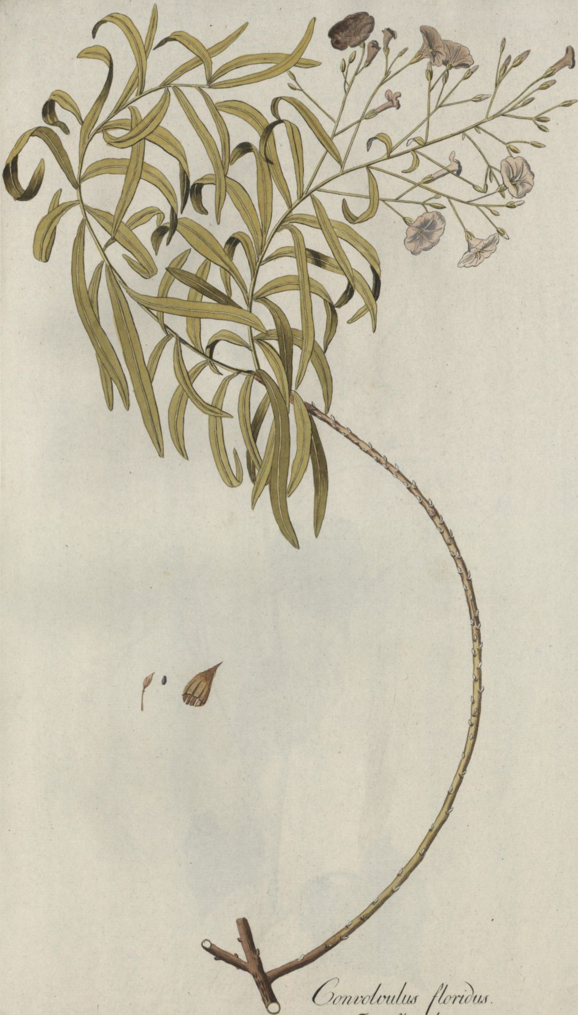
Convolvulus floridus. Jacq. Misc. vol. 3.