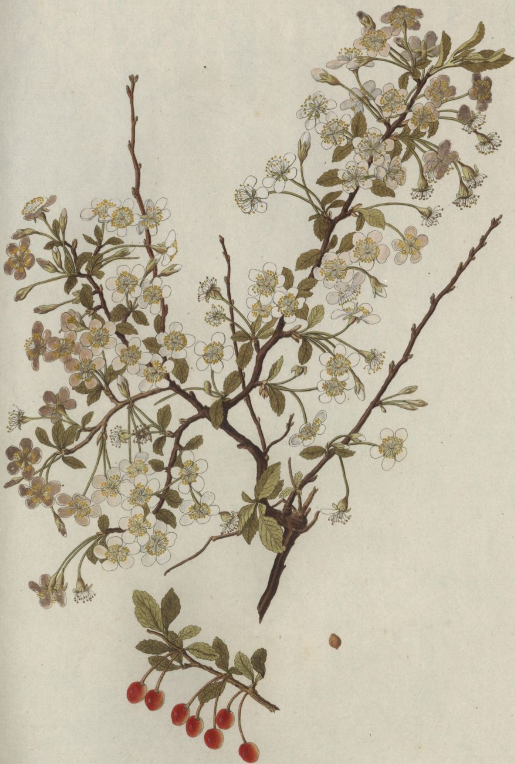
Prunus Chamaecerasus. Jacq. Coll. vol. 1.