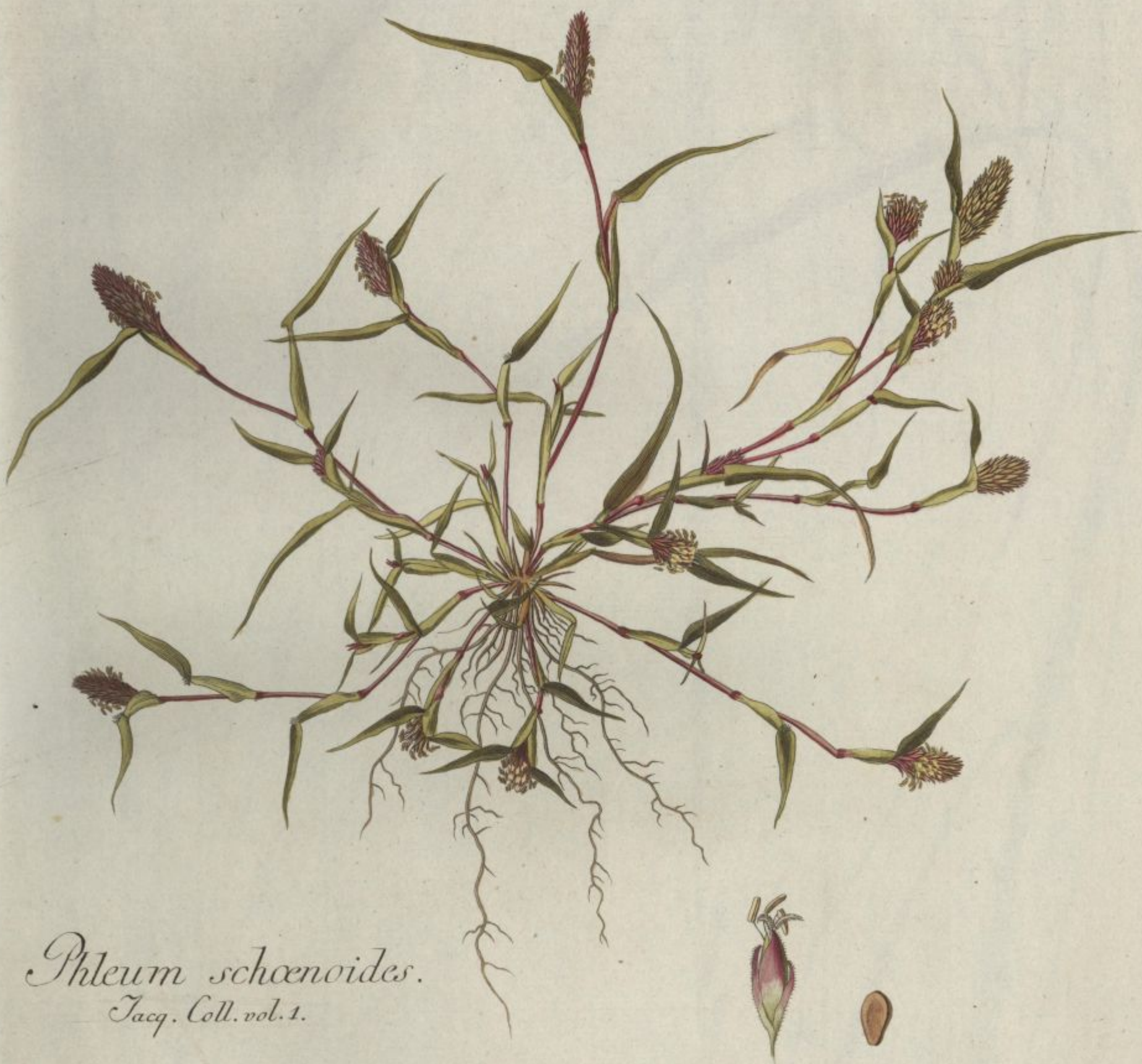
Phleum schoenoides. Jacq. Coll. vol. 1.