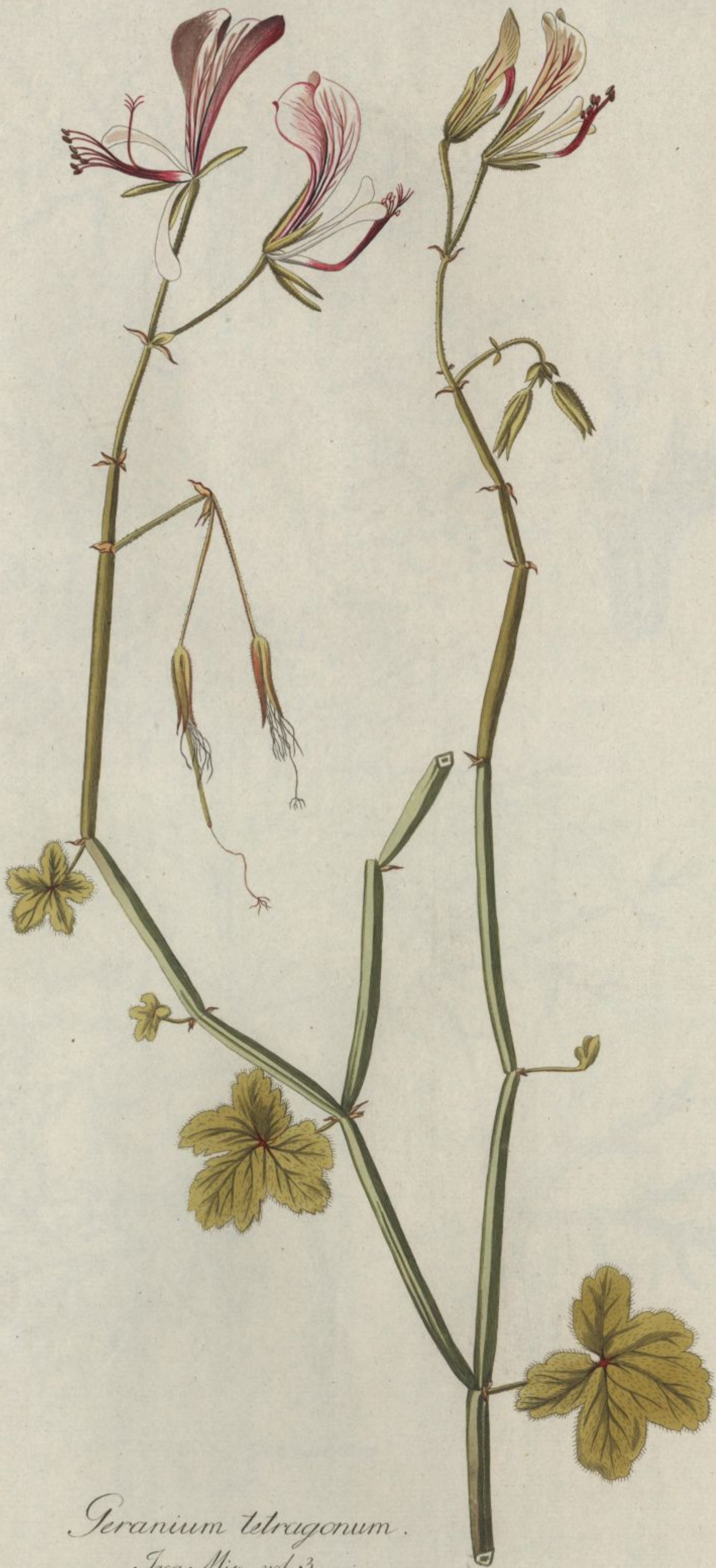
Geranium tetragonum. Jacq. Misc. vol. 3.