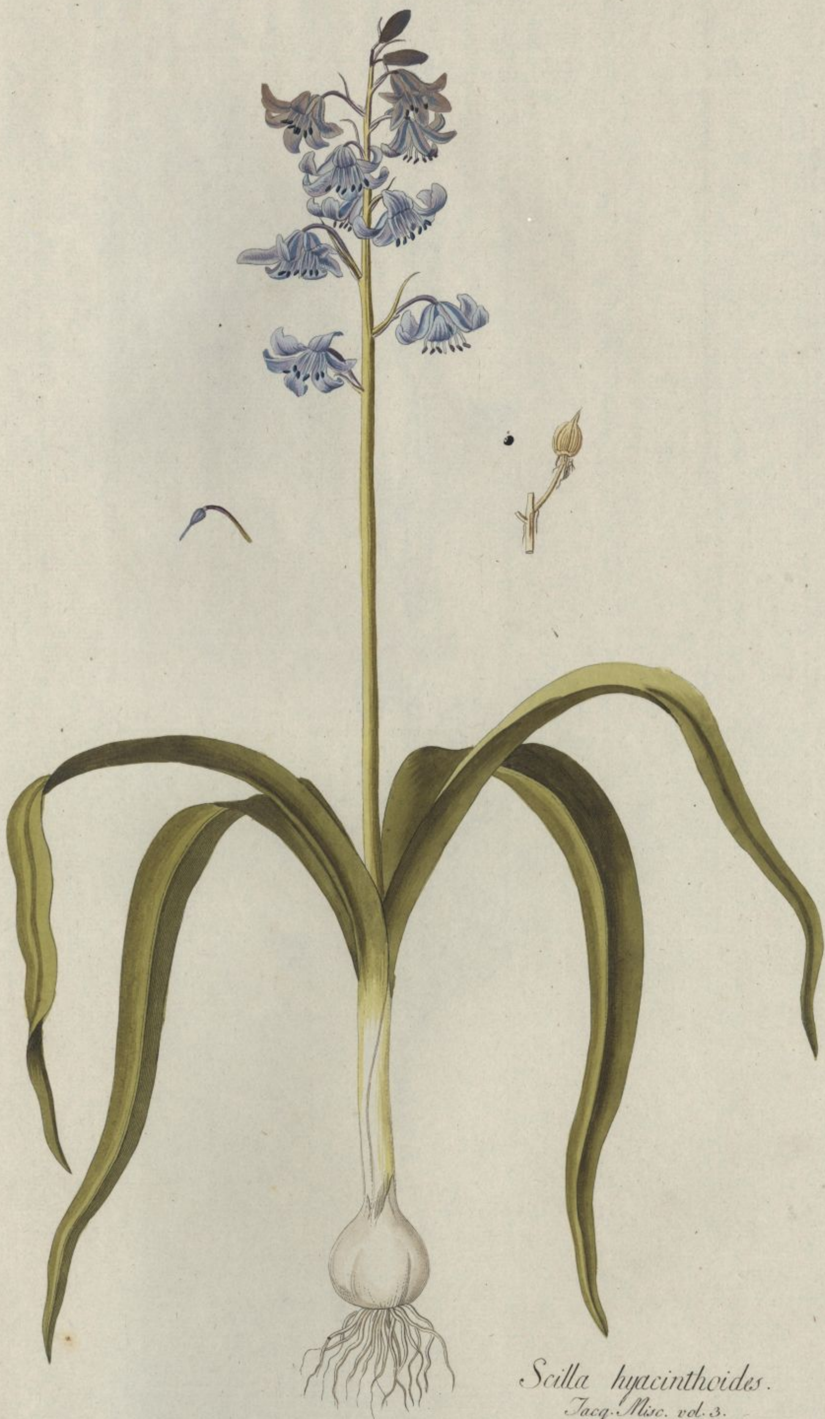
Scilla hyacinthoides. Jacq. Misc. vol. 3.