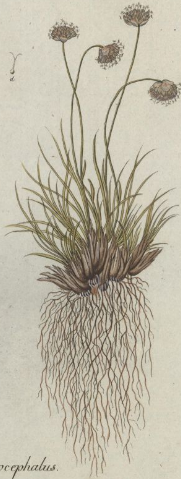
Cynosurus sphaerocephalus. jacq. Misc. vol. 2.