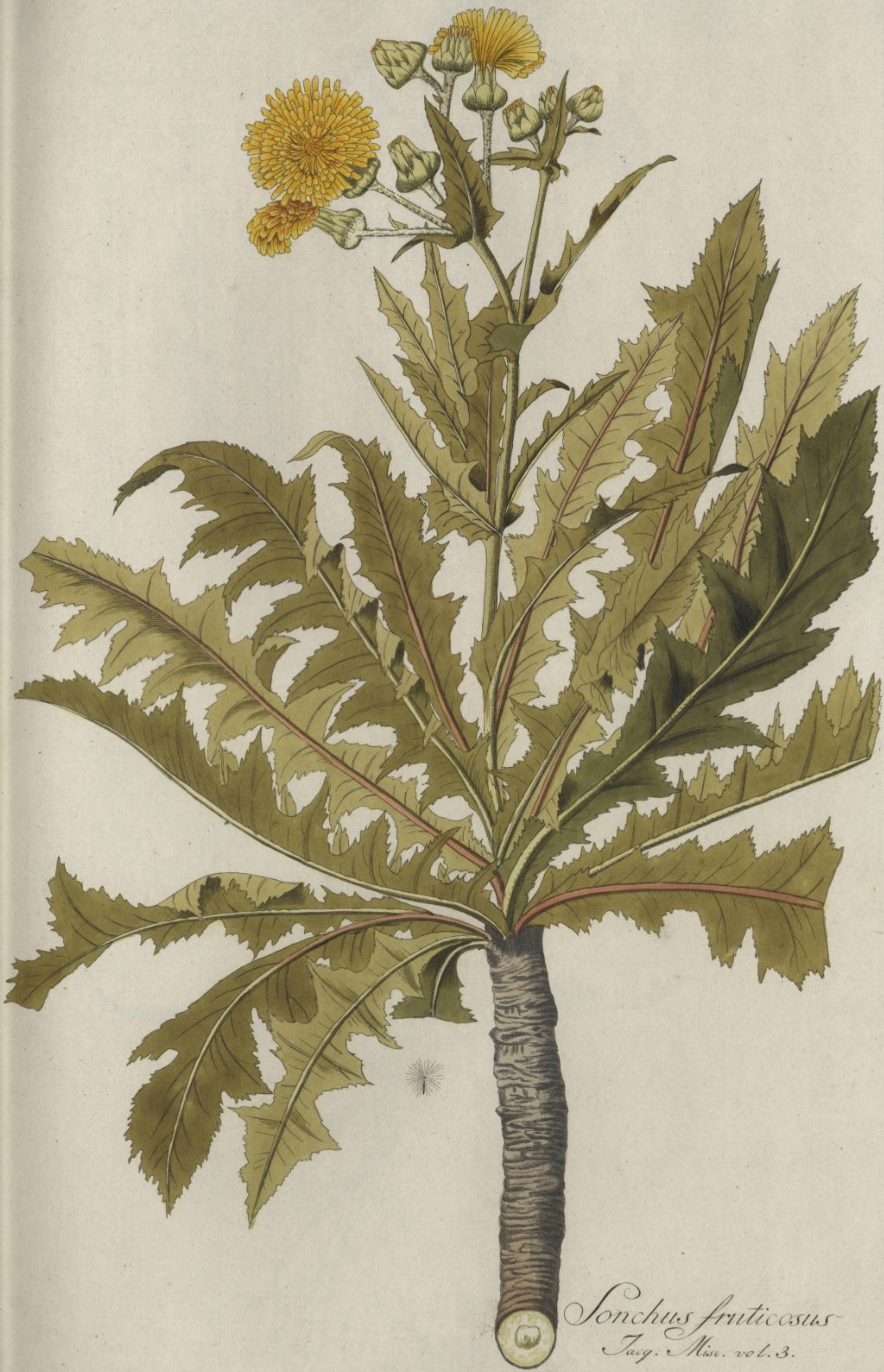
Sonchus fruticosus Jacq. Misc. vol. 3.