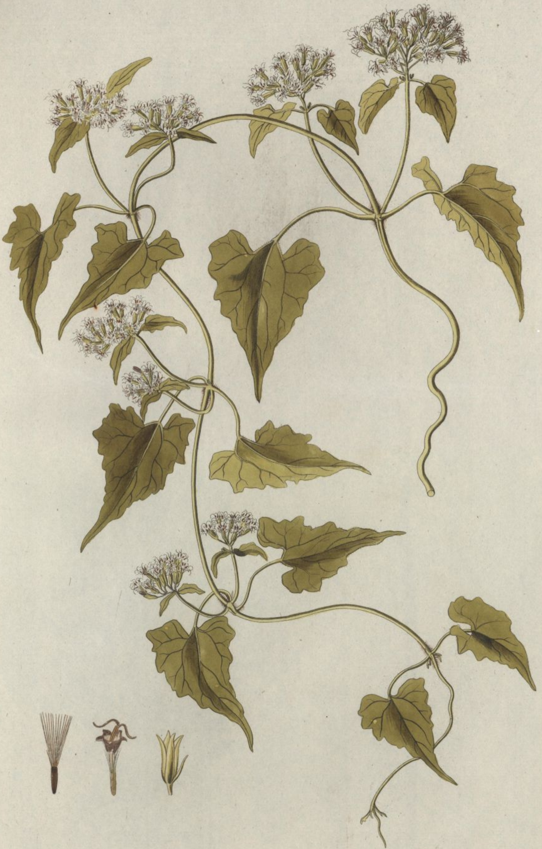
Eupatorium scandens. Jacq. Misc. vol. 3.