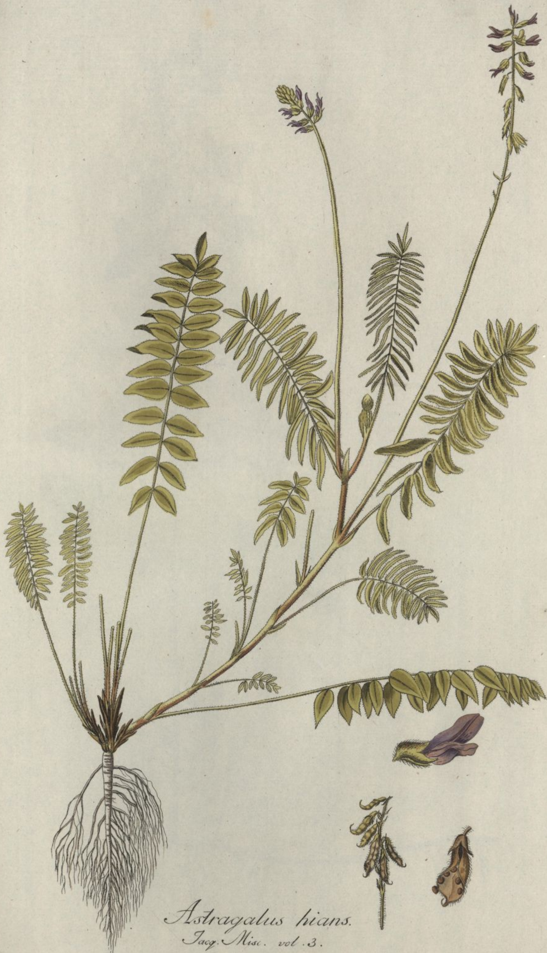
Astragalus hians. Jacq. Misc. vol. 3.