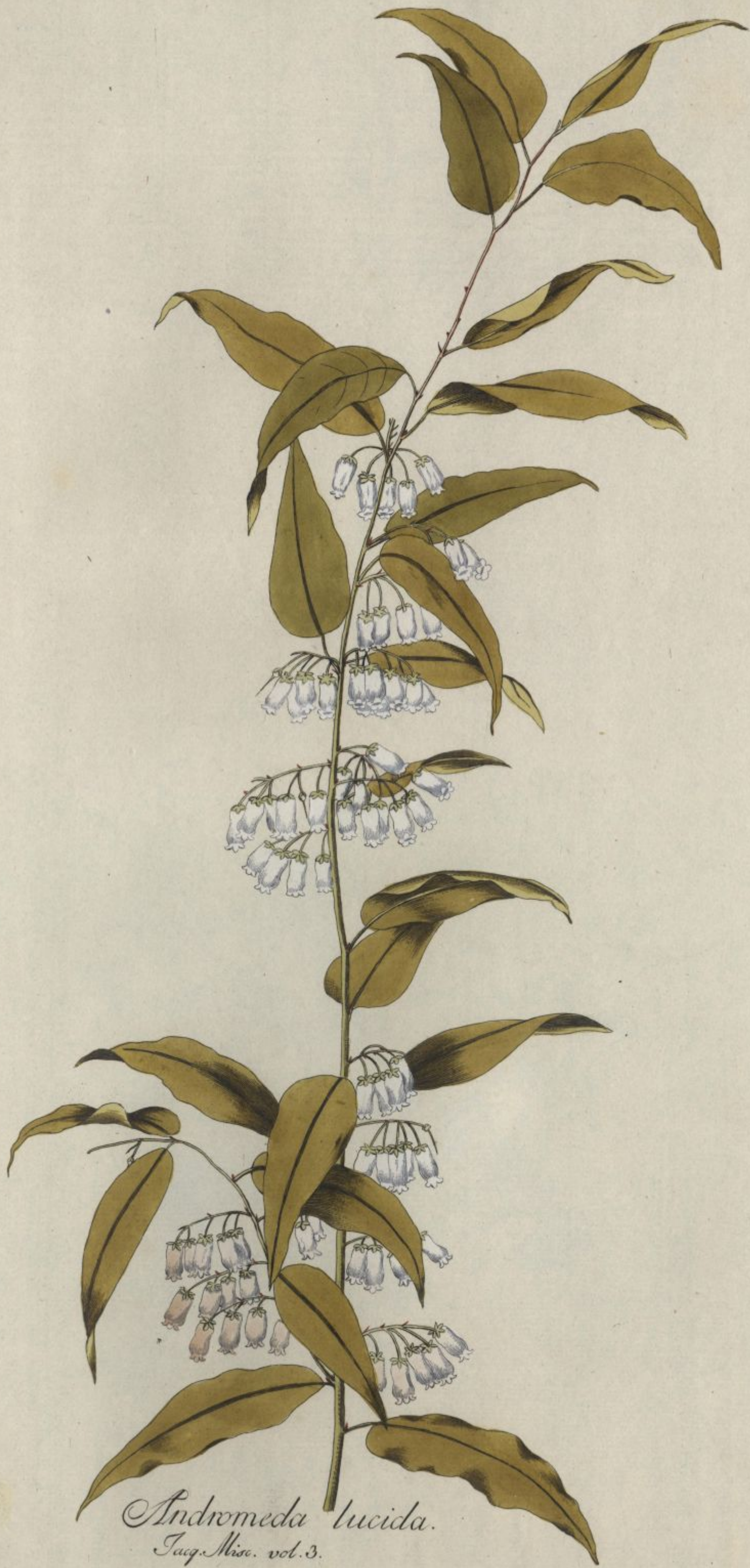
Andromeda lucida. Jacq. Misc. vol. 3.