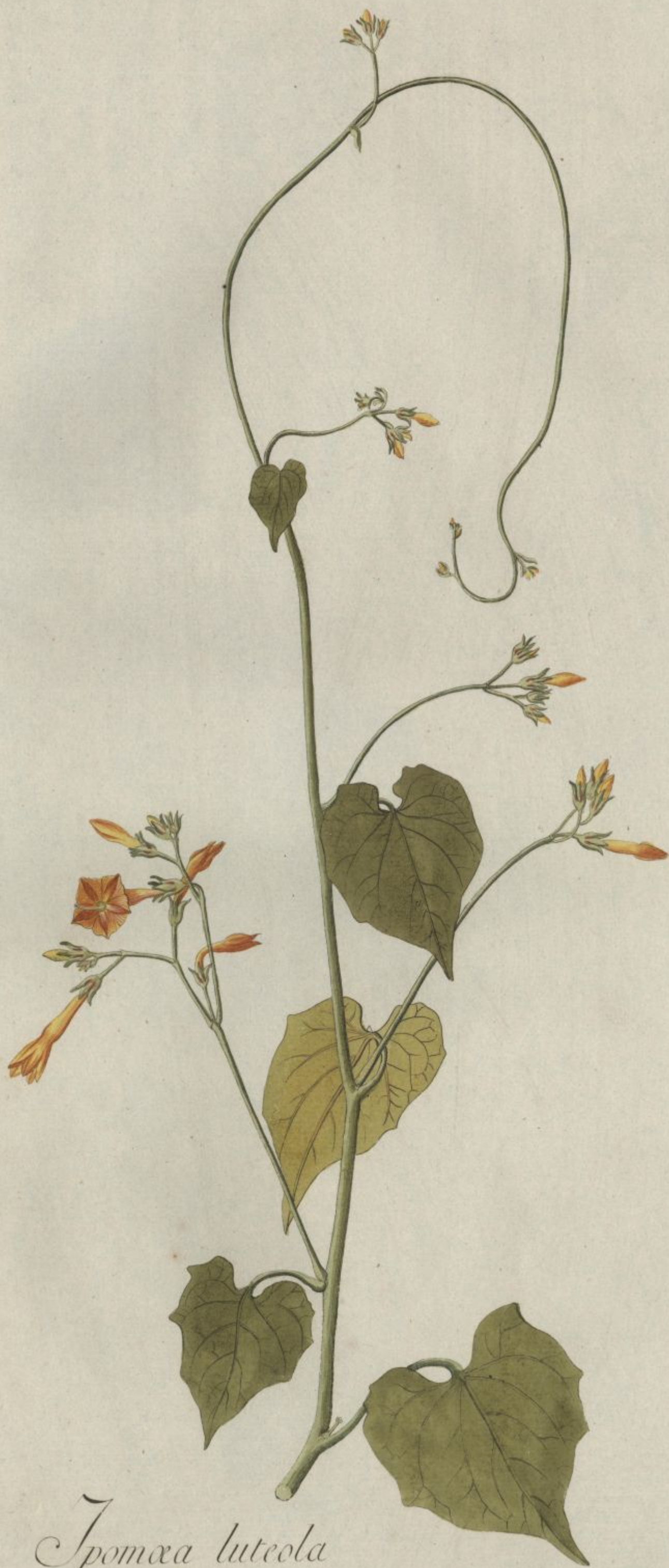
Ipomoea luteola Jacq. Coll. vol. 2.