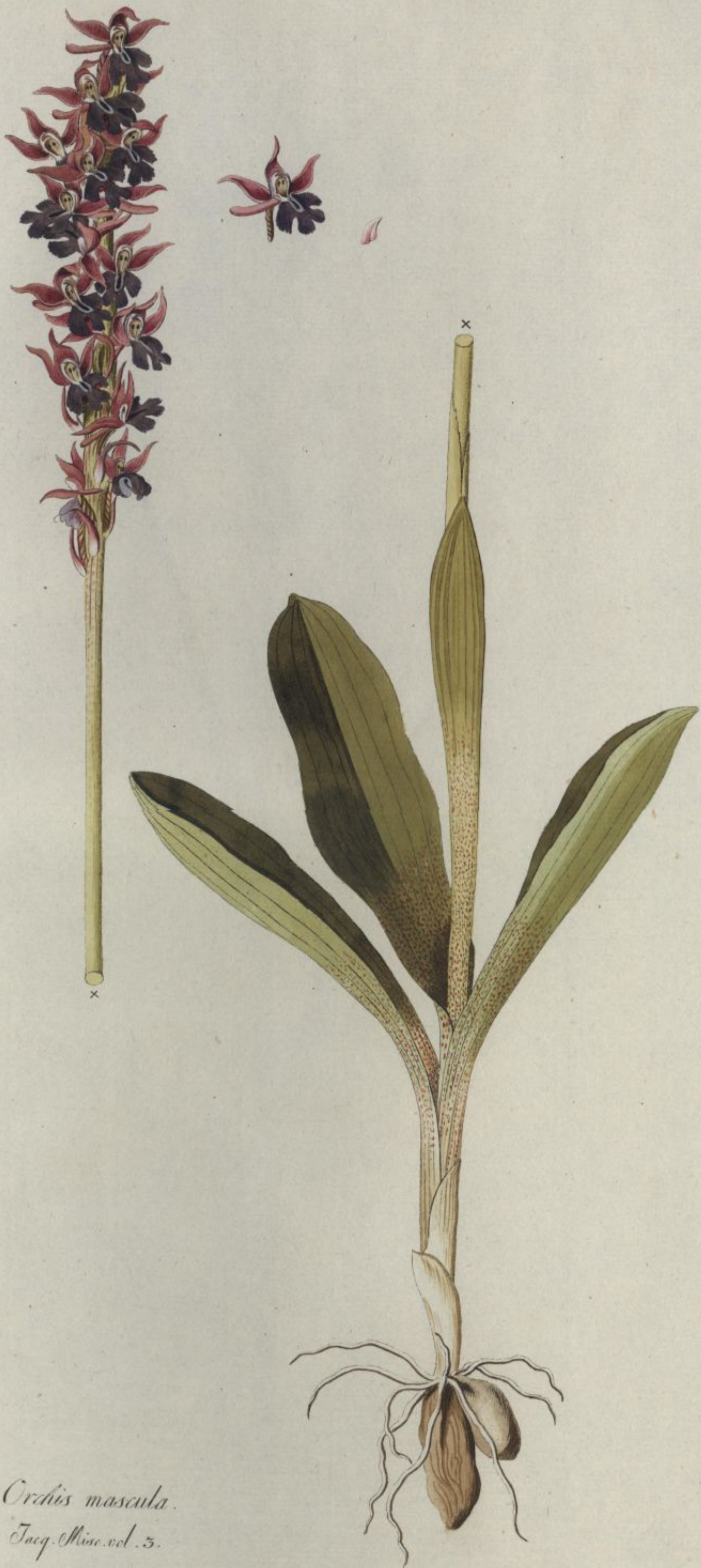
Orchis mascula. Jacq. Misc. vol. 3.