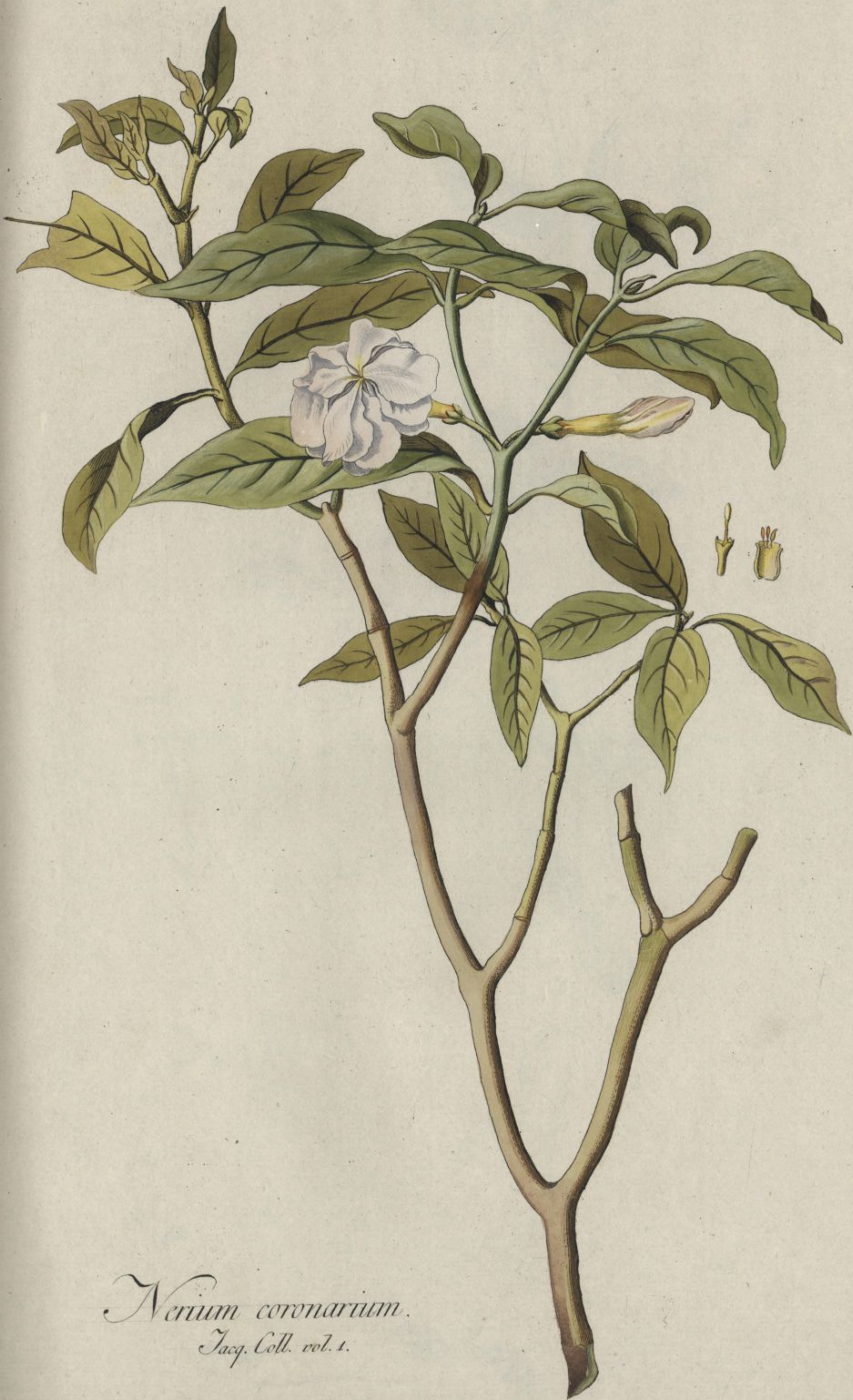
Nerium coronarium. Jacq. Coll. vol. 1.