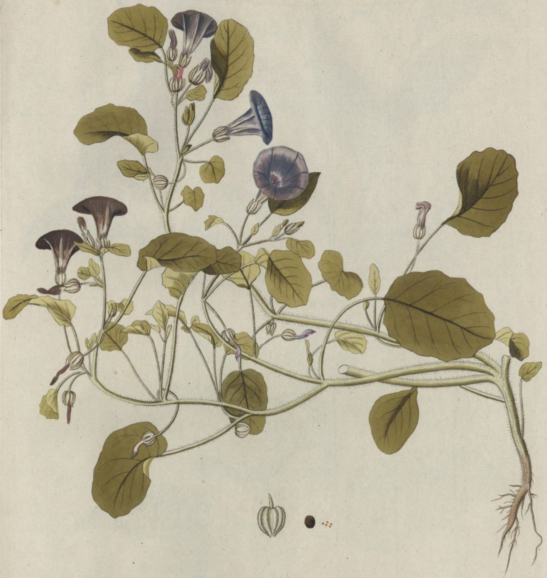
Physalis prostrata. Jacq. Misc. vol. 3.