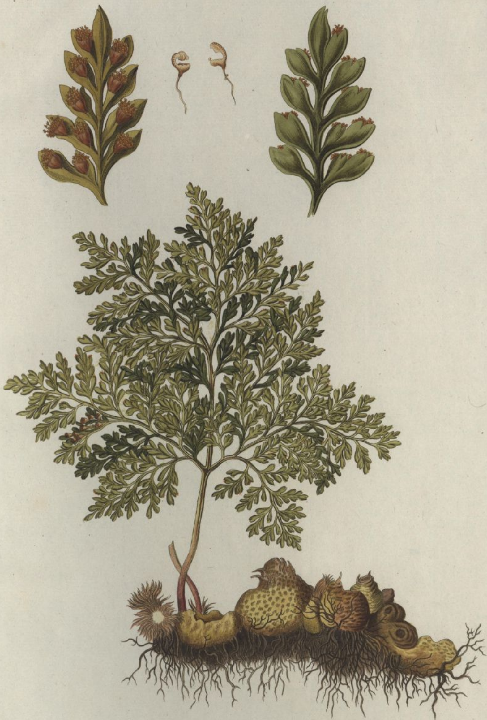
Trichomanes canariense. Jacq. Coll. vol. 1.