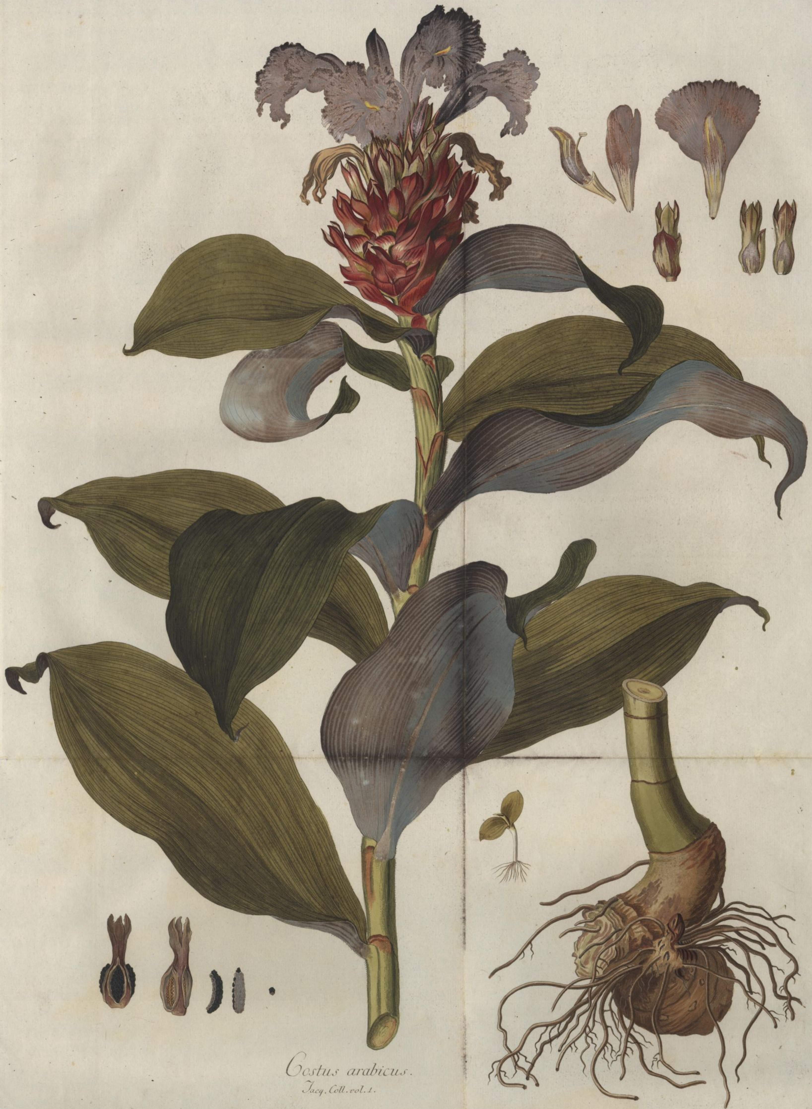
Costus arabicus. Jacq. Coll. vol. 1.