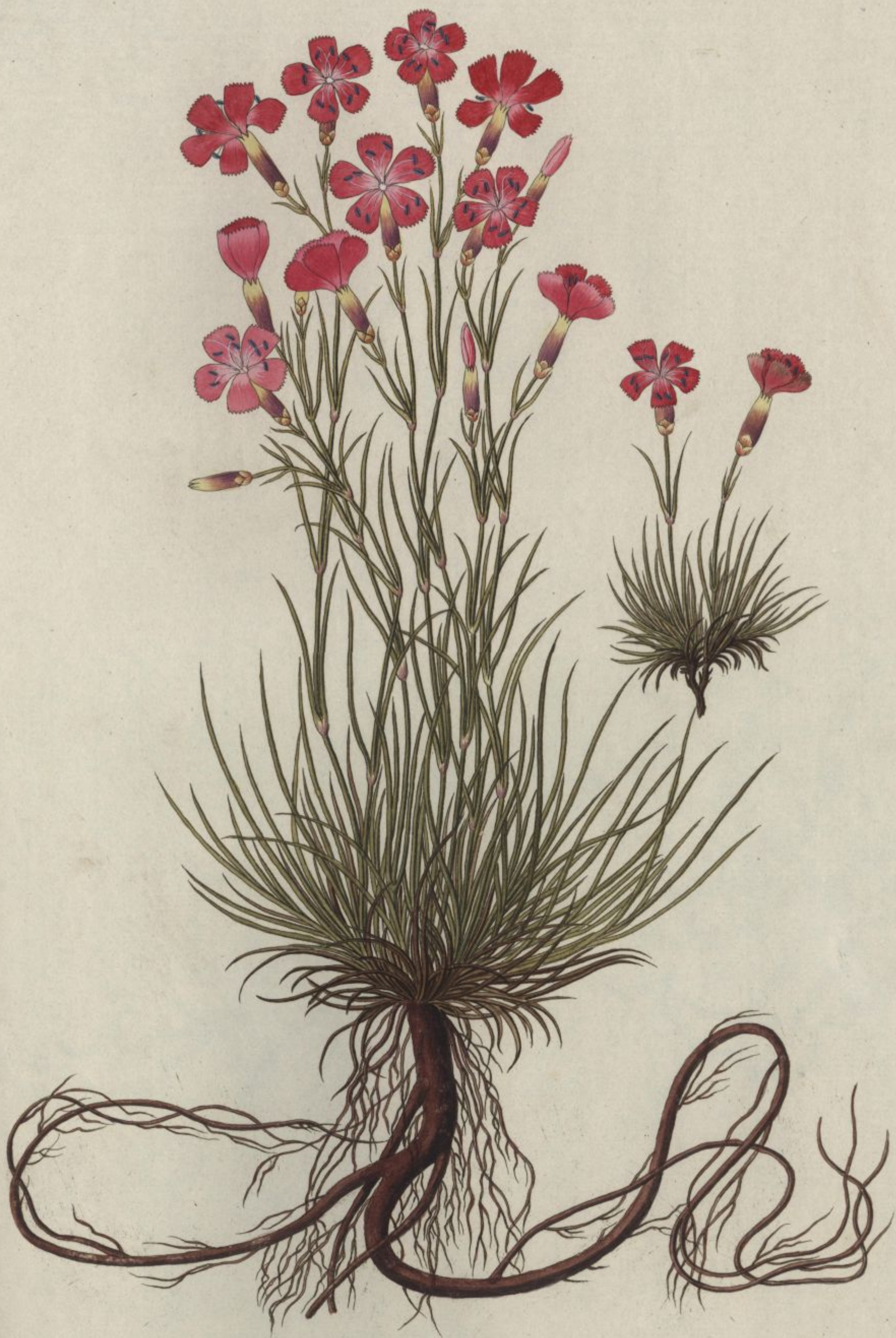
Dianthus sylvestris. Jacq. Coll. vol. 1.