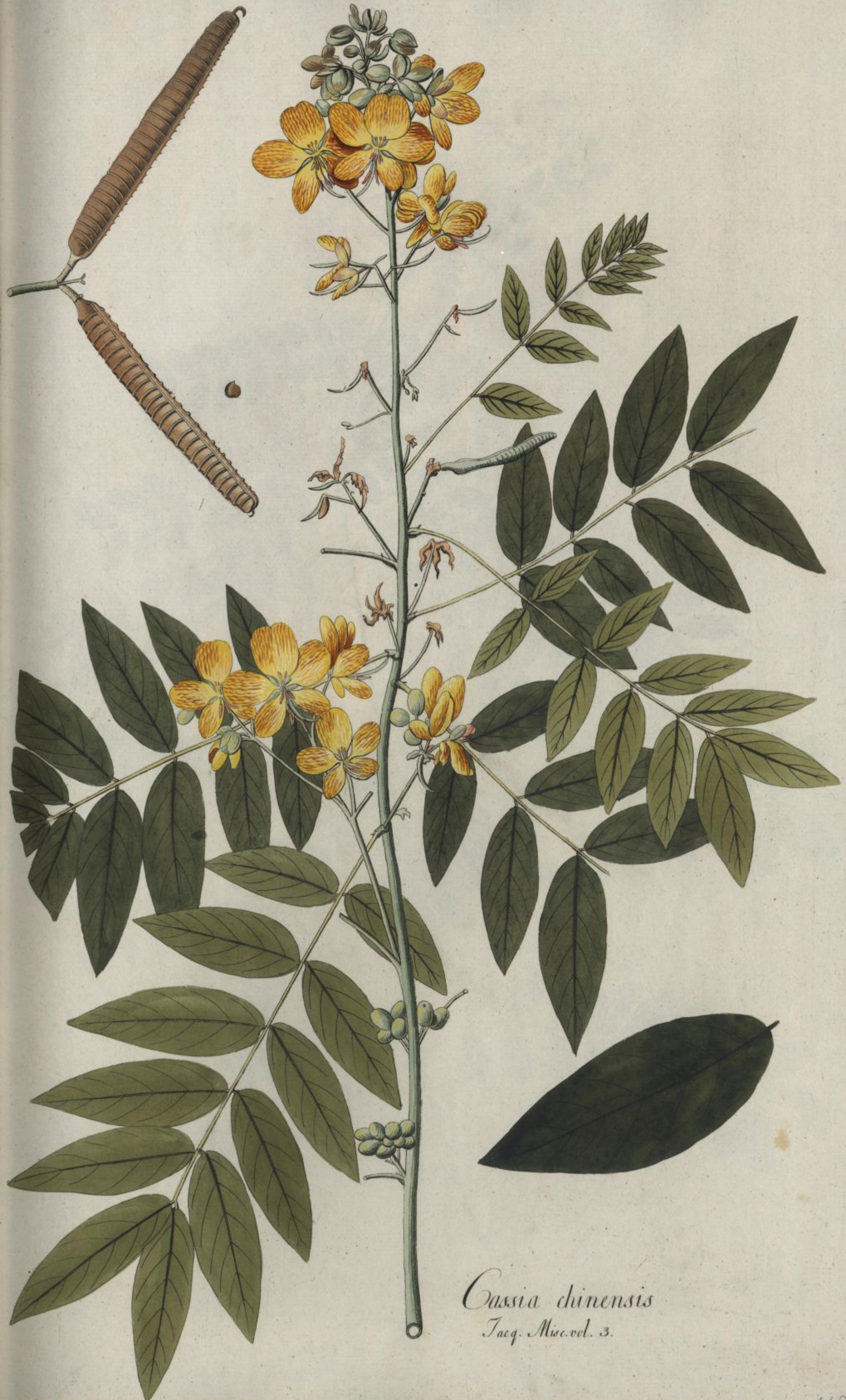
Cassia chinensis Jacq. Misc. vol. 3.