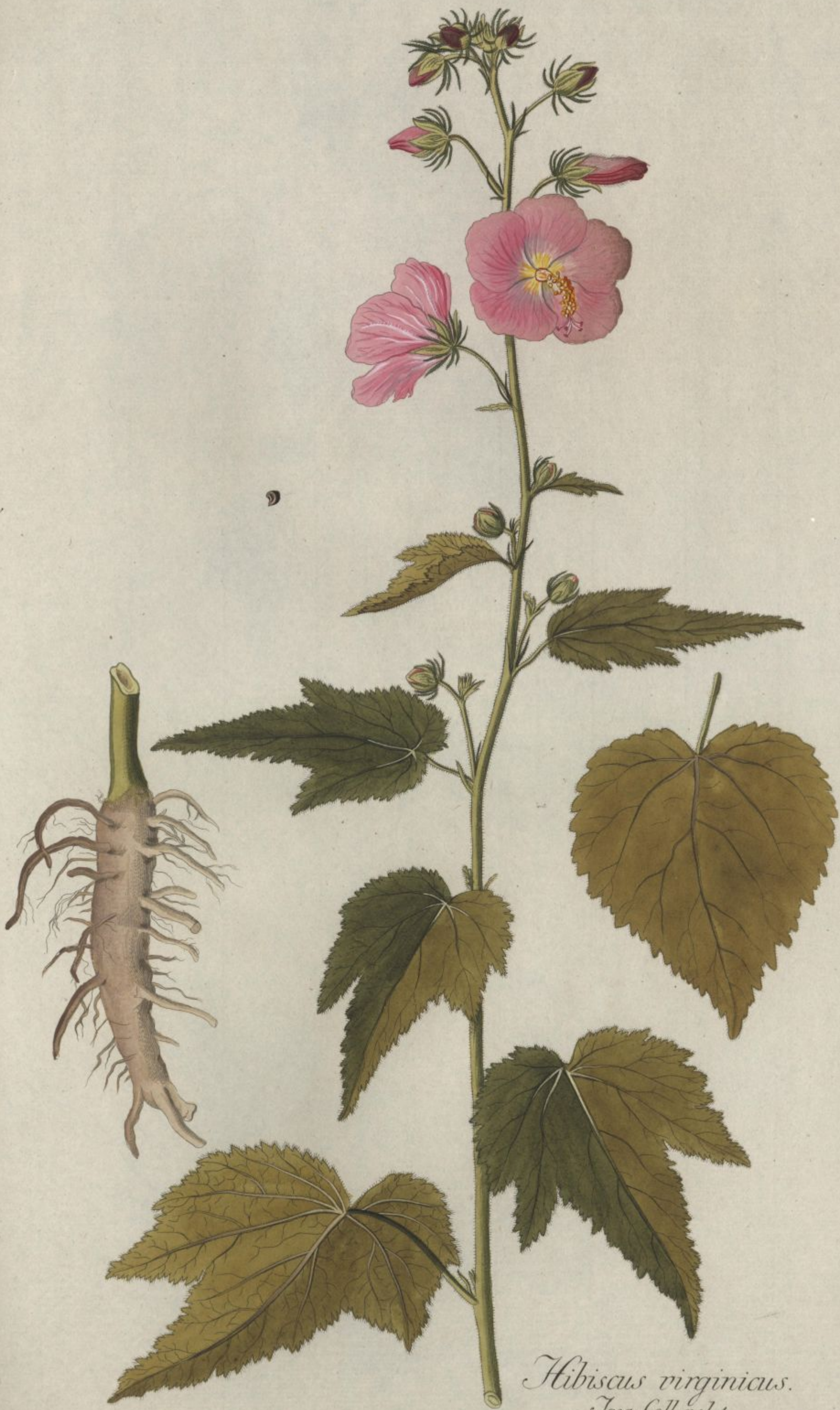
Hibiscus virginicus. Jacq. Coll. vol. 1.