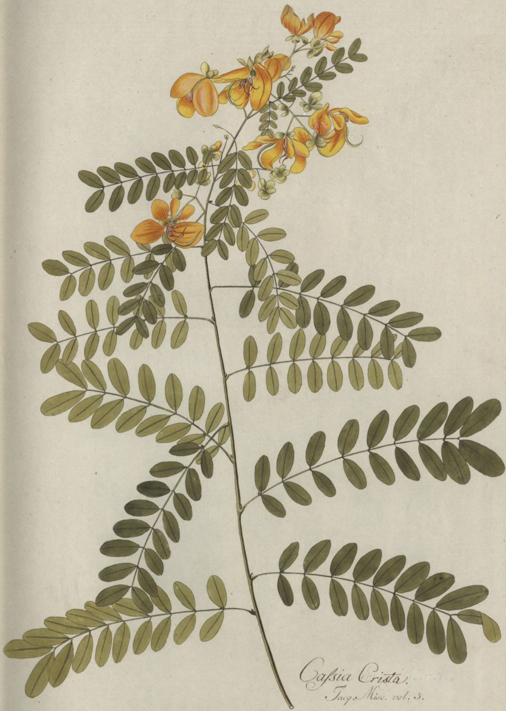
Cassia Crista Jacq. Misc. vol. 3.