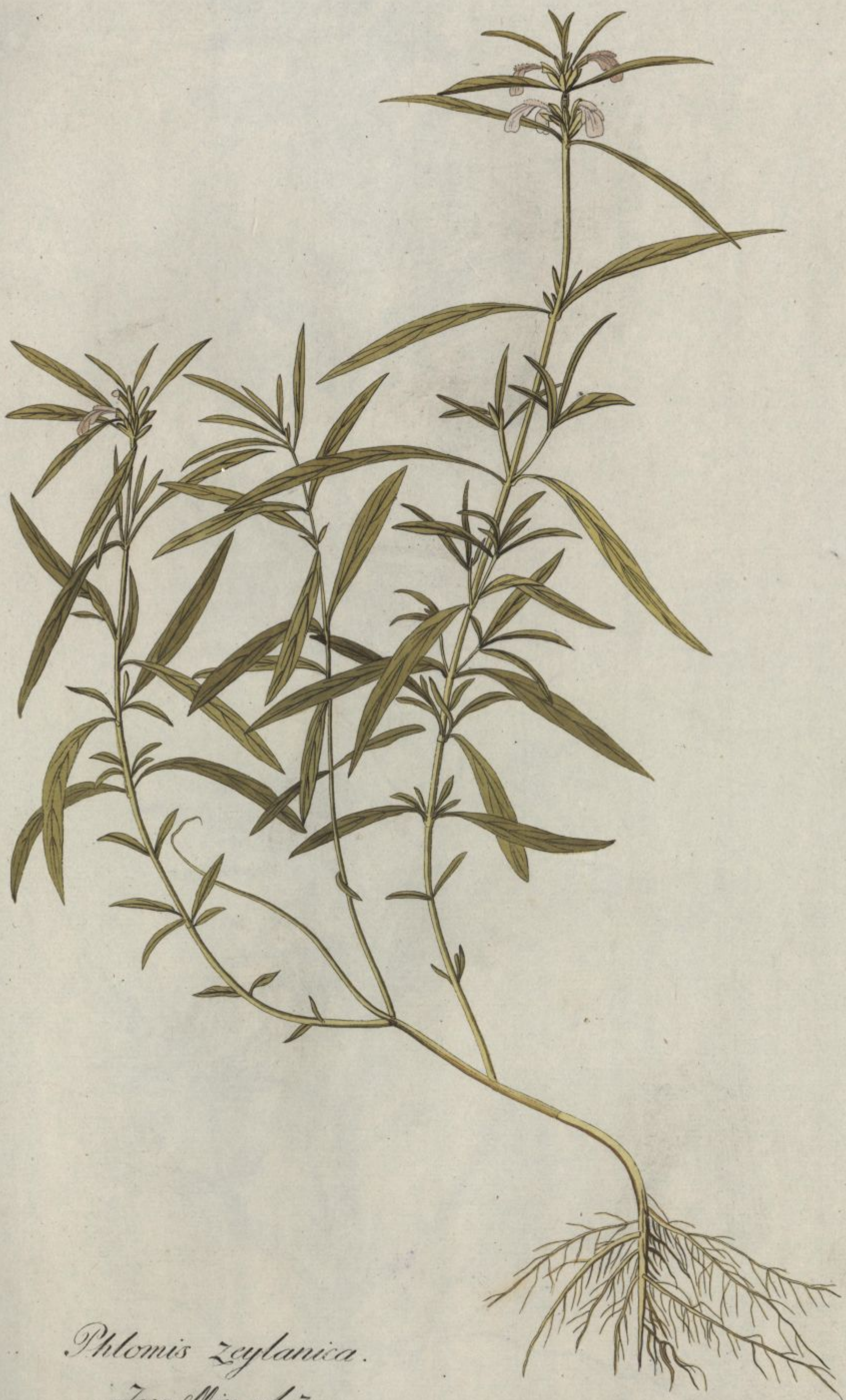
Phlomis zeylanica. Jacq. Misc. vol. 5.