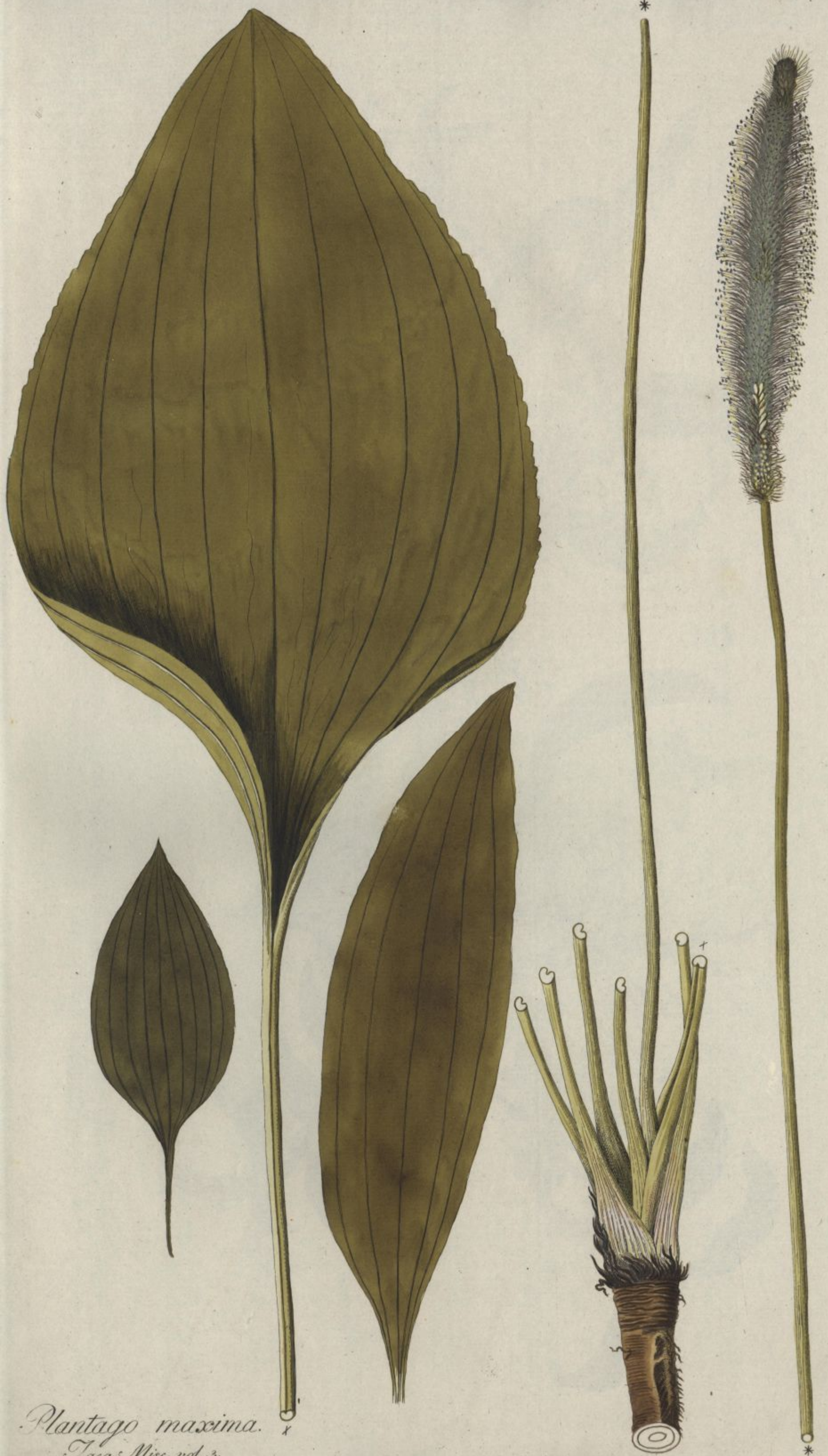
Plantago maxima. Tacq. Misc. vol. 3.