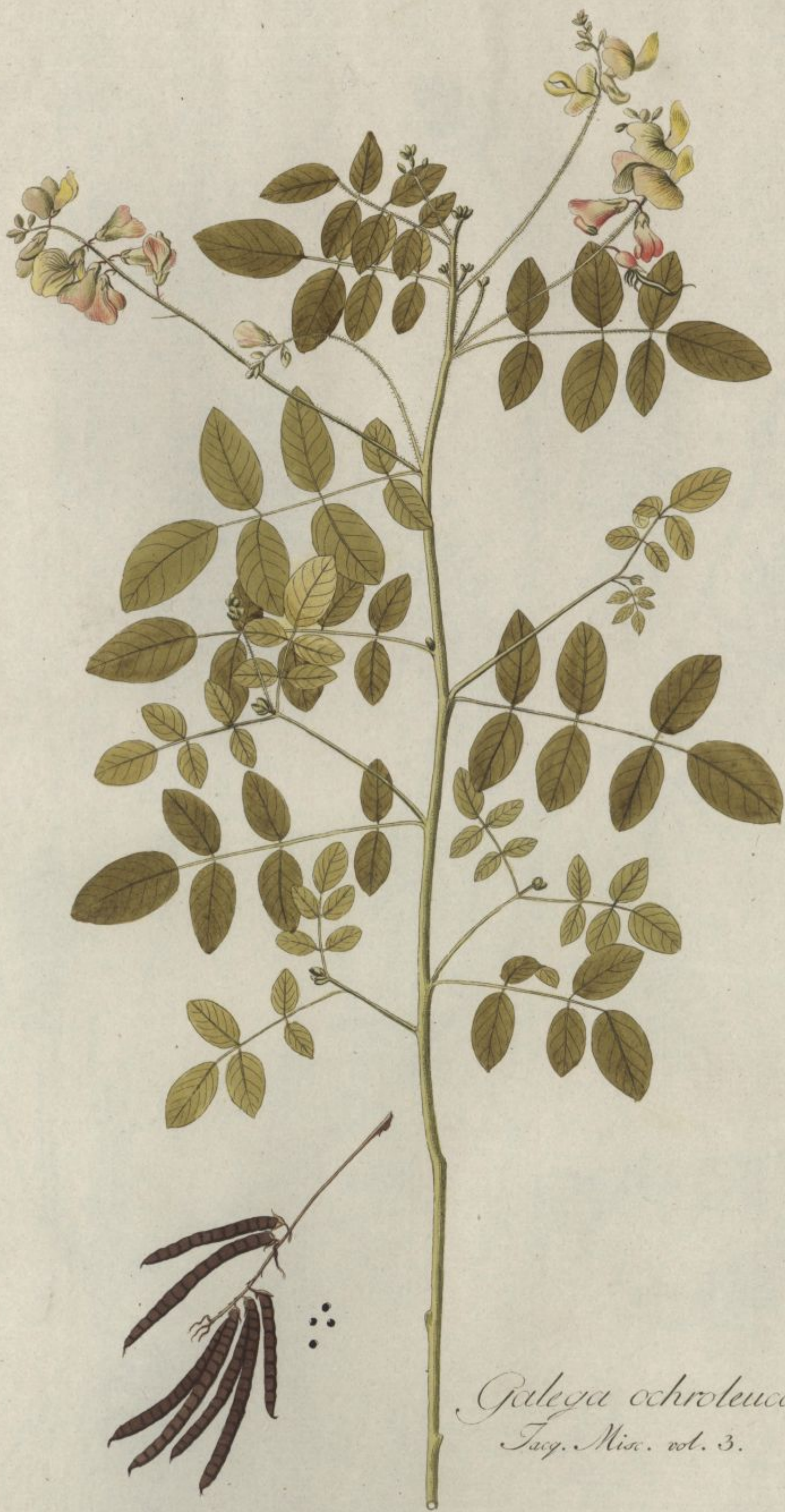
Galega ochroleuca. Jacq. Misc. vol. 3.