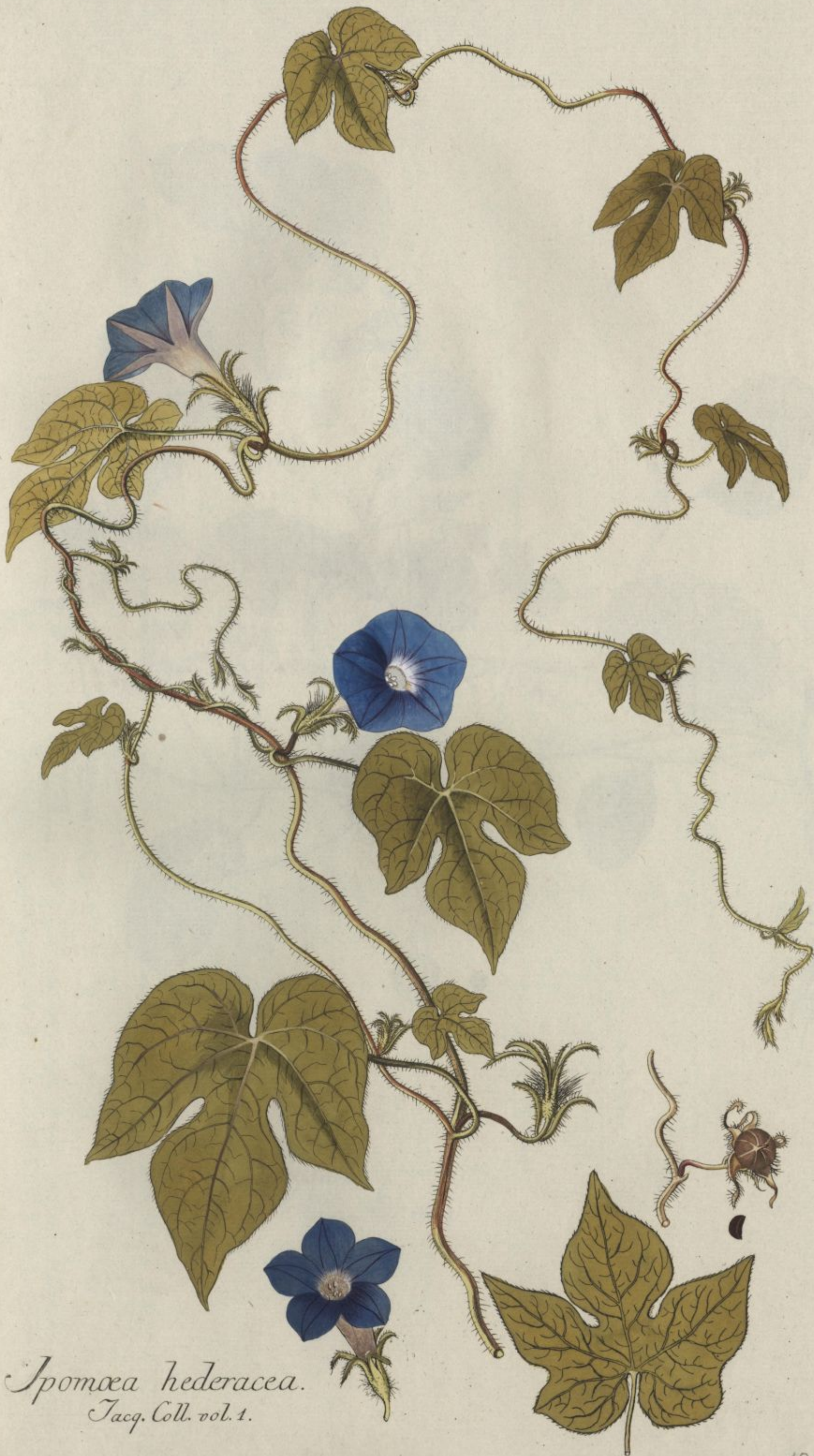
Ipomoea hederacea. Jacq. Coll. vol. 1.