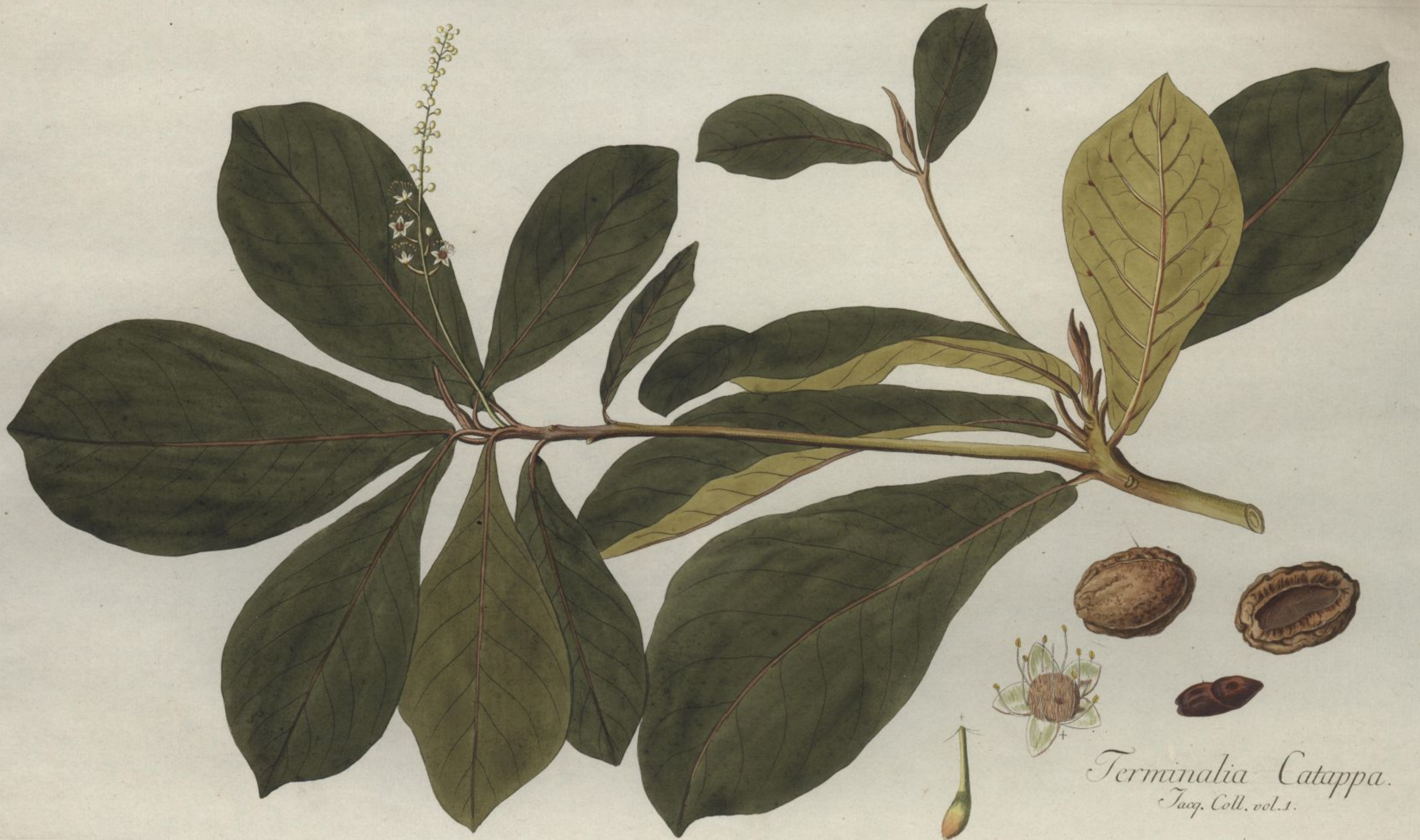
Terminalia Catappa. Jacq. Coll. vol. 1.