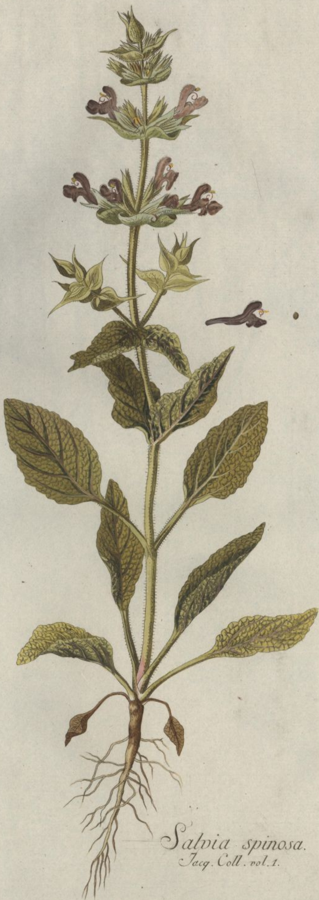
Salvia spinosa. Jacq. Coll. vol. 1.