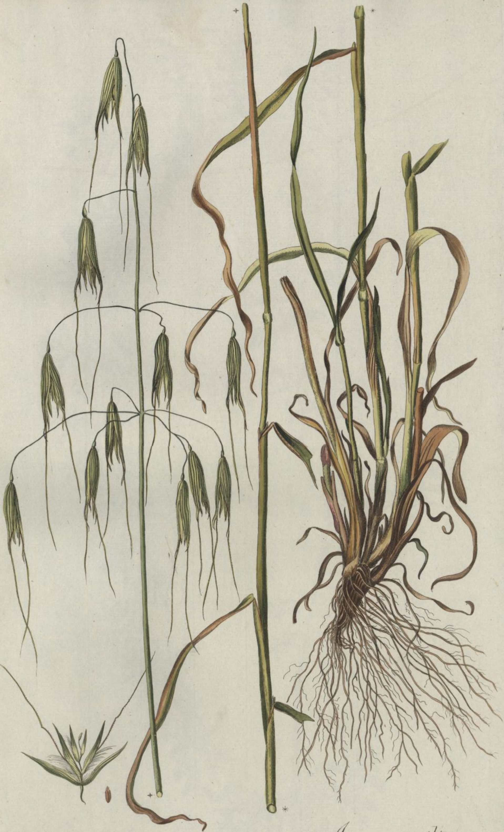
Avena sterilis. Jacq. Coll. vol. 1.