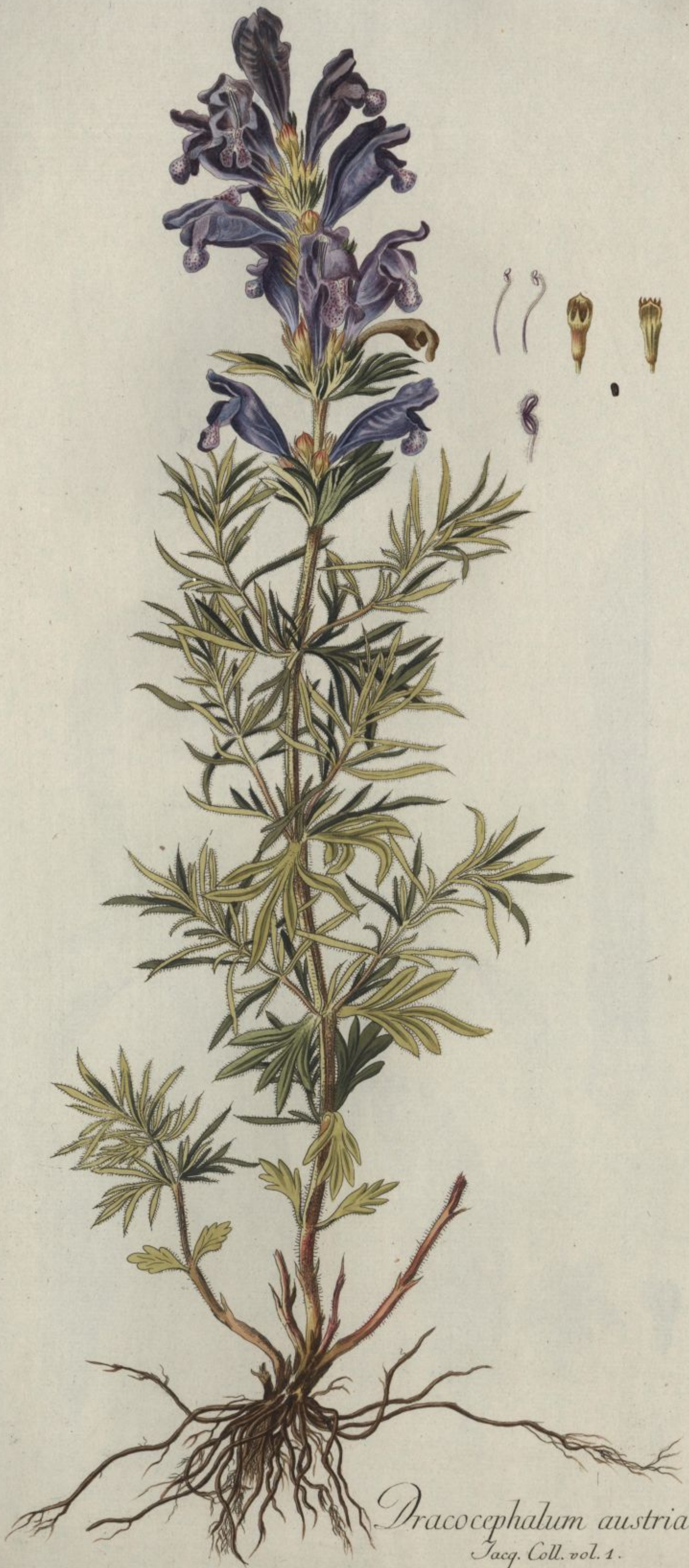
Dracocephalum austriacum. Jacq. Coll. vol. 1.