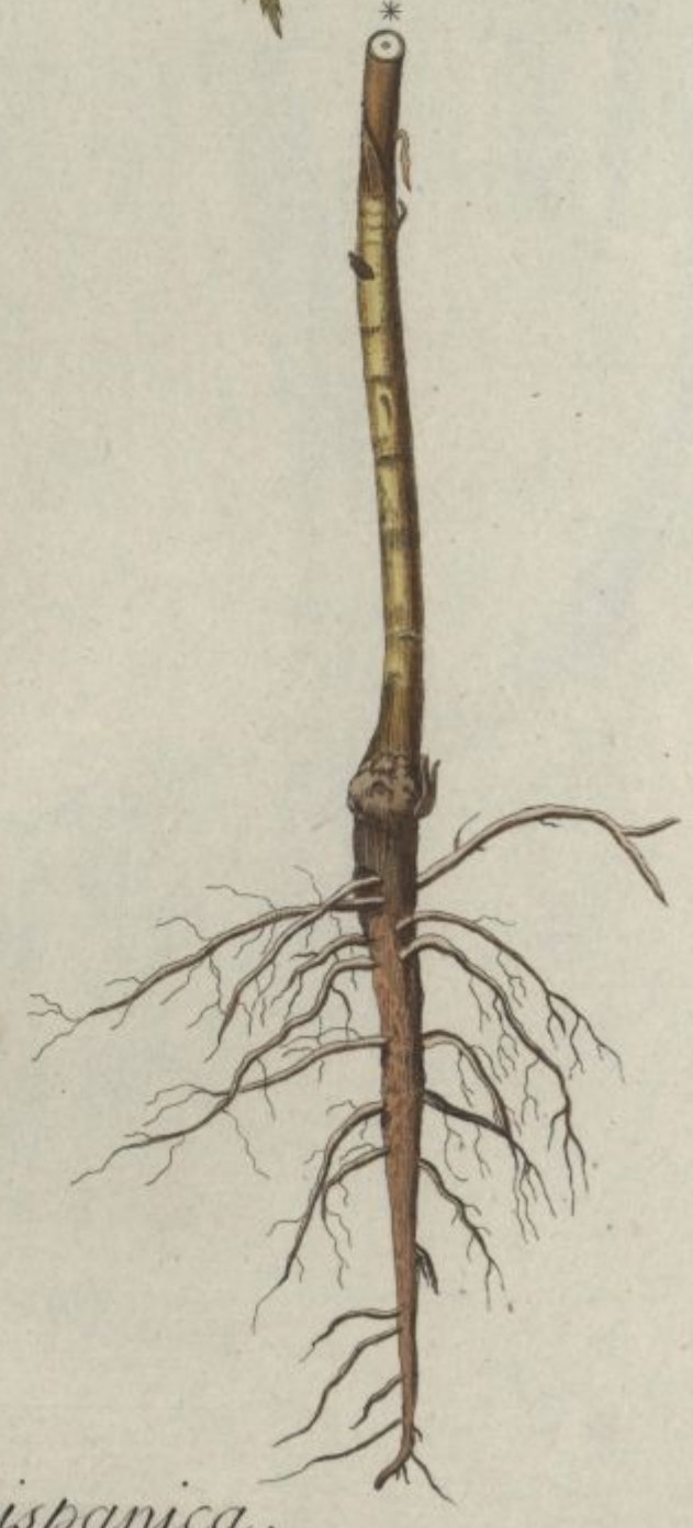
Artemisia hispanica. Jacq. Misc. vol. 3.