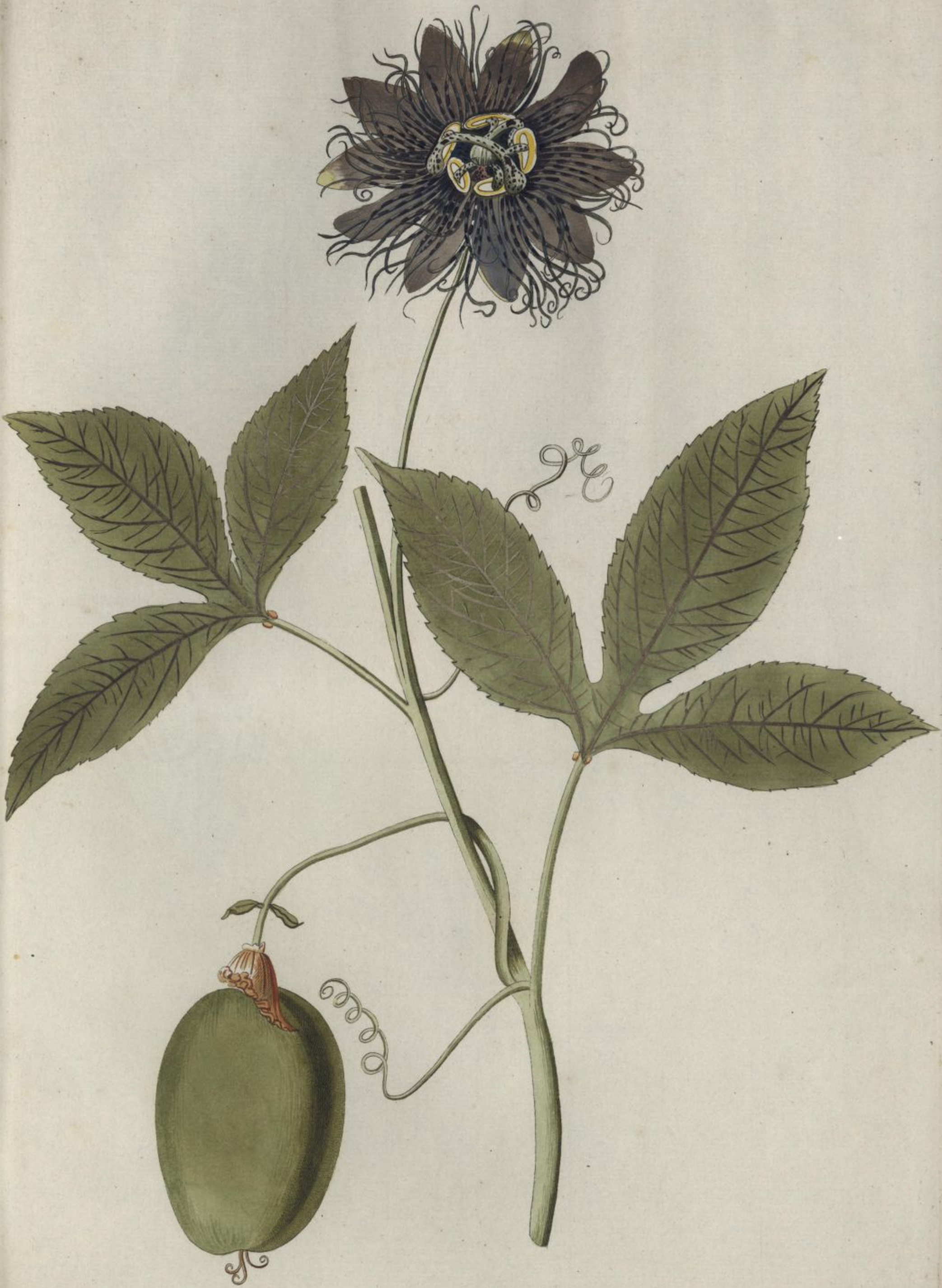
Passiflora incarnata. Jacq. Misc. vol. 3.