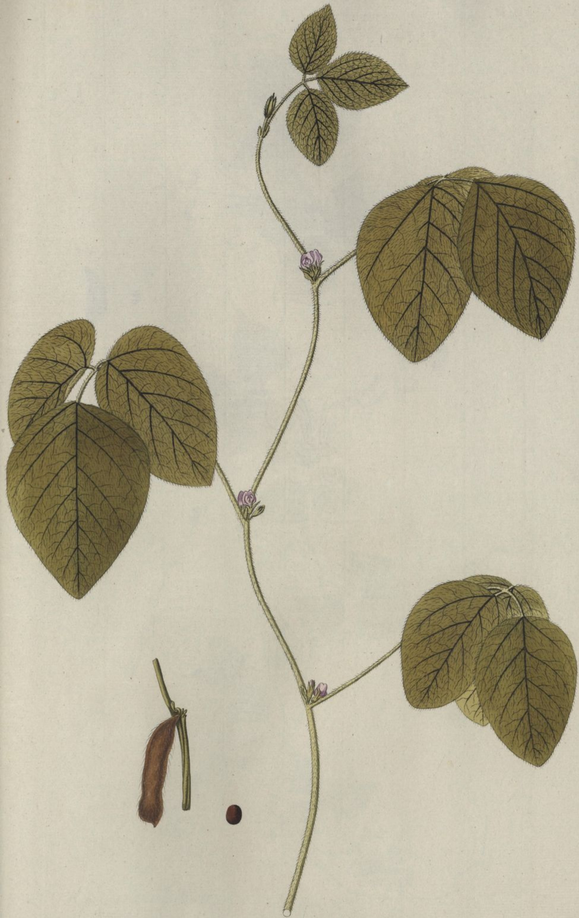
Dolichos Soja. Jacq. Misc. vol. 3.