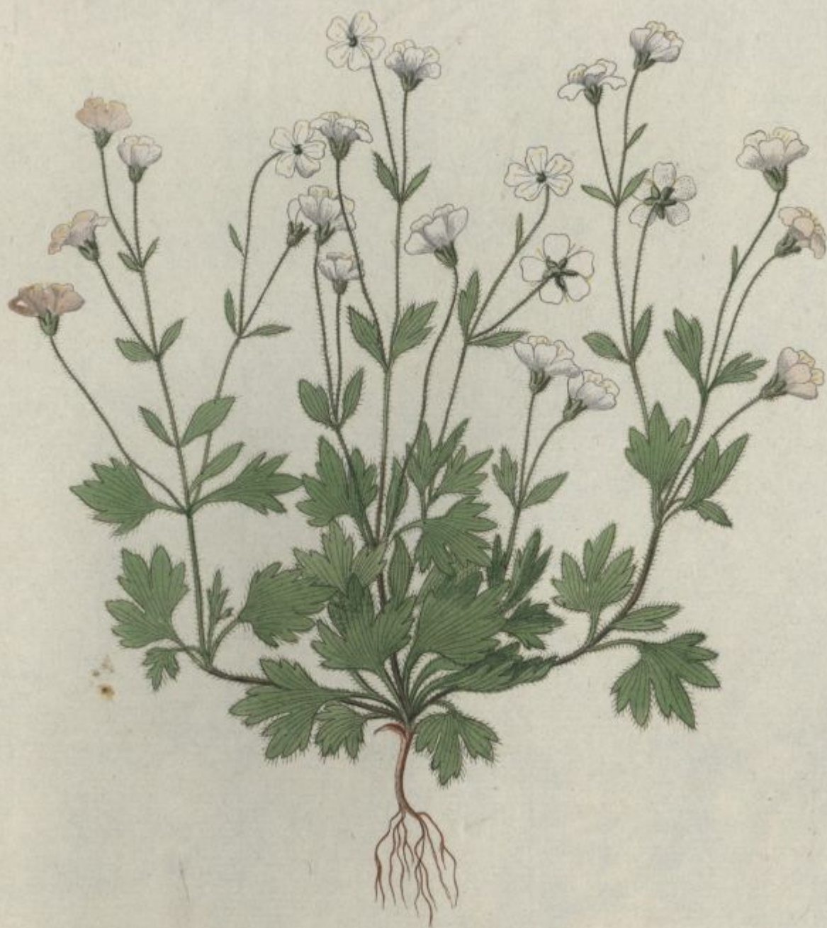
Saxifraga petraea. Jacq. Coll. vol. 1.