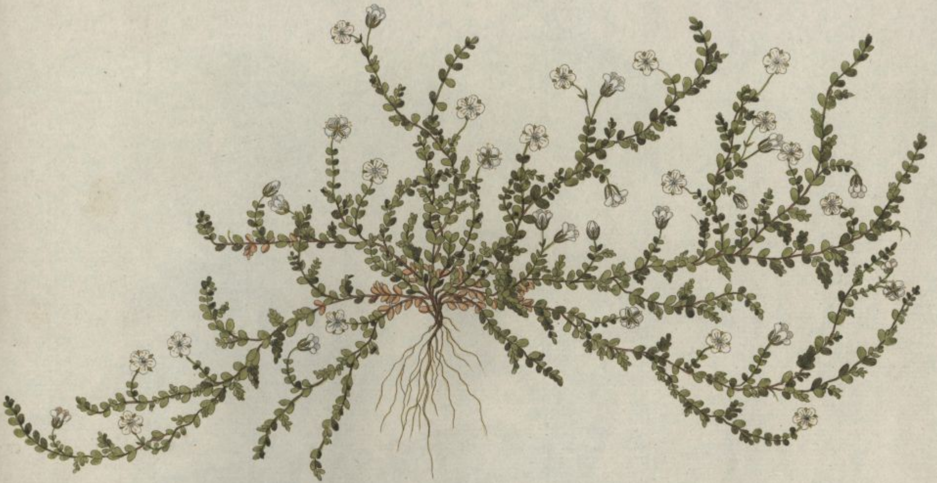
Arenaria biflora Jacq. Coll. vol. 1.