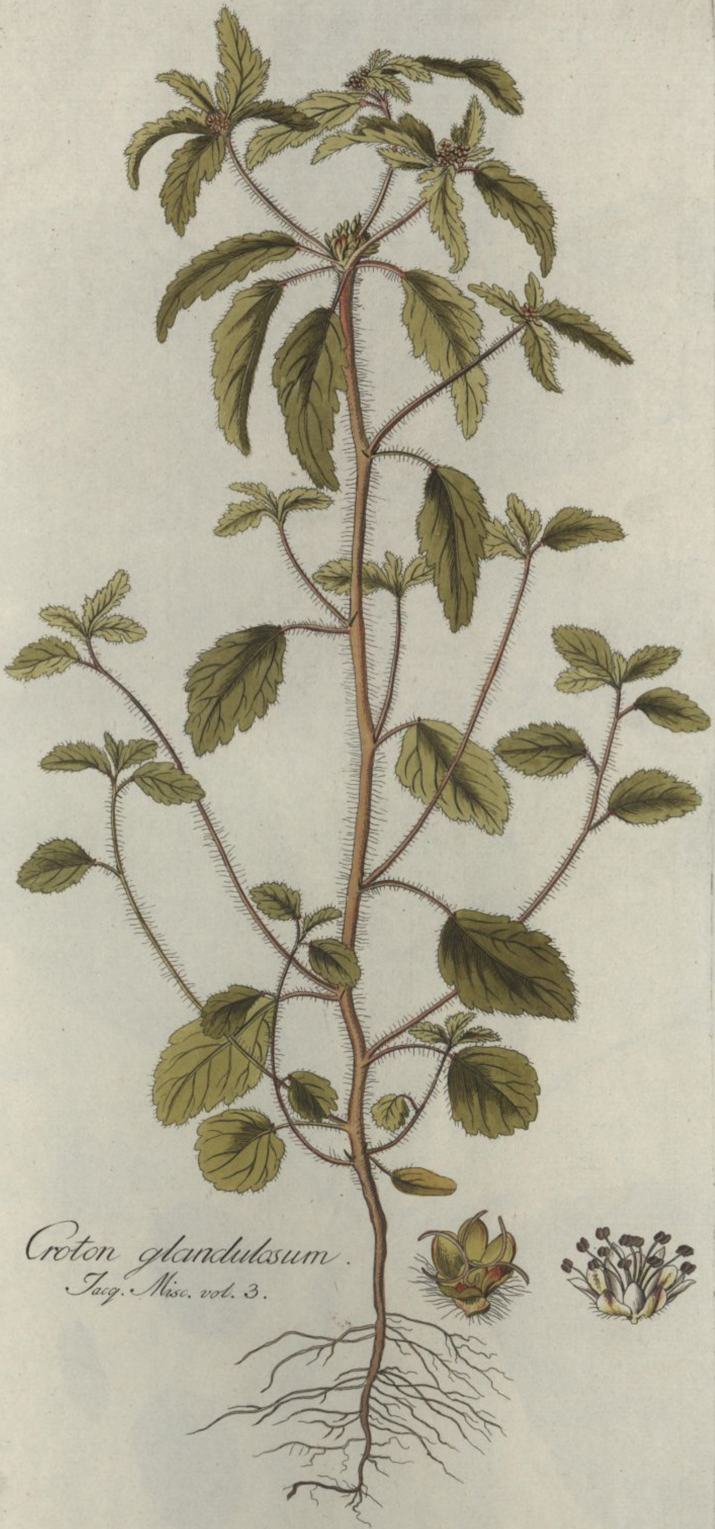
Croton glandulosum . Jacq. Misc. vol. 3.