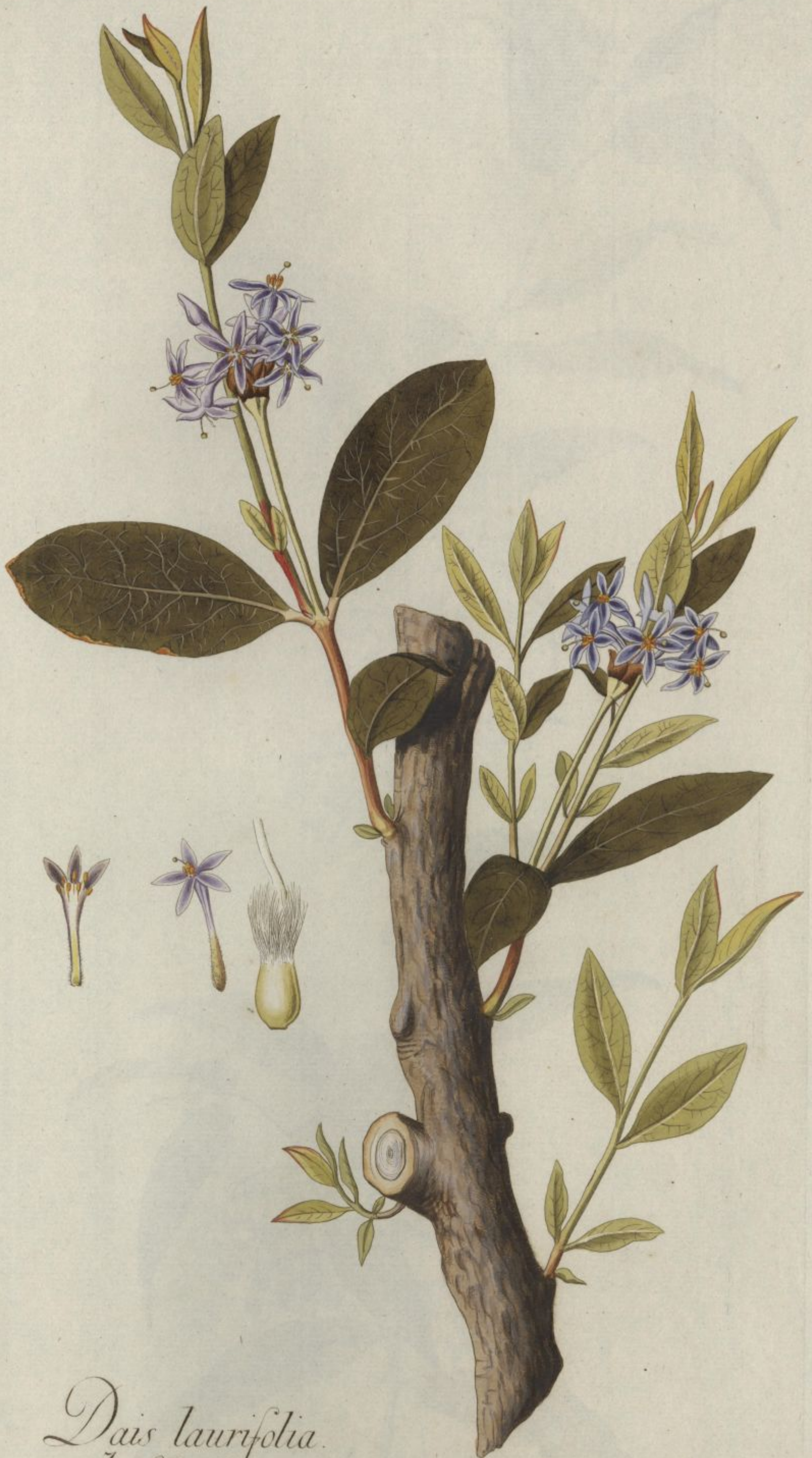
Dais laurifolia. Jacq. Coll. vol. 1.