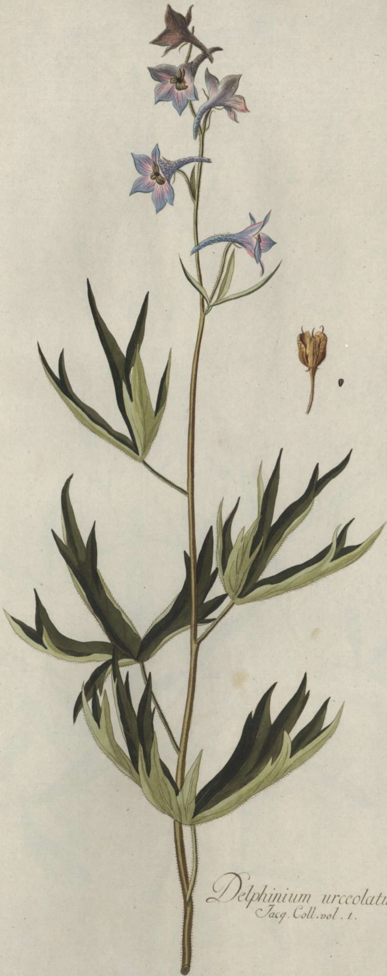
Delphinium urceolatum. Jacq. Coll. vol. 1.