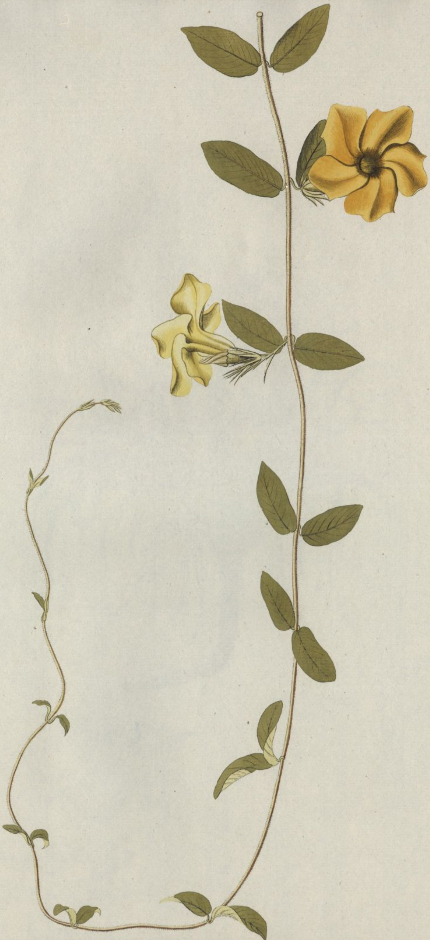
Echites domingensis. Jacq. Misc. vol. 3.