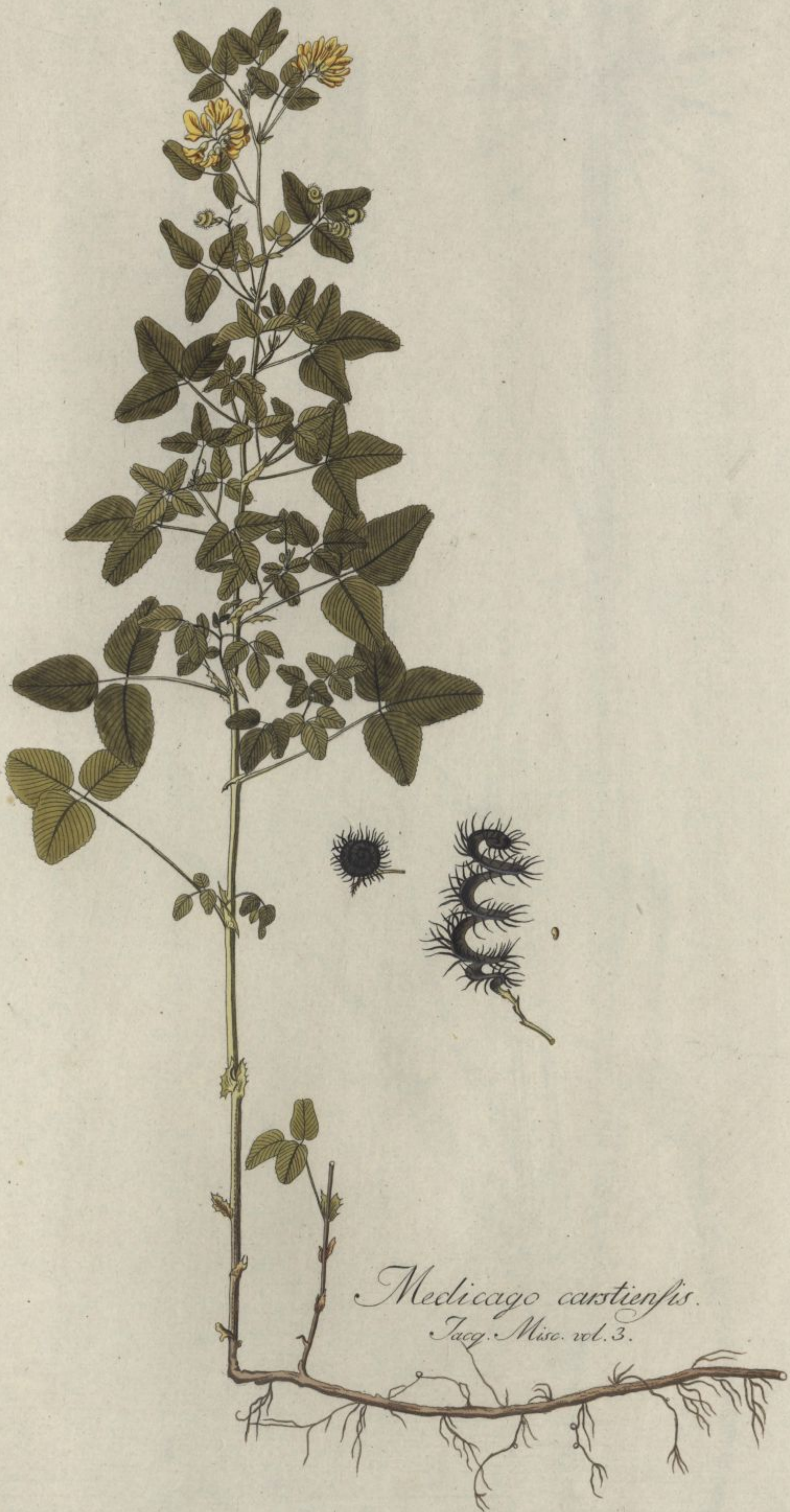
Medicago carstiensis. Jacq. Misc. vol. 3.