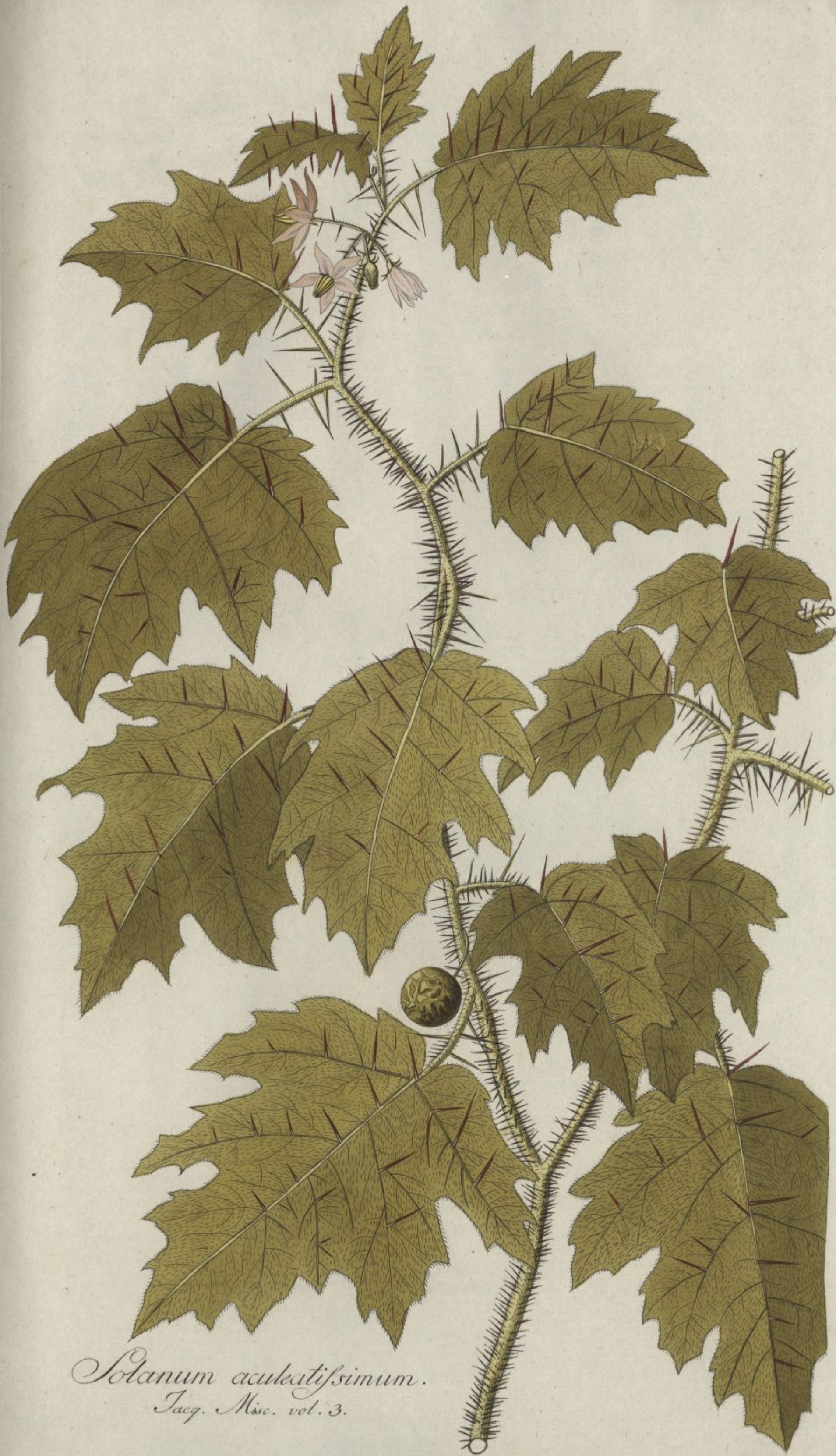
Solanum aculeatissimum. Jacq. Misc. vol. 3.