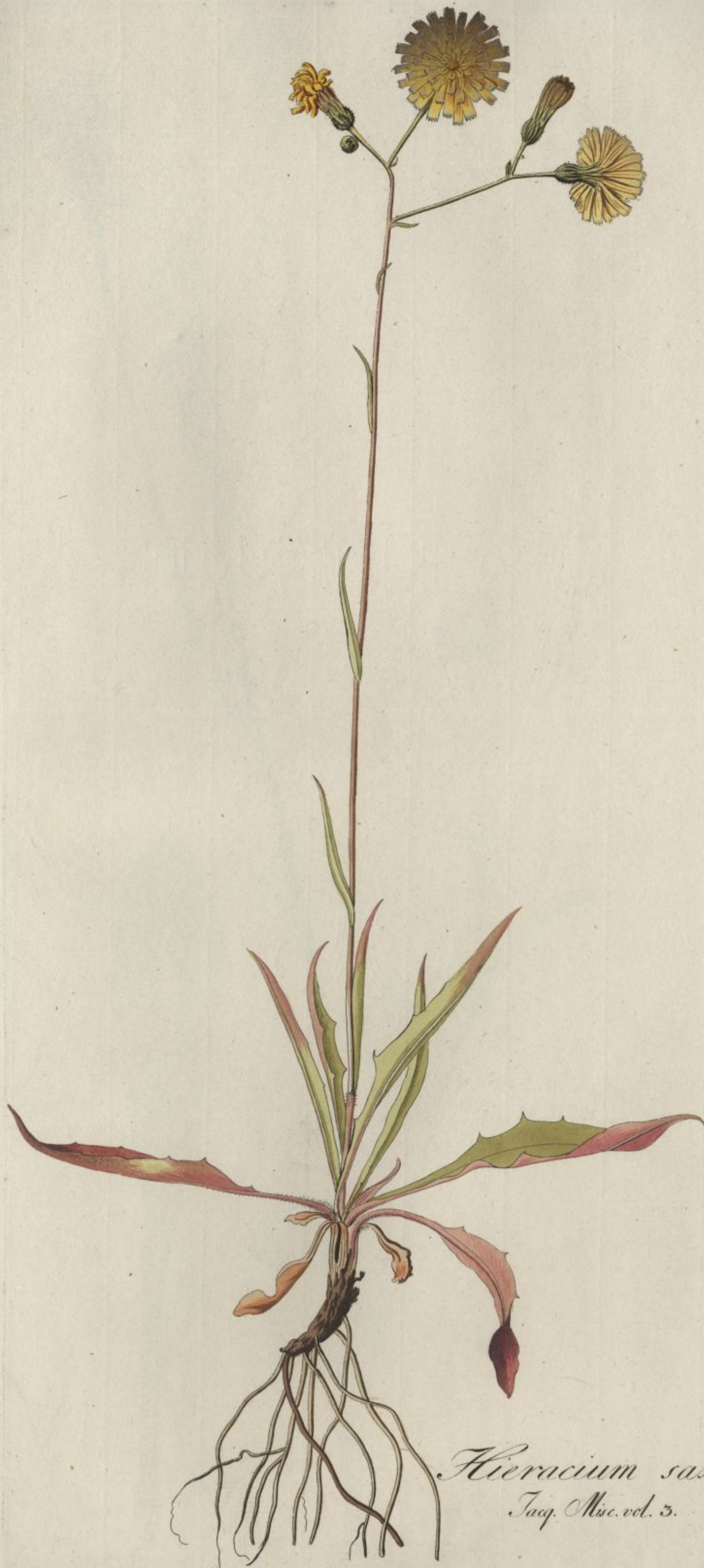
Hieracium saxatile. Jacq. Misc. vol. 3.