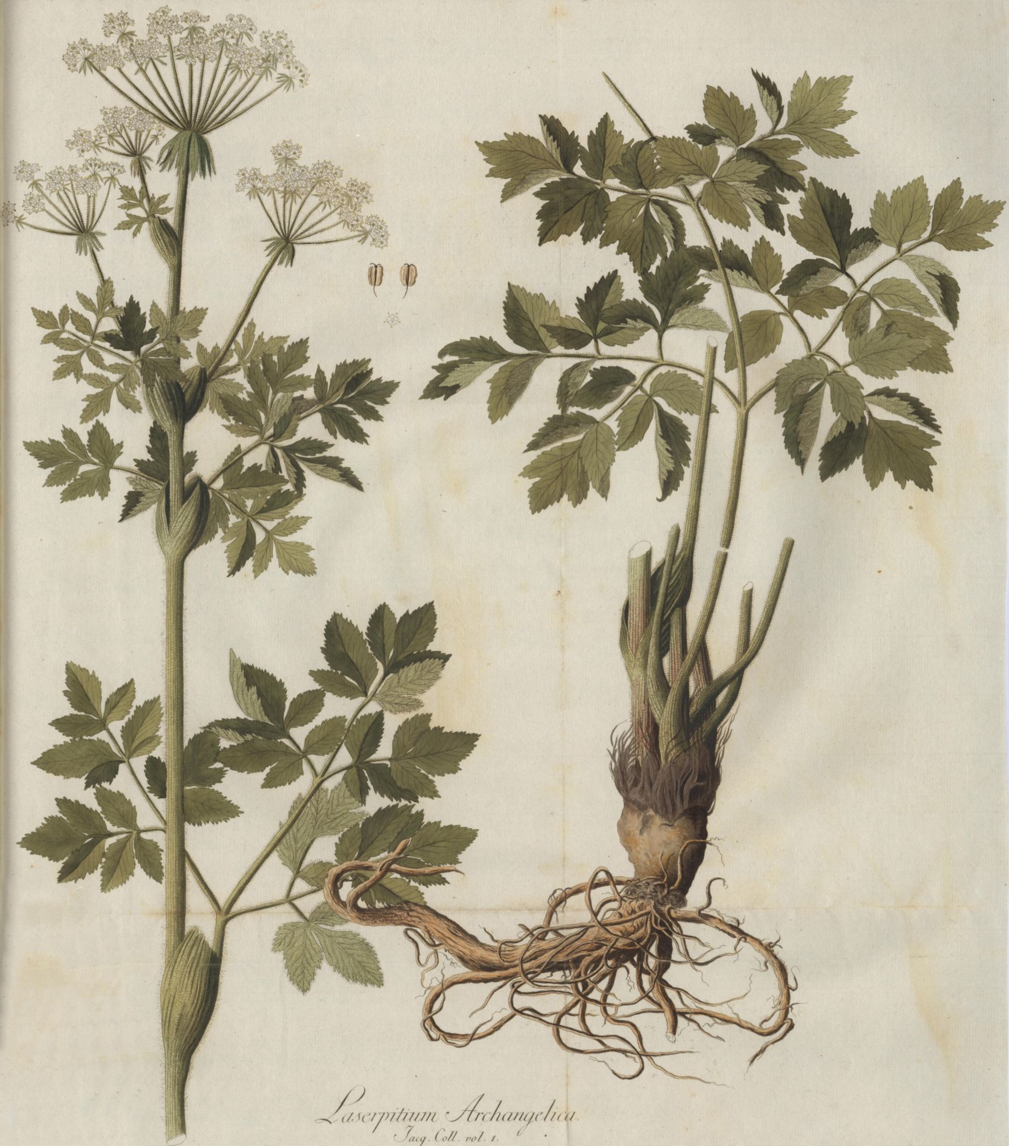
Laserpitium Archangelica. Jacq. Coll. vol. 1.