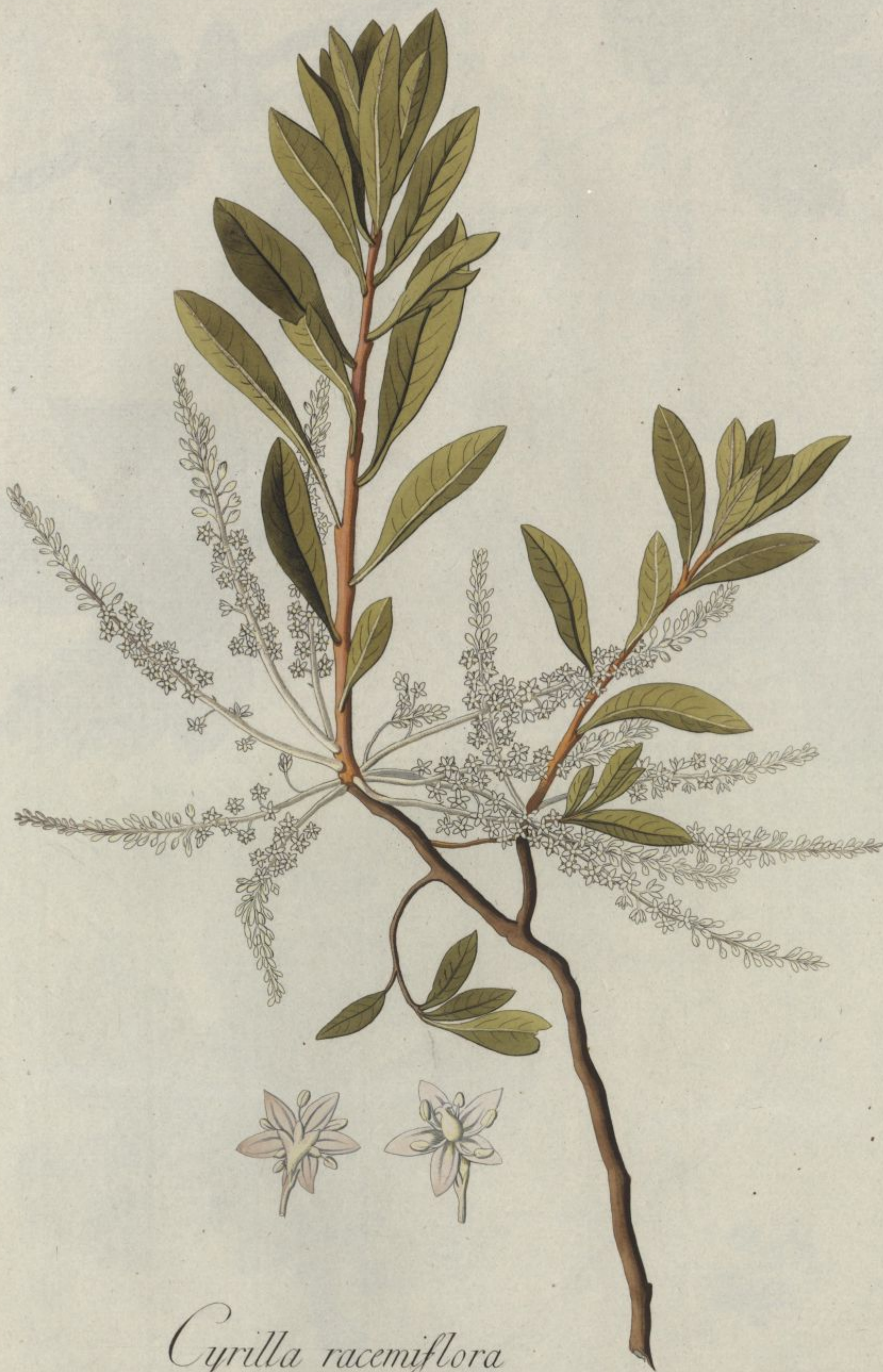
Cyrilla racemiflora Jacq. Coll. vol. 1.