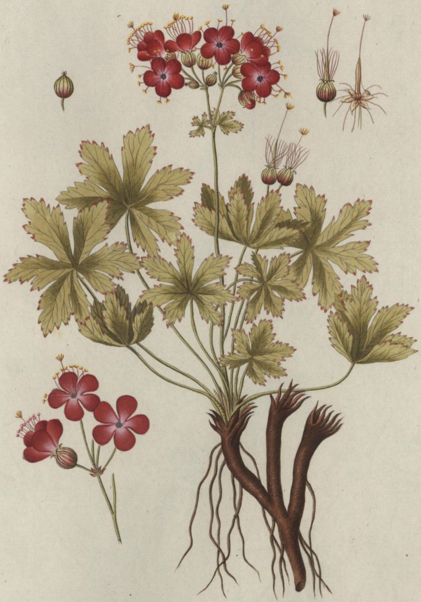
Geranium macrorrhizum. Jacq. Coll. vol. 1.