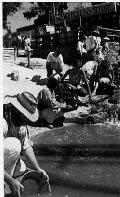
Sovereign Hill, Vic. - Zlato iščejo...