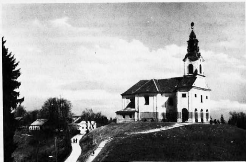
Rožnik nad Ljubljano

PAPEŽ JANEZ PAVEL II. (Iz govora, ki ga je pripravil za obisk Sarajeva)