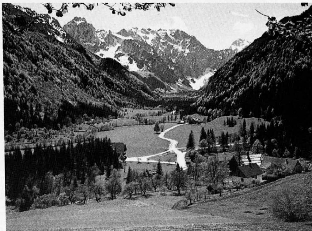
Prelepa Logarska dolina