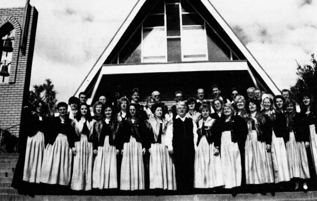
Naši dobrodošli gostje: koroški pevski zbor "Jakob Petelin - Gallus"