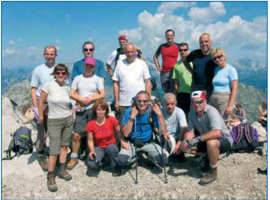
Z izletov odidejo polni lepih spominov.