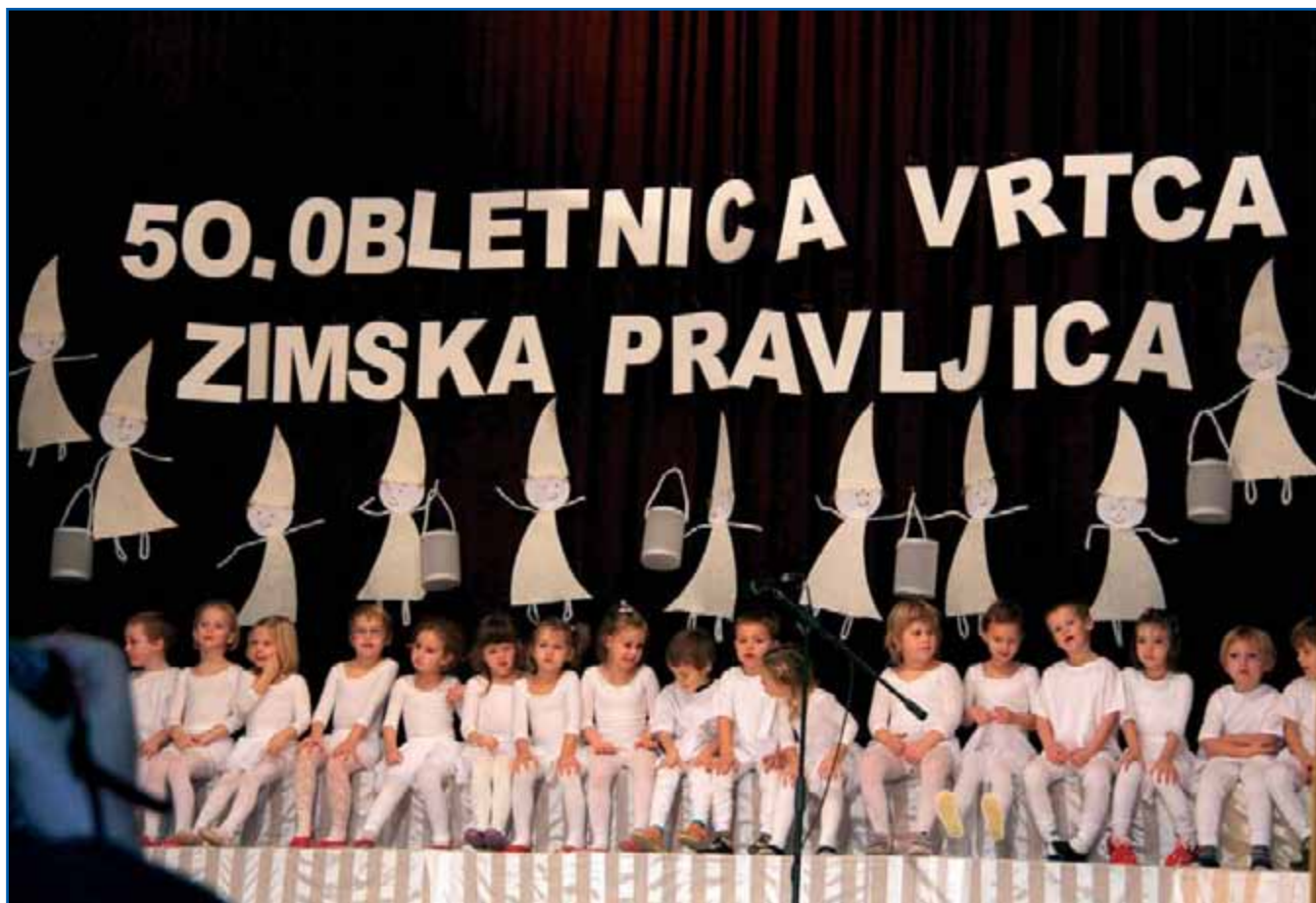
Otroci v vlogi snežink

na podstrešju stare stanovanjske hiše. Predšolsko obdobje je najpomembnejše, najlepše in mora biti za vse otroke pravljíčno. Iz pravljíc se veliko naučimo, pravljíce imajo vrednote, srečen konec, zato simboličen naslov skupne prireditve: Zimska pravljíca.