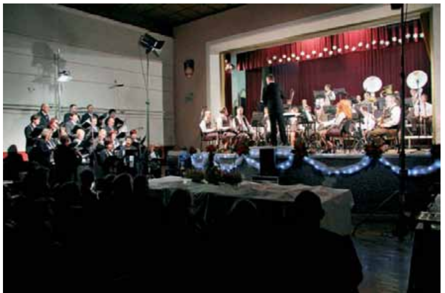
MePZ Biser in Godba Vodice: dobra kombinacija za koncert