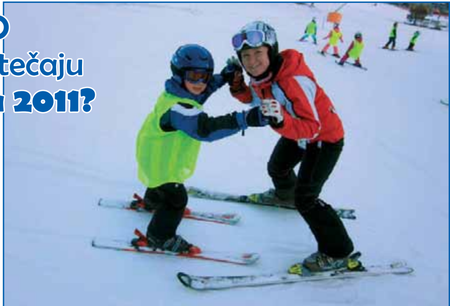
Skupaj je lažje.

Za tečaj med zimskimi počitnicami odločitev o razpisu še ni sprejeta. Ali bo tečaj sploh razpisan, bodo narekovale predvsem naše kadrovske omejitve v tem času. V prime-