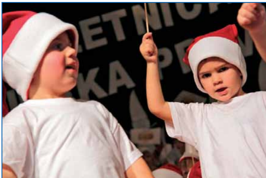
Mali božični junaki

V tem šolskem letu je naše izbrano prednostno področje umetnost, zato otrokom omogočamo dodatne likovne, glasbene in plesne dejavnosti v okviru kurikula. Tako smo s plesom in pesmijo oblikovali našo decembrsko prireditev, kajti pravljice so del otroštva, naš vrtec je del te pravljice, ki se je začela pozimi, ob robu Vodice,