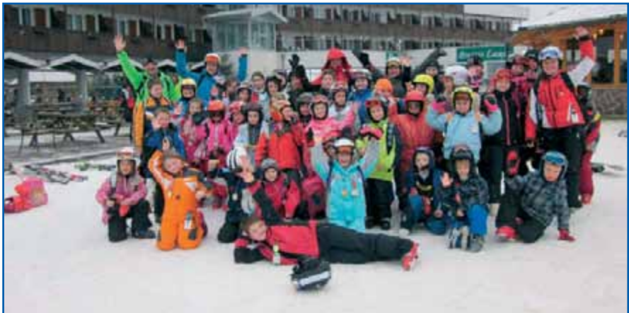
Skupinska slika ob zaključku tečaja