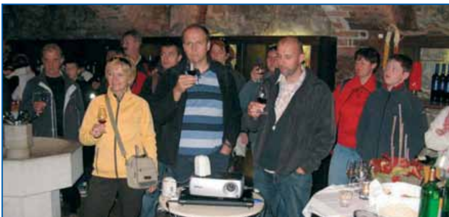
Takole so nazdravili skupnemu druženju.