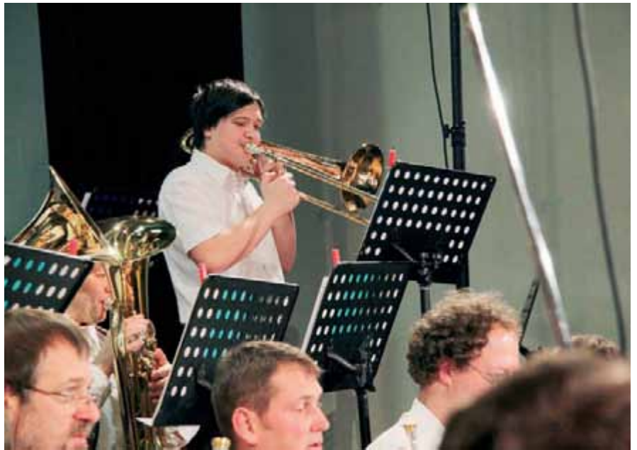
Godbeno društvo bo letos praznovalo.

Tudi letos Godbeno društvo Vodice ni razočaralo svojih zvestih poslušalcev, prebivalcev občine Vodice. Tradicionalni božično-novoletni koncert v dvorani Kulturnega doma Vodice, katerega gost so bili pevci MePZ (mešani pevski zbor) Biser, je bil pika na i v predprazničnem občinskem vzdušju.