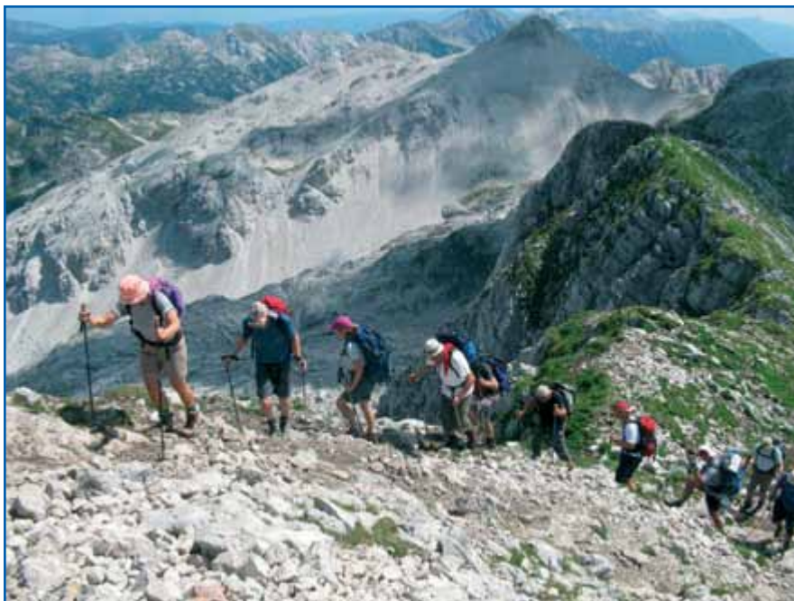
Noben vrh ni previsok zanje.

Samo teden dni kasneje je bil tradicionalni, letos že 11. pohod po