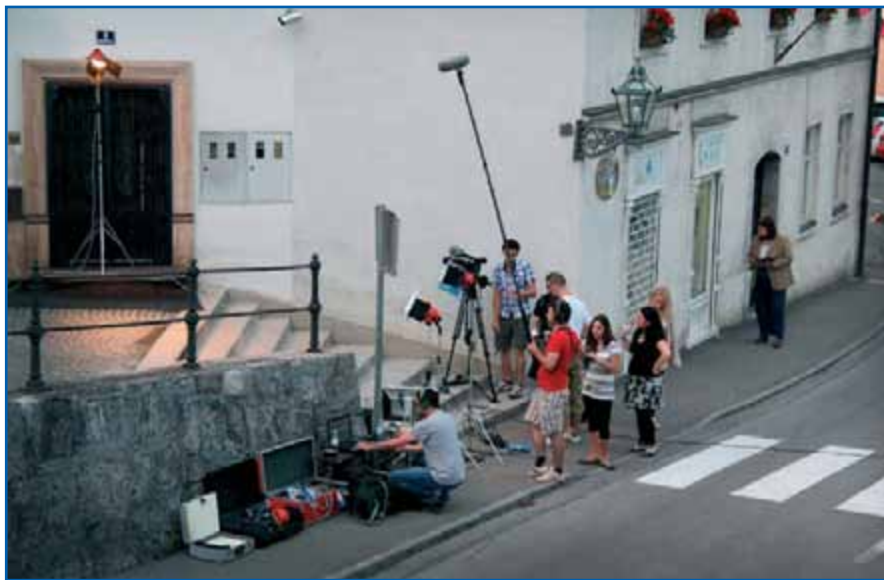
Takole je bil videti snemalni dan.