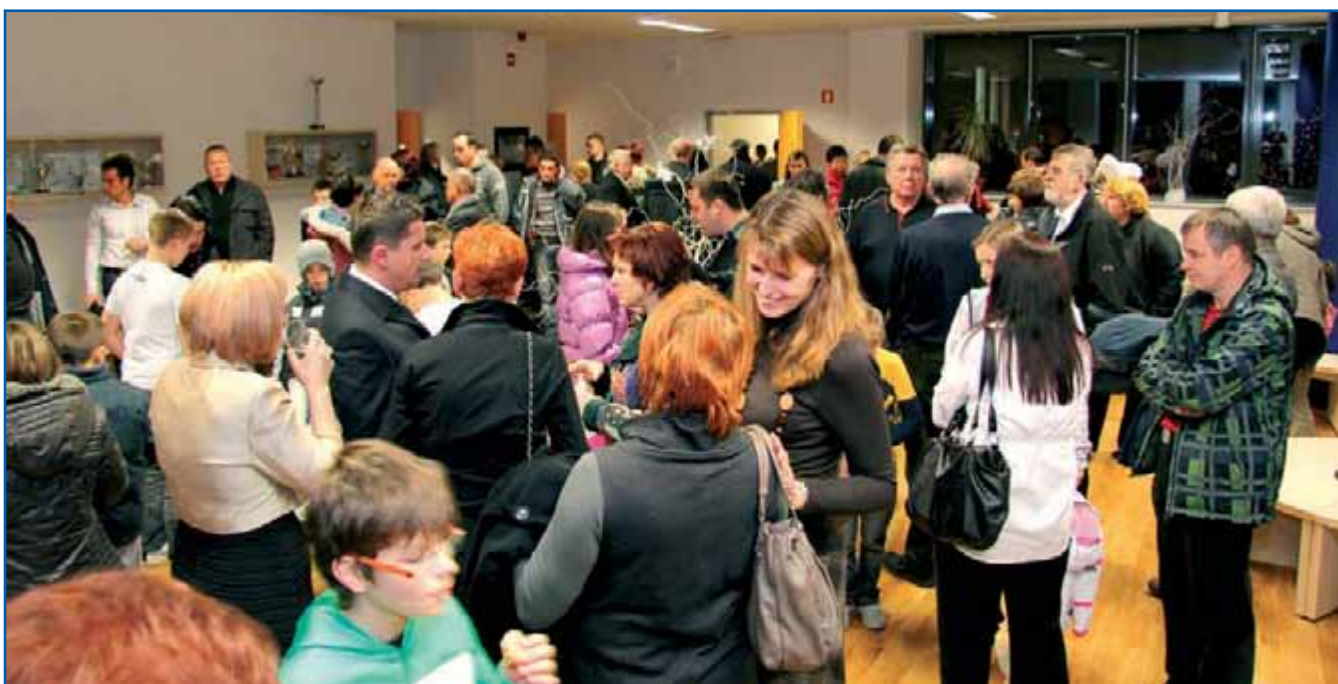
Občani so si ogledali prenovljeno šolo.