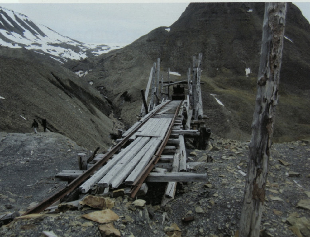
Ostanki rudniske opreme-v ozadiju gora Nordenskiöldtoppen.