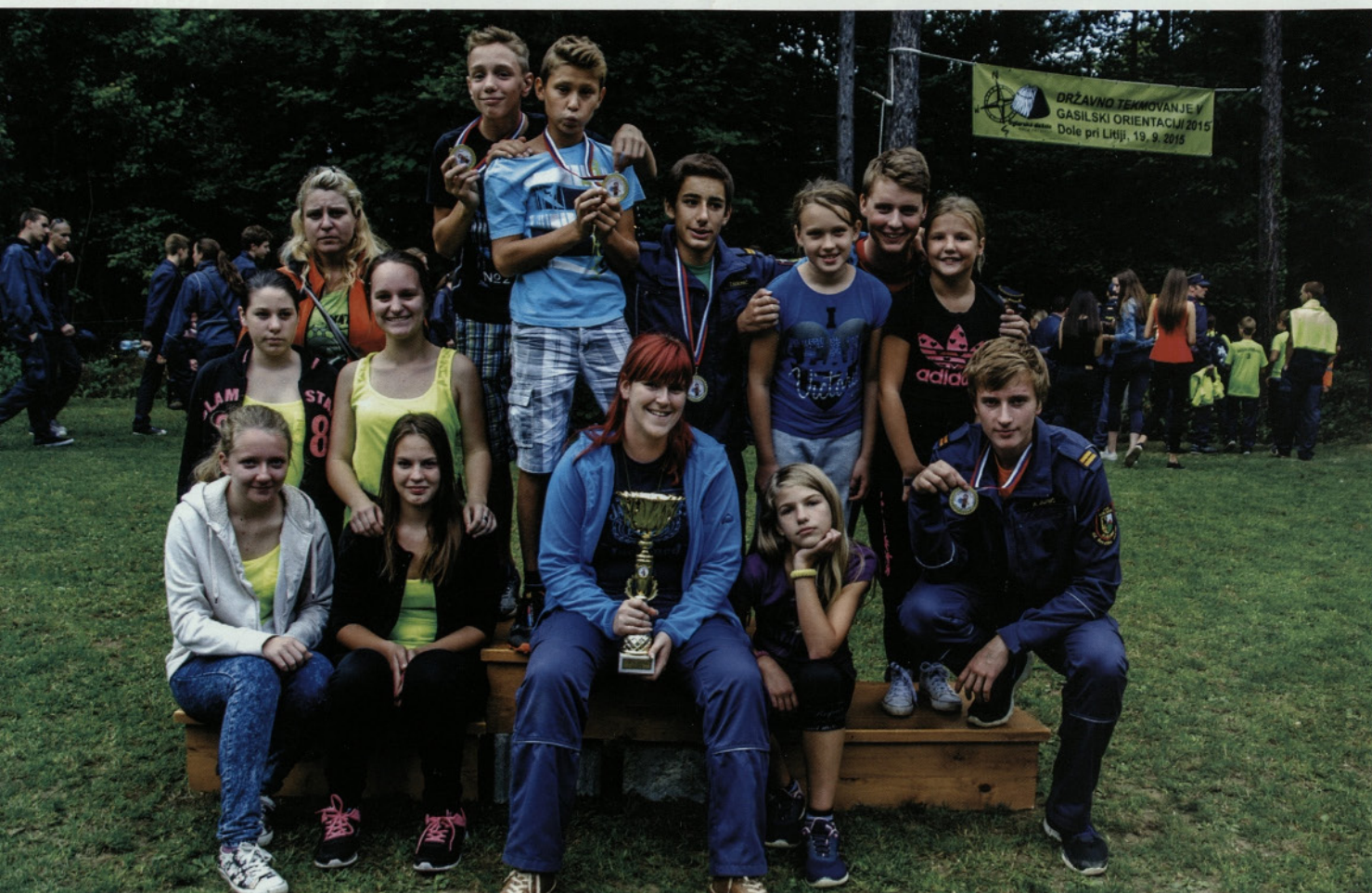
Na Dolah pri Litiji je v soboto, 19. septembra, potekalo državno tekmovanje v gasilski orientaciji za pionirje, pionirke, mladinke, mladince, pripravnice in pripravnike. Na tekmovanju je nastopilo 186 ekip. Tekmovale so tudi tri ekipe PGD Lokovica, ki so dosegle odlične rezultate. Mladinke so v svoji kategoriji od skupno 31 ekip, osvojile 11. Mesto. Pionirke v konkurenci 33ih ekip 15. Mesto. Mladinci pa so v svoji konkurenci premagali 35. Ekip in postali tretjič zapored državni prvaki. Čestitamo!