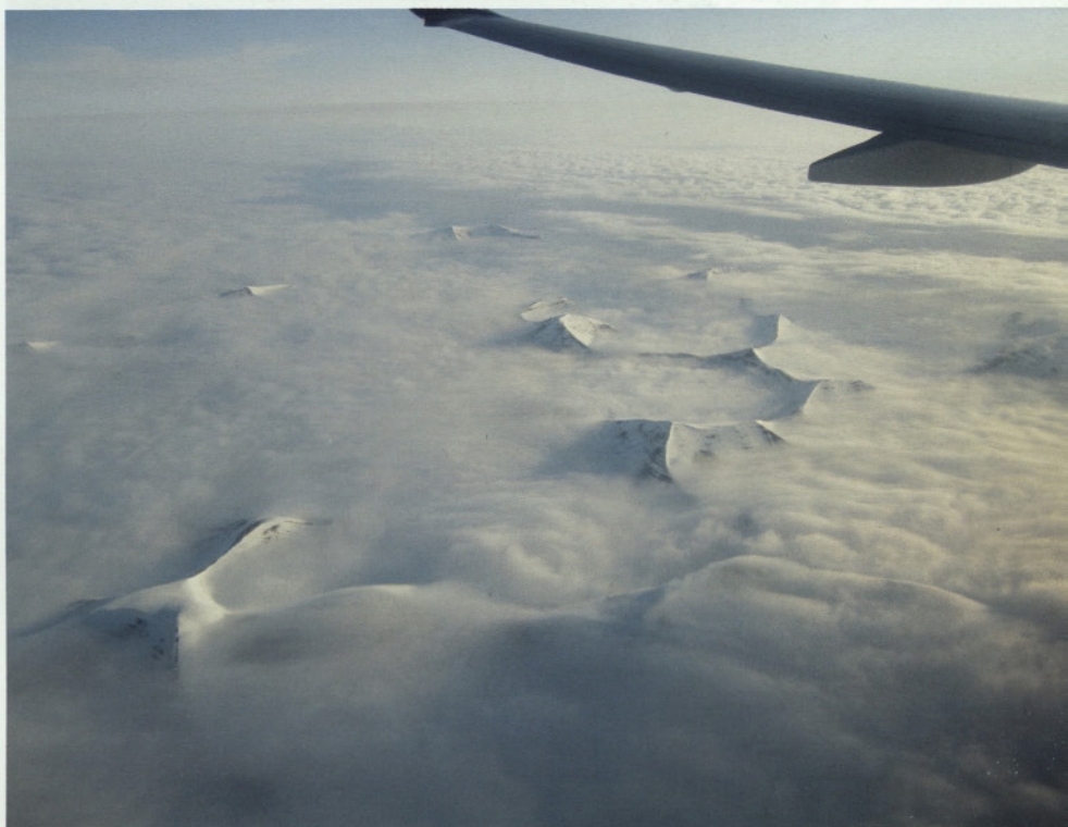
Svalbard iz zraka.

Na Svalbardu so na voljo številne možnosti za bolj ali manj pustolovsko preživljanje prostega časa. Vse je odvisno od razpoložljivega časa in od debeline denarnice. Zaradi visokih cen in pomanjkanja nastanitvenih kapacitet je smiselno že pred samim prihodom vse aktivnosti podrobno načrtovati in rezervirati. Lokalne turistične agencije imajo v svojih programih pestro ponudbo eno in več dnevni izletov z ogledi fjordov, ledenikov, gorskih vrhov, rudarskih naselbin in podobno. Organizacija in izvedba teh izletov je brezhibna. Popotnike pridejo zjutraj iskat s kombijem, če je manjša skupina ali avtobusom, če je večja skupina pred hotel (poberejo jih iz vseh hotelov v mestu), jih odpeljejo na izlet in zvečer pripeljejo nazaj pred hotel. Poleg omenjenih izletov so seveda na voljo tudi nekoliko bolj avanturistične aktivnosti, kot denimo vožnje s kajaki, ogledi ledenih jam in celodnevni trekingi na okoliške hribe. V nadaljevanju sledi kratek opis aktivnosti, po katerih je sicer največ povpraševanja, in katerih se je udeležila tudi naša skupina.