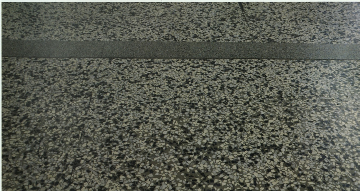
Gladek teraco, zlizan z bosimi nogami tisočernih velenjskih knapov, zdaj s ponosom prenaša umetniške dogodke v muzeju premogovništva.

Vem. Nekaterim se bo zdelo krivično, ker ne pohvalim njihovega ubranega petja, vendar ga ni treba hvaliti. Če ne bi znali lepo peti, sploh ne bi dobili prostora na odru. Ubrano petje pevskega zbora je pač predpogoj, da sploh sme nastopiti pred publiko in slednje velja za vse, ki nastopajo v javnosti. Ne samo na umetniškem polju.