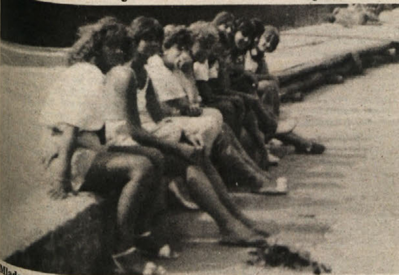
Mlade odbojkarice Bora, Kontovela in Sokola, ki so te dni na skupnih pripravah v Škofji Loki, se med prostim časom, ki ga je pravzaprav zelo malo, sploščujejo, tako da gredo na krajše sprehode in tako поблиže spoznajo tudi lepote tega gorenjskega predela