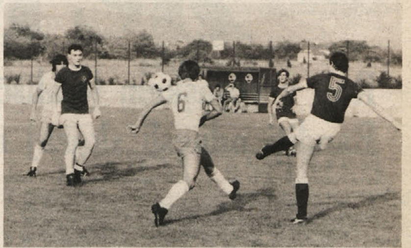
V okviru priprav na 1. AL je Vesna igrala prijateljsko nogometno srečanje proti Portualeju. Naši pa so v tej tekmi izgubili z 2:4. Na sliki: posnetek s tega srečanja