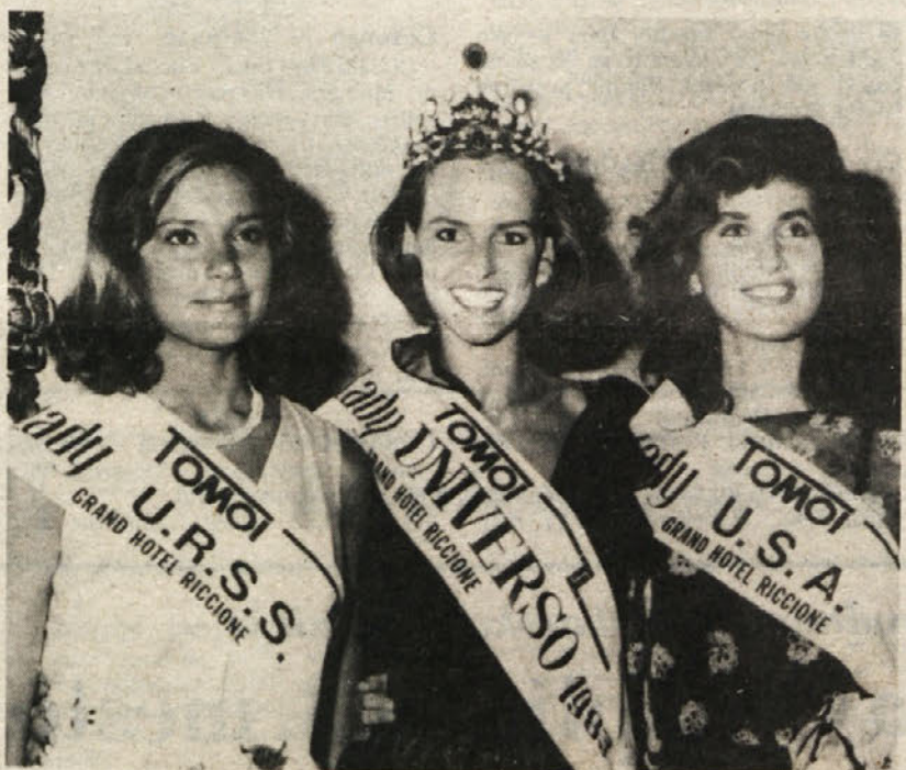
V znanem italijanskem letovišču Riccione so sedaj, ko se turistična sezona bliža koncu, prešli na tradicionalne prireditve, kamor spada tudi izboritev lepotic. Ne gre za izvolitev mis, pač pa lady. Na gornji sliki vidimo najlepšo lady s krono na glavi, ob njej pa sta najlepša sovjetska in najlepša ameriška lady