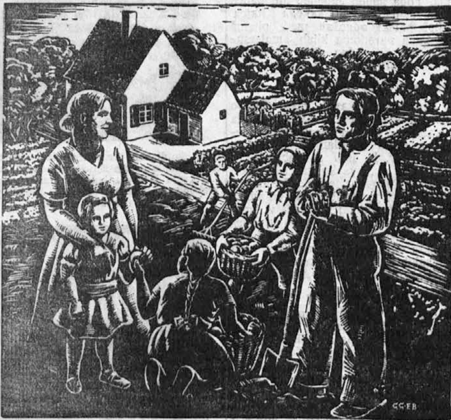
OD ZORE DO MRAKA

Za dame in gospode brinaša vedno namoveiše