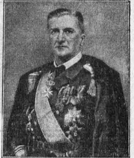
Madžarski regent Nikolaj Horthy, ki je te dni slavil svojo 70-letnico.

intenzivnega pouka v šolah, propagande itd. je bilo mogoče v l. 1937 znižati to število mrtvih na 7635, a vendar je še ogromno, če se pomisli, da je bila v svetovni vojni marsikatera bitka proglašena za krvavo, a ni zahtevala toliko mrtvih in ranjenih kakor nemško cestno omrežje v enem letu.