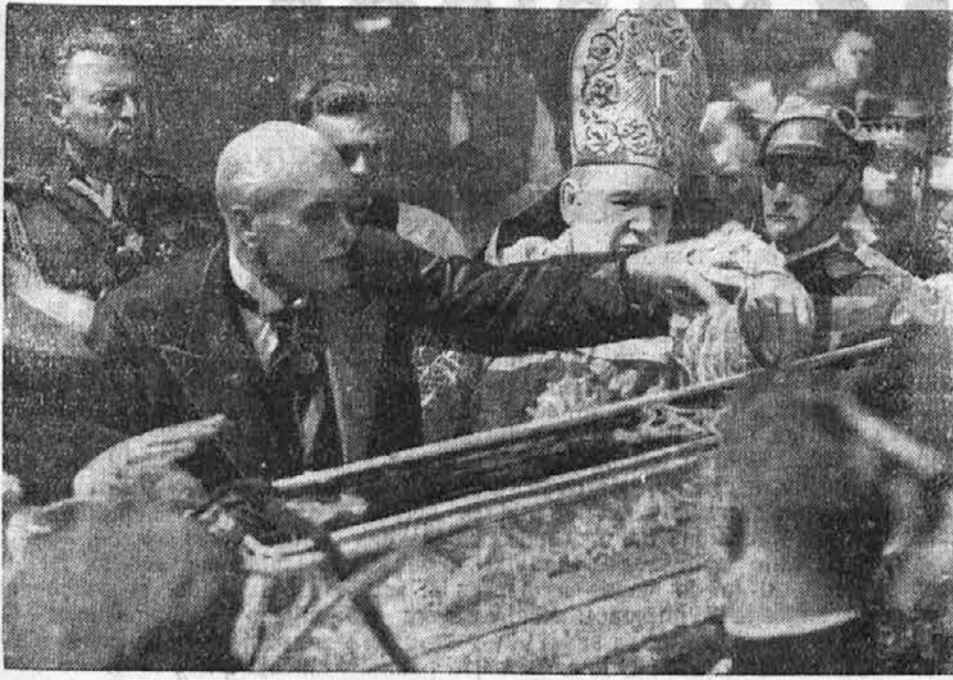
Poročali smo že, da so Poljaki prepeljali v svojo domovino zemске ostanke poljskega svetnika sv. Andreja Bobole. Na podobi vidimo, kako polaga na krsto svetnika predsednik poljske republike Moscicki odlikovanje neodvisnega križa. Tej svečanosti je prisostvovalo okoli 100.000 ljudi.