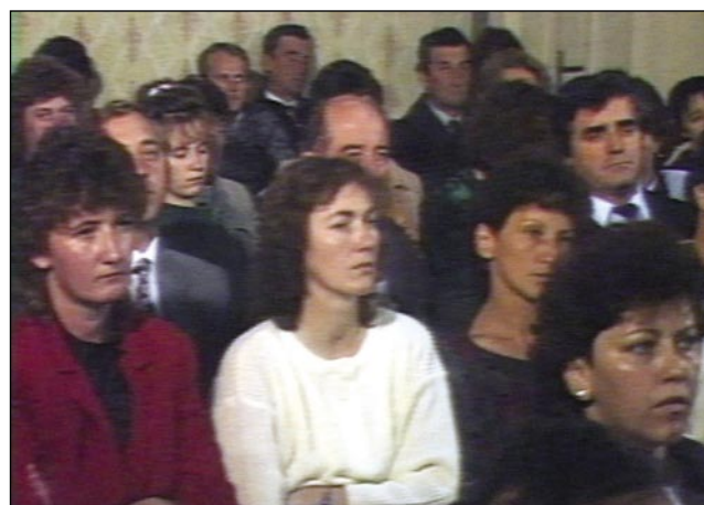
Delegati iz Porabja in Budimpešte

Listine o manjšinskih pravicah. Še bolj kritično je bilo v Osijeku leta 1990 zadnje, 15. Srečanje manjšin sosednjih dežel. Vzpodbude za spreminjanje razmer so prihajale tudi iz skupne organizacije, DZJS, posebej na zadnjih kongresih te organizacije. DZJS se je v osemdesetih letih spremenila in iz okostenele manjšinske organizacije, tesno navezane na vladajočo partijo, je nastajala organizacija, ki si je prizadevala za uresničevanje manjšinskih pravic. Čeprav s sedanjega zornega kota nemara manj pomemben dogodek je bil leta 1986 izid prvega, po obsegu skromnega Slovenskega koledarja, iz katerega se je razvila sodobna in obsežna publikacija, kakršno poznamo