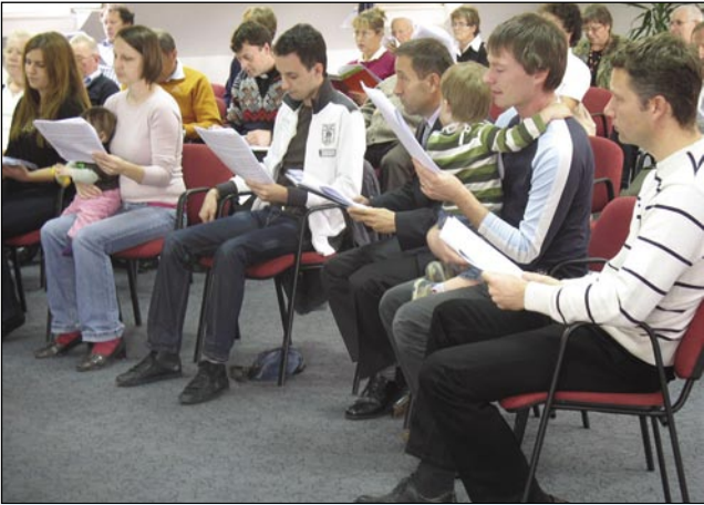
Zborček »Brezi imena« spejva porabske pesmi